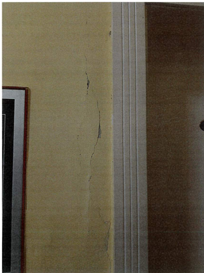
Particolare Fessurazione – rialzamento/distacco intonaco

Via Porta al Borgo 54 – 51100 Pistoia email samanthacatigeometra@gmail.com email pec samantha.cati@geopec.it Cell 338 6306944 Tel 0573 215134