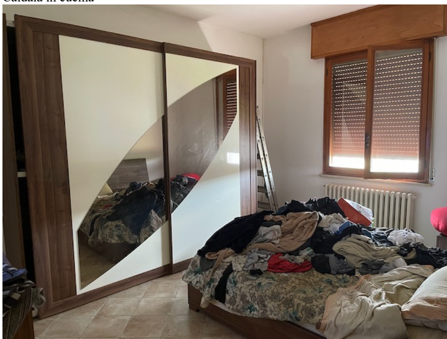
Camera da letto matrimoniale.