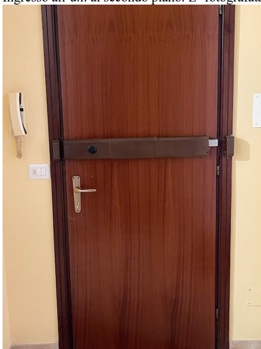
Porta di ingresso,al cui interno è stato montato un catenaccio passante.