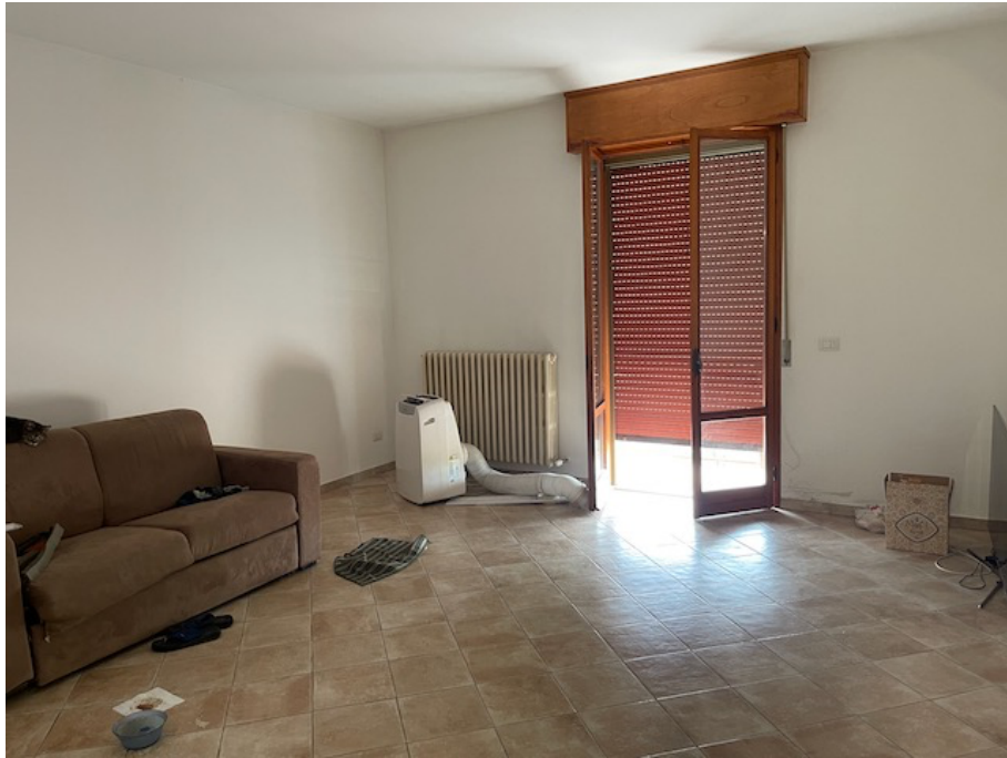
Salotto, con accesso a balcone sul fronte.