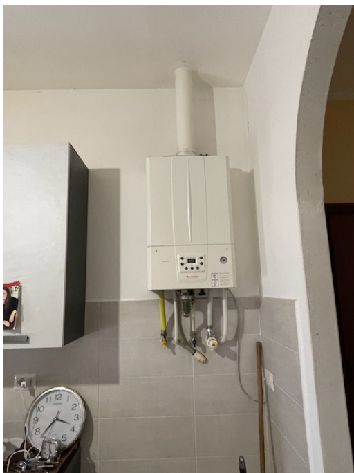
Caldaia in cucina