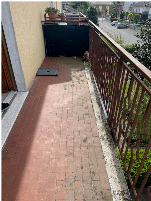
Balcone sul fronte.