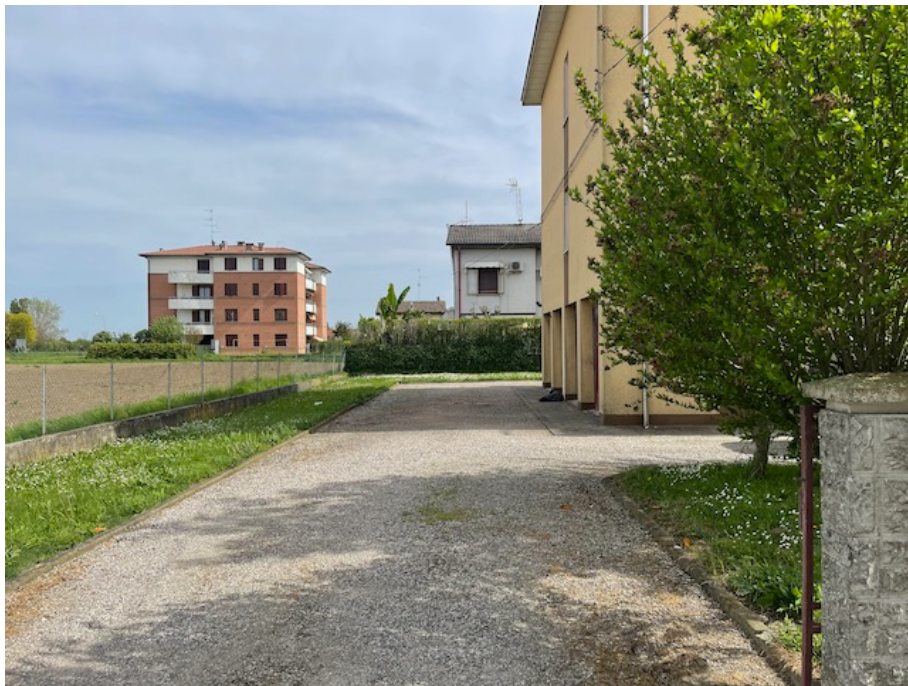
Area cortiliva comune