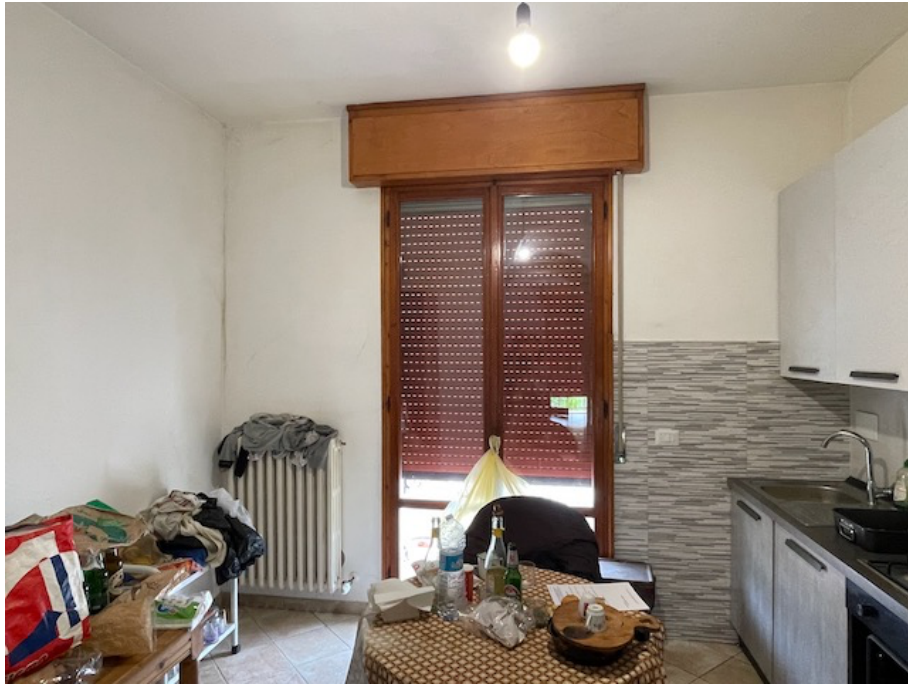
Cucina con accesso a balcone sul retro.