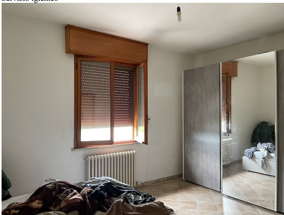
Seconda camera da letto matrimoniale.