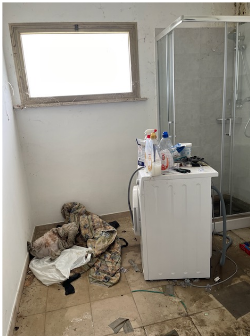
Lavanderia interna all'autorimessa.