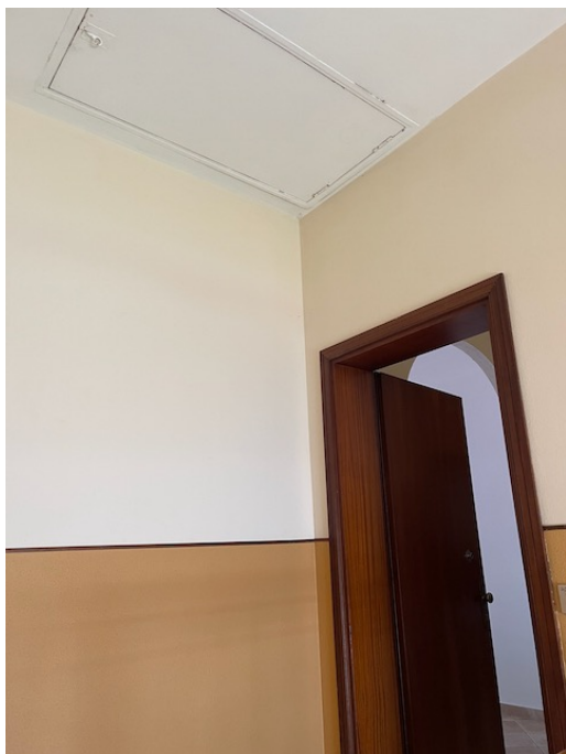
Ingresso all'u.i. al secondo piano. E' fotografata la botola di accesso al sottotetto comune non abitabile.