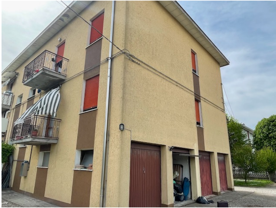
Prospetto laterale nord