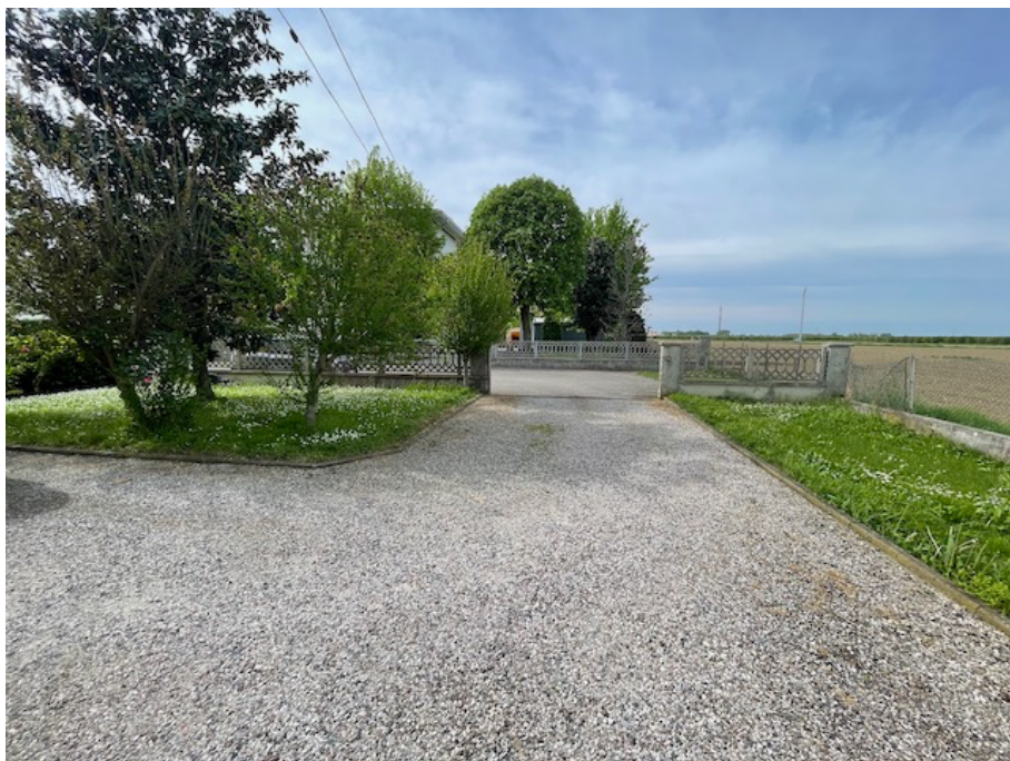
Area cortiliva comune