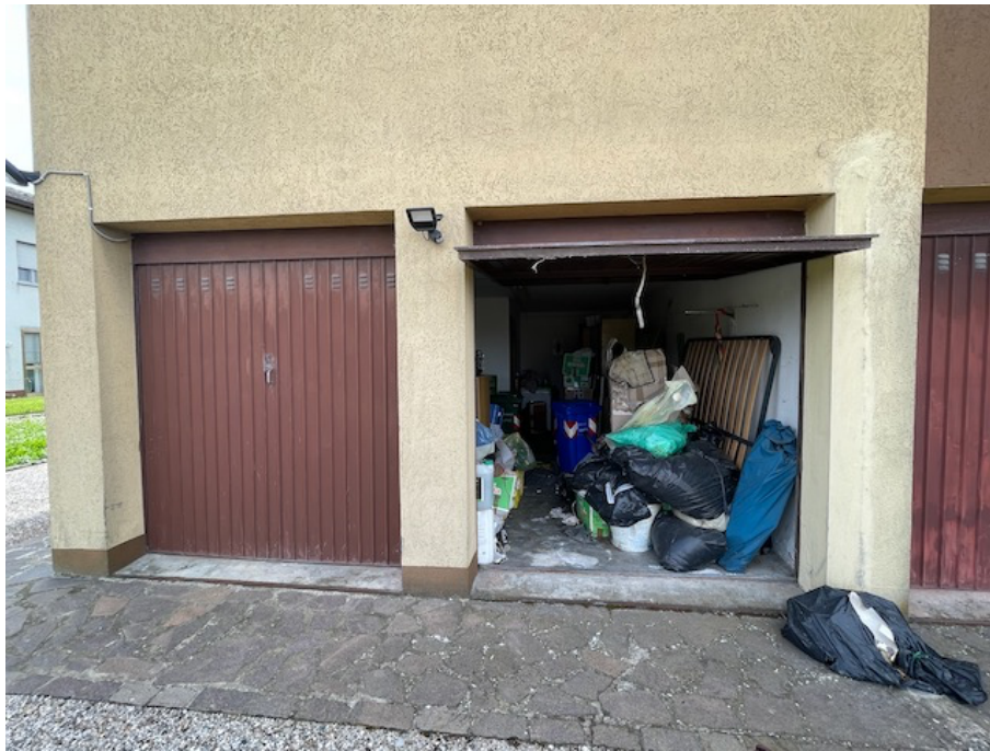
Autorimessa con due portelloni.