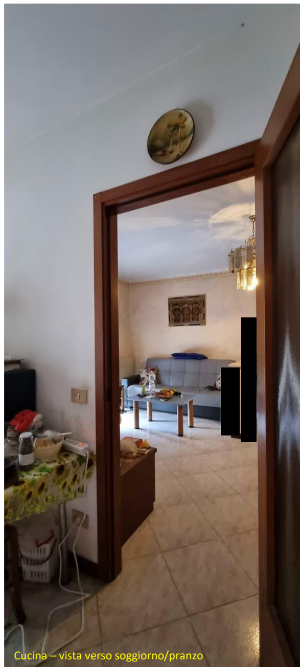
Cucina – vista verso soggiorno/pranzo