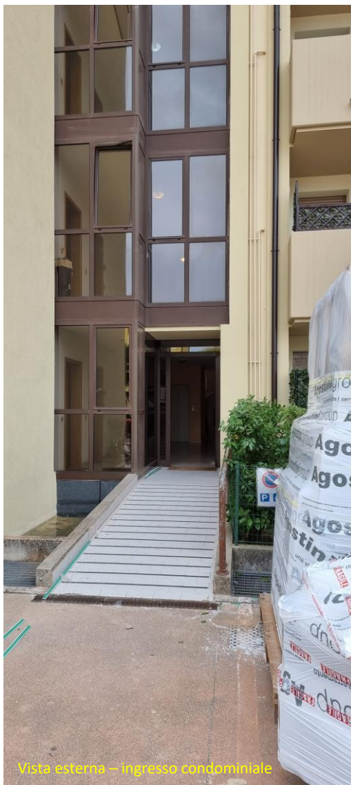
Vista esterna – ingresso condominiale