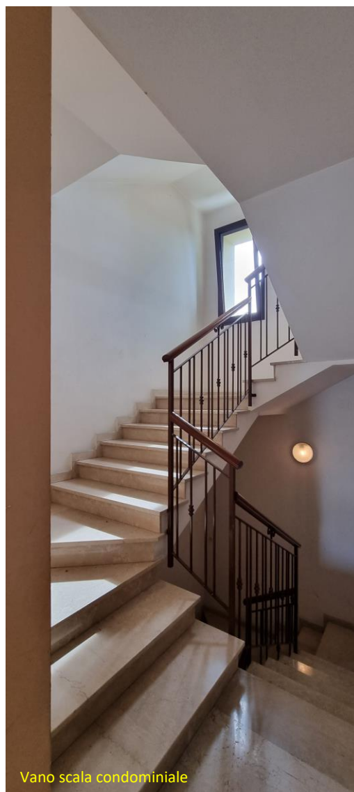
Vano scala condominiale