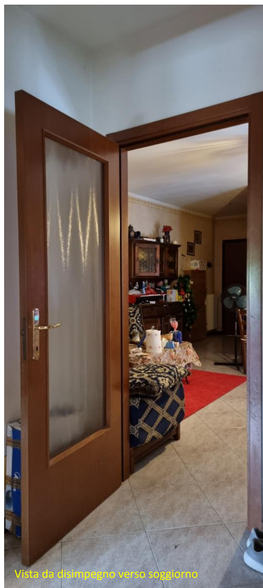
Vista da disimpegno verso soggiorno