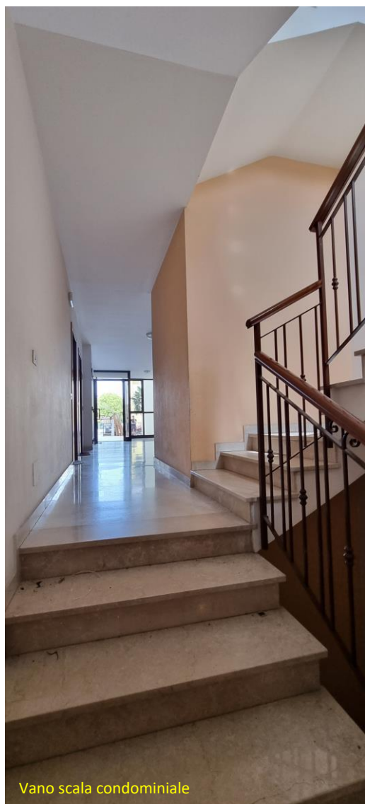
Vano scala condominiale