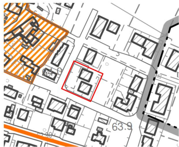
Estratto P.A.T. – P1 – Dicembre 2018 Carta dei Vincoli e della pianificazione territoriale Area in oggetto non sottoposta a vincoli