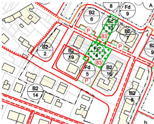
Estratto P.I. Carta della zonizzazione – ZTO B2

A livello di inquadramento Urbanistico-Edilizio, come si evince dagli estratti delle tavole grafiche del P.I. e P.A.T. riportati nelle figure sottostanti (allegato n. 09), l'edificio non è sottoposto a nessun tipo di vincolo storico, ambientale, ecologico o funzionale, e ricade in zona territoriale omogena B2.