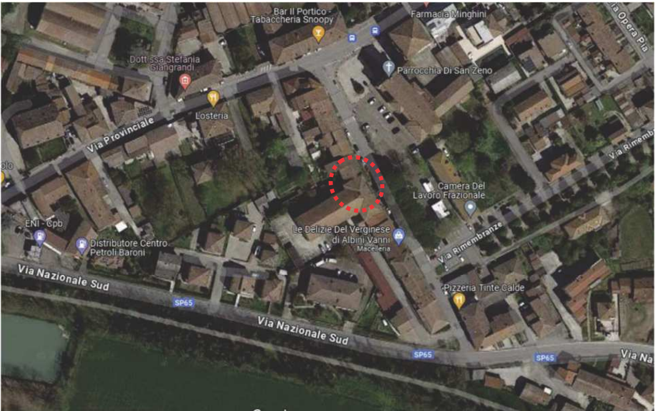
Immagine n.5: individuazione satellite immobile Lotto 002