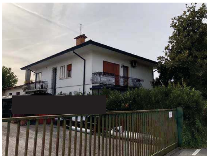
foto 3 prospetto nord-est