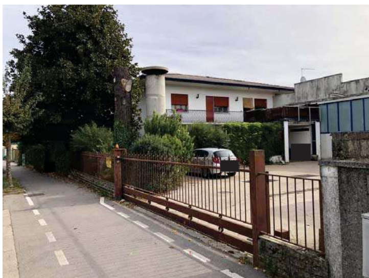
foto 1 ingresso carraio