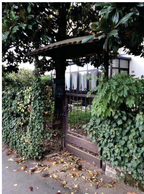
foto 2 ingresso pedonale