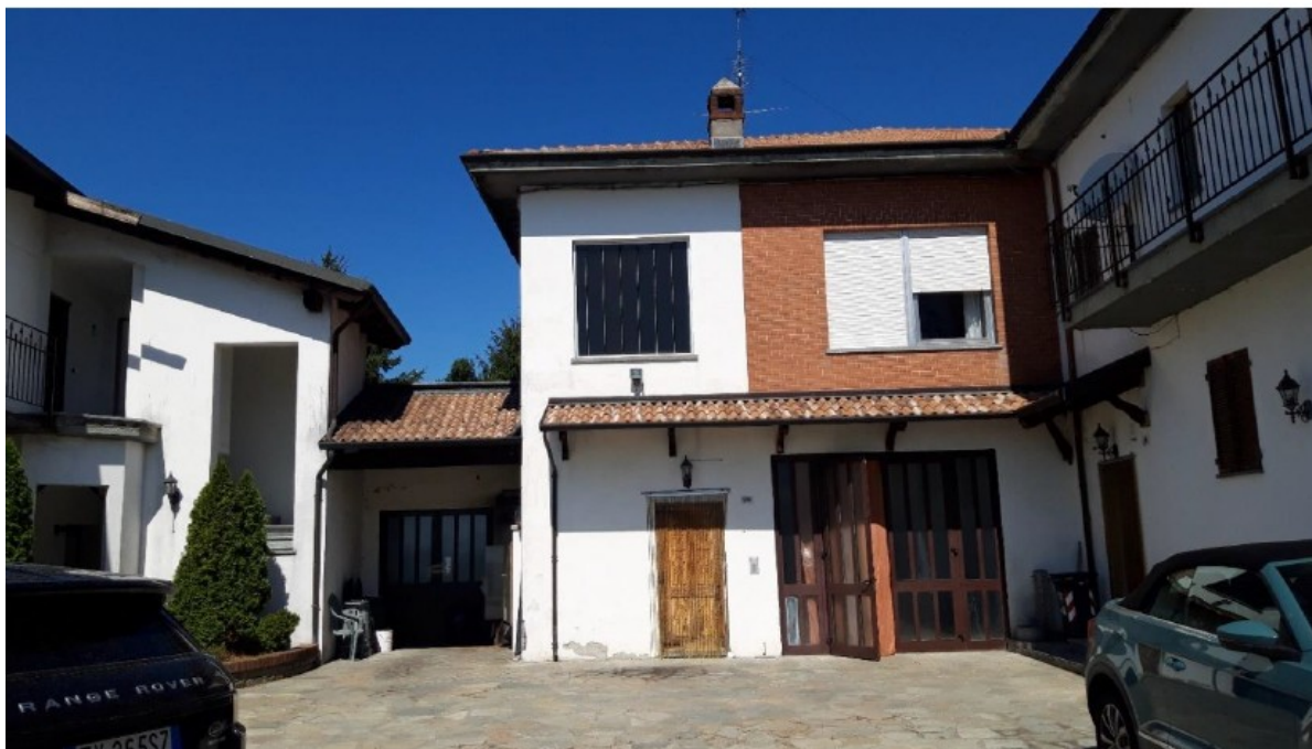
Fig. 1. Accesso all'immobile dal cortile comune su Via Santa Lucia n.20