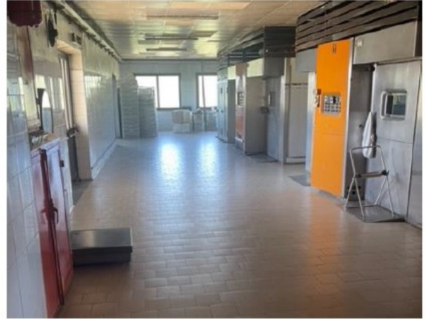
Fig. 5 Laboratori