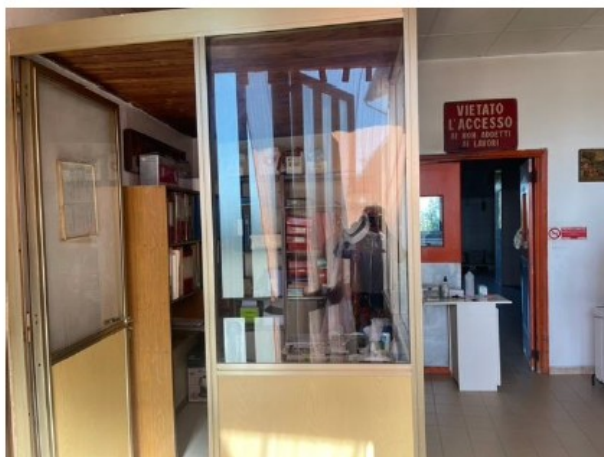
Fig. 2. Disimpegno