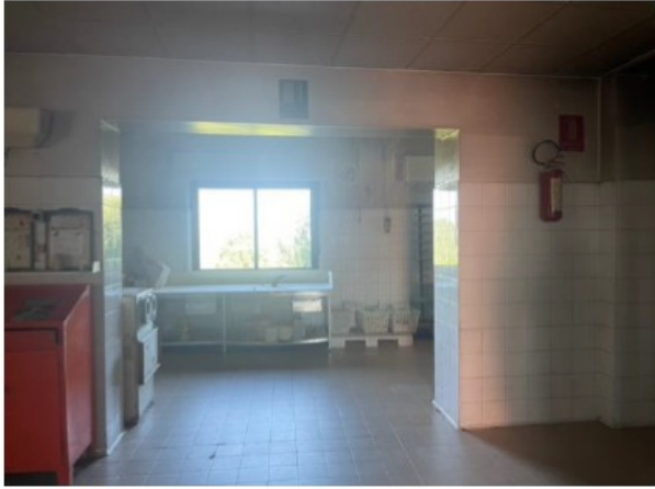
Fig. 4 Laboratori