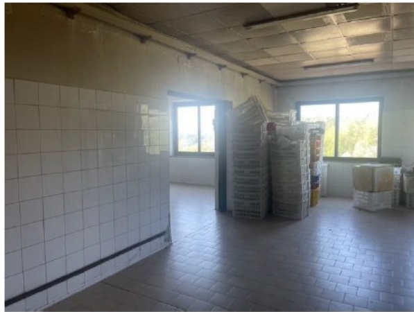
Fig. 6 Laboratori e accesso unità adiacente F. 22 P. 258 Sub. 1