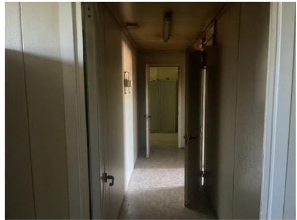
Fig. 7 Accesso ai servizi igienici