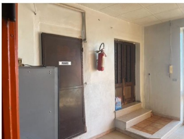
Fig. 3. Ripostiglio e accesso a unità adiacente F. 22 P. 383 Sub. 2