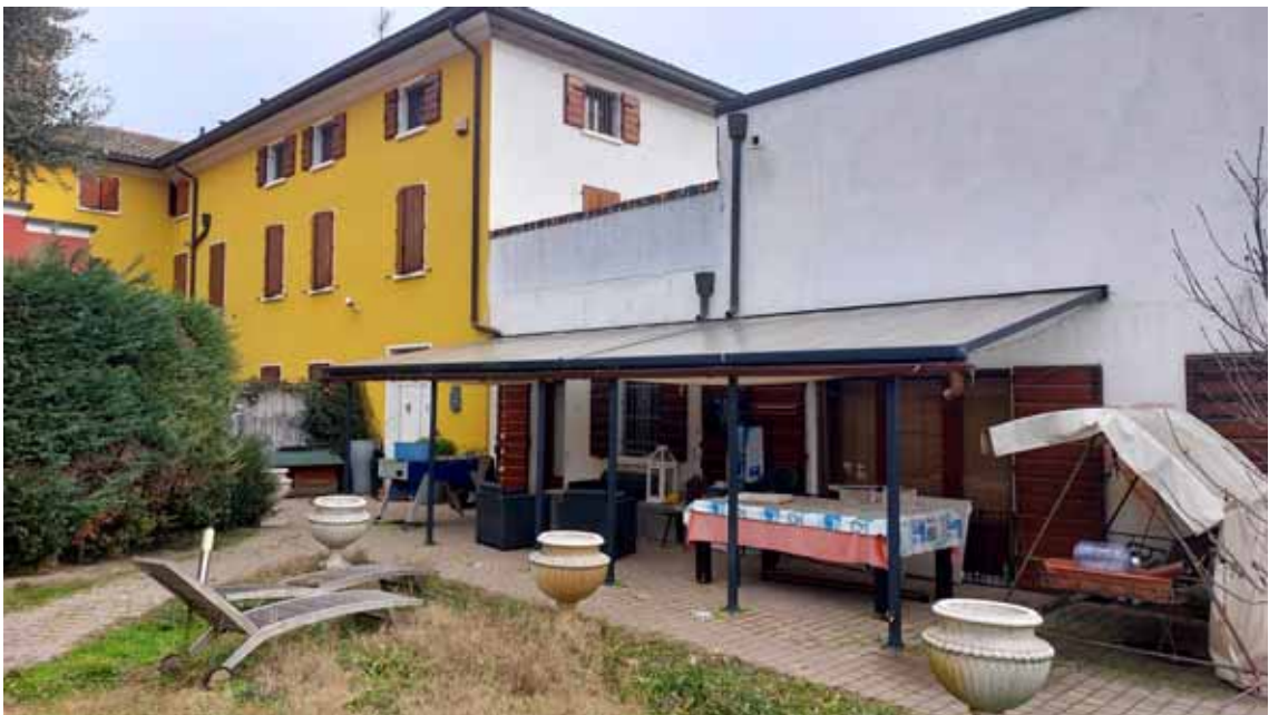
42) Vista esterna.