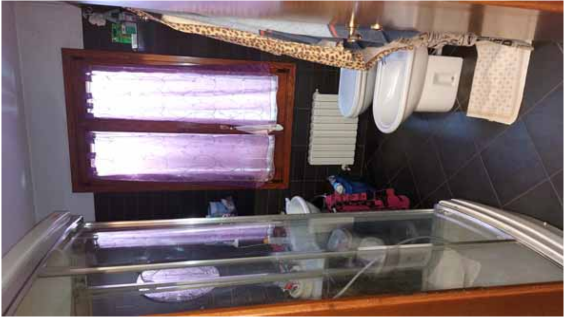
9) Vista di un bagno.