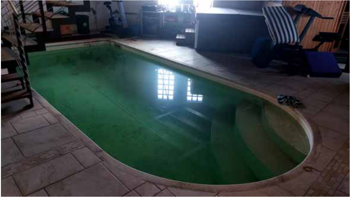
27) Vista della piscina interna.