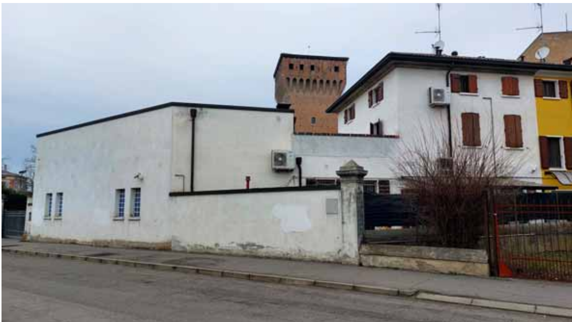
44) Vista esterna.