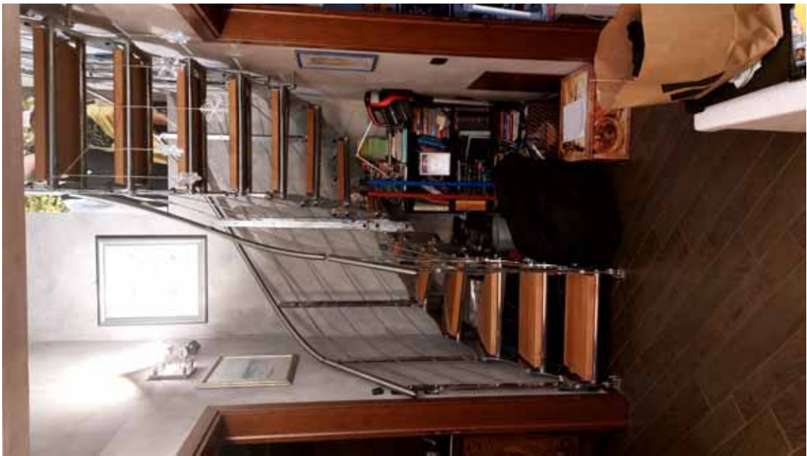
8) Vista della scala di accesso alla soffitta.