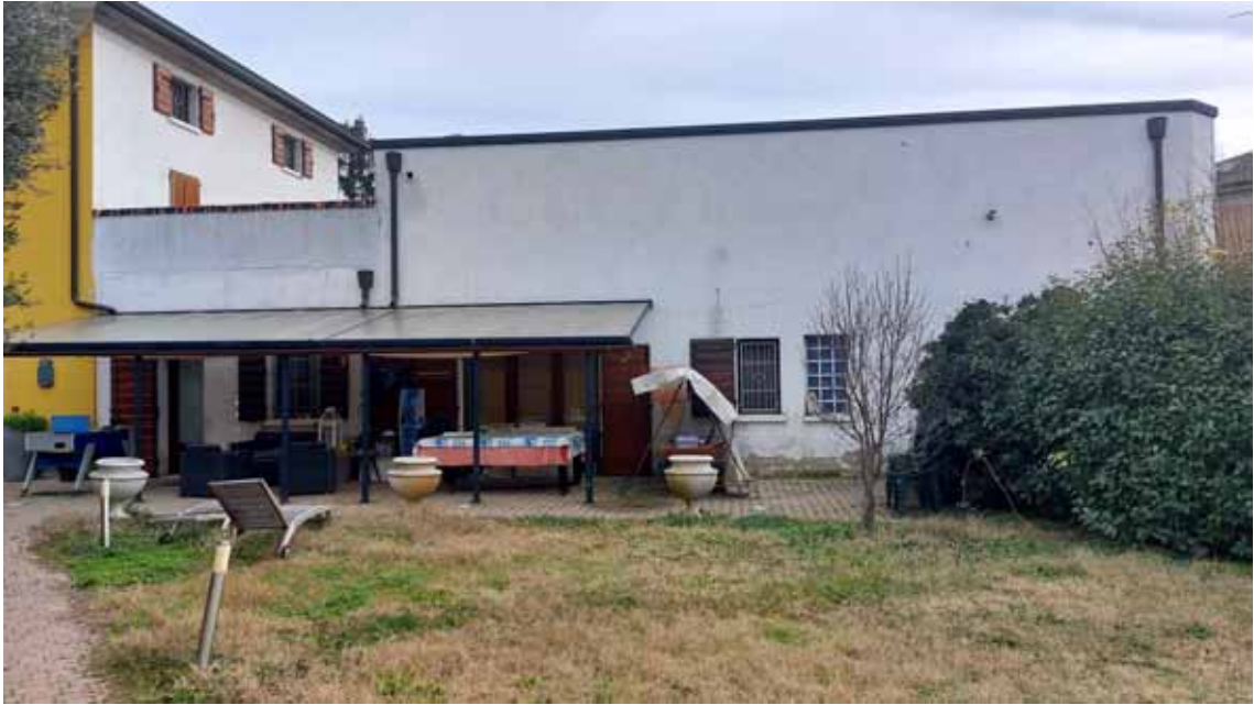
41) Vista esterna.