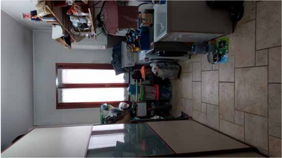
17 ) Vista della lavanderia.