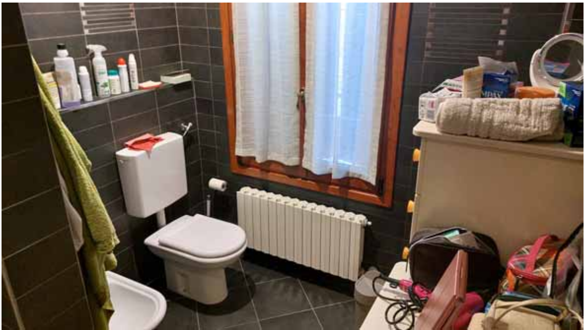
14) Vista di un bagno.