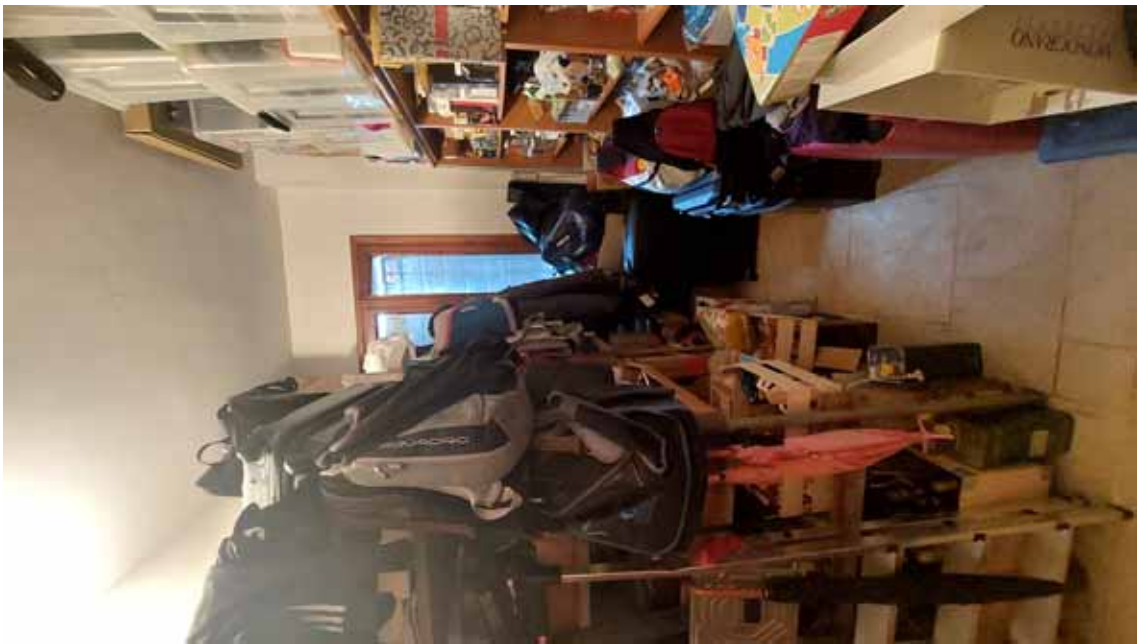
16) Vista della cantina.