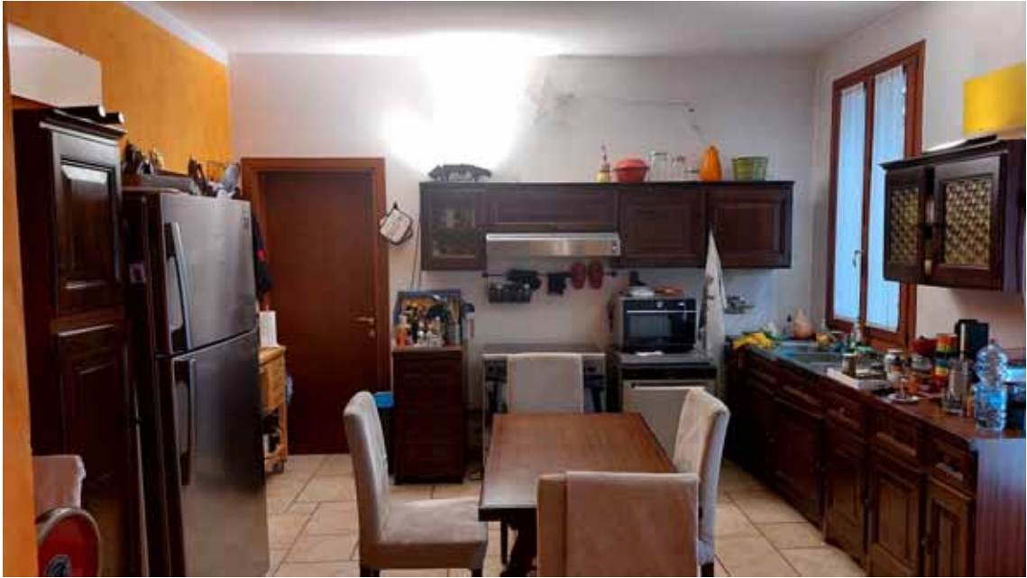
21) Vista della cucina.