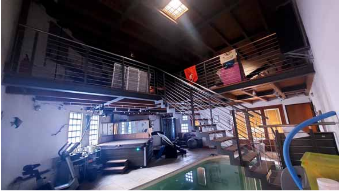
29) Vista della zona riabilitazione.