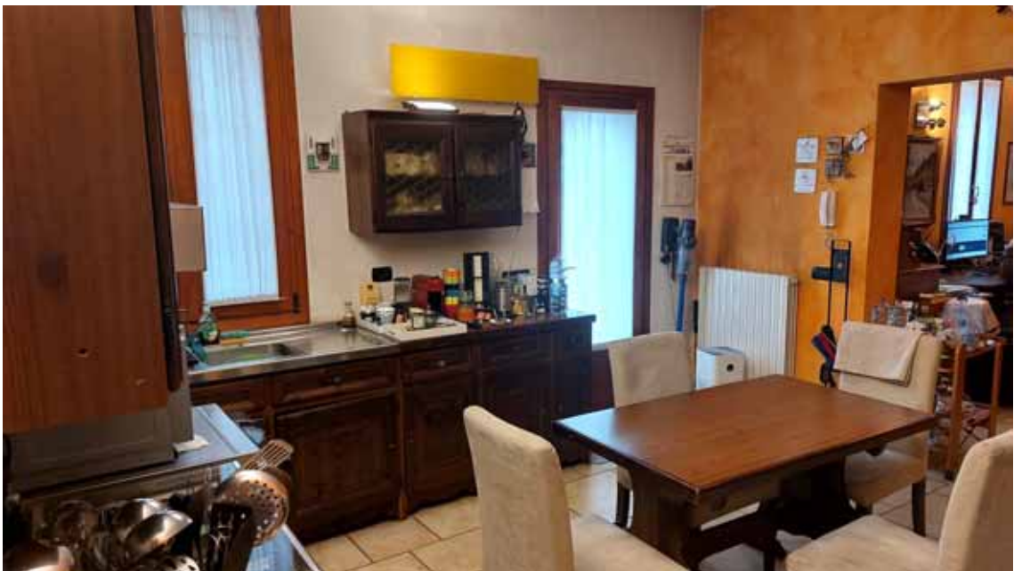
22) Vista della cucina.