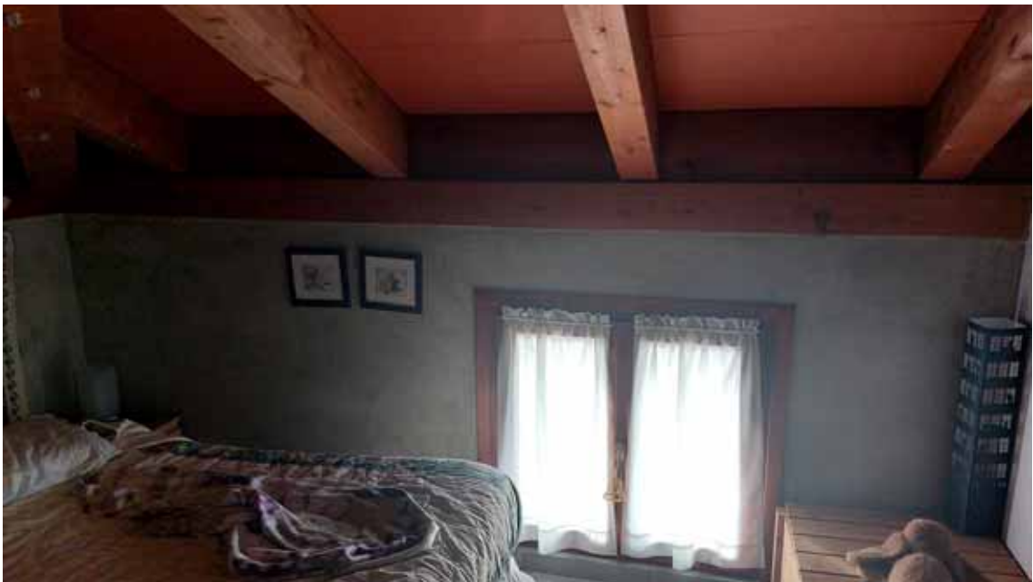
4) Vista del ripostiglio nella soffitta.