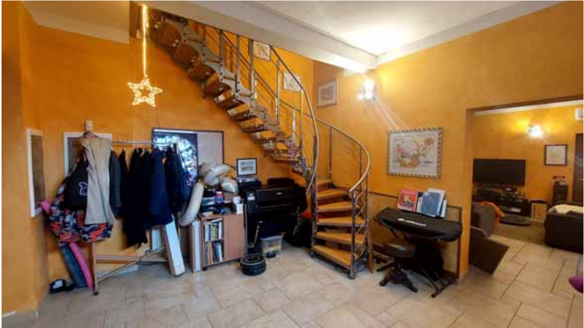
19) Vista dell'ingresso.