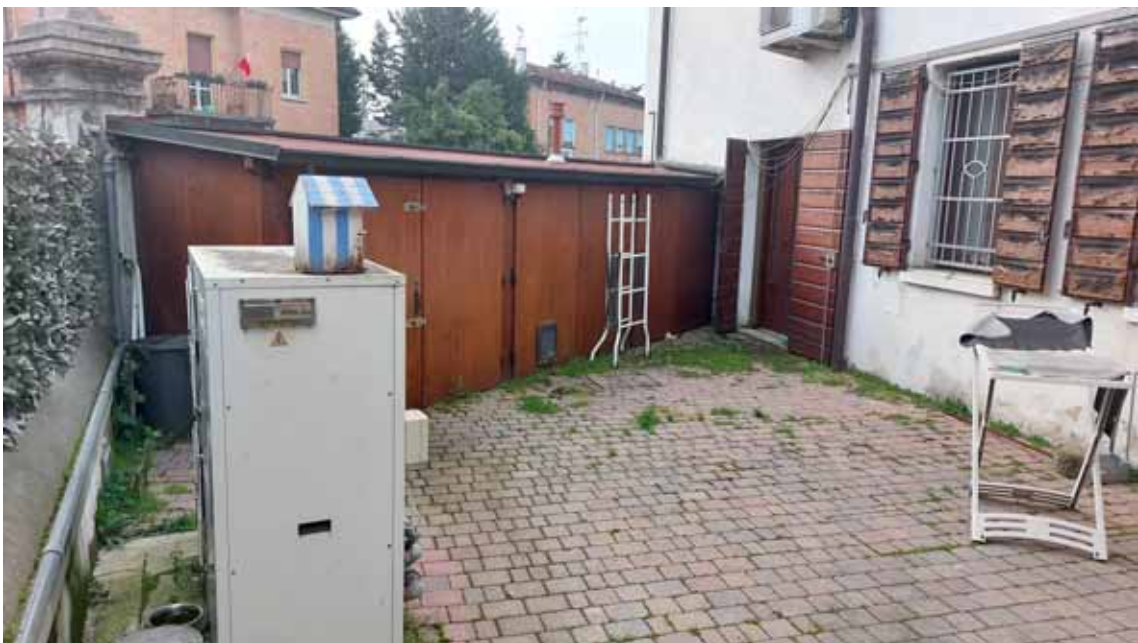
24) Vista di parte dell'area cortiliva.