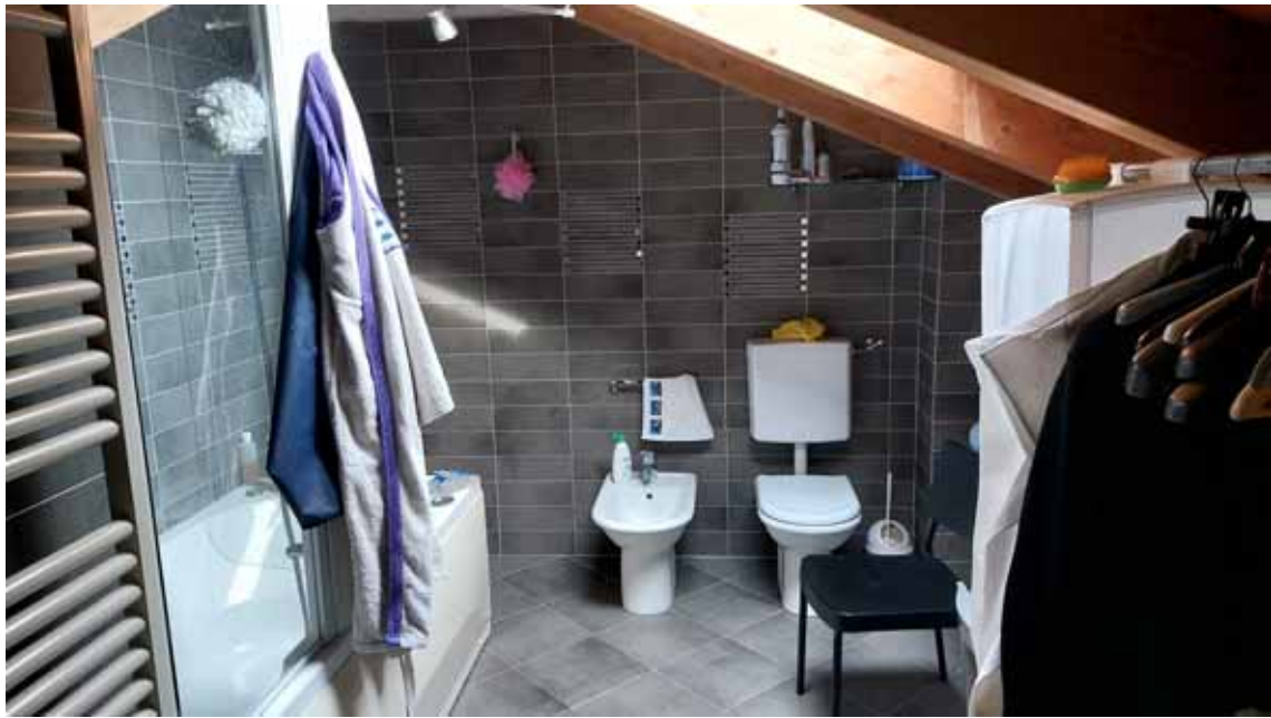
5) Vista della lavanderia nella soffitta.