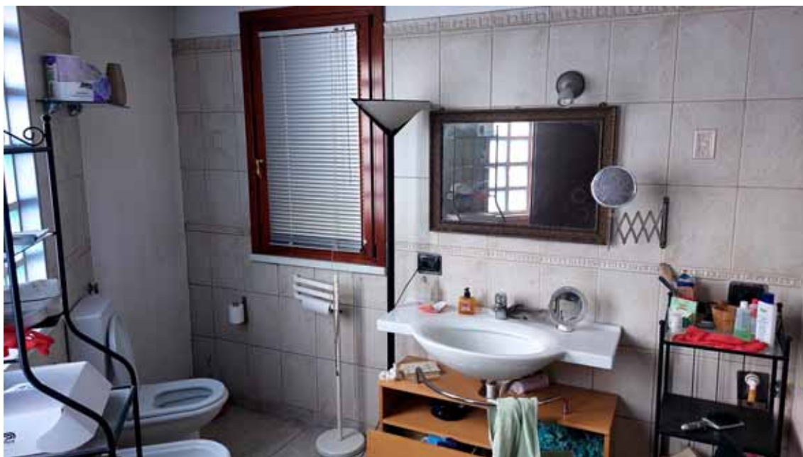
31) Vista del bagno della zona riabilitazione.