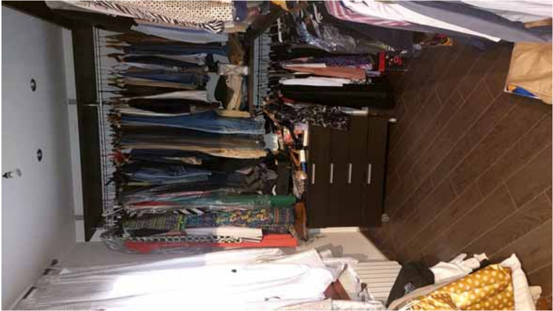
13) Vista della cabina armadi.