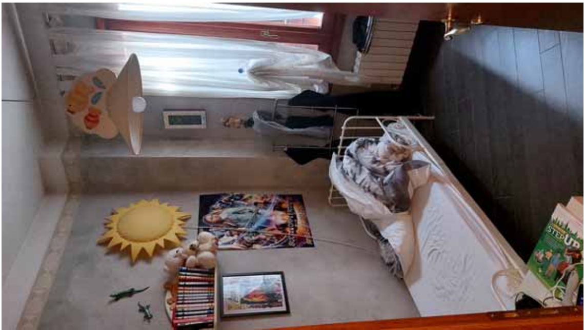
10) Vista di una camera da letto.