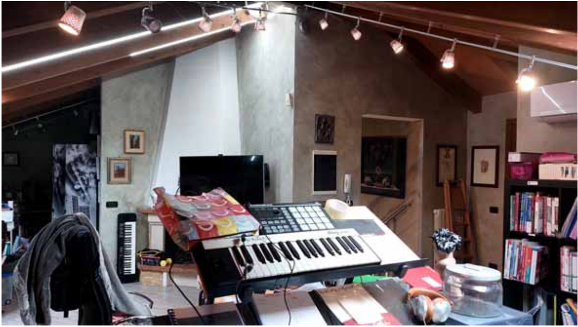
3) Vista della soffitta.