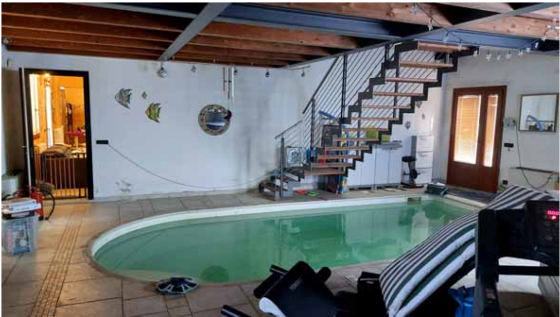
28) Vista della piscina interna.