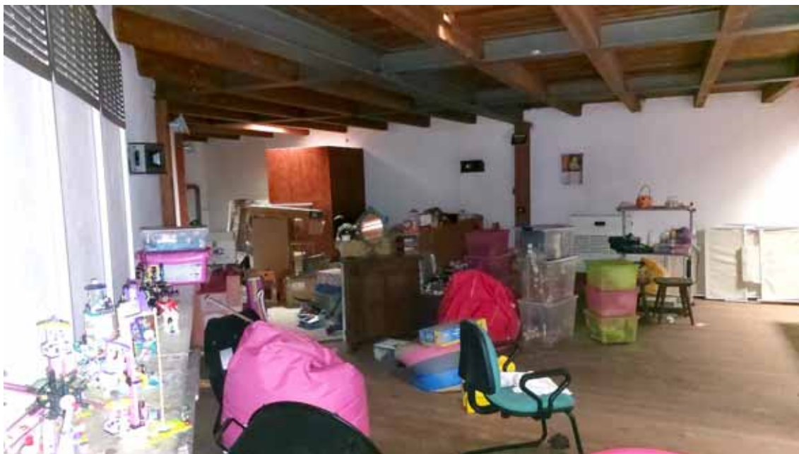
32) Vista del soppalco della zona riabilitazione.