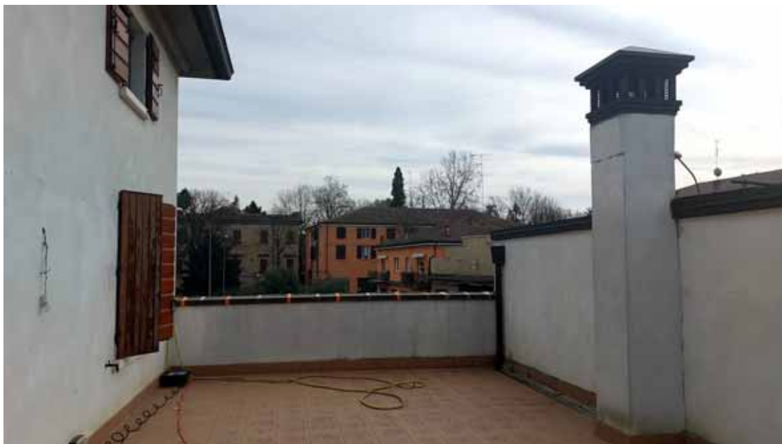
34) Vista della terrazza.