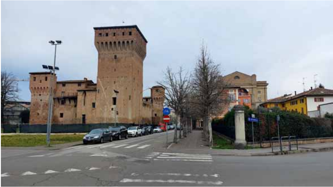
43) Vista della viabilità esterna.