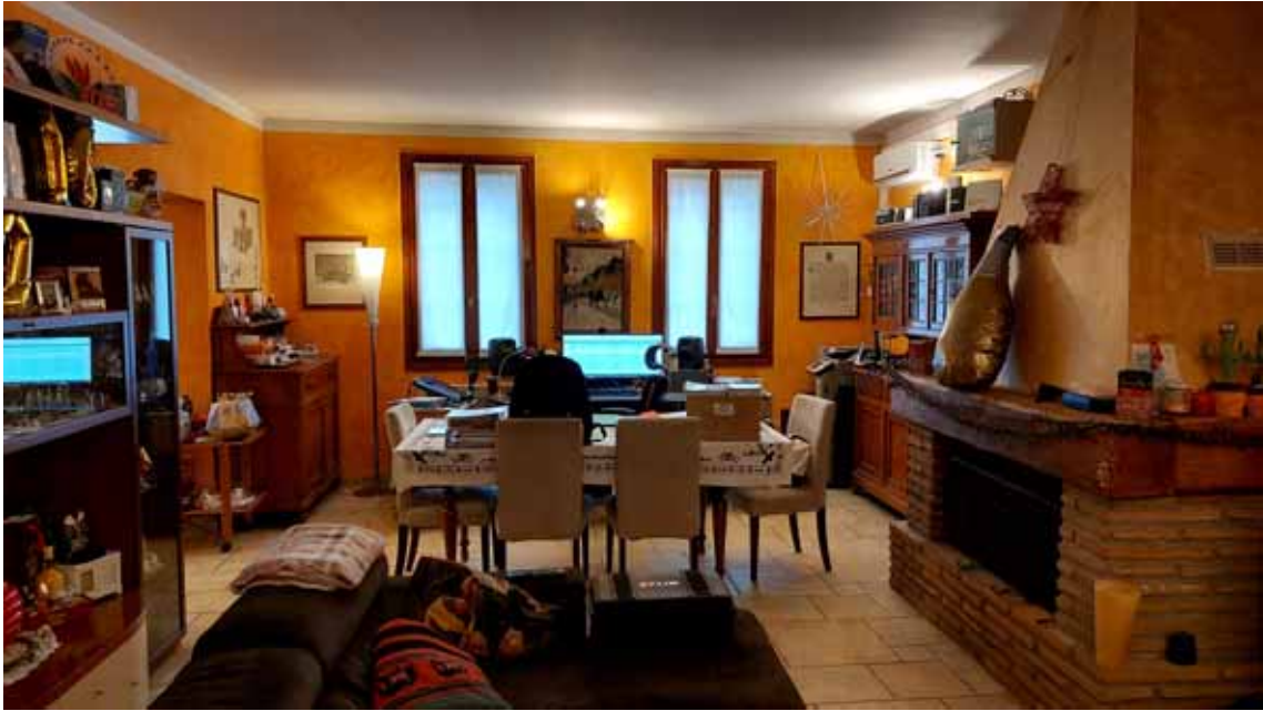
23) Vista del soggiorno.