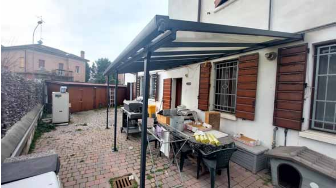
25) Vista di parte dell'area cortiliva.