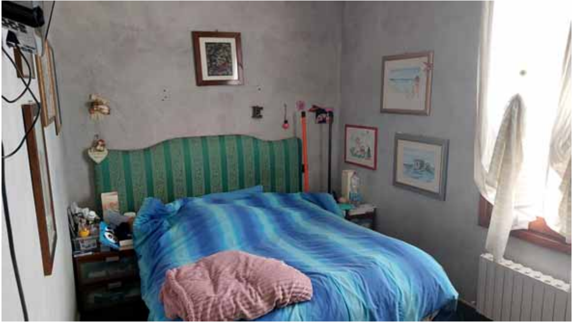
7) Vista di una camera da letto.