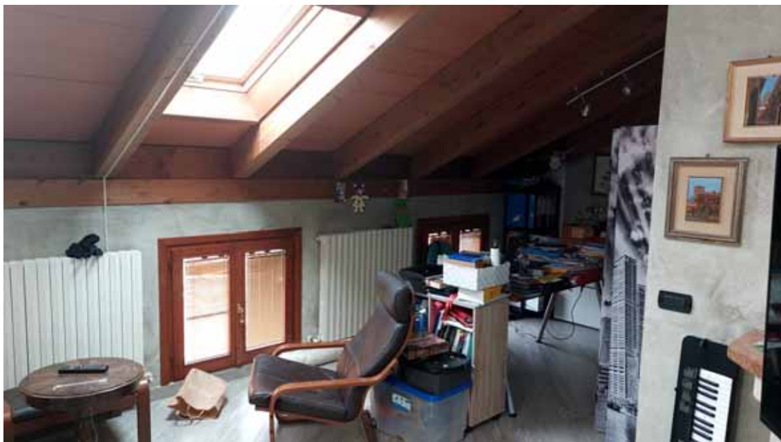
1) Vista della soffitta.