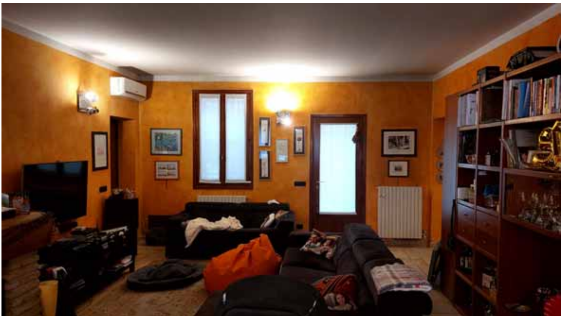
20) Vista del soggiorno.