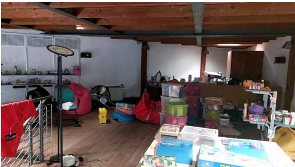
33) Vista del soppalco della zona riabilitazione.