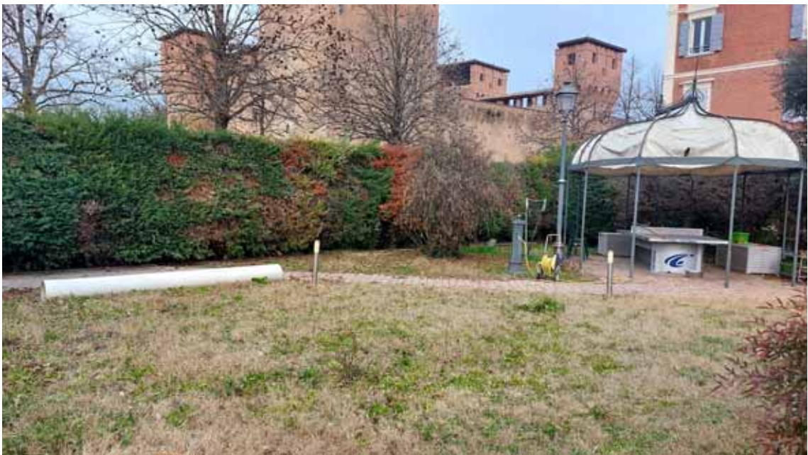
38) Vista dell'area cortiliva fronte strada.