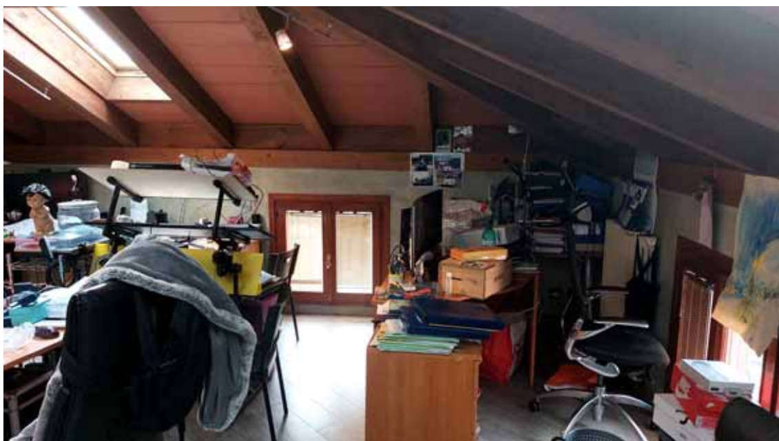
2) Vista della soffitta.