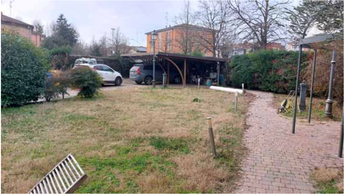
37) Vista dell'area cortiliva fronte strada.