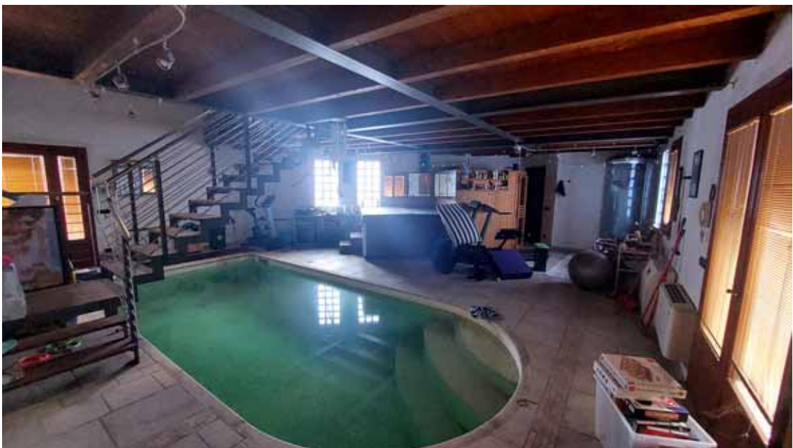
26) Vista della piscina interna.