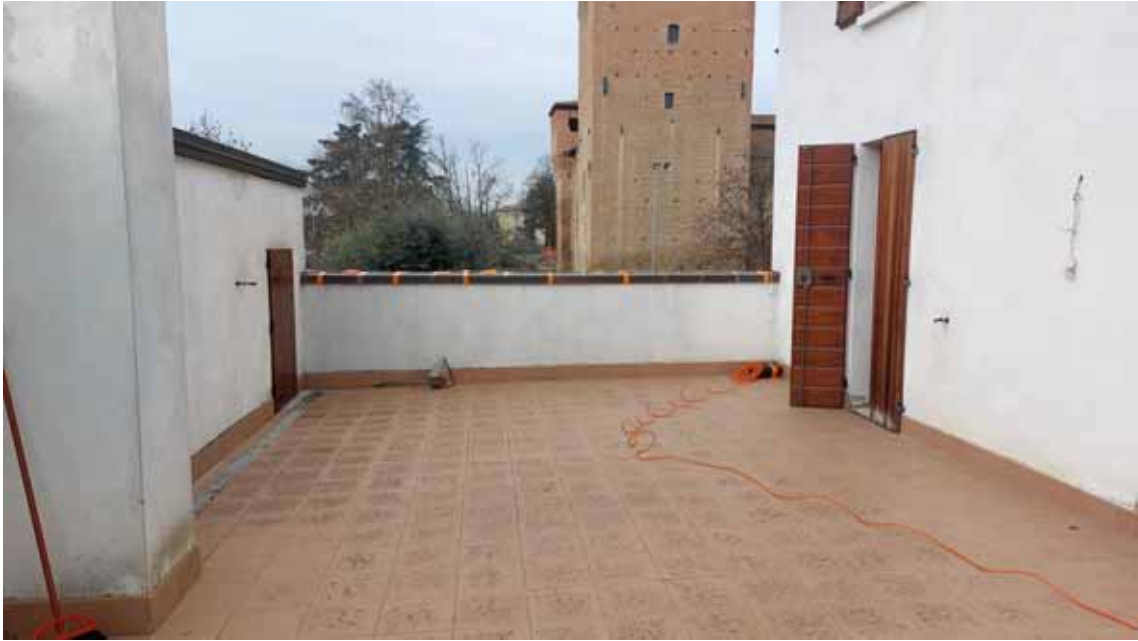
35) Vista della terrazza.