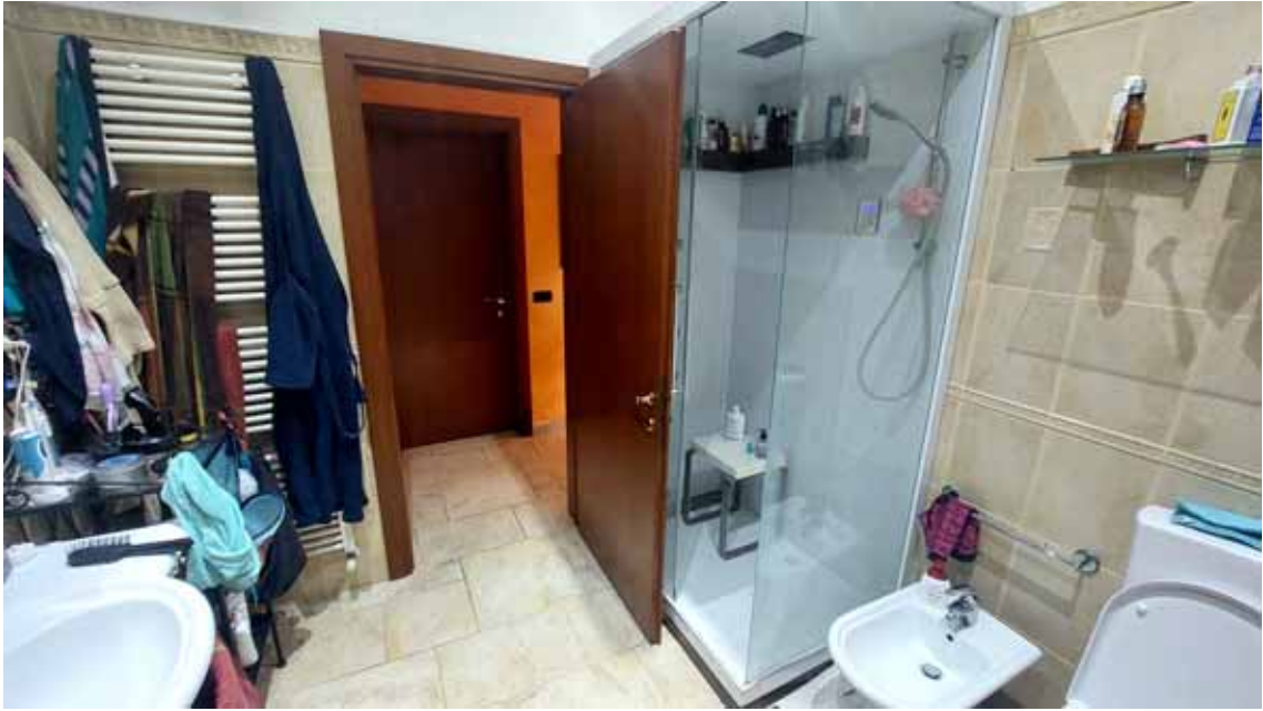
15) Vista di un bagno.