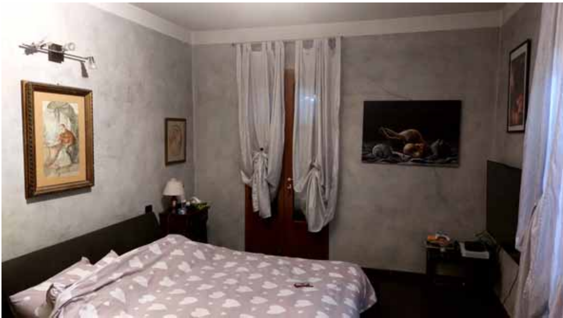
12) Vista di una camera da letto.