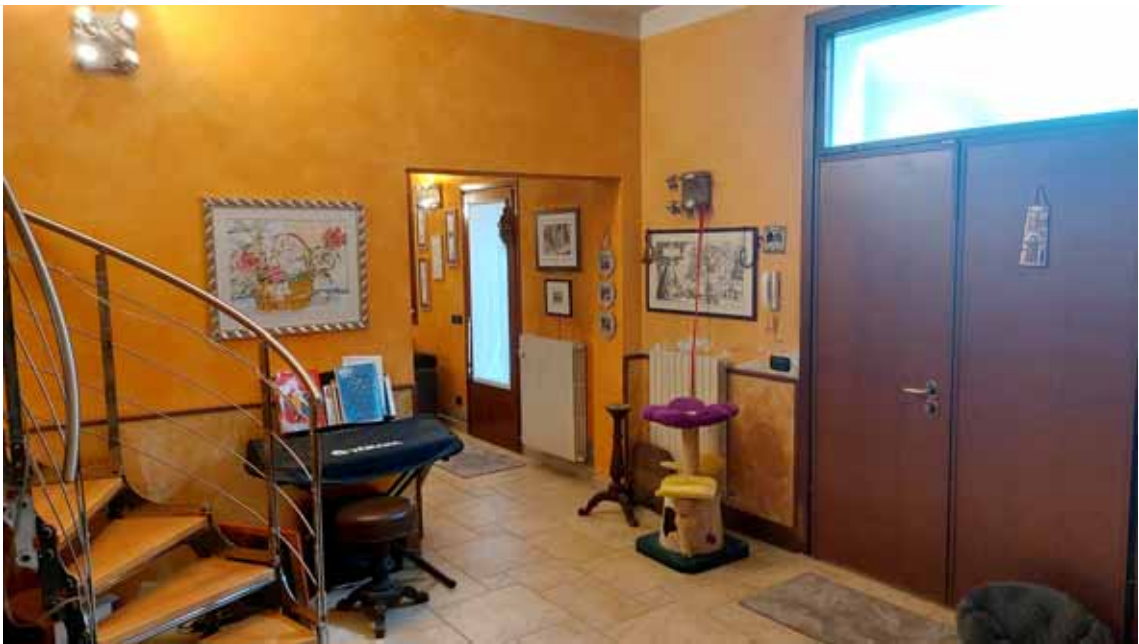
18) Vista dell'ingresso.