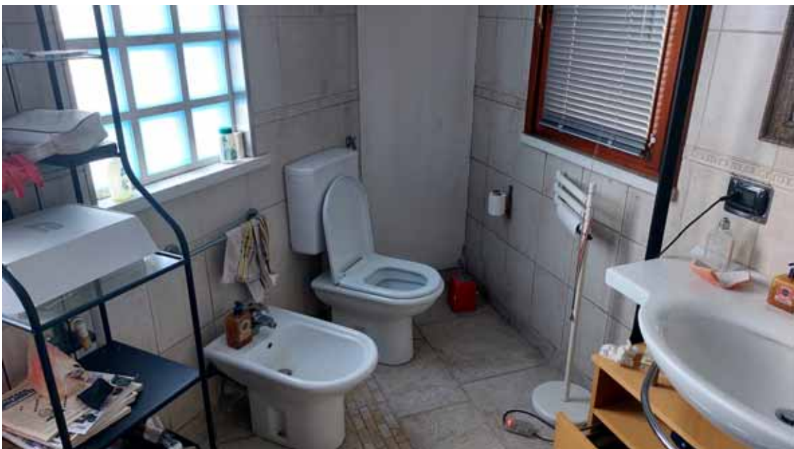
30) Vista del bagno della zona riabilitazione.