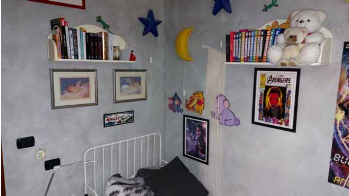
11) Vista di una camera da letto.