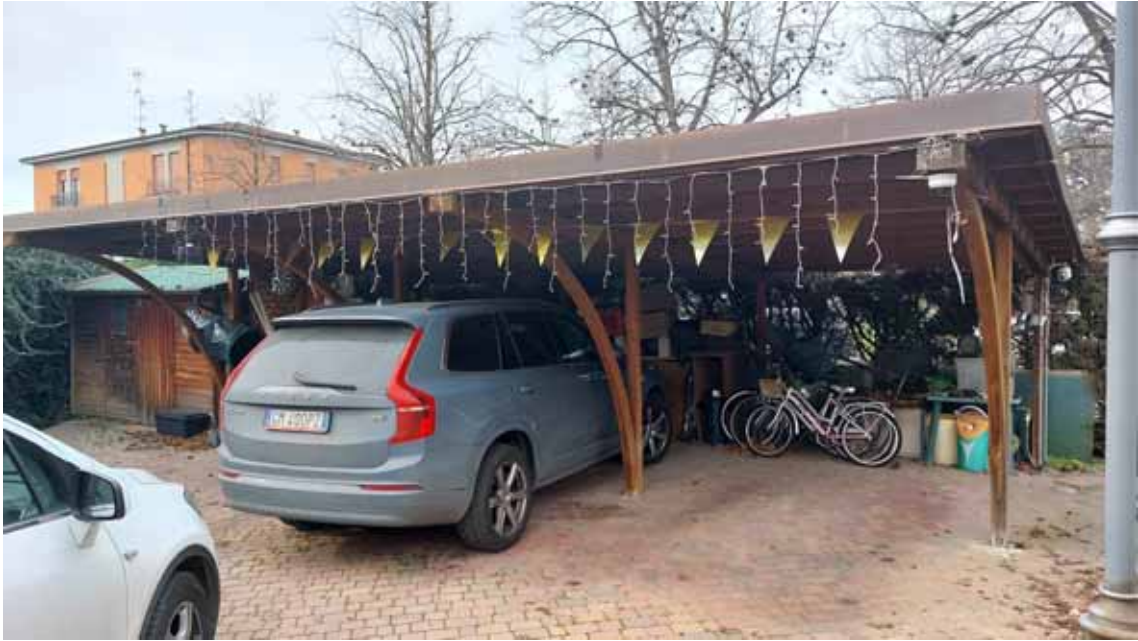
39) Vista dell'area cortiliva fronte strada, con tettoie per auto.