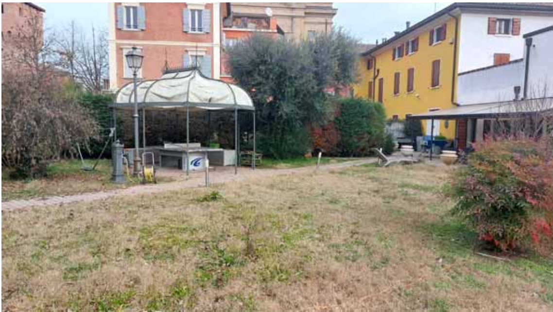
36) Vista dell'area cortiliva fronte strada.