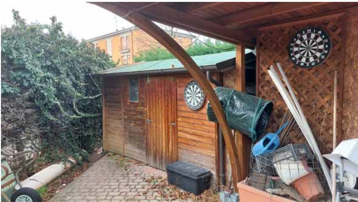
40) Vista del deposito in legno, da demolire.