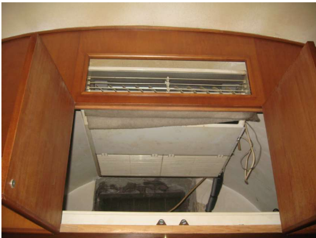
Foto n.18: vista del dell'impianto di condizionamento rivestito da parete in legno e collegato all'esterno sulla retrostante via Sbrasile