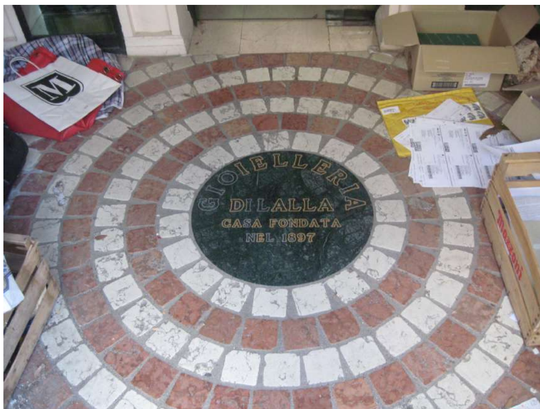
Foto n.6: particolare della pavimentazione nell'atrio d'ingresso al locale commerciale