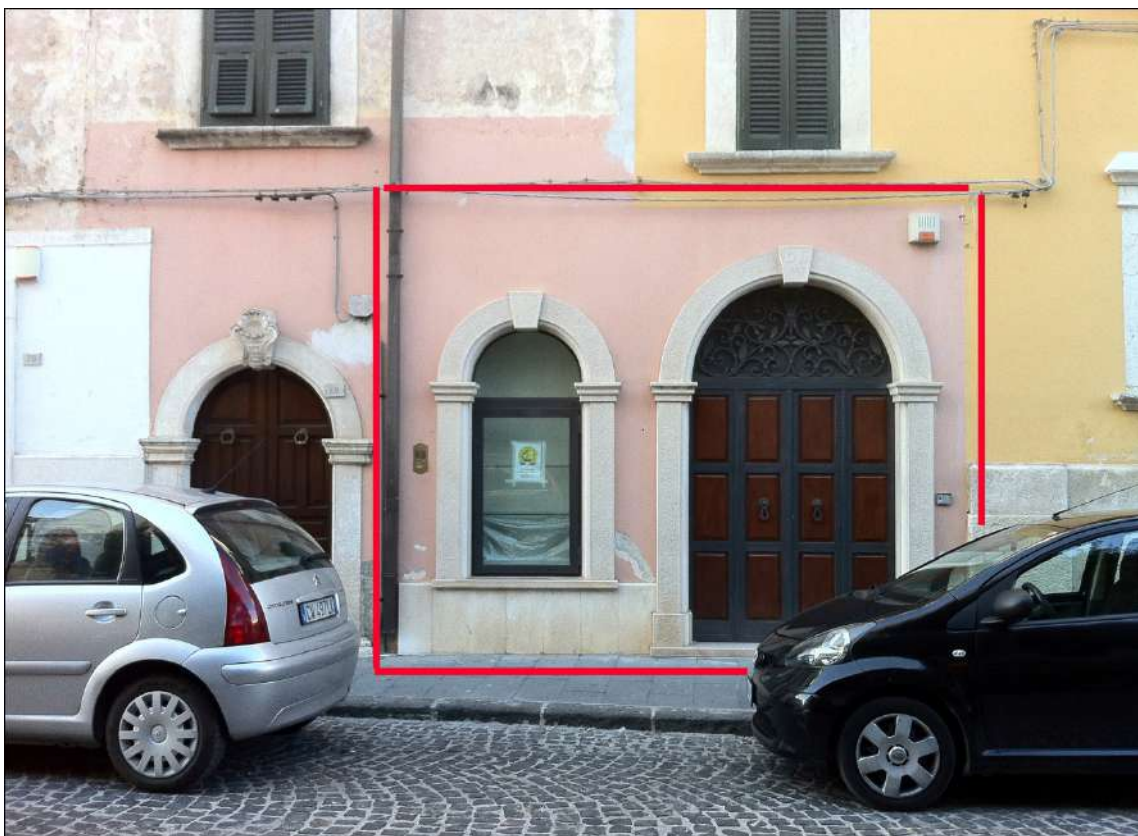
Foto n.2: in rosso sono delineati i confini del lotto in vendita. La vista prospettica evidenzia la presenza di un portone in pietra con porta in legno e ferrobattuto lavorato. Sopraluce finemente decorato sempre in ferrobattuto. Vetrina incassata, laterale, con elementi decorativi in pietra.