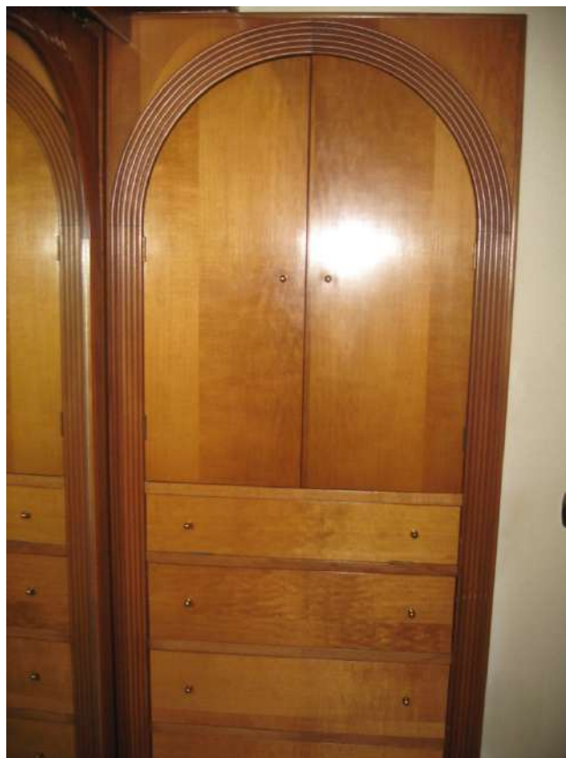
Foto n.14: particolare di rivestimento in legno, di una nicchia muraria profonda, con cassettiere