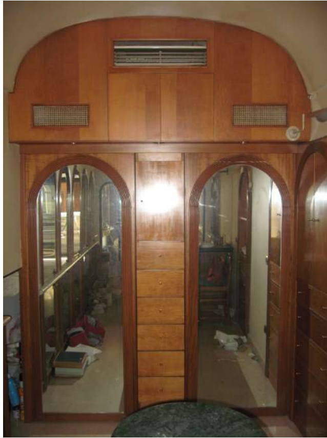
Foto n.11: vista della parte terminale del locale rivestita in legno e specchi