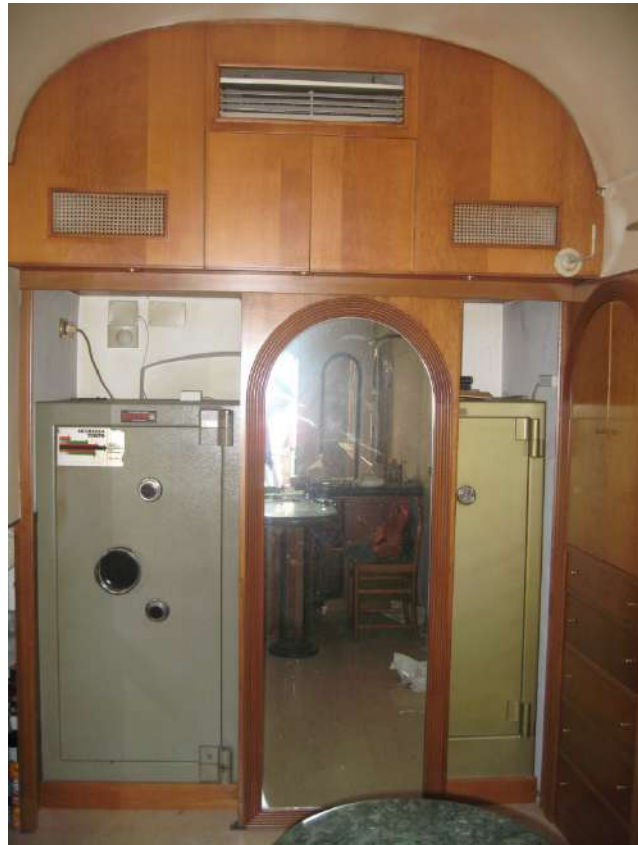
Foto n.12: casseforti di numero pari a 2, retrostanti il rivestimento in parete in legno e specchi