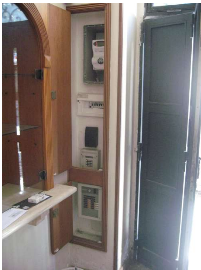
Foto n.16: sistema antifurto e quadro elettrico alloggiati all'interno di apposito vano rivestito