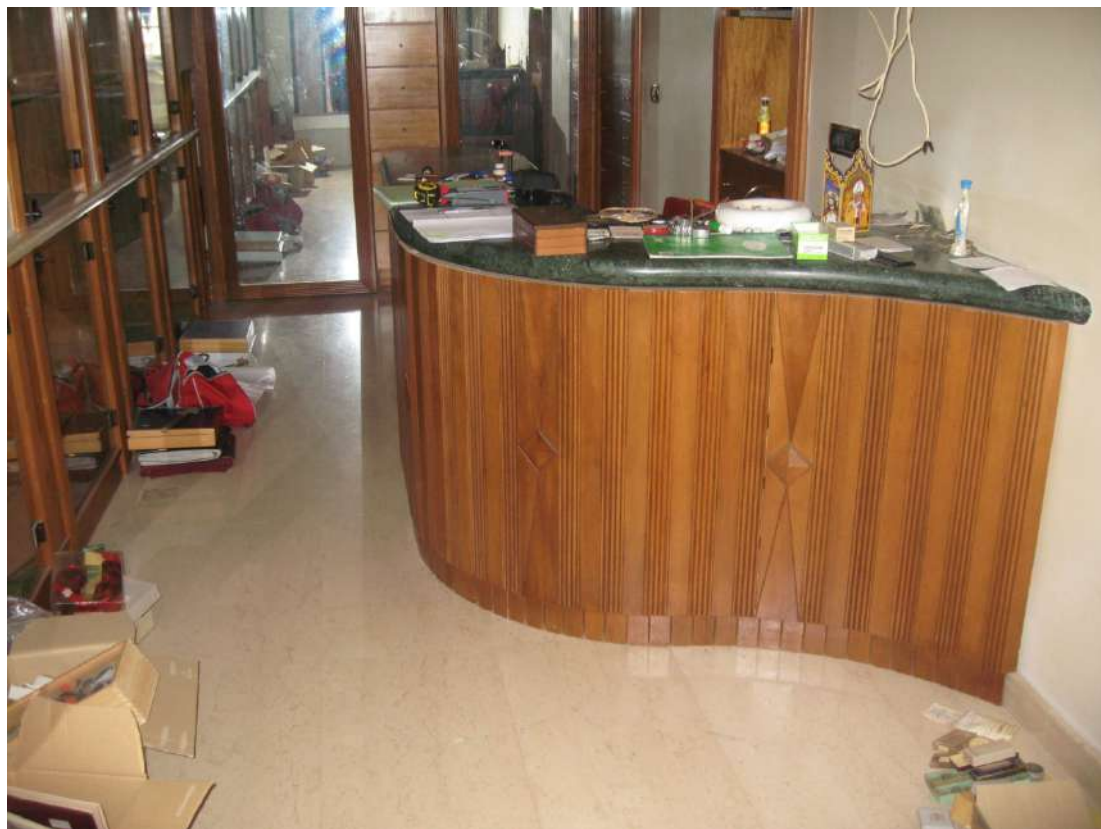
Foto n.10: particolare del bancone con ripiano in verde guatemala e parte verticale in legno