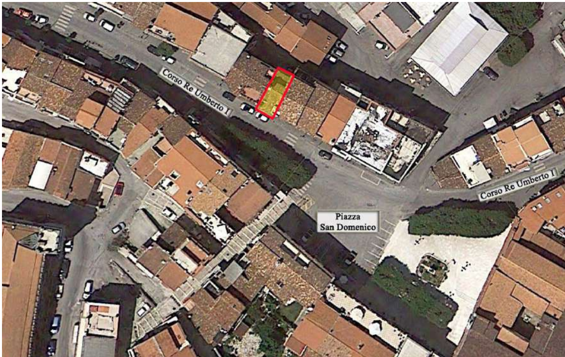
Foto n.1: inquadramento urbanistico del Lotto nel contesto cittadino. Il locale commerciale è ubicato sulla via principale della cittadina.