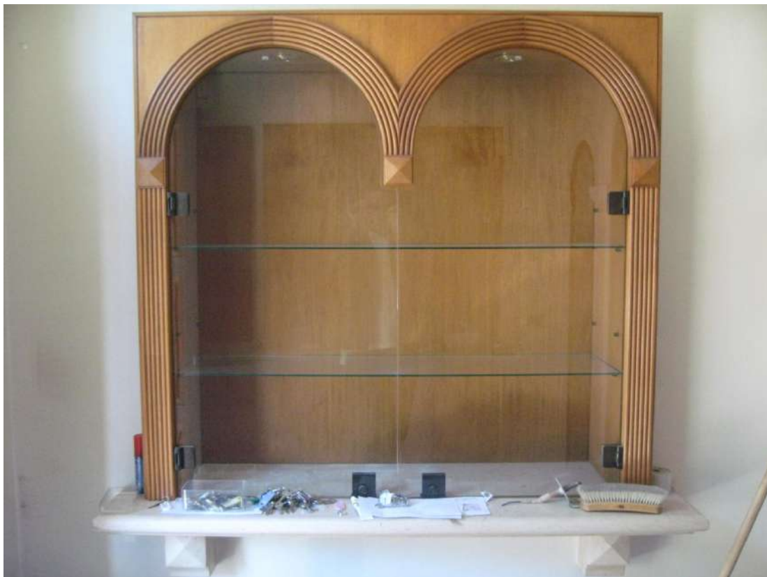
Foto n.17: vetrine espositive in legno, vetro e pietra ubicate nella zona d'ingresso