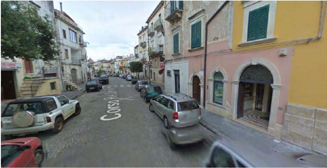
Foto n.3: vista prospettica della strada di ubicazione del lotto al Civico n.66 di Corso Re Umberto I. Il lotto è posizionato sulla destra della foto ed è individuato dal portone aperto e dalla adiacente vetrina incassata. Facciata intonacata di colore rosa, in buono stato conservativo.