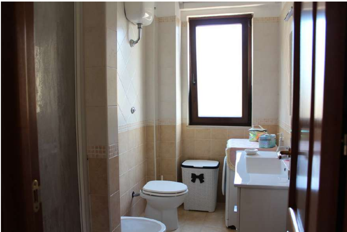
Foto 78: bagno di servizio, con vano doccia in muratura e finestra esposta ad ovest.