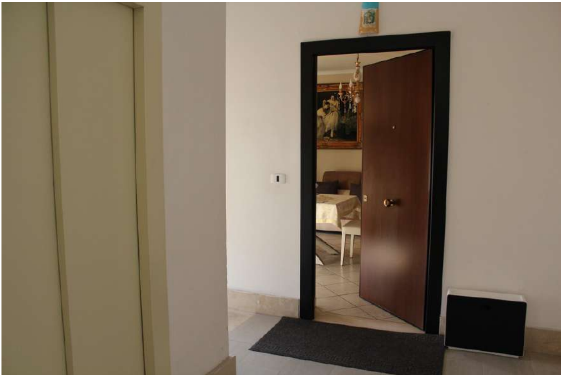
Foto 41: accesso all'appartamento al primo piano della scala B dell'edificio A, sub. 30.