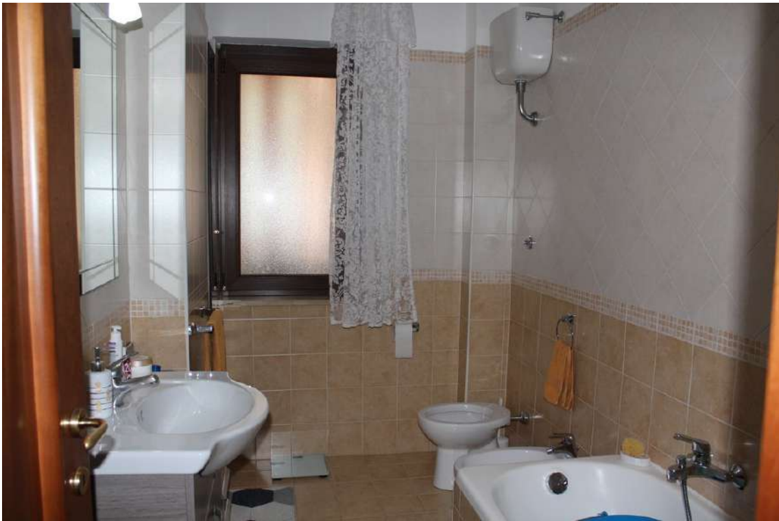
Foto 87: bagno principale dotato di vasca e con finestra esposta verso sud.