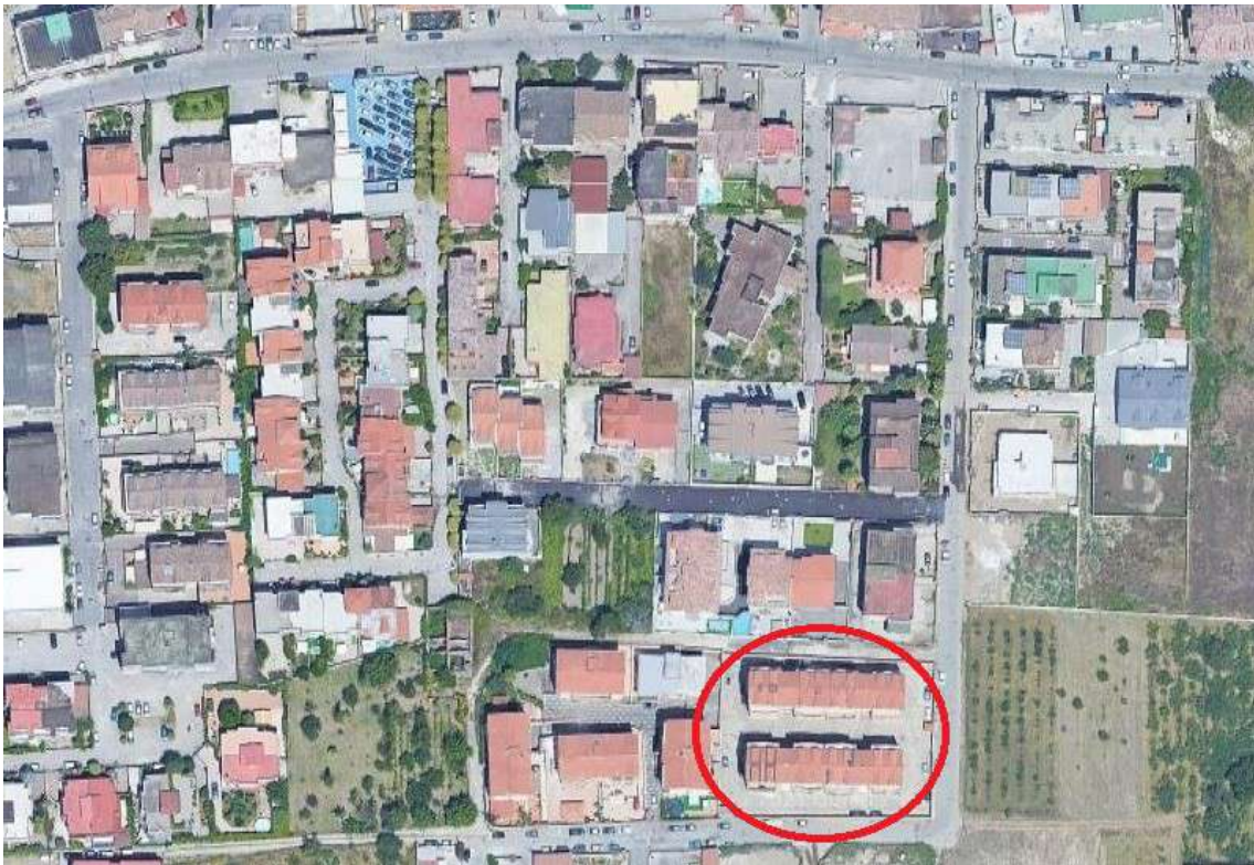
Foto 3: traversa di via Della Libertà, in evidenza il Parco Susanna, al civico n° 478/O.