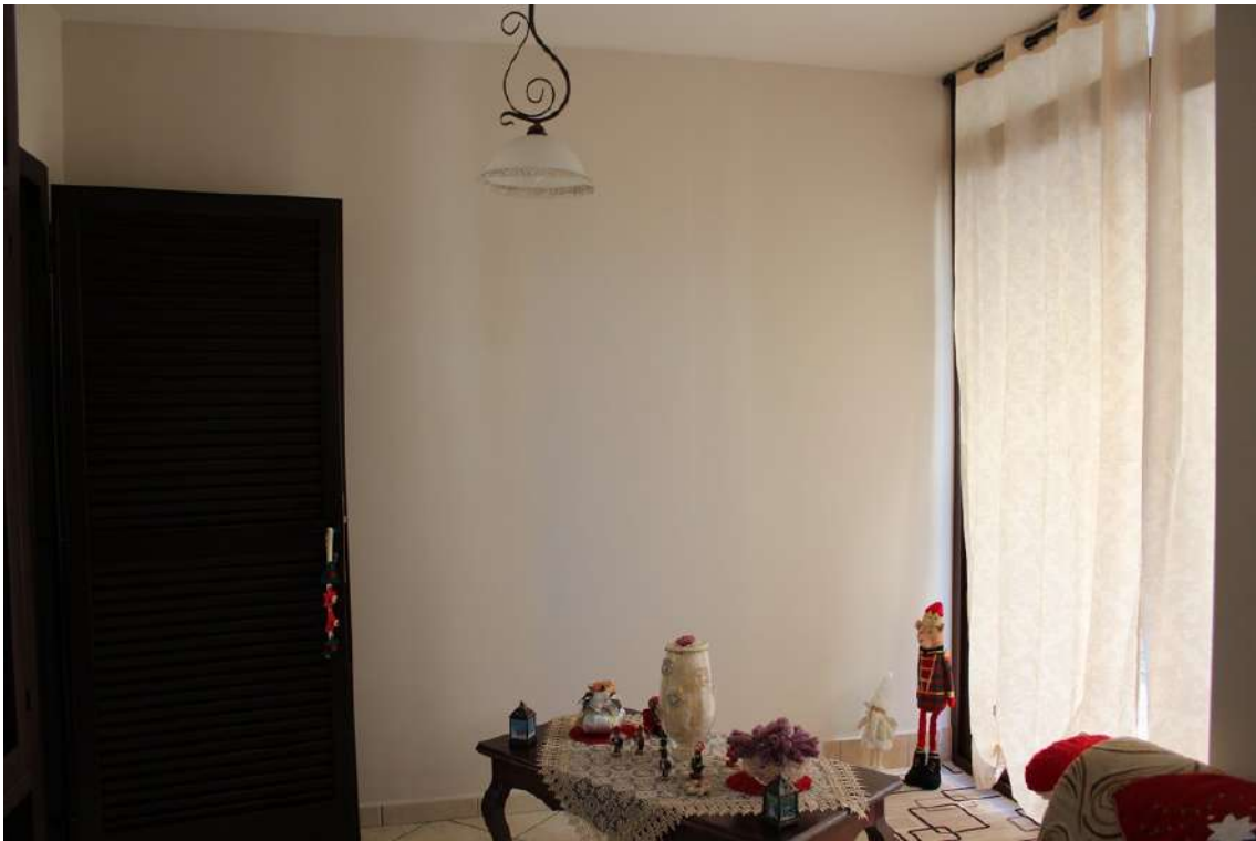
Foto 33: ambiente chiuso da veranda, ricavato sul balcone esposto verso nord.