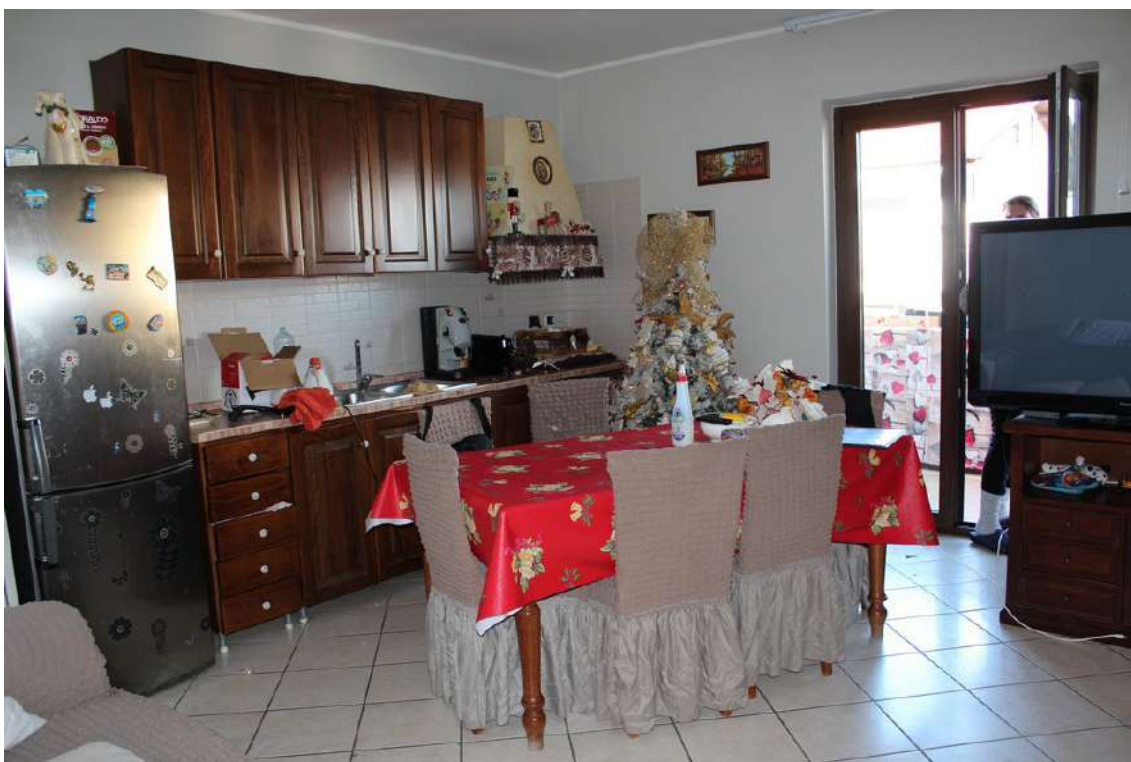
Foto 62: ingresso diretto nel living, con balcone esposto a nord.