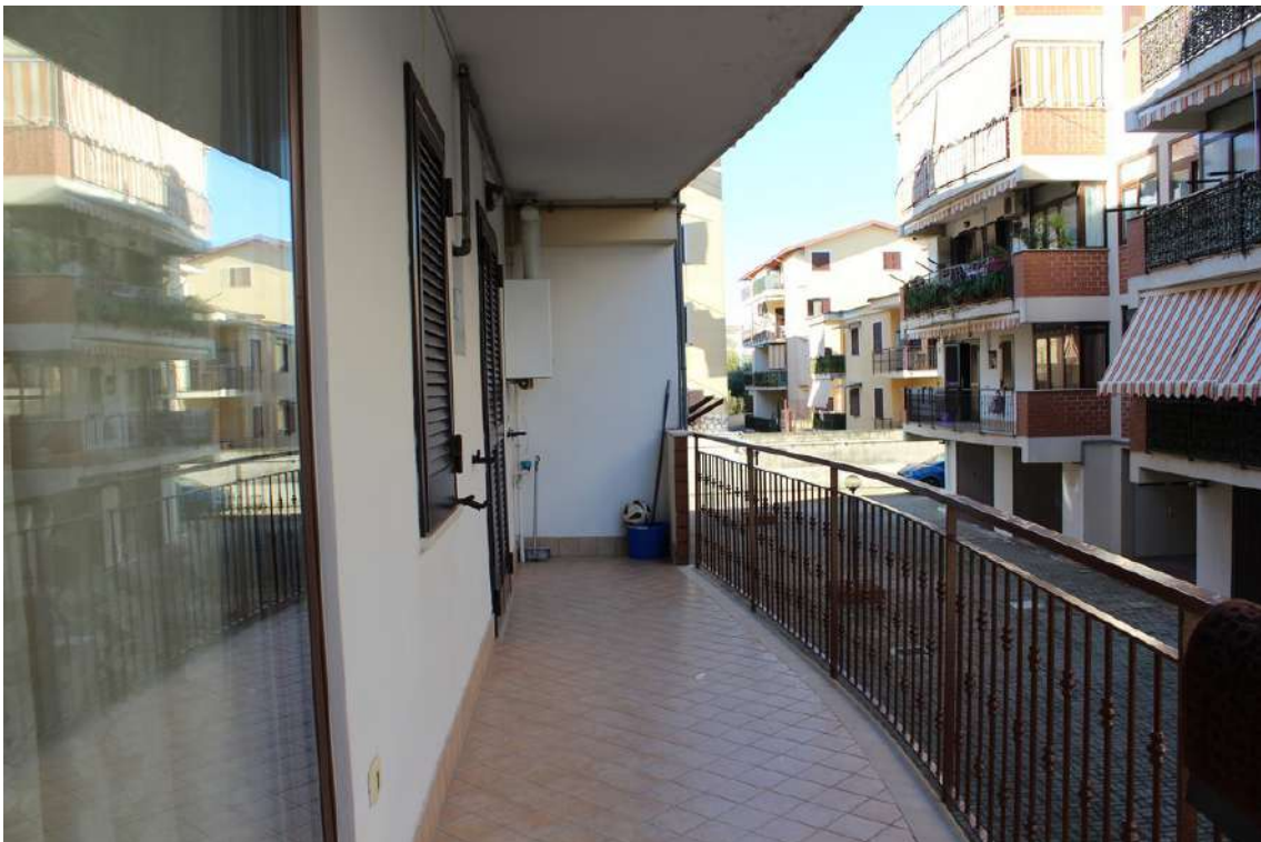
Foto 34: balconi e finestra del bagno esposti verso il cortile centrale del parco.