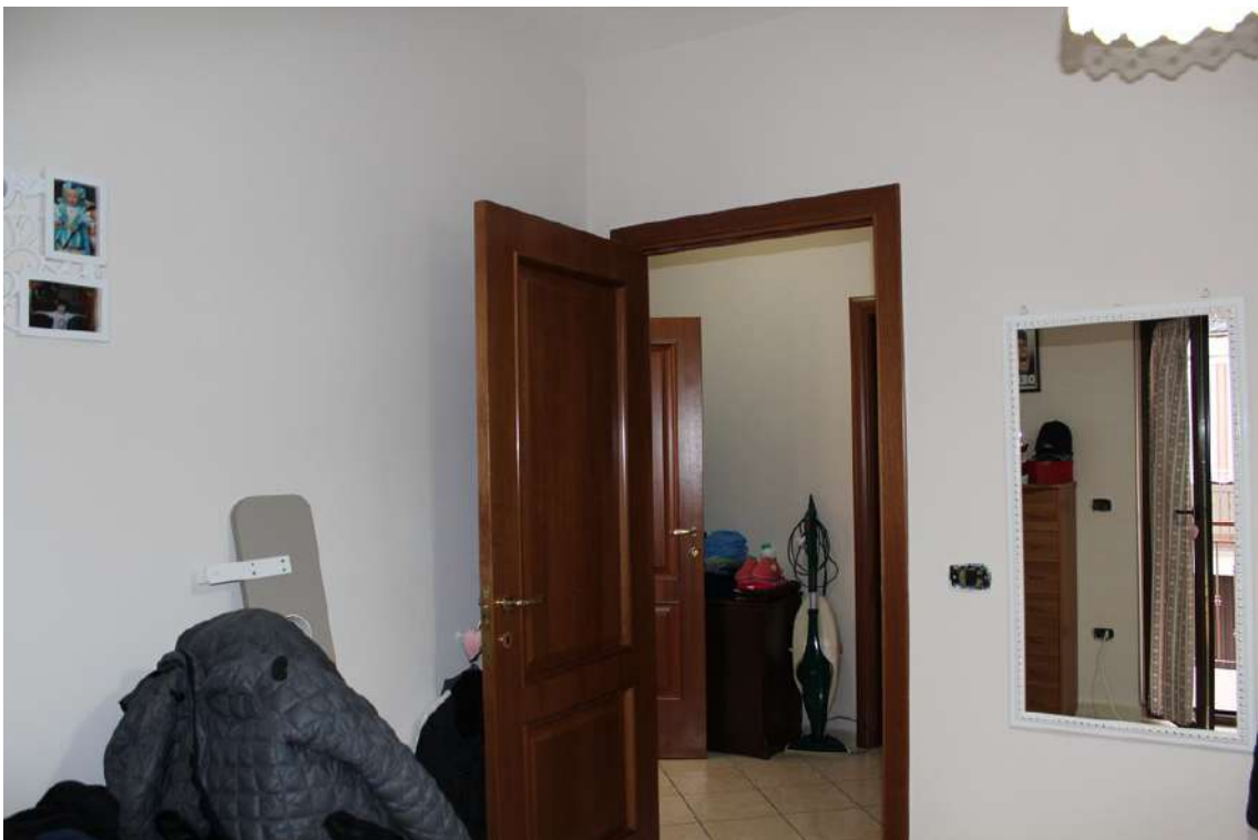
Foto 38: seconda camera con esposizione verso nord, sul cortile centrale del parco.