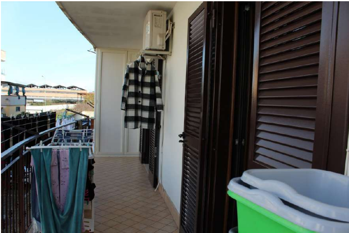
Foto 73: balconi del soggiorno e della camera da letto padronale, esposti verso nord.