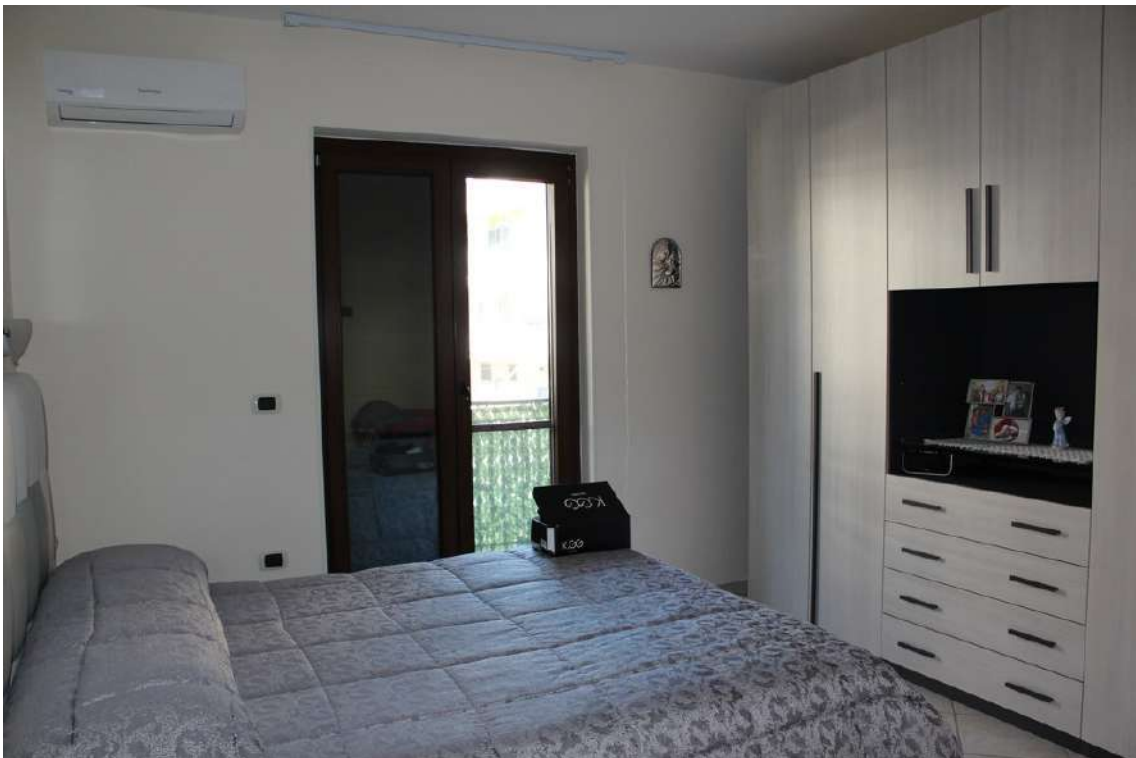
Foto 84: camera da letto padronale con balcone esposto verso nord.