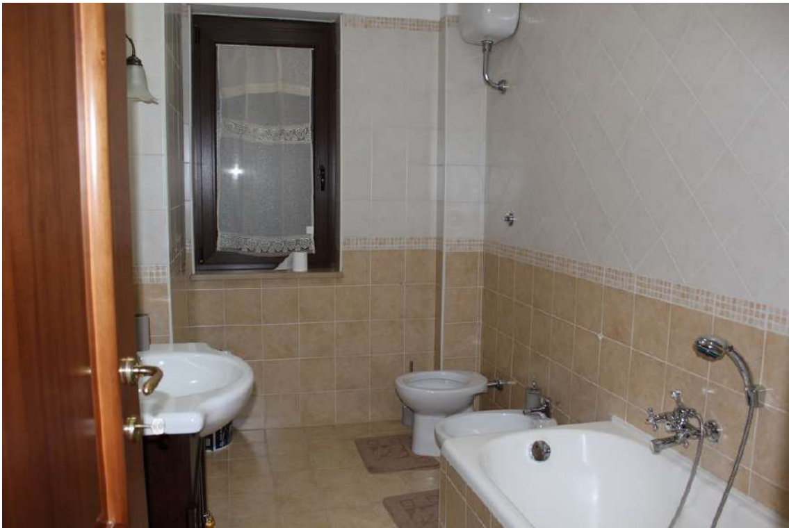
Foto 39: bagno principale dotato di vasca e con finestra esposta verso nord.