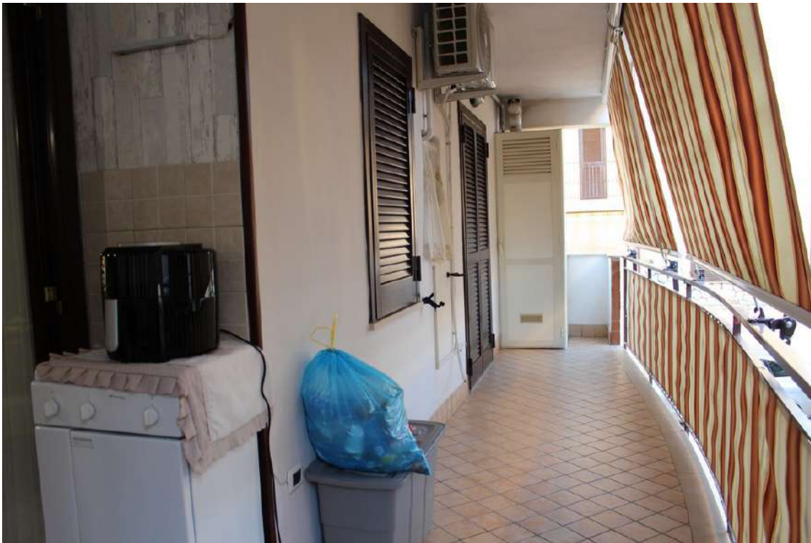
Foto 45: balconi e finestra del bagno esposti verso il cortile centrale del parco.