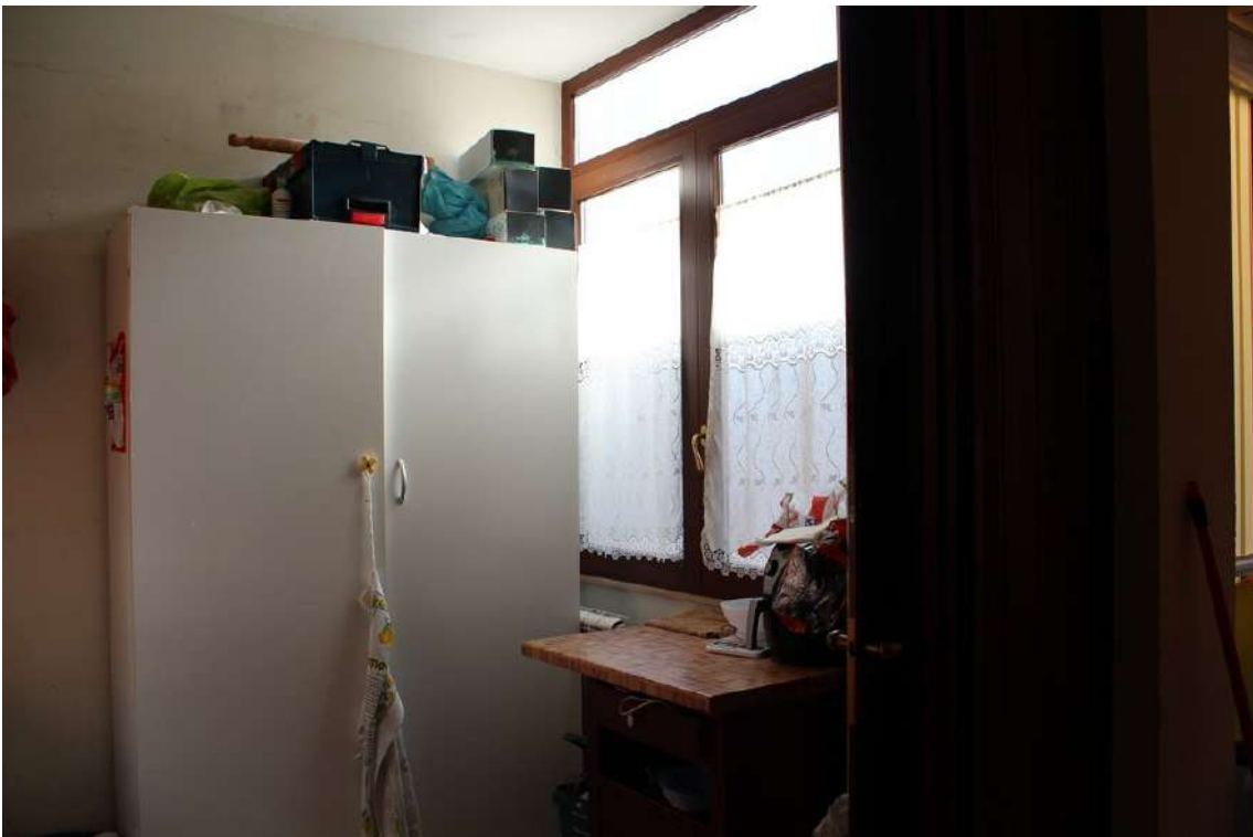
Foto 64: piccola veranda sul balcone esposto a sud, verso il cortile centrale del parco.