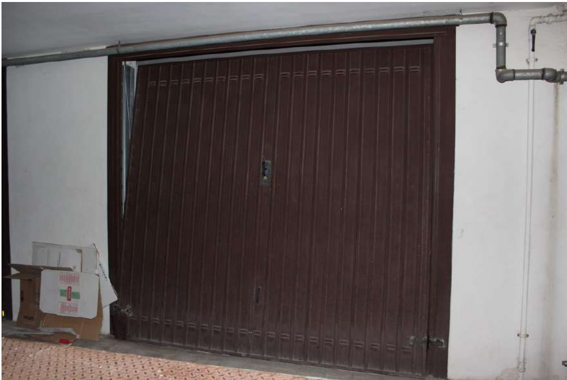
Foto 29: garage al piano terra dell'edificio B con accesso sul lato sud, di sub. 61.