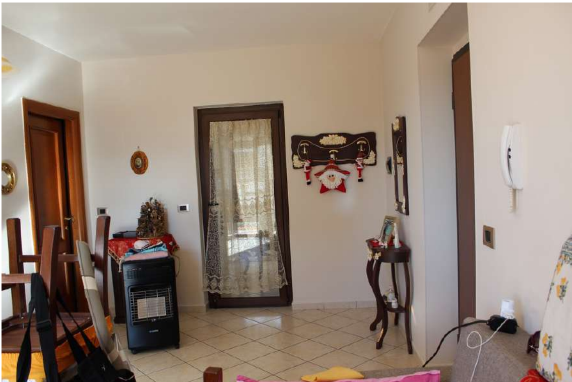
Foto 32: ingresso diretto nel living, collegato al disimpegno ed alla veranda.