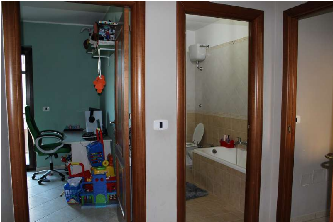
Foto 56: disimpegno della zona notte, composta da due camere e due bagni.