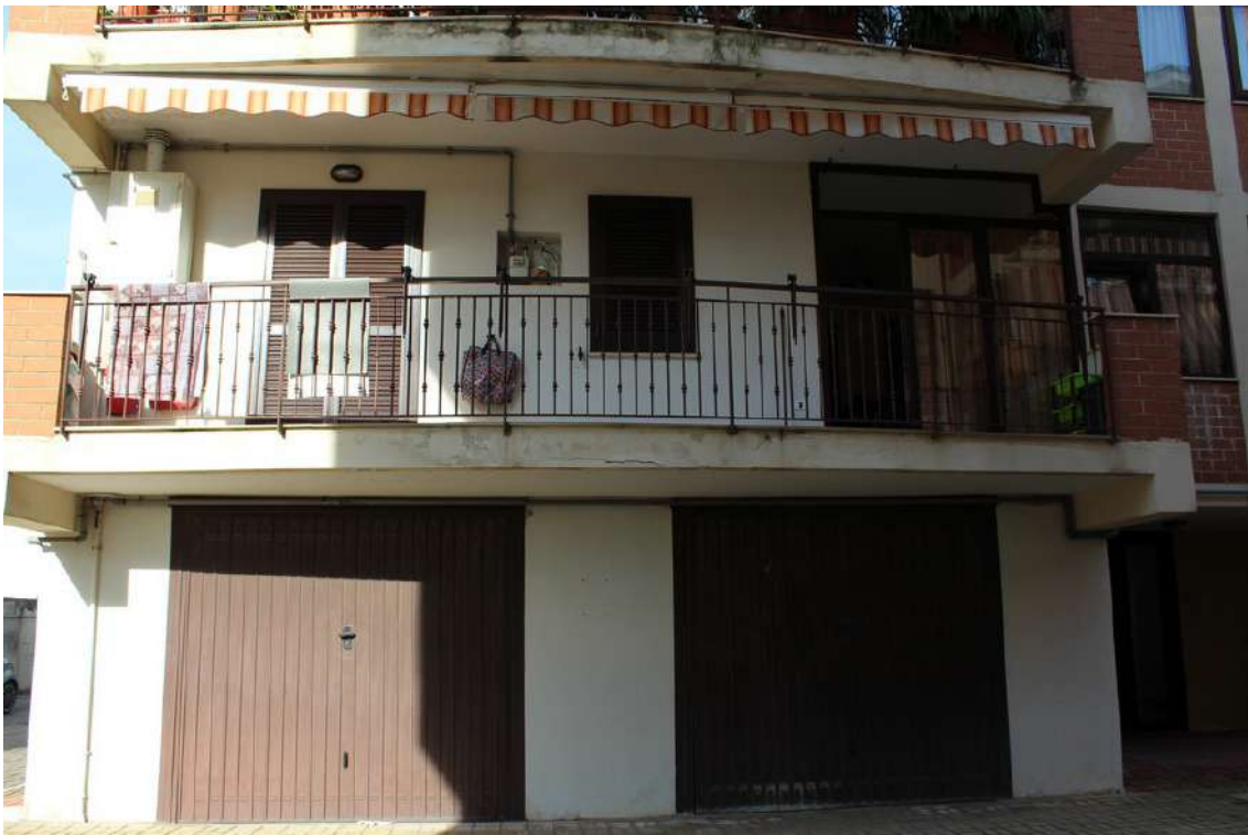
Foto 16: balcone esposto sul cortile centrale dell'appartamento al primo piano sub. 62.