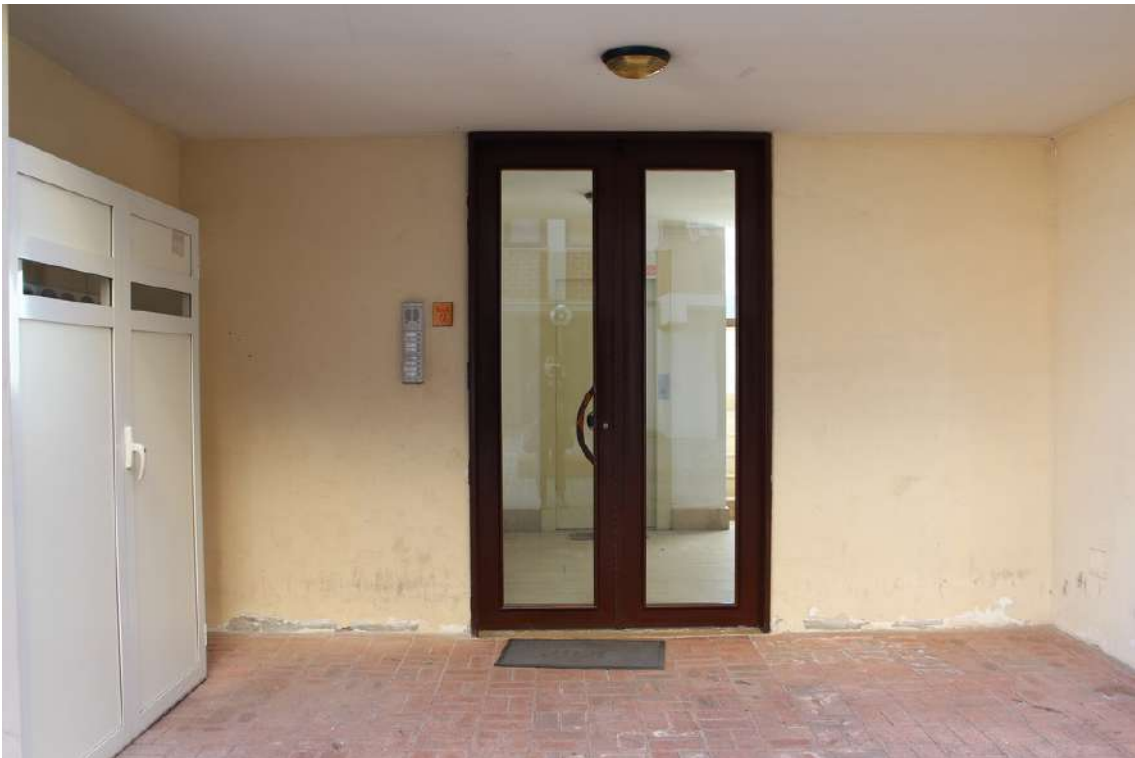
Foto 9: portone del vano scala A dell'edificio A, con accesso dal cortile centrale.