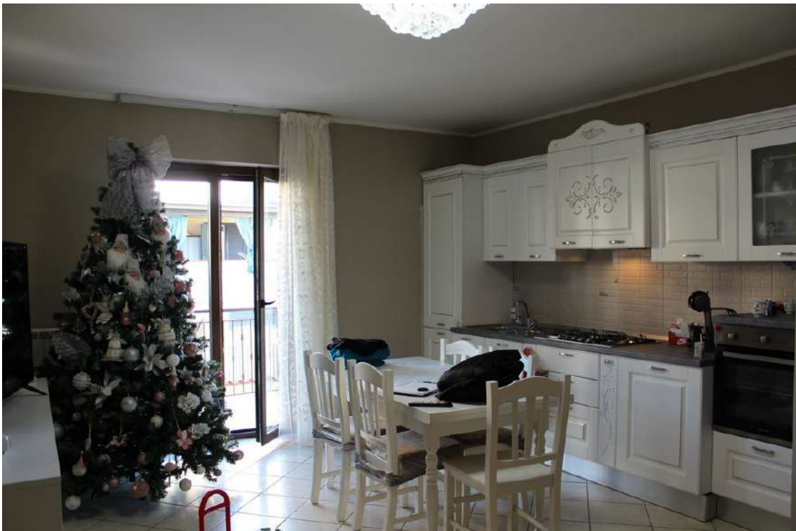
Foto 52: ingresso diretto nel living, con balcone esposto a nord.