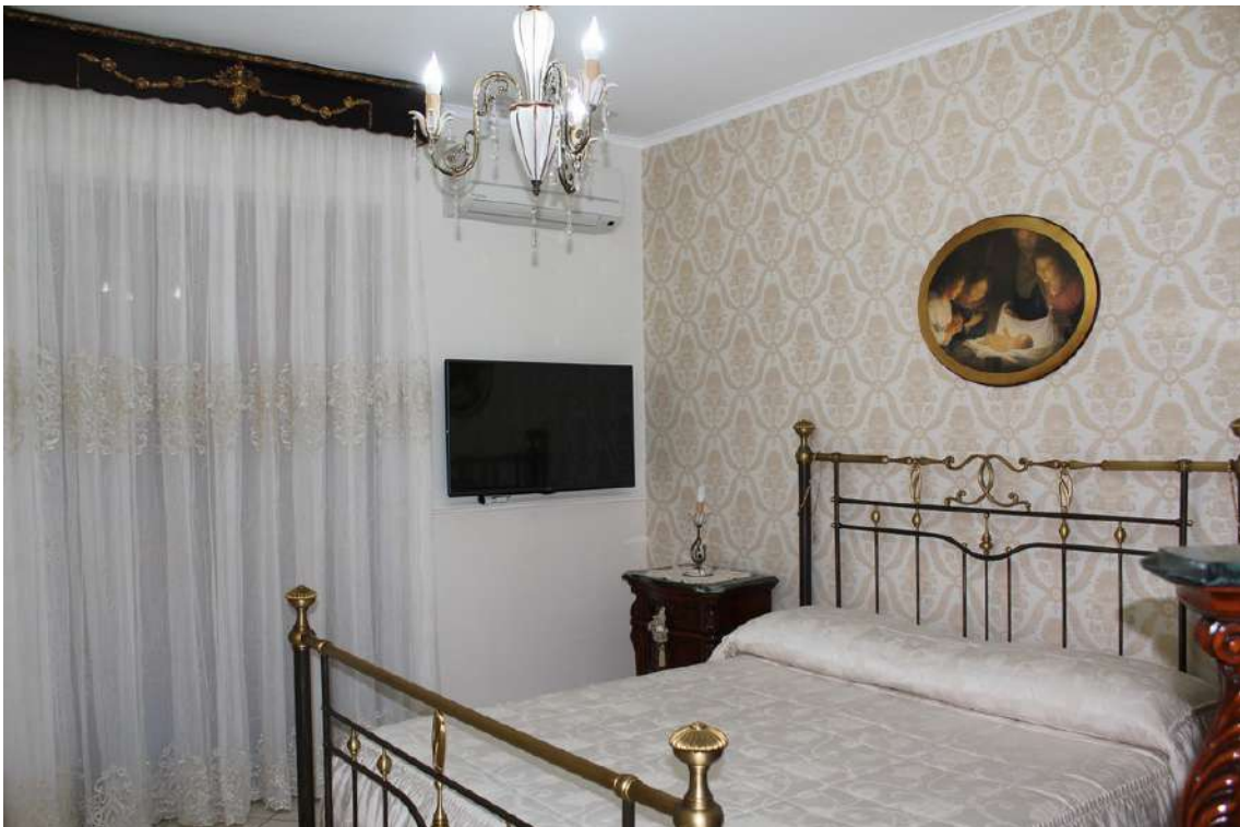
Foto 46: camera da letto padronale con accesso dal disimpegno della zona notte.