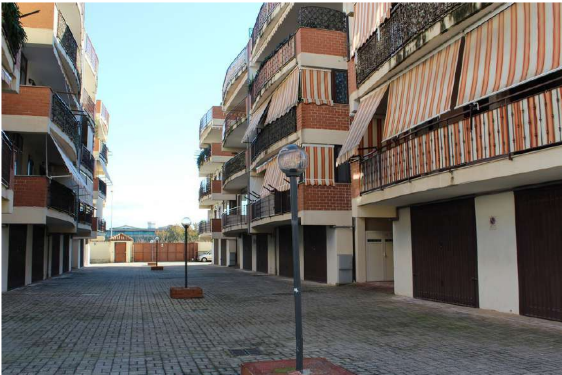
Foto 18: cortile centrale del Parco Susanna, con cancelli d'accesso sul lato est del lotto.