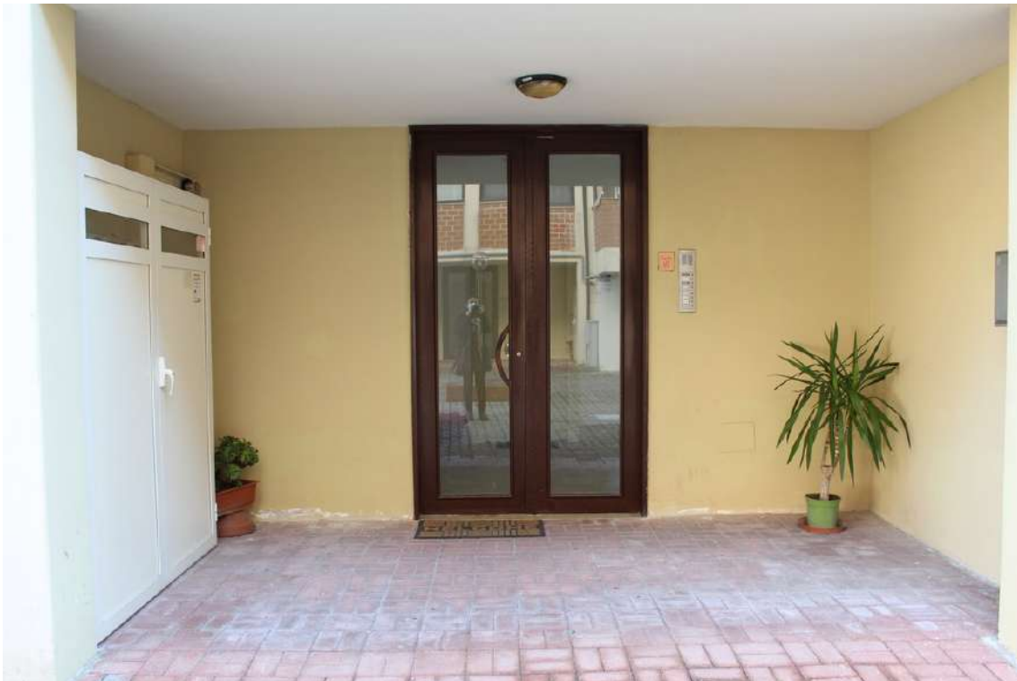
Foto 15: portone del vano scala D dell'edificio B, con accesso dal cortile centrale.