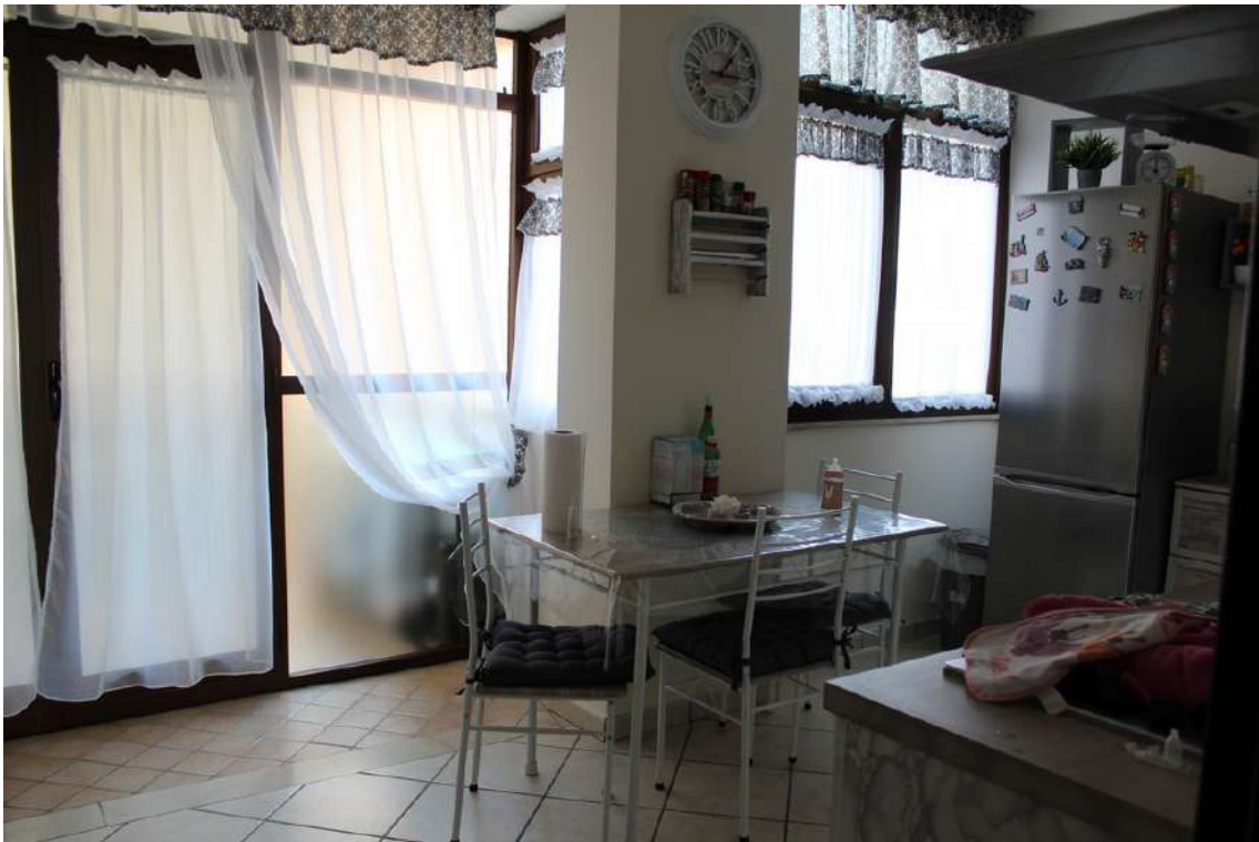
Foto 81: veranda adibita a cucina, ricavata sul balcone esposto sul cortile centrale.