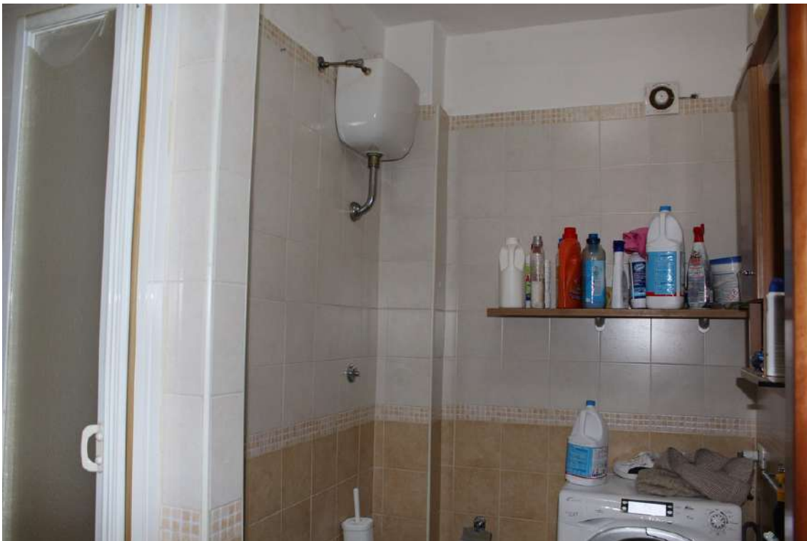
Foto 68: bagno di servizio, con vano doccia in muratura e impianto di aspirazione.