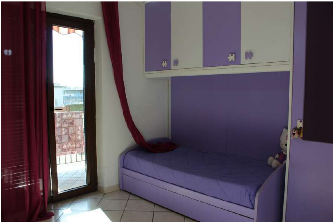
Foto 76: seconda camera con balcone esposto verso sud, sul cortile centrale del parco.