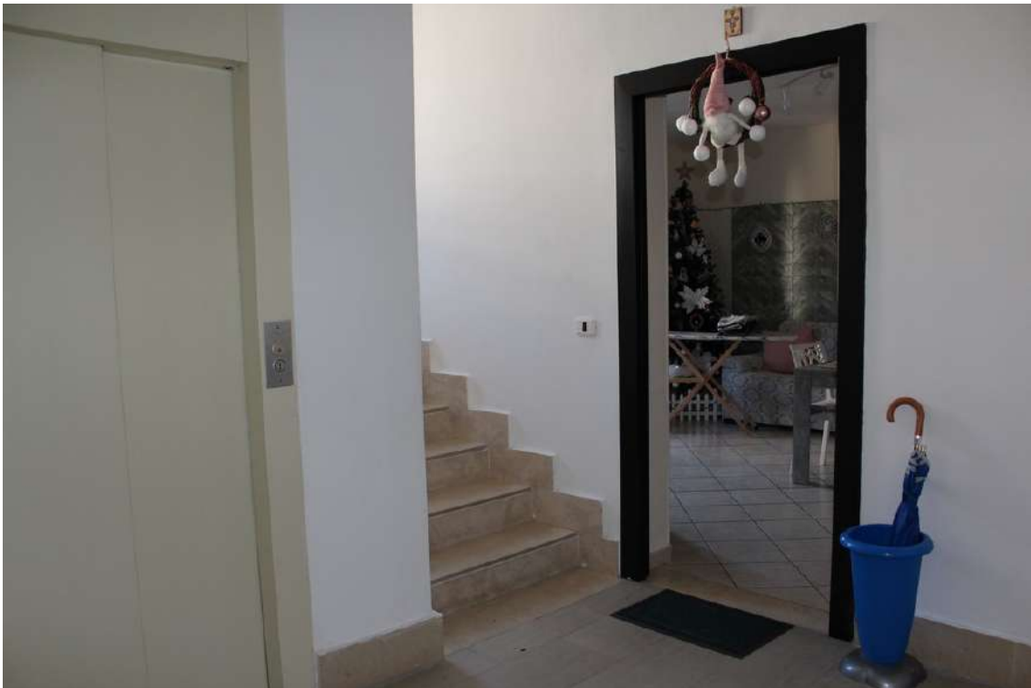
Foto 79: accesso all'appartamento al primo piano della scala D nell'edificio B, sub. 63.