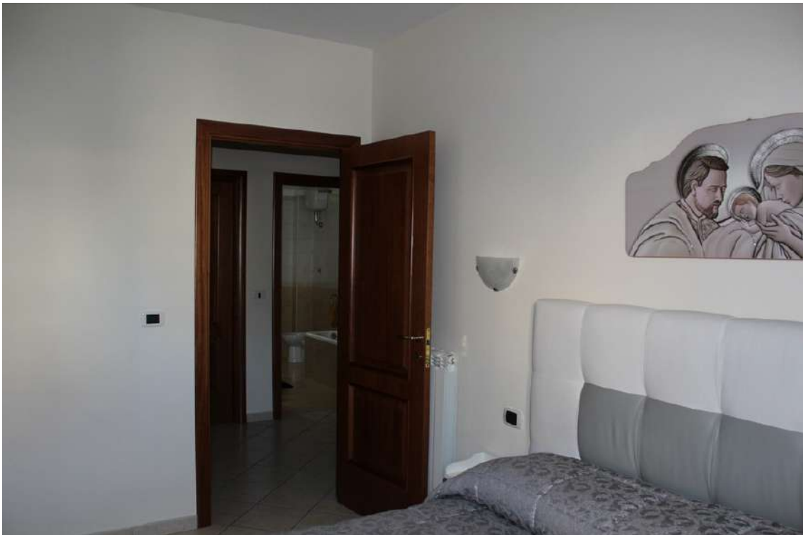
Foto 85: camera da letto padronale con accesso dal disimpegno della zona notte.