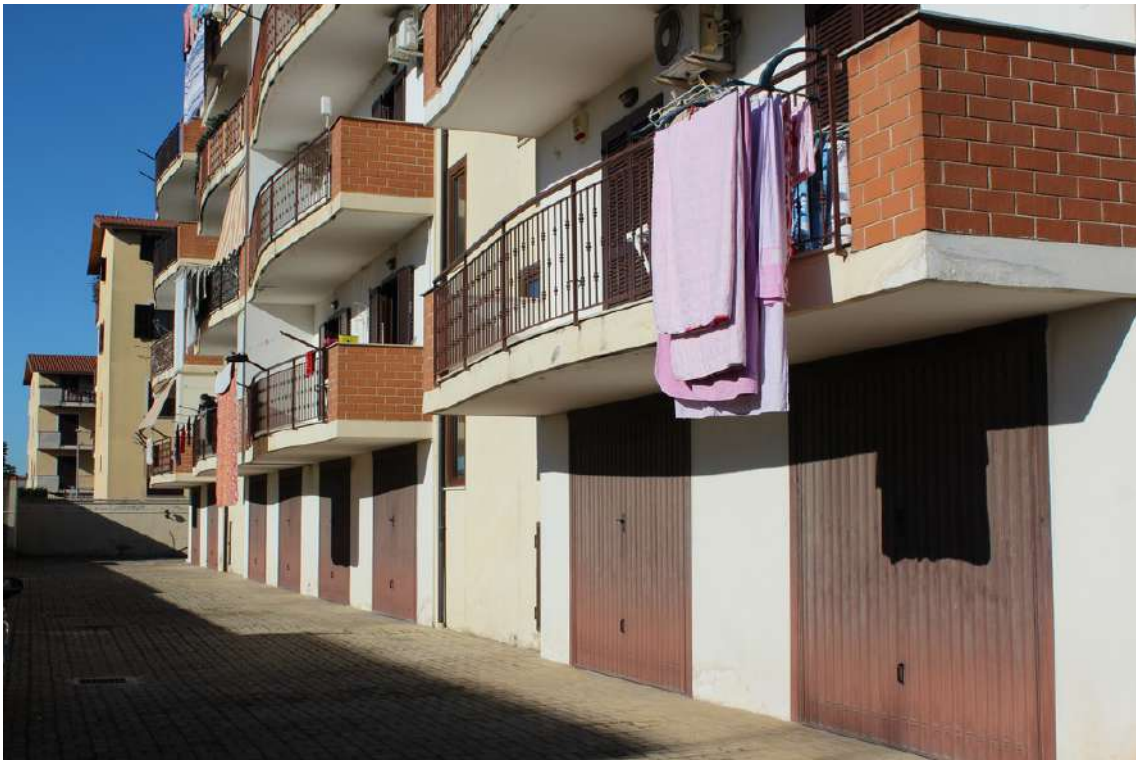
Foto 7: facciata sud dell'edificio A, con garages al piano terra.