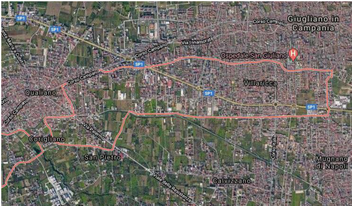
Foto 1: inquadramento territoriale del comune di Villaricca (Na).