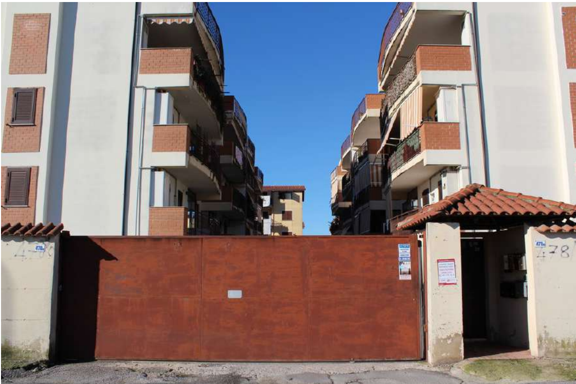
Foto 4: cancelli pedonale e carrabile di accesso al civico n° 478/O.