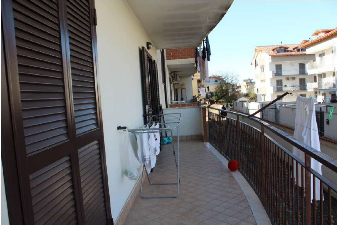
Foto 55: balconi del living e della camera da letto, esposti verso nord.