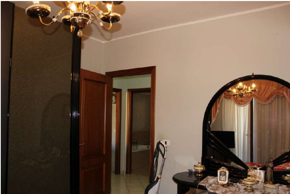
Foto 65: camera da letto padronale con accesso dal disimpegno della zona notte.