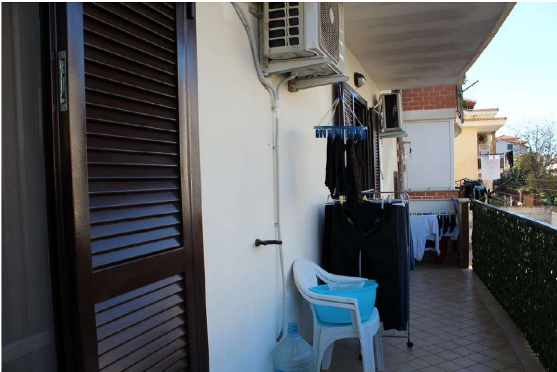
Foto 83: balconi del soggiorno e della camera da letto padronale, esposti verso nord.