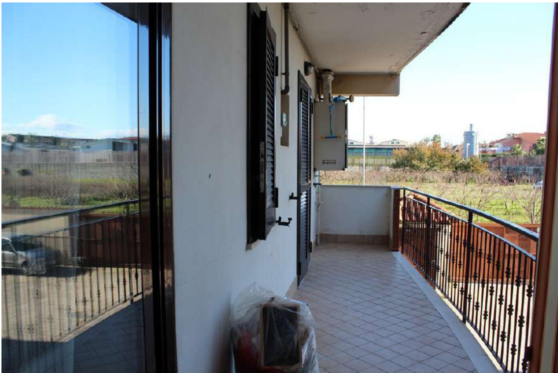
Foto 54: balconi e finestra del bagno esposti verso il cortile centrale del parco.