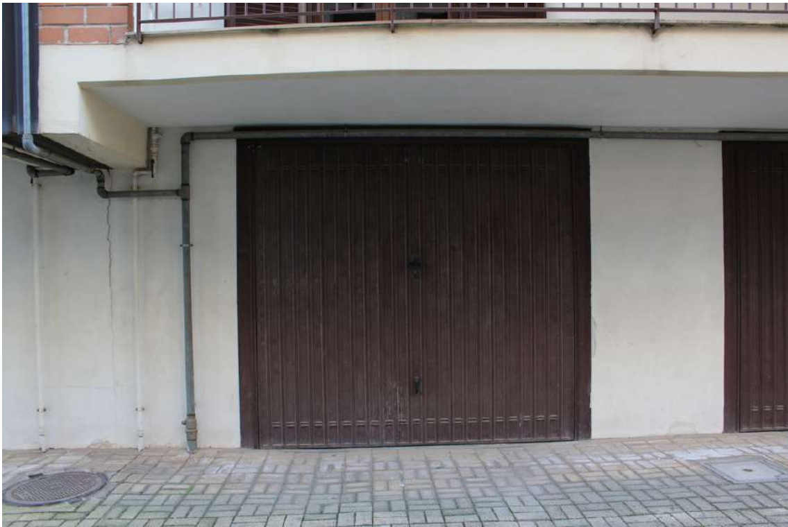
Foto 27: garage al piano terra dell'edificio B con accesso sul lato nord, di sub. 54.