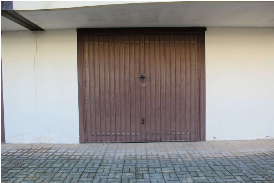
Foto 25: garage al piano terra dell'edificio B con accesso sul lato nord, di sub. 40.