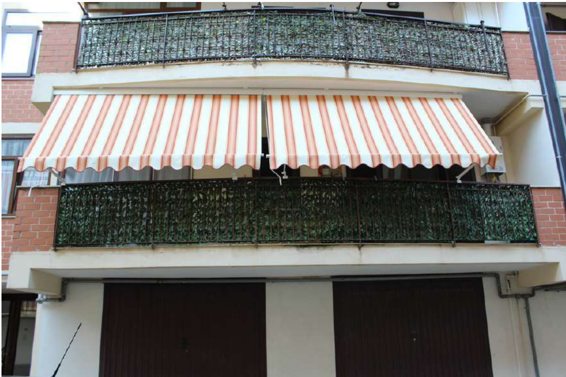
Foto 17: balcone esposto sul cortile centrale dell'appartamento al primo piano sub. 63.