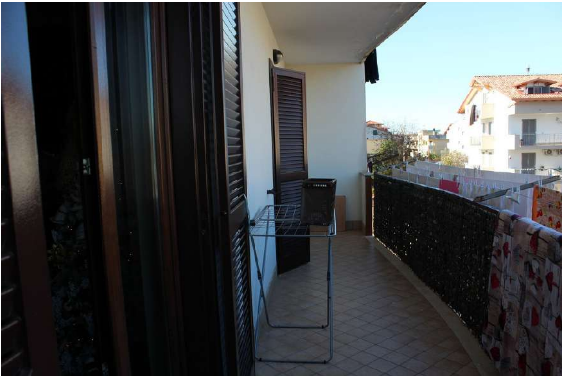
Foto 63: balconi del living e della camera da letto padronale esposti a nord.