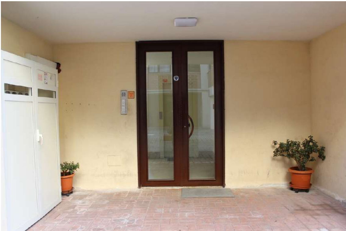
Foto 11: portone del vano scala B dell'edificio A, con accesso dal cortile centrale.