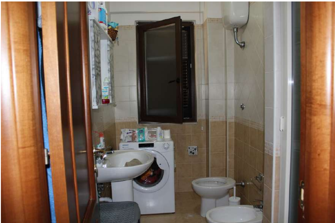
Foto 60: bagno di servizio, con vano doccia in muratura e finestra esposta ad est.