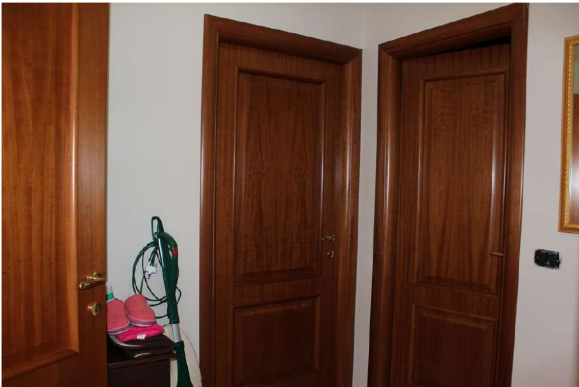
Foto 36: disimpegno della zona notte, composta da due camere e due bagni.