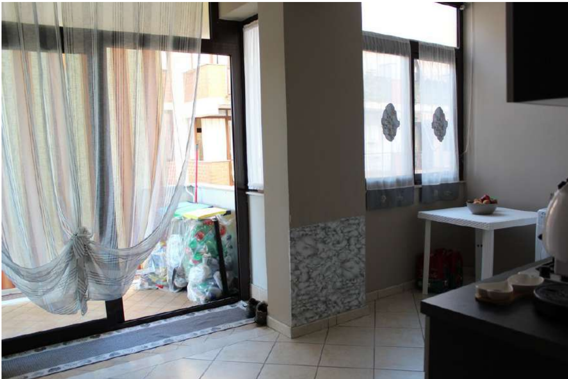
Foto 53: ambiente con veranda, ricavato sul balcone esposto verso il cortile centrale.