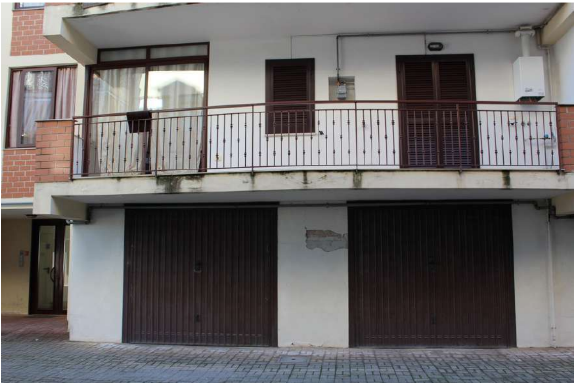
Foto 10: balcone esposto sul cortile centrale dell'appartamento al primo piano di sub. 15.