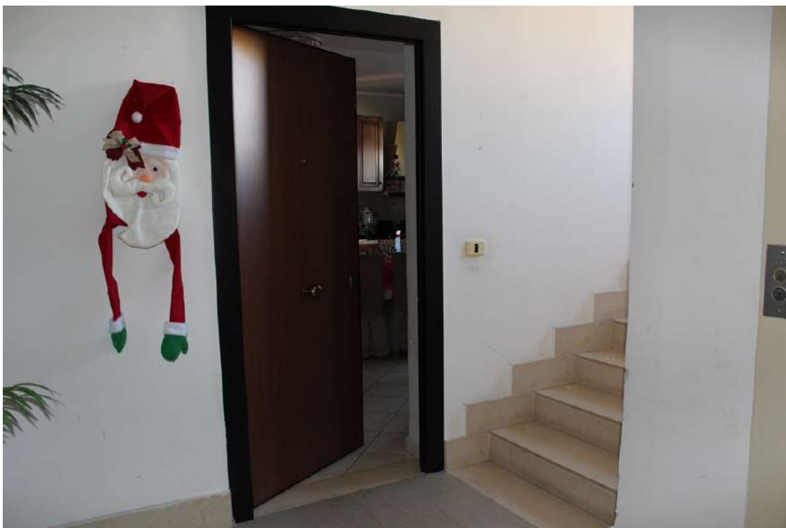
Foto 61: accesso all'appartamento al secondo piano della scala C nell'edificio B, sub. 49.