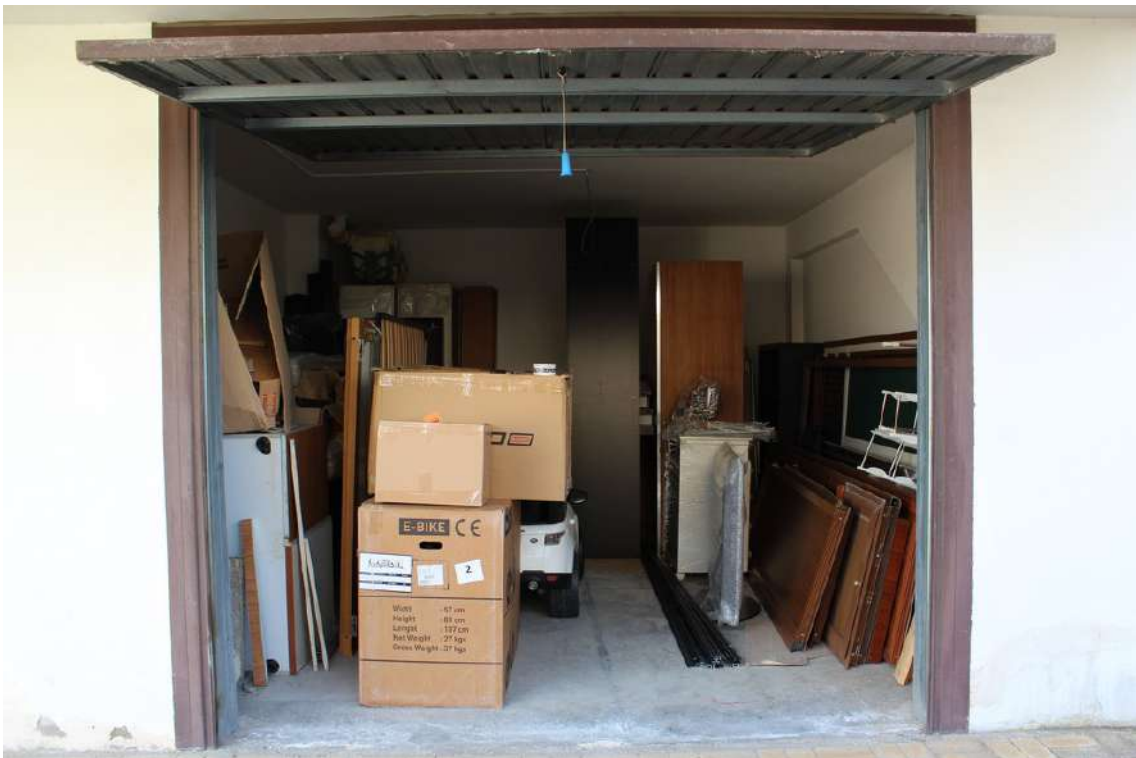
Foto 24: secondo garage proveniente dall'ingresso del parco, con serranda basculante.