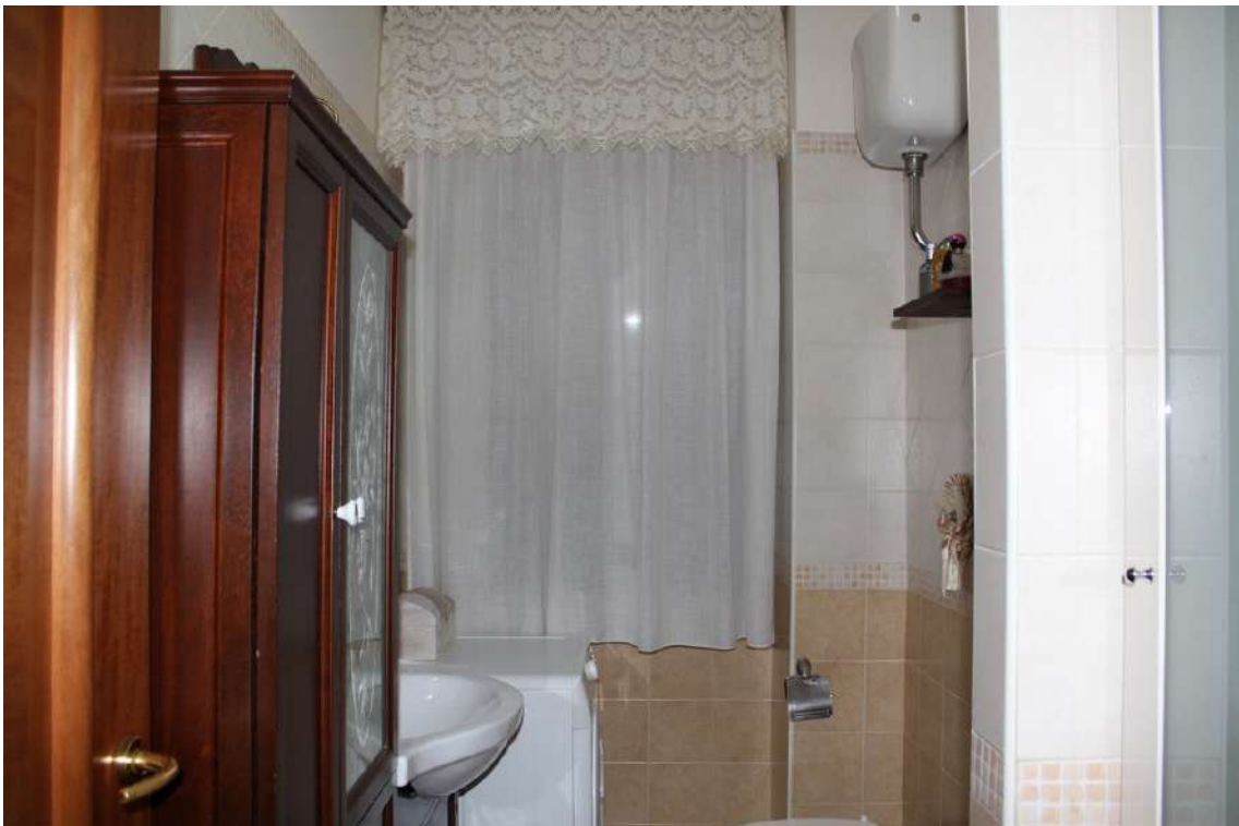
Foto 50: bagno di servizio, con vano doccia in muratura e finestra esposta ad ovest.