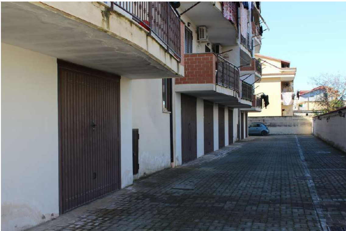
Foto 8: facciata nord dell'edificio B, con garages al piano terra.