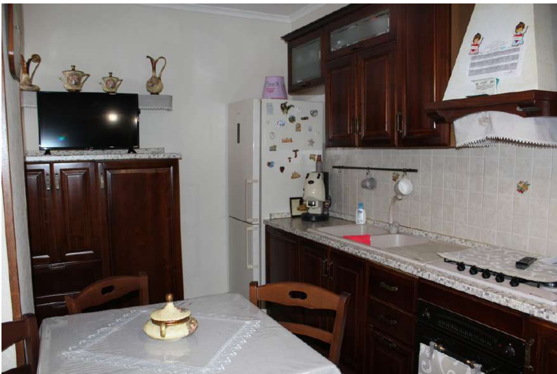
Foto 44: veranda adibita a cucina, ricavata sul balcone esposto verso nord.