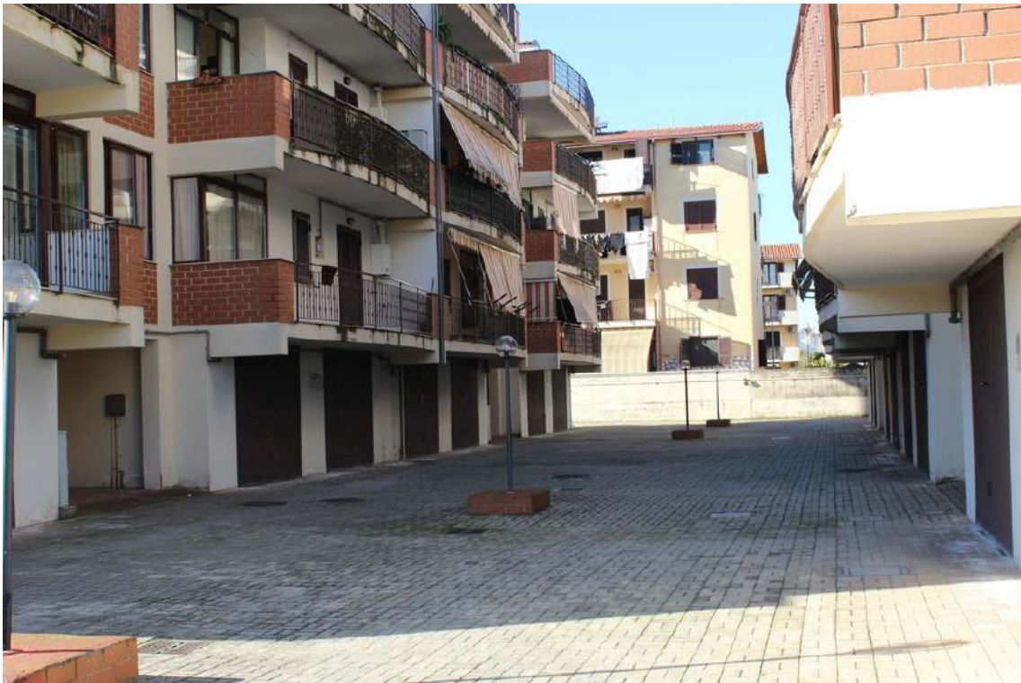
Foto 5: cortile centrale del Parco Susanna, con a sx edificio A ed a dx edificio B.