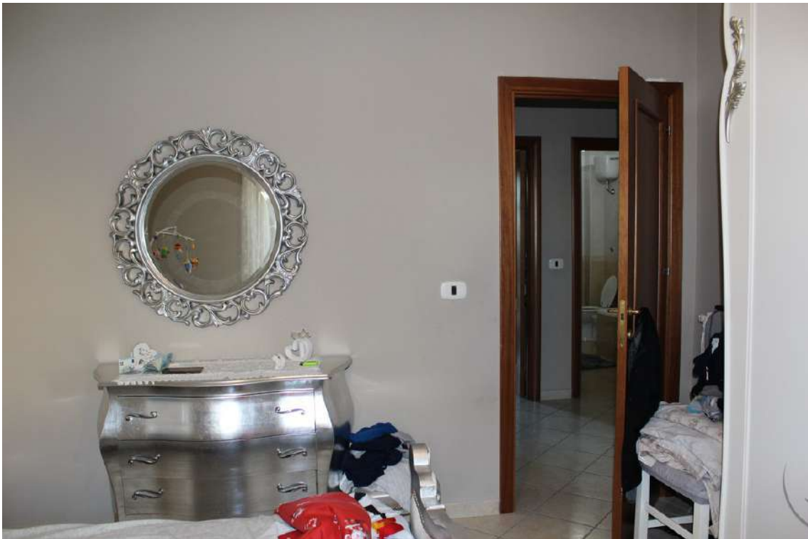
Foto 57: camera da letto padronale, con accesso dal disimpegno della zona notte.