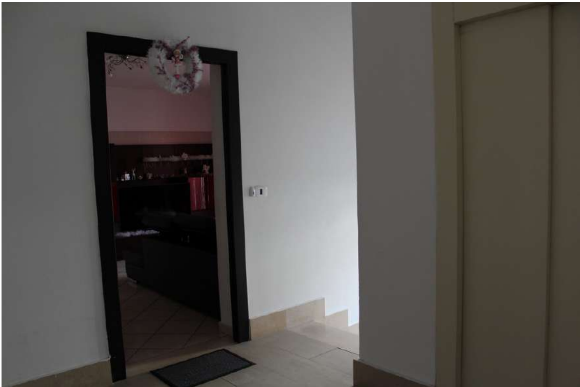
Foto 69: accesso all'appartamento al primo piano della scala D nell'edificio B, sub. 62.