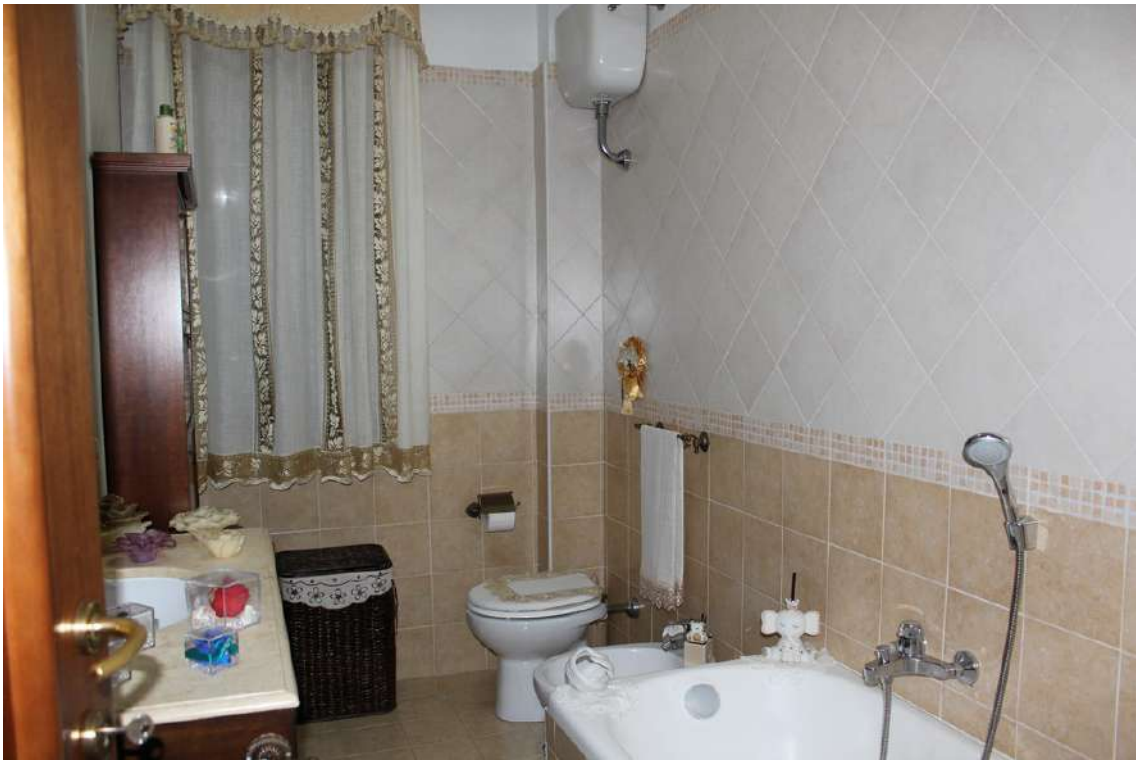
Foto 49: bagno principale dotato di vasca e con finestra esposta verso nord.