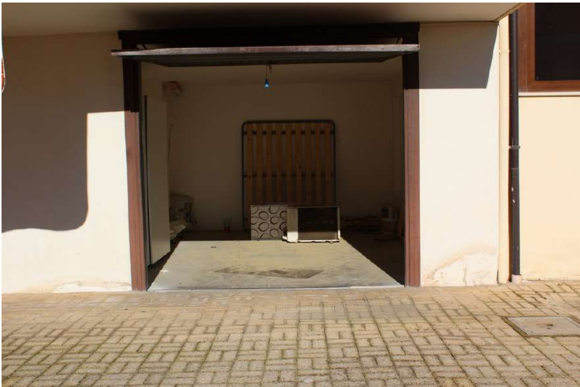
Foto 20: terzo garage provenendo dall'ingresso del parco, con serranda basculante.