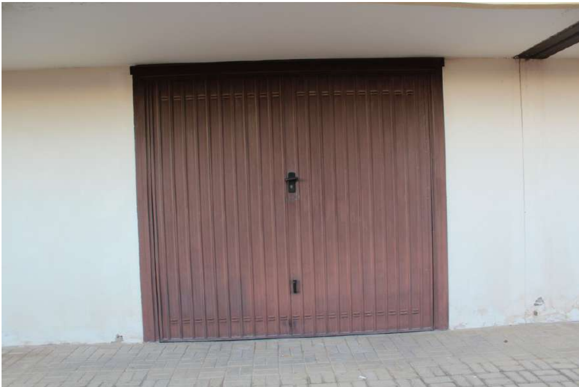
Foto 21: garage al piano terra dell'edificio A con accesso sul lato sud, di sub. 22.