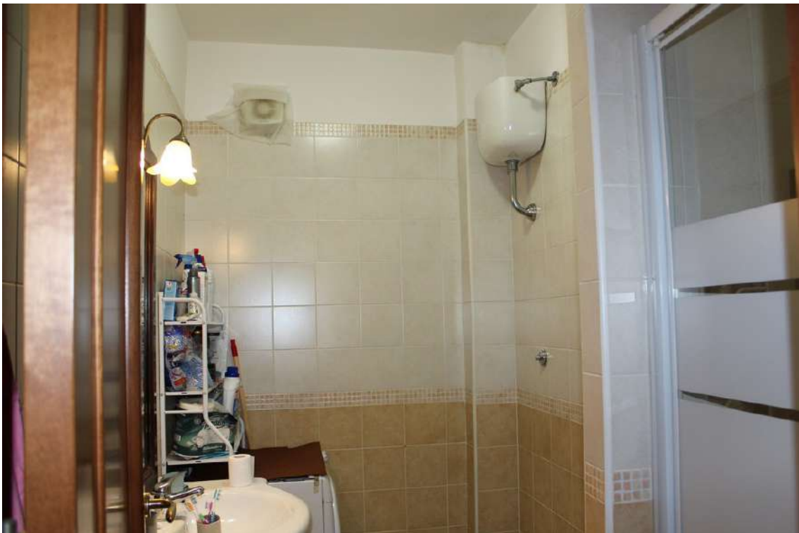
Foto 40: bagno di servizio, con vano doccia in muratura ed impianto di aspirazione.