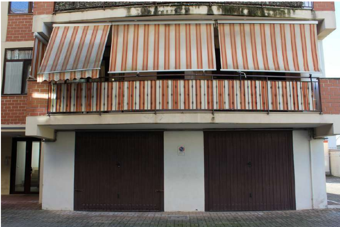
Foto 12: balcone esposto sul cortile centrale dell'appartamento al primo piano sub. 30.