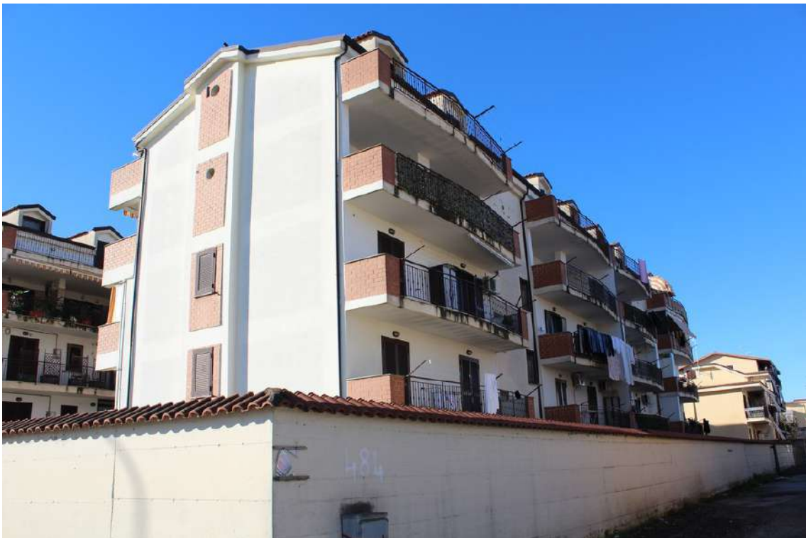
Foto 6: facciate est e nord dell'edificio B, di cinque piani fuori terra, con muro di cinta.