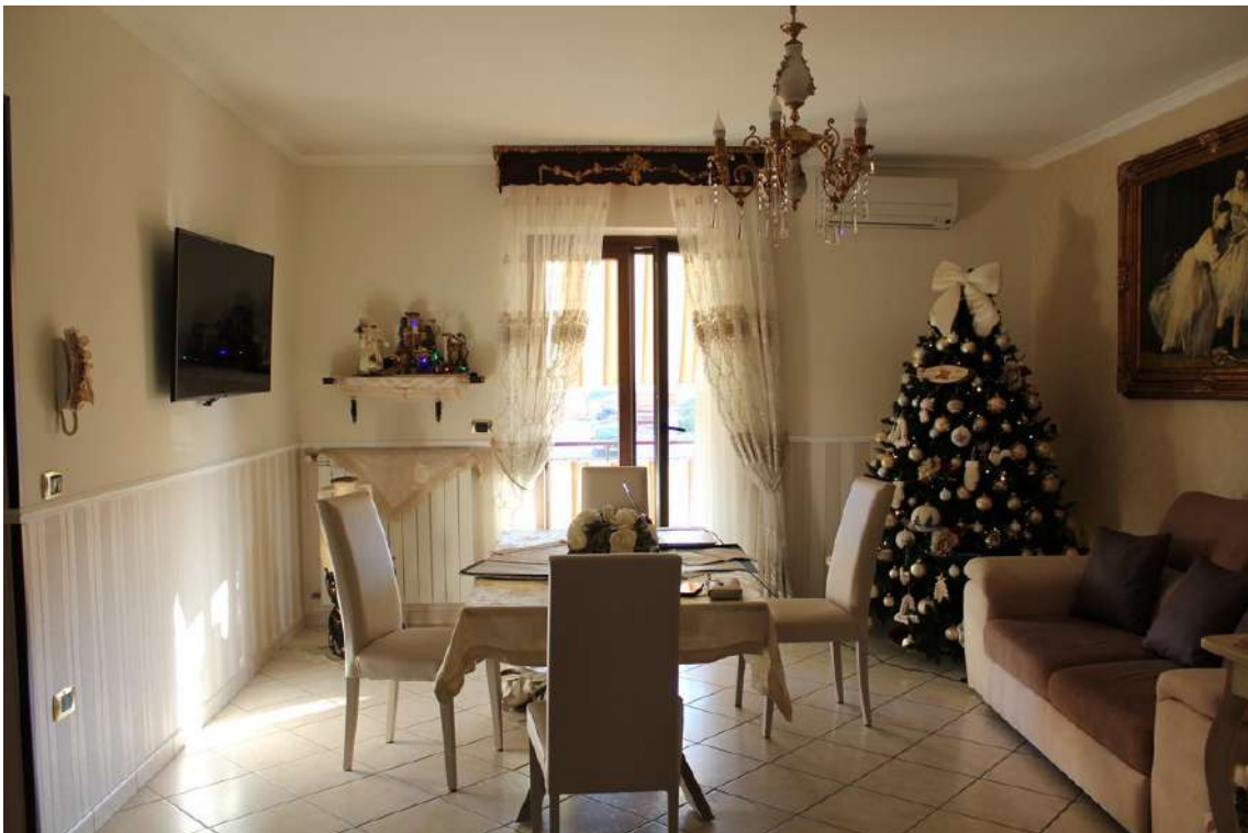
Foto 42: ingresso diretto nel soggiorno, con balcone esposto a sud.