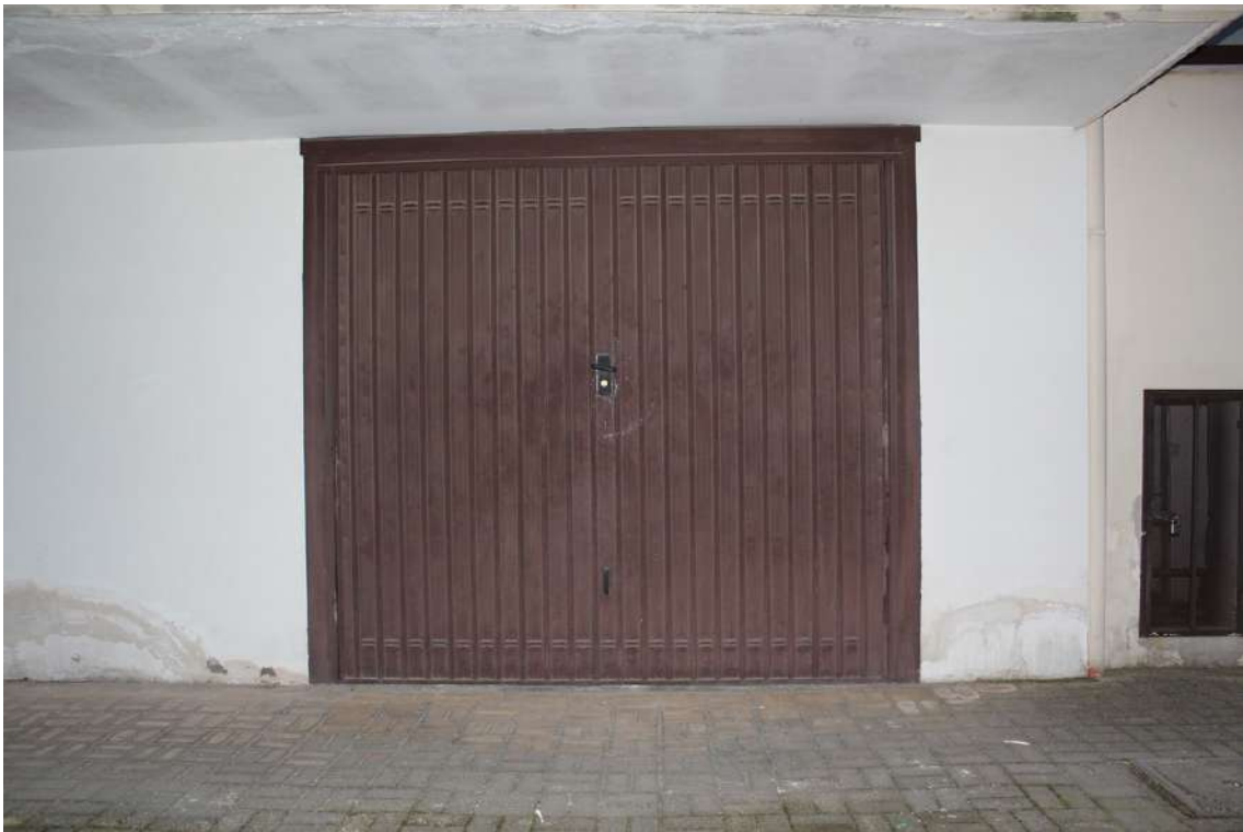
Foto 23: garage al piano terra dell'edificio B con accesso sul lato nord, di sub. 39.