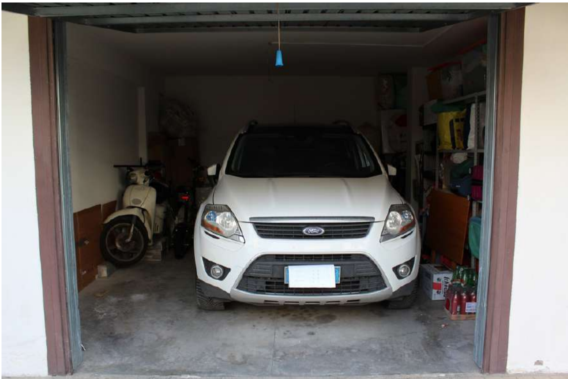
Foto 28: quinto garage proveniente dall'ingresso del parco, con serranda basculante.