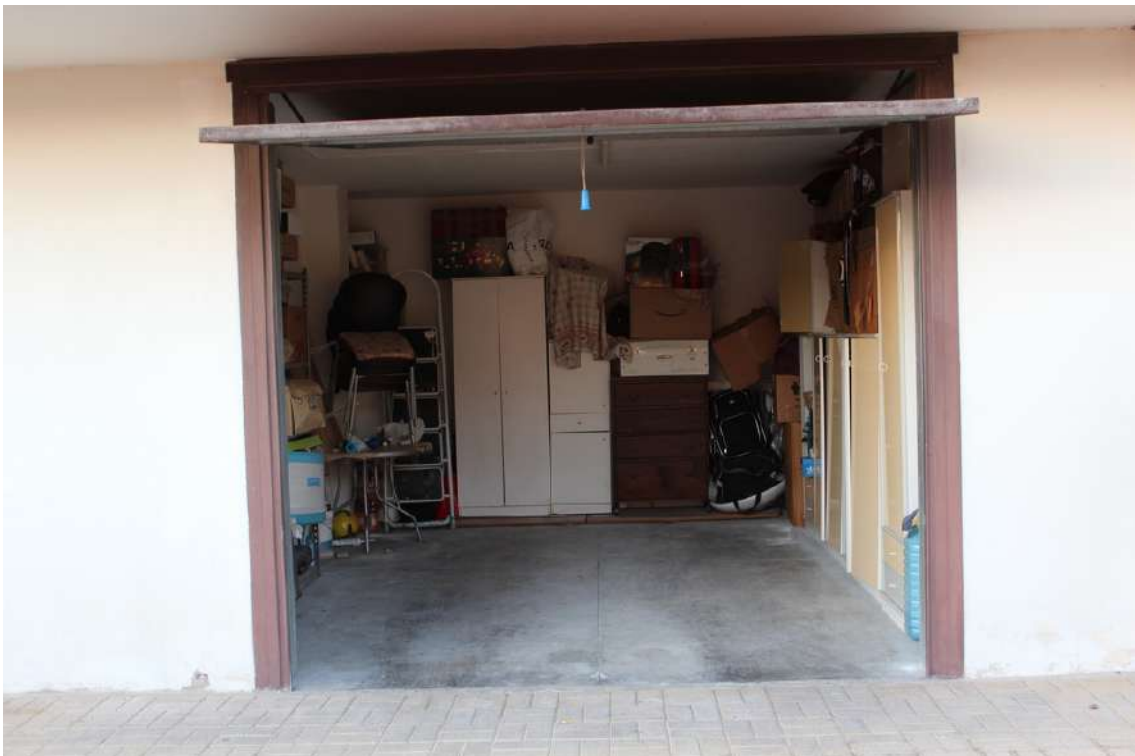
Foto 22: quinto garage proveniente dall'ingresso del parco, con serranda basculante.