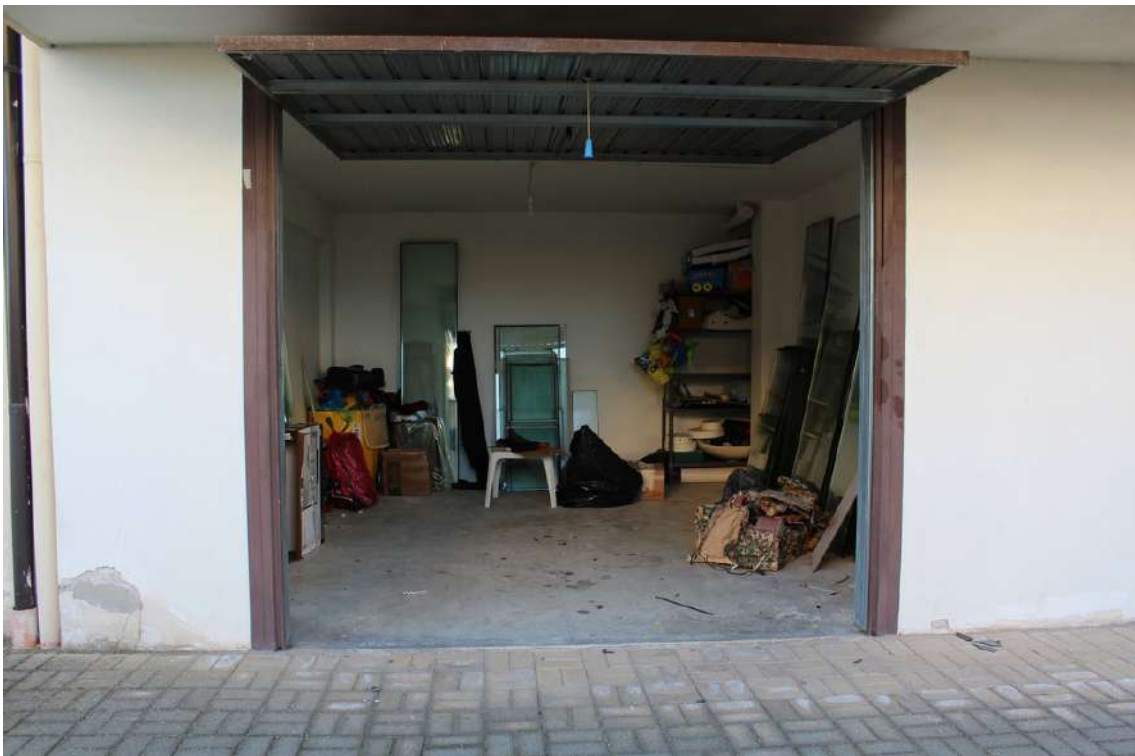
Foto 26: terzo garage proveniente dall'ingresso del parco, con serranda basculante.