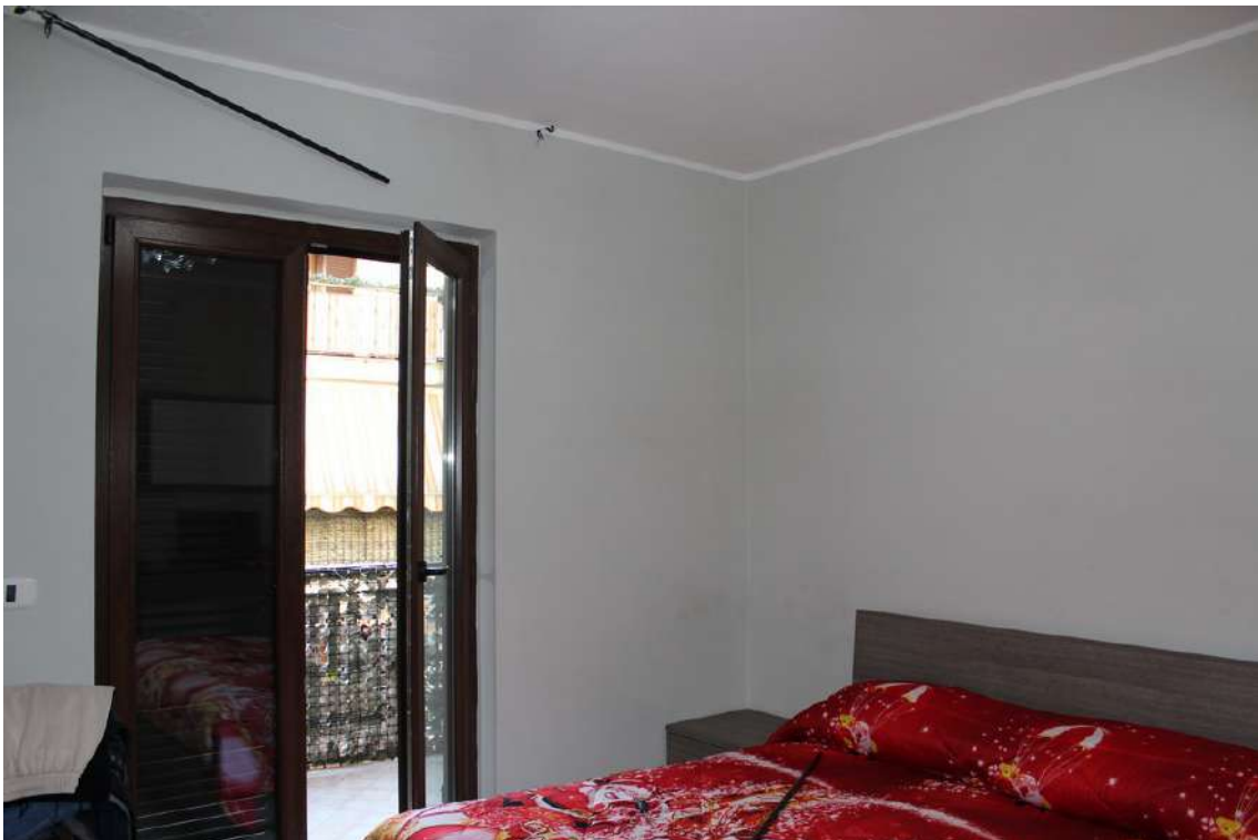
Foto 66: seconda camera con esposizione verso il cortile centrale del parco.