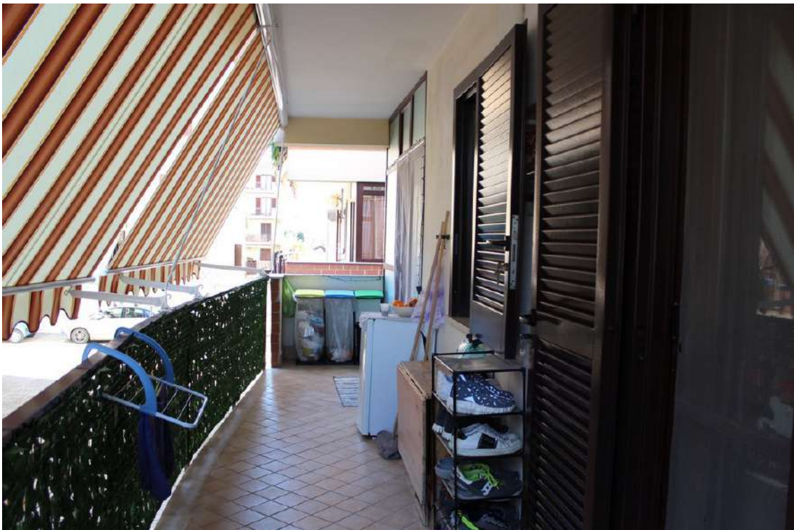
Foto 82: balconi e finestra del bagno esposti a sud, verso il cortile centrale del parco.