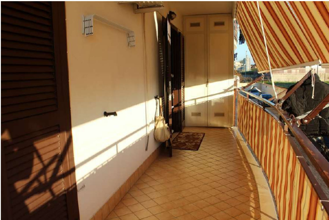
Foto 47: balconi della camera da letto padronale e del salone esposti verso sud.