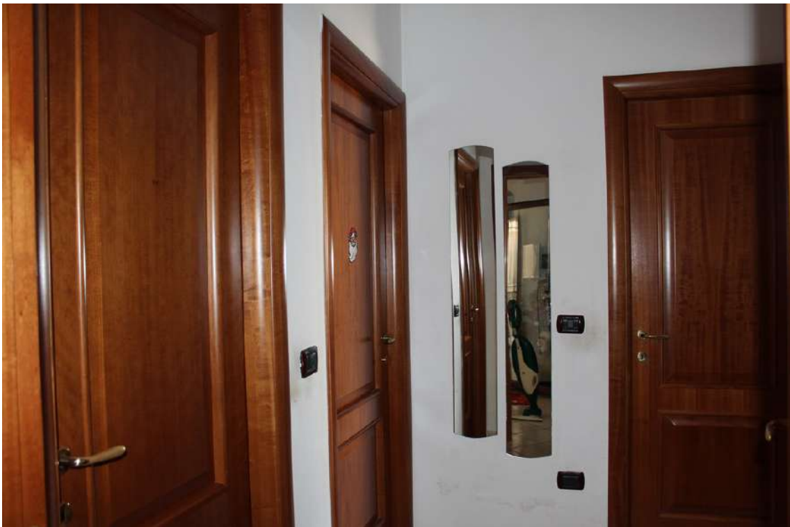
Foto 74: disimpegno della zona notte, composta da due camere e due bagni.