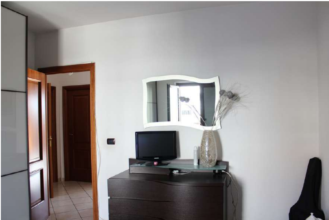
Foto 75: camera da letto padronale con accesso dal disimpegno della zona notte.