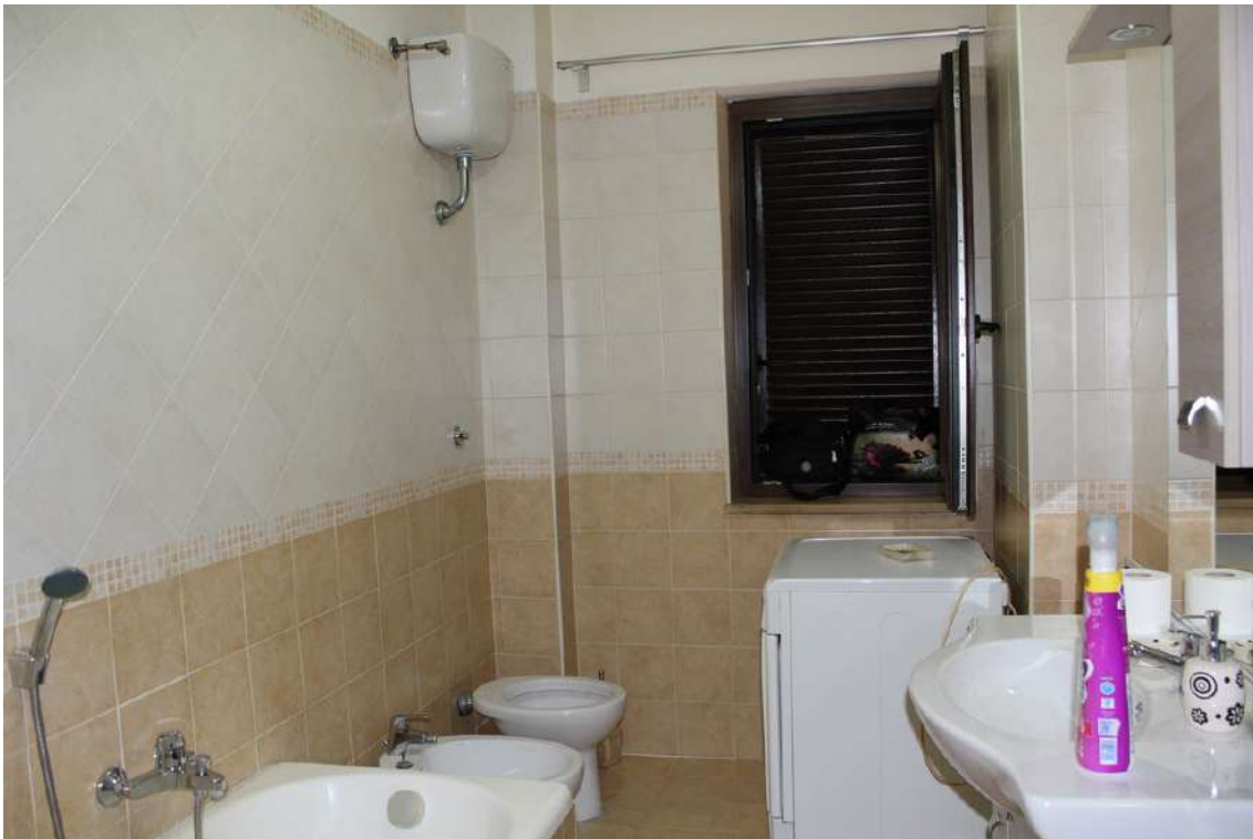
Foto 77: bagno principale dotato di vasca e con finestra esposta a sud.