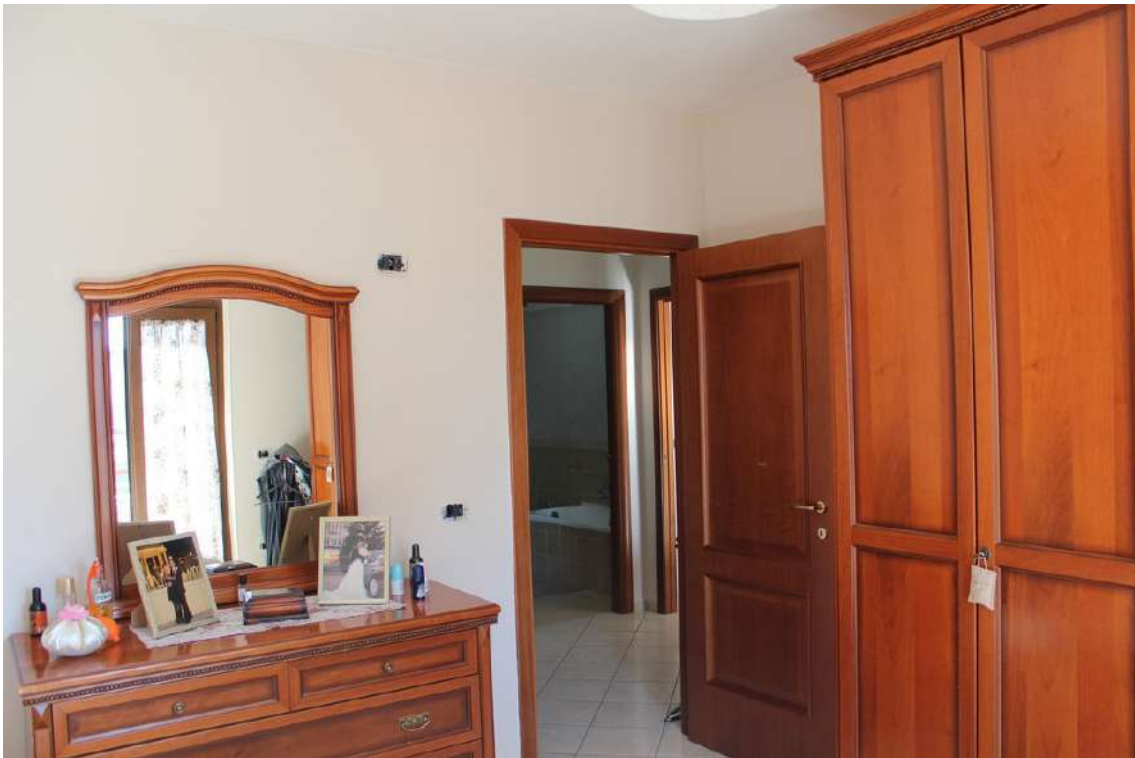
Foto 37: camera da letto padronale con accesso dal disimpegno della zona notte.