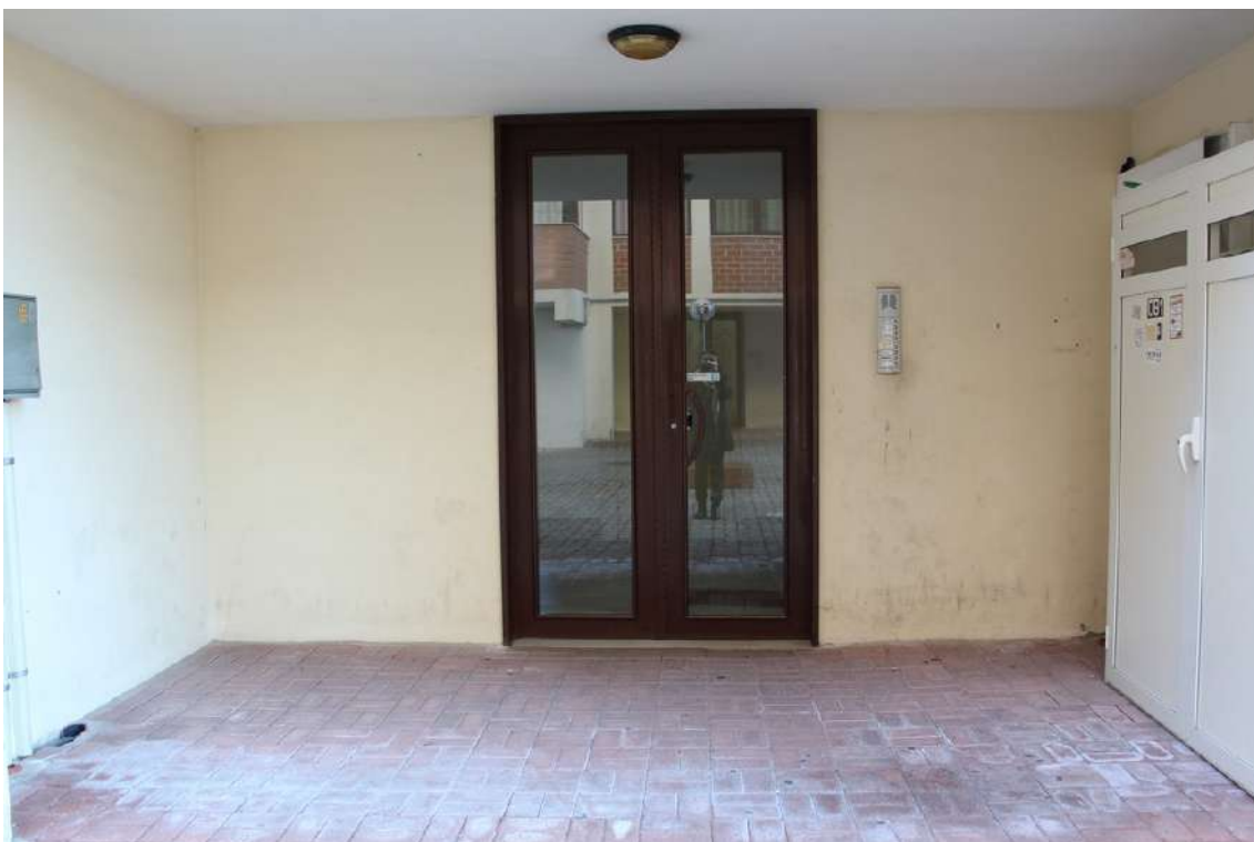
Foto 13: portone del vano scala C dell'edificio B, con accesso dal cortile centrale.