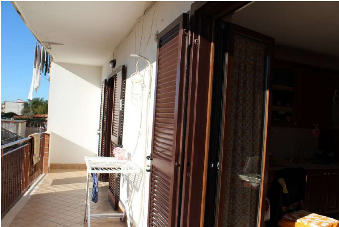
Foto 35: balconi del living e della camera da letto, esposti verso sud.