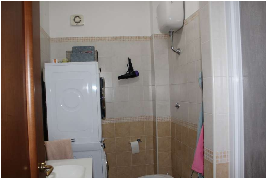
Foto 88: bagno di servizio, con vano doccia in muratura e impianto di aspirazione.