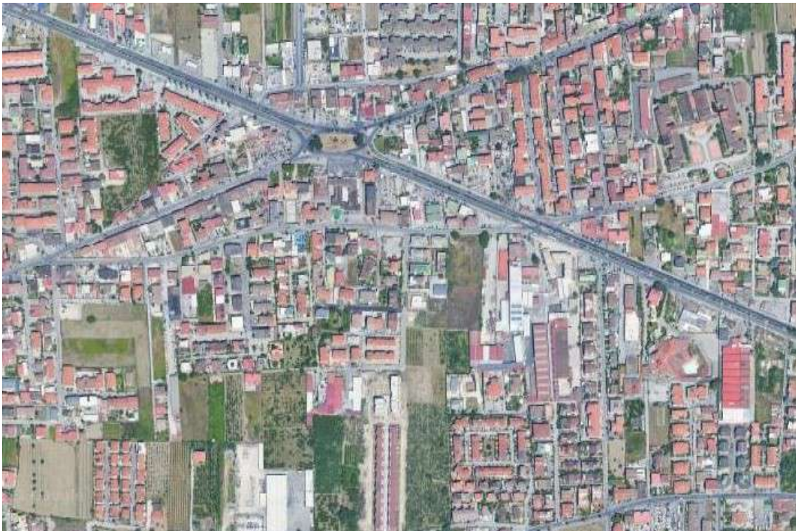
Foto 2: zona semi centrale, sviluppata lungo l'asse viaria di via Della Libertà.