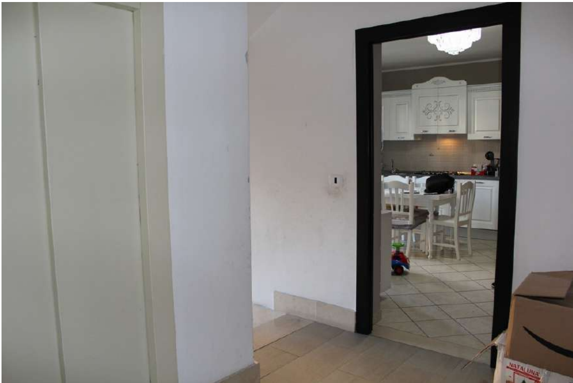
Foto 51: accesso all'appartamento al primo piano della scala C nell'edificio B, sub. 46.