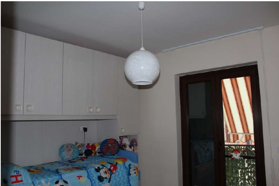
Foto 86: seconda camera con esposizione verso il cortile centrale del parco.