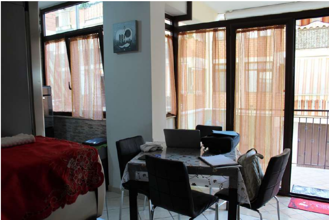
Foto 71: cucina nella veranda, ricavata sul balcone esposto verso il cortile centrale.