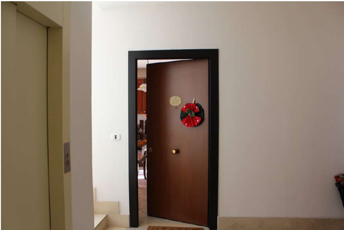
Foto 31: accesso all'appartamento al primo piano della scala A dell'edificio A, sub. 15.