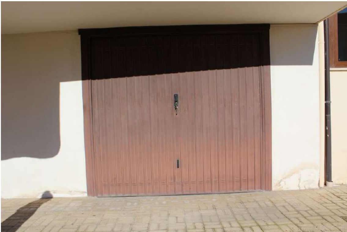
Foto 19: garage al piano terra dell'edificio A con accesso sul lato sud, di sub. 8.