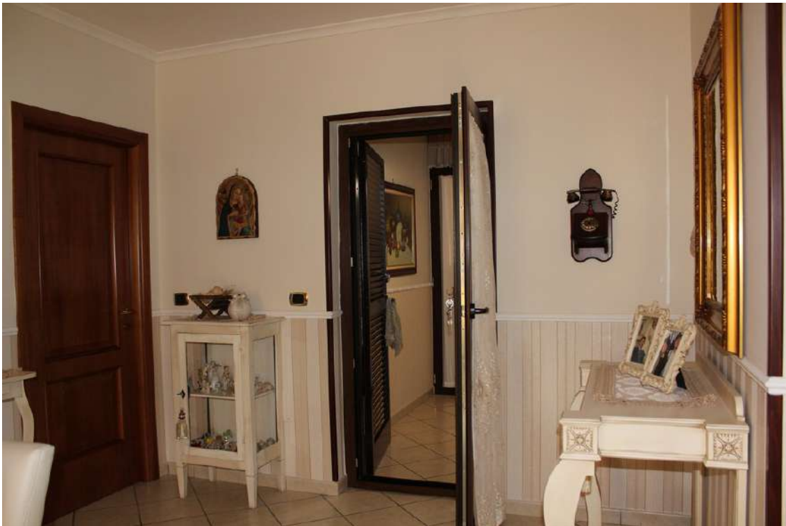
Foto 43: lato del salone collegato al disimpegno ed alla veranda.