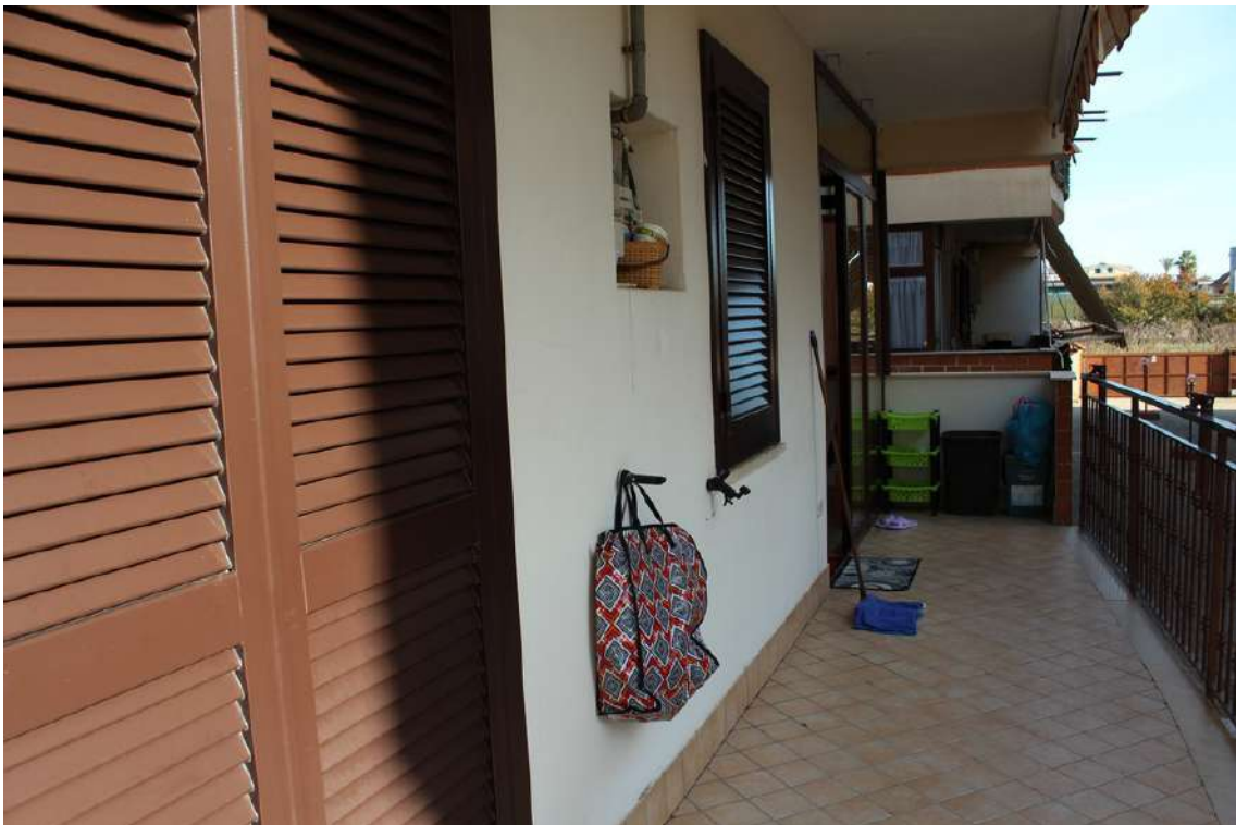
Foto 72: balconi e finestra del bagno esposti verso il cortile centrale del parco.