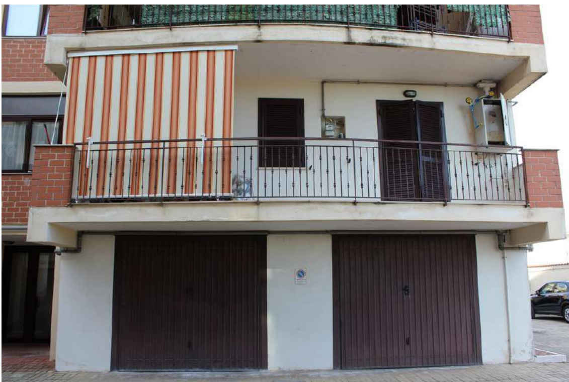
Foto 14: balcone esposto sul cortile centrale dell'appartamento al primo piano sub. 46.