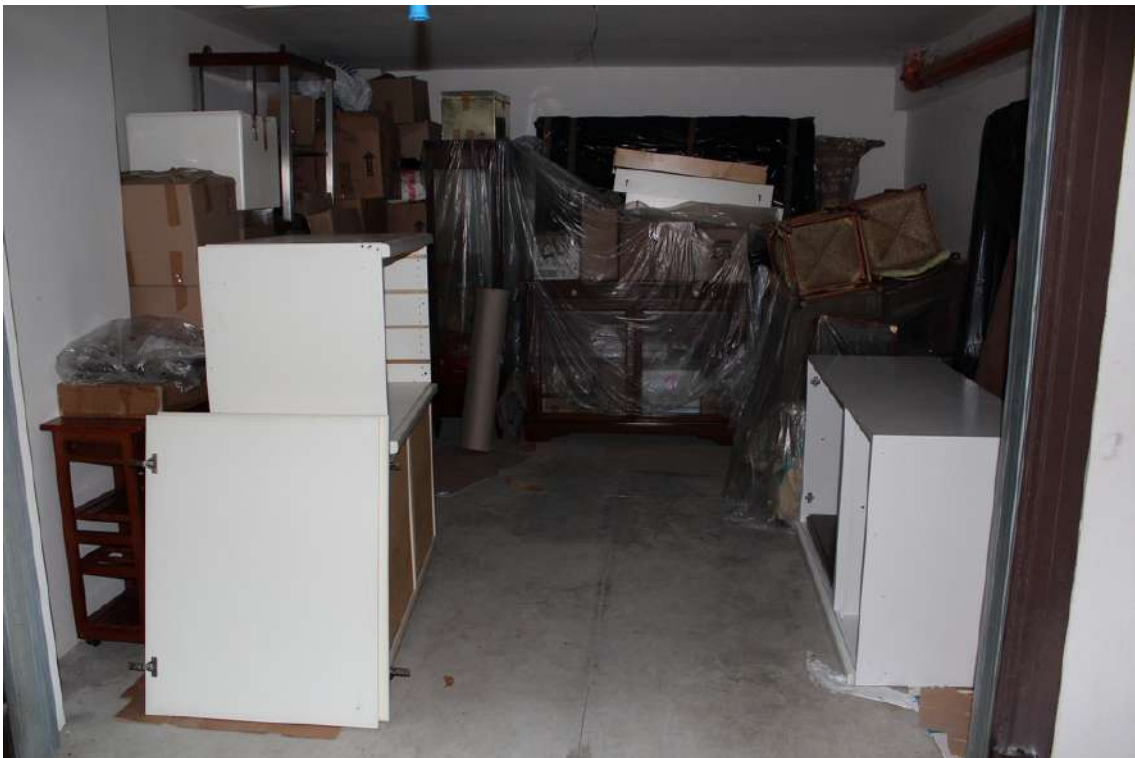
Foto 30: quinto garage proveniente dall'ingresso del parco, con serranda basculante.