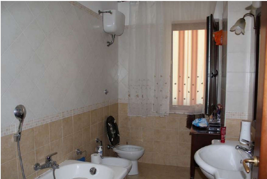
Foto 67: bagno principale, con vasca e finestra esposta verso sud.