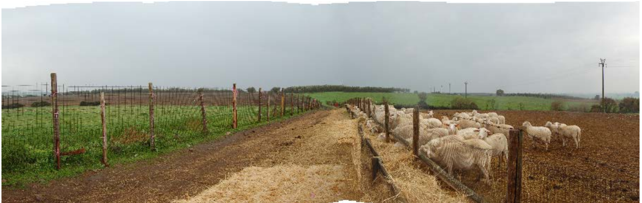
Foto 46 - Strada vicinale che divide i due appezzamenti di terreno