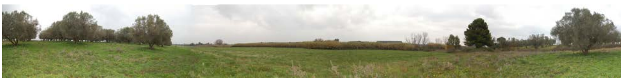
Foto 39 - Panoramica dei terreni che costituiscono il compendio pignorato