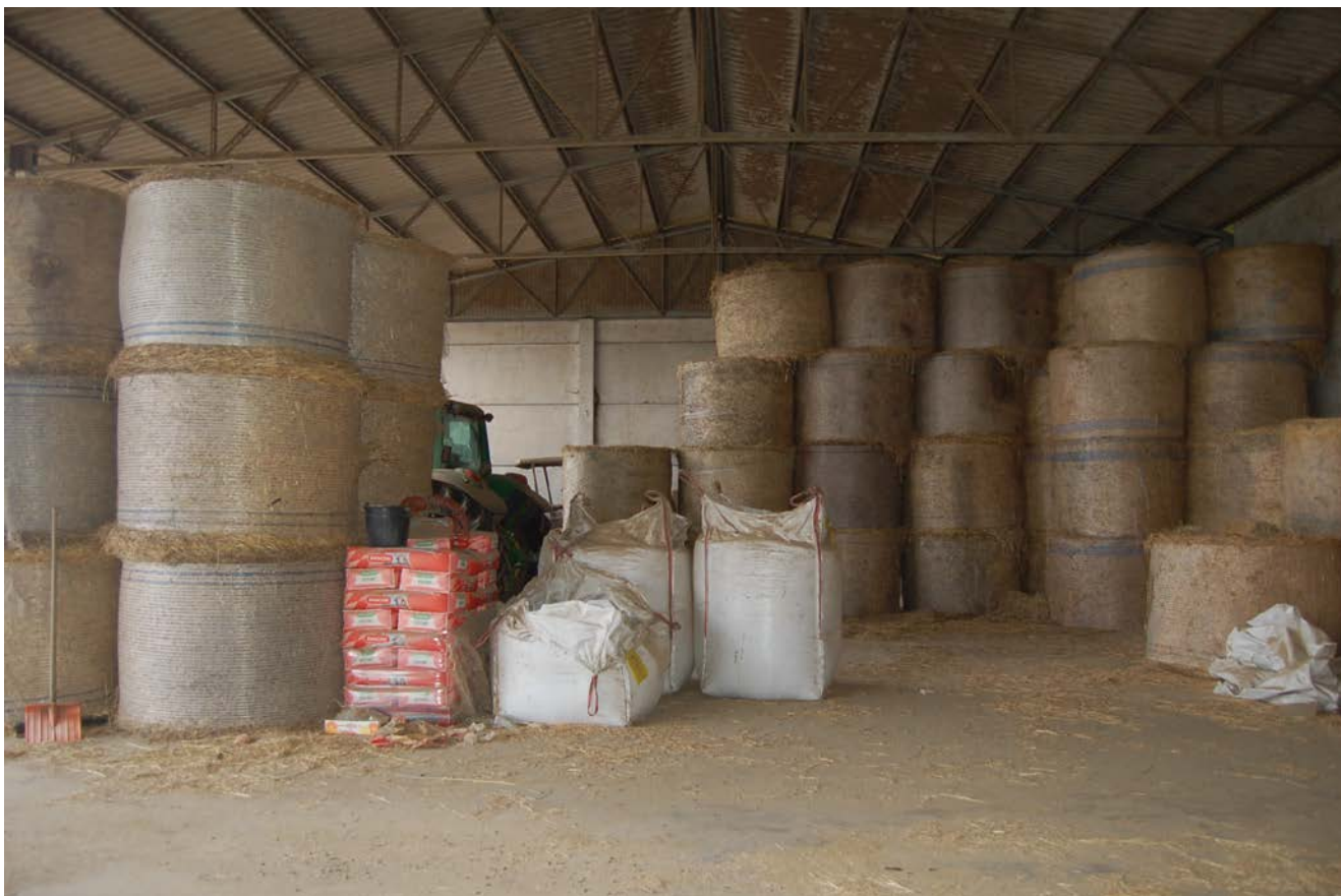
Foto 9– Vista interna del capannone prefabbricato con destinazione fienile –ricovero attrezzi