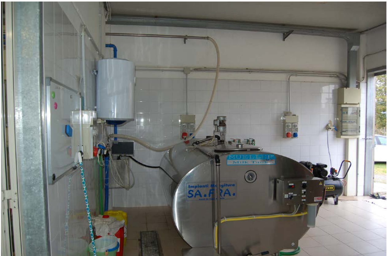
Foto 17 - Sala stoccaggio latte