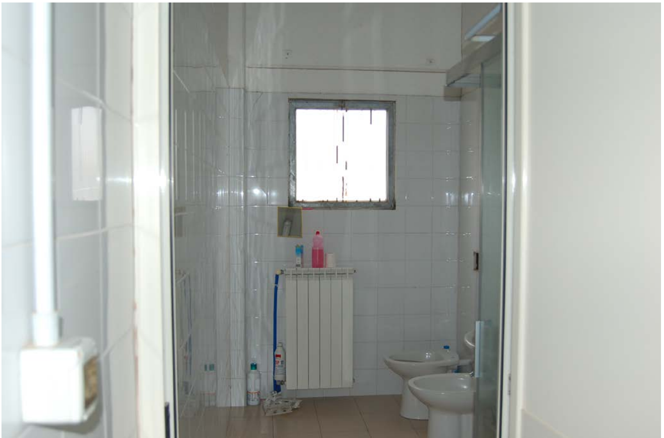
Foto 21 - Antibagno spogliatoio e bagno