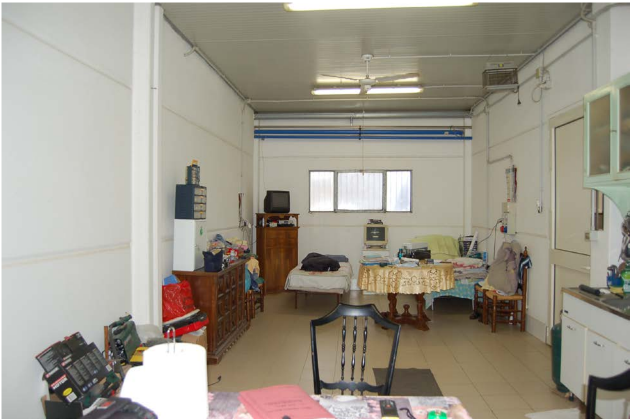
Foto 23 - Locali adibiti a cucina