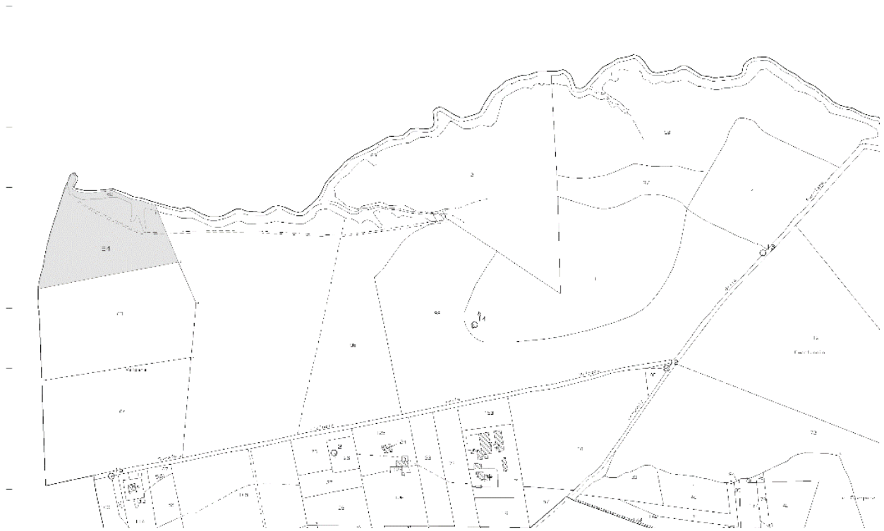
Figura 4 - Estratto di mappa foglio 240 con individuazione delle part.ile 53-62

Direzione Provinciale di Viterbo - Ufficio Provinciale - Territoriale - Disegnata ADOLFO BRAY