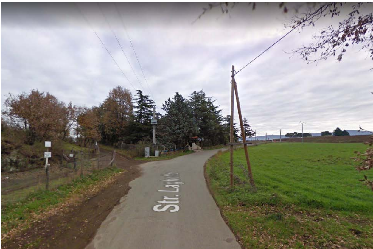
Foto 1- Bivio su Strada Laghetto per accedere alla strada sterrata d'accesso al compendio pignorato