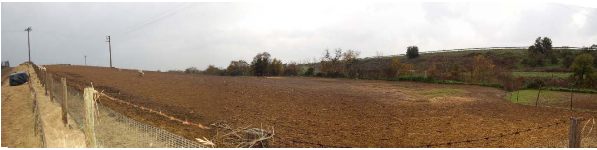
Foto 44 - Panoramica dei terreni che costituiscono il compendio pignorato