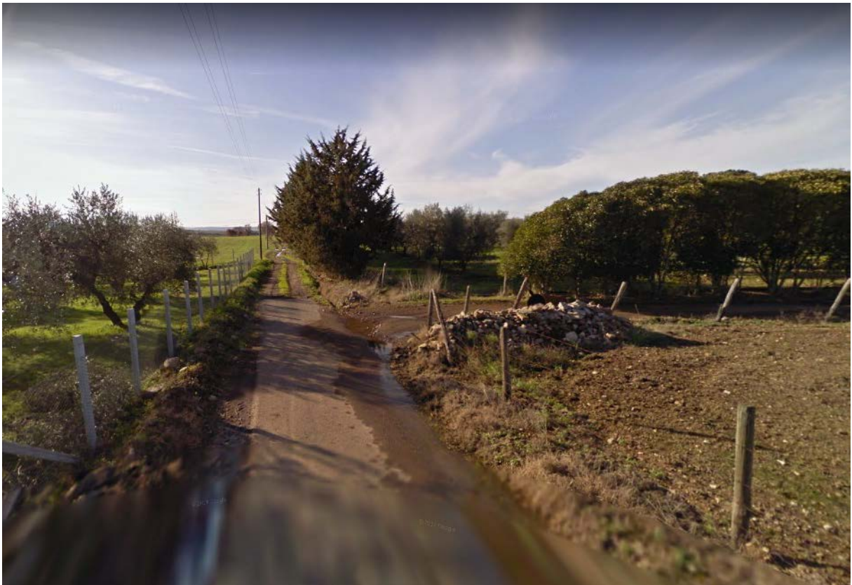
Foto 40 – Bivio su Strada vicinale Sterparelle per accedere alla strada sterrata d'accesso al compendio pignorato fg.239 e 240