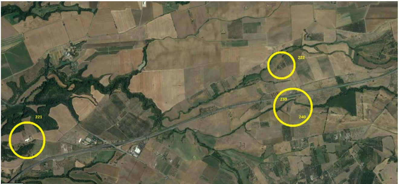
Figura 1 – Aerefogrammetria con localizzazione dei beni pignorati suddivisi per i diversi fogli