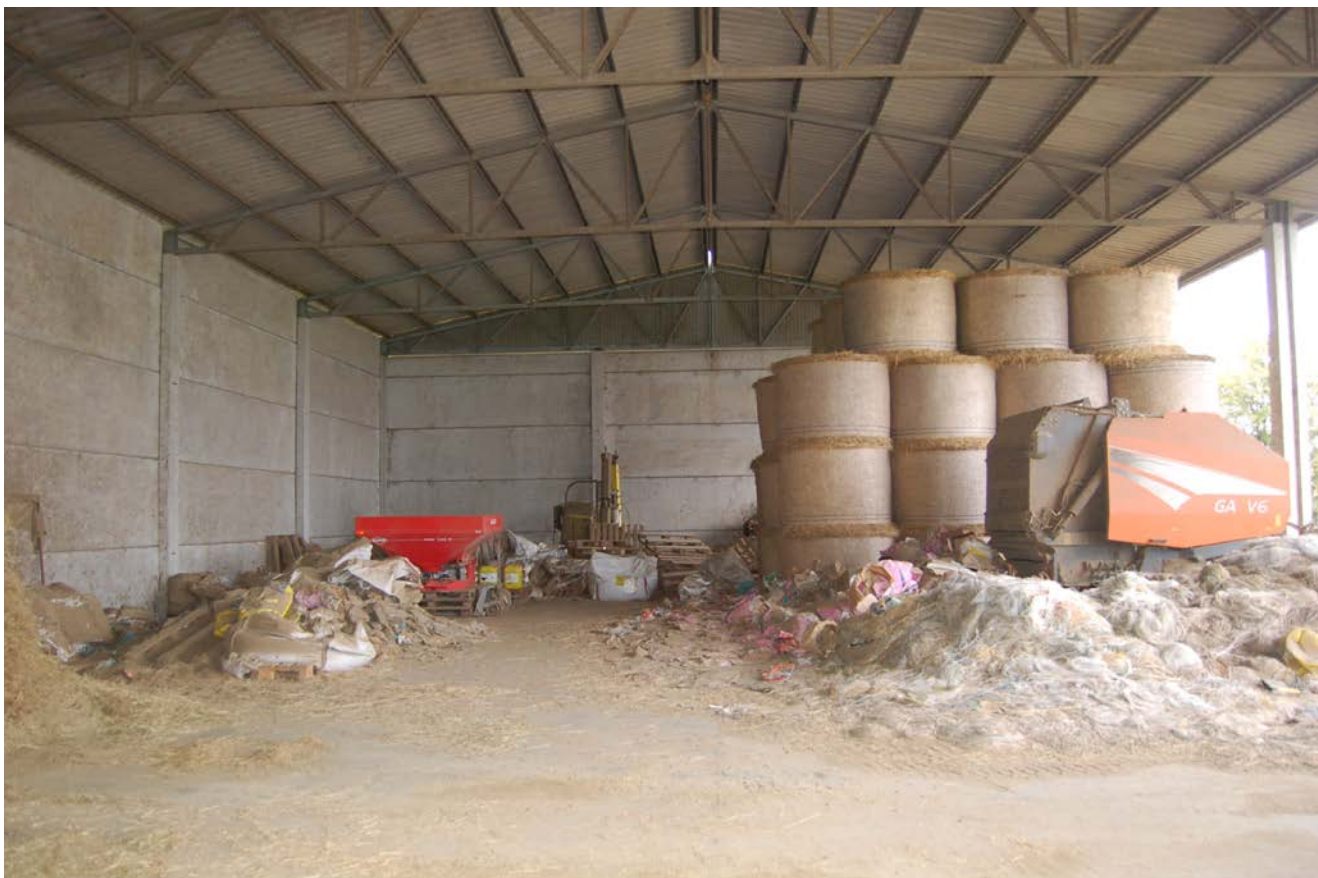
Foto 10 - Vista interna del capannone prefabbricato con destinazione fienile –ricovero attrezzi