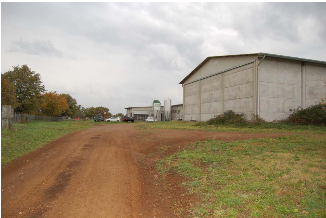
Foto 5 - Strada d'accesso al compendio pignorato