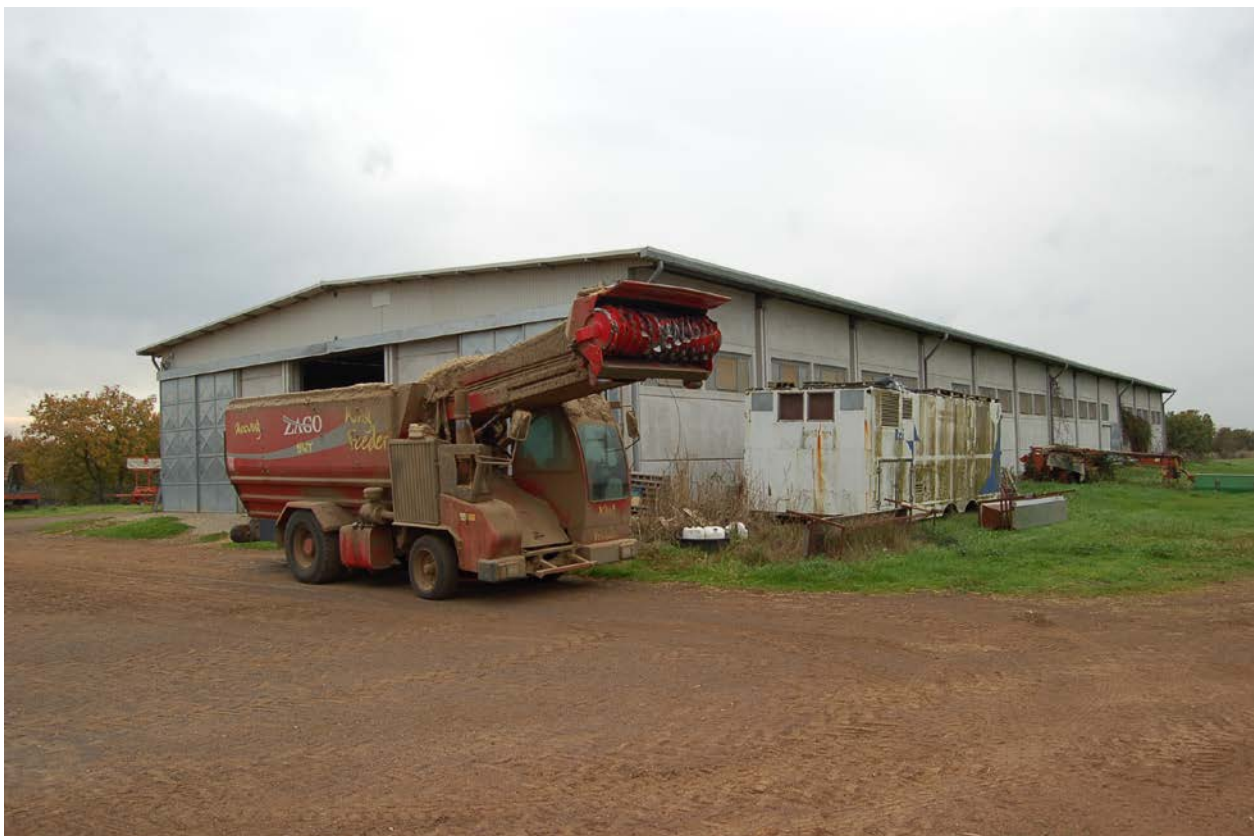
Foto 14 - Capannone prefabbricato con destinazione ovile-laboratorio