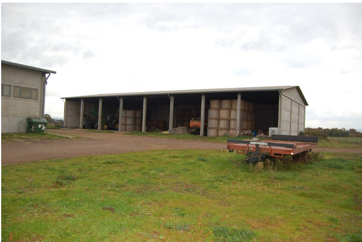
Foto 6 – Capannone prefabbricato con destinazione fienile –ricovero attrezzi