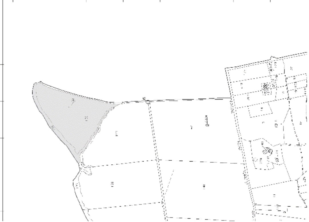
Figura 3_ Stralcio di Estratto di mappa foglio 239 con individuazione delle particelle

Direzione Provinciale di Viterbo Ufficio Provinciale - Territorio - Direttore ADOLFO