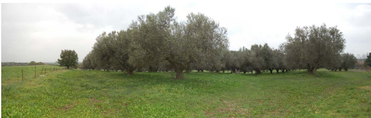
Foto 38 – Panoramica dei terreni che costituiscono il compendio pignorato