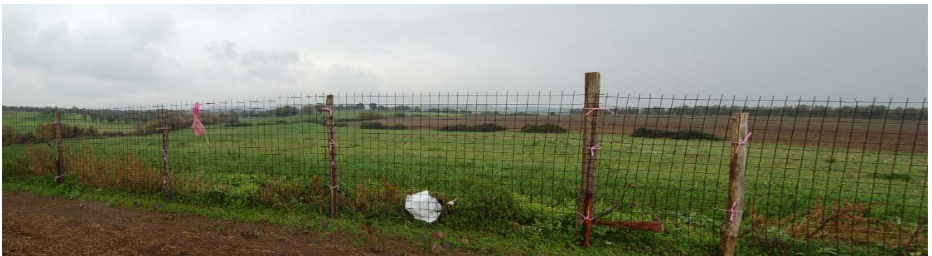
Foto 47 - Panoramica dei terreni che costituiscono il compendio pignorato