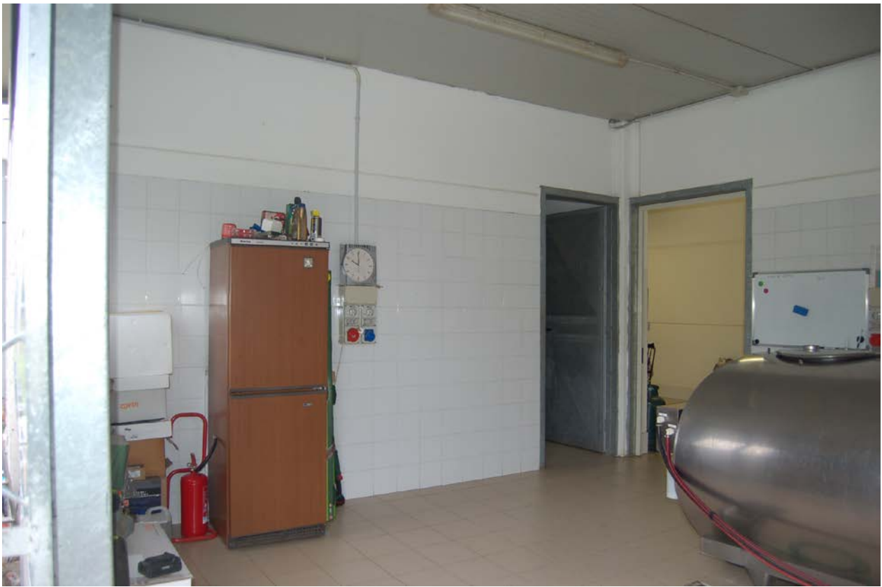
Foto 20 - Sala stoccaggio latte