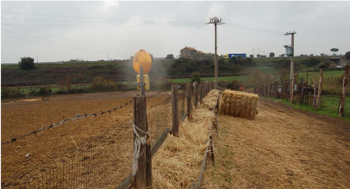
Foto 45 - Strada vicinale che divide i due appezzamenti di terreno