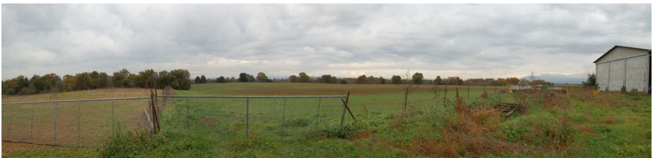
Foto 34 - Terreni limitrofi ai capannoni utilizzati per il pascolo