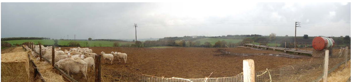
Foto 43 - Panoramica dei terreni che costituiscono il compendio pignorato