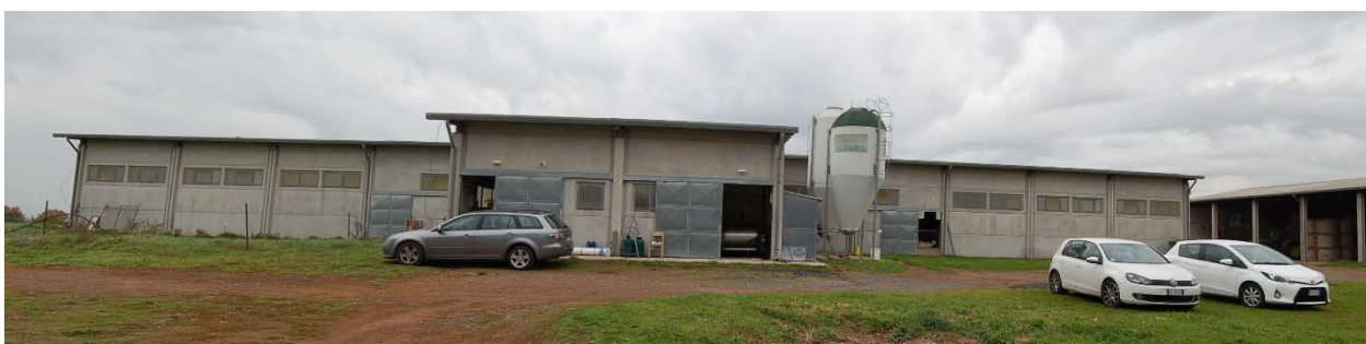
Foto 13 - Capannone prefabbricato con destinazione ovile-laboratorio