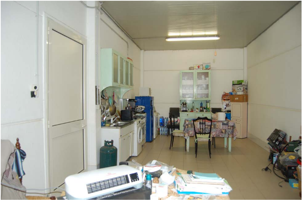
Foto 24 - Locali adibiti a cucina