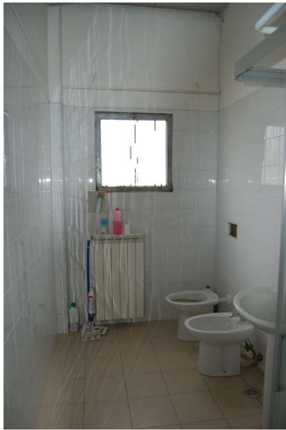
Foto 22 - Antibagno spogliatoio e bagno