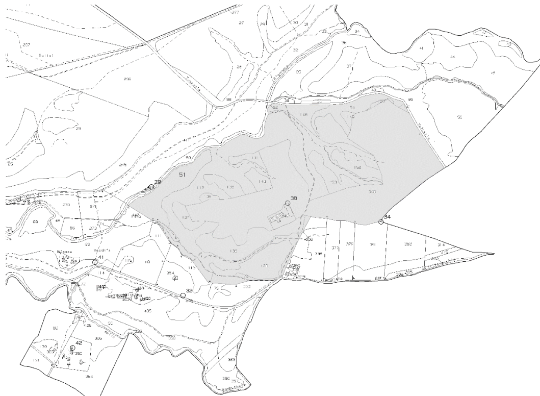
Figura 2- Stralcio di Estratto di mappa foglio 221 con individuazione delle particelle

Immobilie al N.C.T e N.C.E, U Fg. 221, part. 51-52-54-76-112-120-136-137-138-139-140-141-148-149-150-151-152-153-348-349 – 349 (fabbricato)