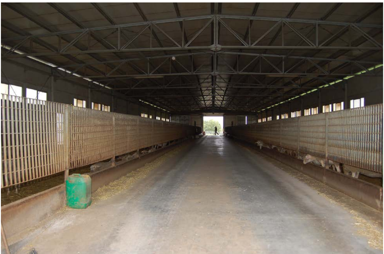
Foto 31 - Interno capannone prefabbricato adibito a stalla