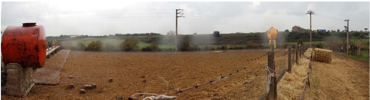
Foto 42 - Panoramica dei terreni che costituiscono il compendio pignorato