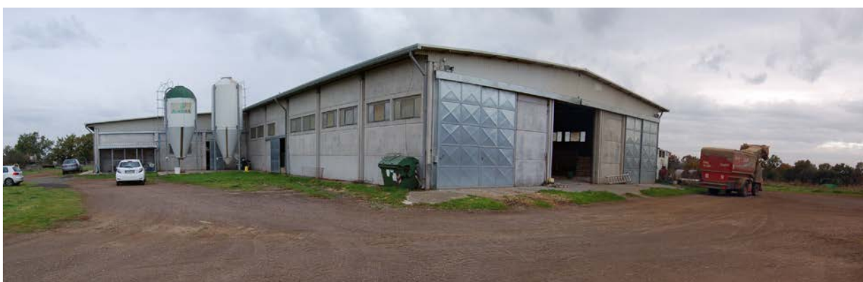
Foto 12 – Capannone prefabbricato con destinazione ovile-laboratorio