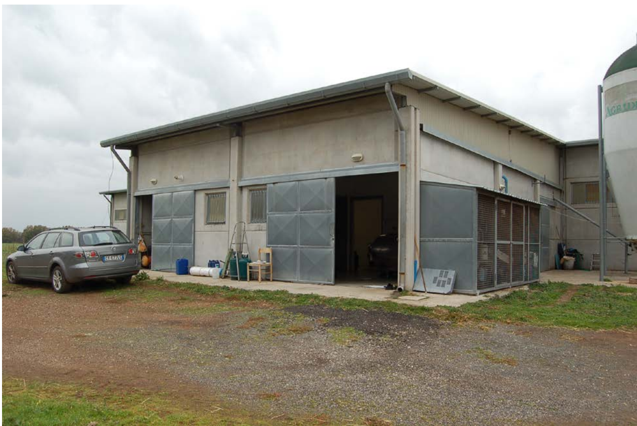
Foto 15 - Porzione di capannone prefabbricato con destinazione laboratorio