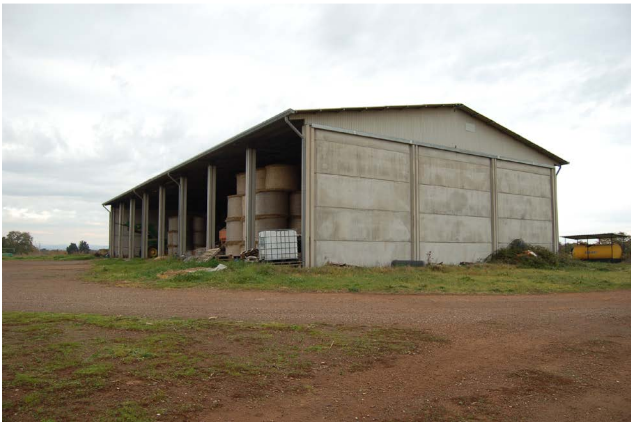
Foto 7- Capannone prefabbricato con destinazione fienile –ricovero attrezzi