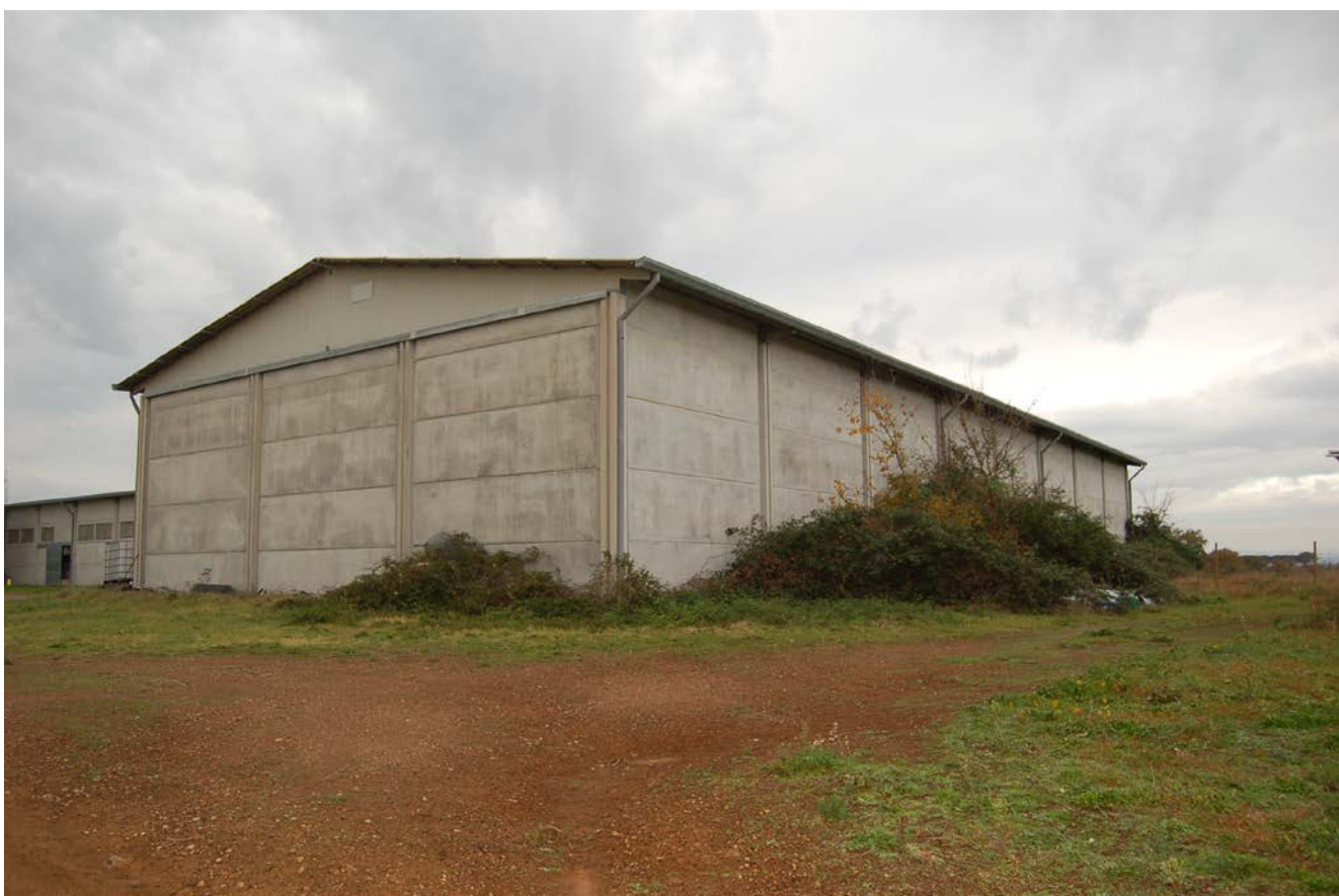
Foto 8- Capannone prefabbricato con destinazione fienile –ricovero attrezzi