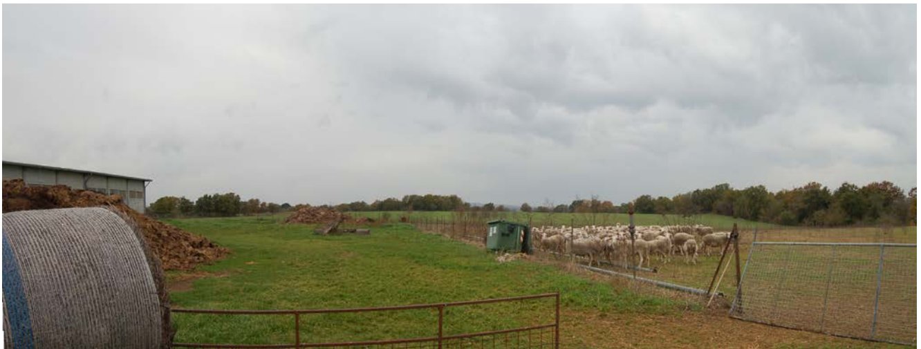
Foto 33 – Terreni limitrofi ai capannoni utilizzati per il pascolo