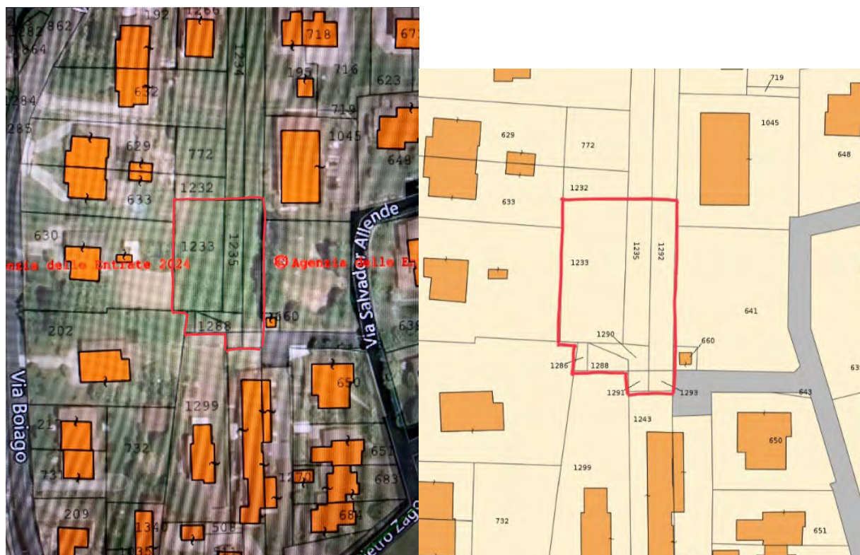
Individuazione dei beni oggetto di pignoramento su foto aerea (a sinistra) e corrispondente estratto dal Geoportale dell'Agencia delle Entrate (a destra)