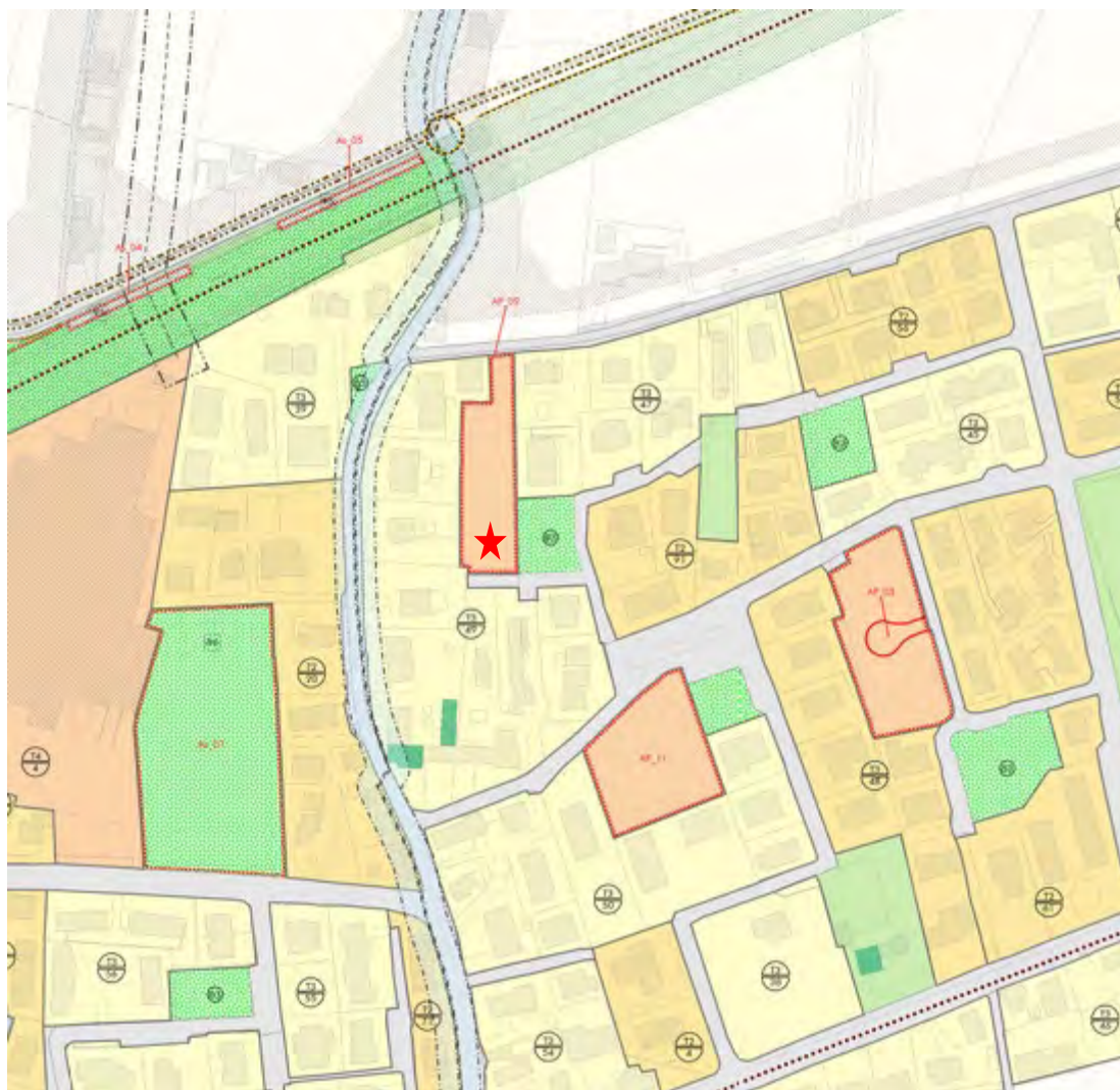
Estratto dalla Tavola dei Vincoli – Piano degli Interventi – Comune di Quinto di Treviso In colore il limite dell'area di progetto AP-2 e, indicata con stella, la posizione del lotto

A carico delle particelle 1291 e 1293 sussiste servitù di passaggio pedonale e carraio con ogni mezzo per l'accesso a Via Allende, istituita con atto di permuta stipulato dal dott. Maurizio Bianconi, notaio in Treviso, in data 13/09/2010 Rep. 100351 Racc. 28476 registrato a Treviso il 15/09/2010 al n. 5922 serie 1T (cfr. Atto di provenienza n.3). Attualmente esse sono destinate a viabilità. Non sono presenti vincoli di natura paesaggistica.