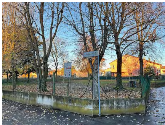
Accesso al lotto da Via Allende (a destra) e il parco pubblico S. Allende (a destra)