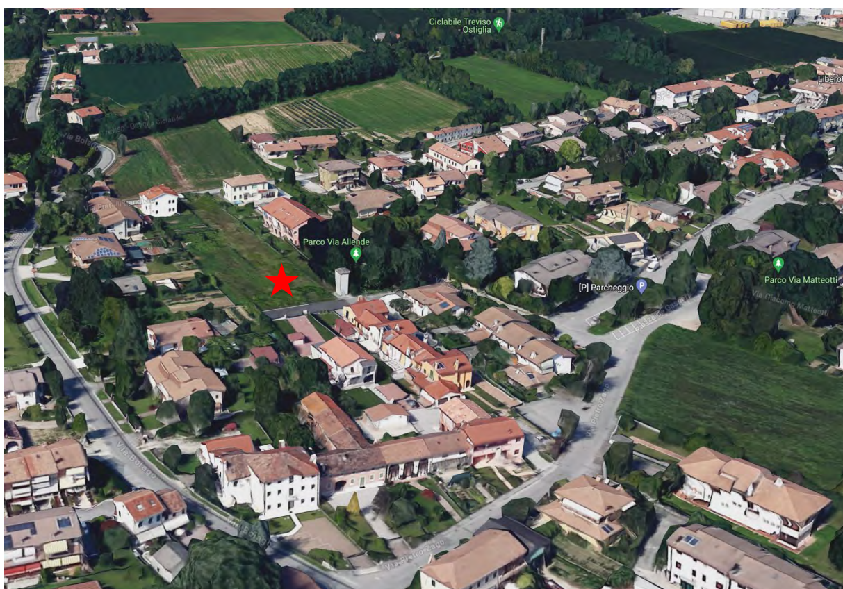
Individuazione del lotto (individuato con stella rossa) nel contesto urbanistico. Si noti la "Treviso-Ostiglia" a nord, il parco pubblico S. Allende e il parcheggio pubblico di piazza Matteotti. (Da Google Maps)

Si trova a circa 600 m in linea d'aria dalla piazza del Municipio e dai servizi principali (banca, ufficio postale, esercizi commerciali, fermate di autobus e corriere). Il percorso cicloturistico "Treviso Ostiglia" si trova a circa 300 m. L'aeroporto Canova dista 2,5 km circa e la città di Treviso dista 6 km circa. Il lotto è aderente al Parco pubblico "S. Allende" mentre a 100 m è situato un ampio parcheggio pubblico in Piazza De Gasperi.