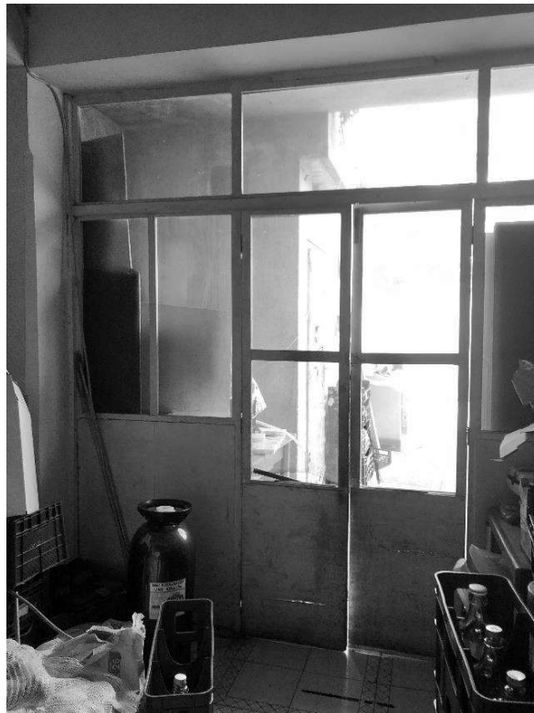
foto 14 – vista dall'interno del Portico verso l'esterno lato nord