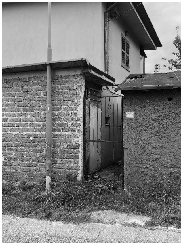
foto 6 – vista del prospetto sud-est (Ristorante – lato Magazzino e corpo di fabbrica annesso)