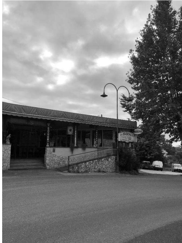
foto 3 - vista lato ovest – ingresso al Ristorante (sub 13) e al Bar (sub 14) tramite porticato (vista da Via Artena)