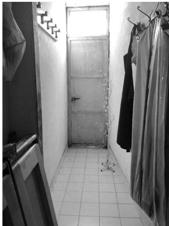
foto 16 – Vista della porta esterna del corpo di fabbrica sud-est