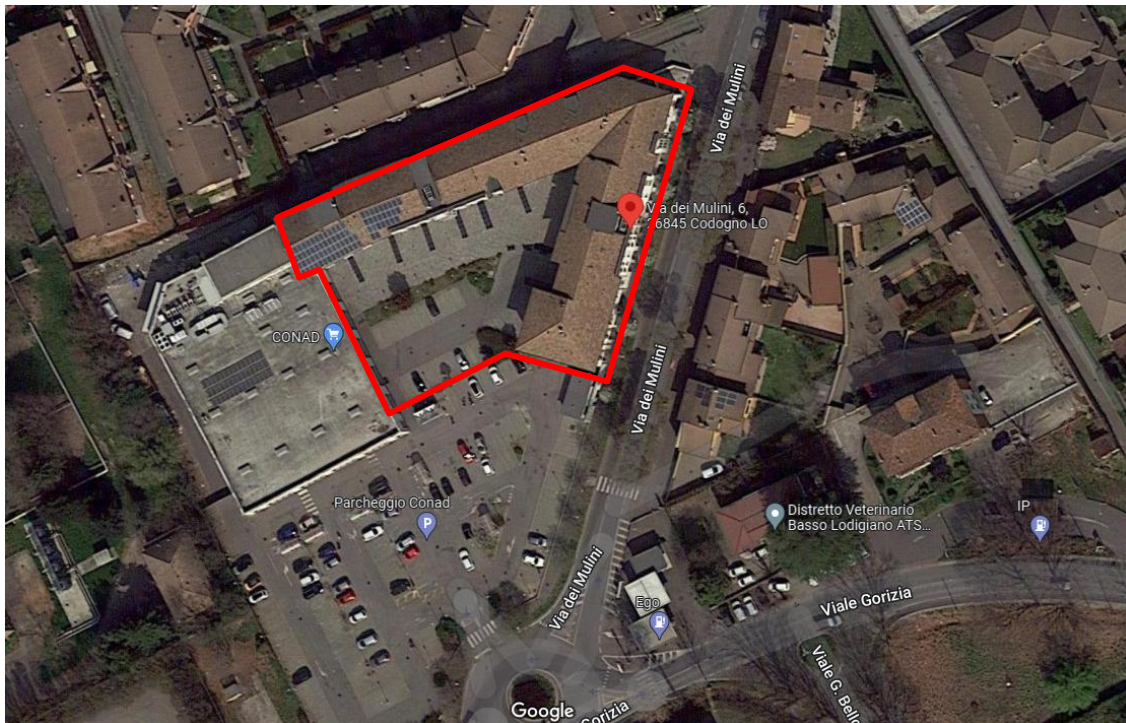
Immagine satellitare GOOGLE maps

Il complesso, di recente costruzione, è posto in zona semicentrale a poca distanza dal centro storico, zona ben servita e ben collegata al contesto urbano circostante. Codogno è un comune di circa 15.000 abitanti, ben dotato di servizi primari e secondari, dista circa 20 Km da Lodi (capoluogo di provincia), 50 Km da Milano e 30 da Cremona: altri comuni confinanti o limitrofi sono Casalpusterlengo, Fombio, Maleo, San Fiorano, Somaglia, Terranova dei Passerini.