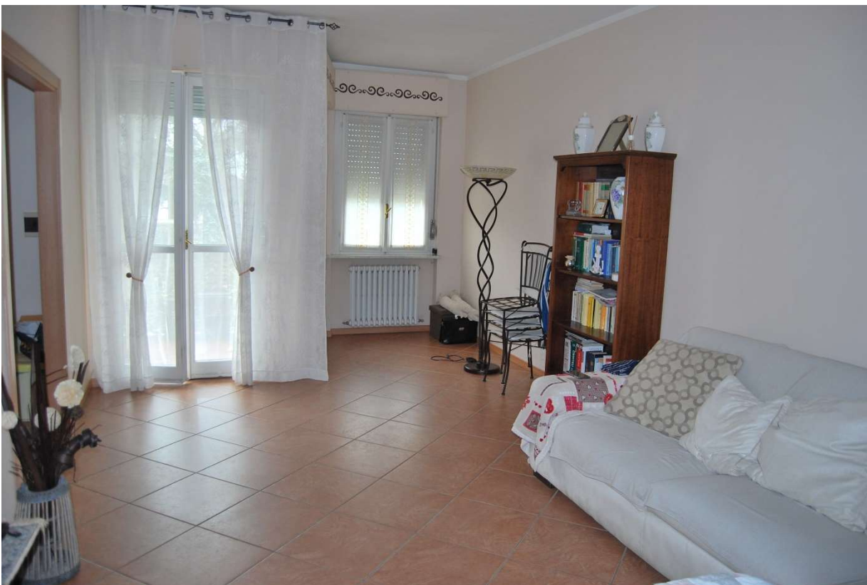
LOTTO 5 - Camera matrimoniale, soggiorno, alloggio sub.6, piano 3°, foto 11-12)