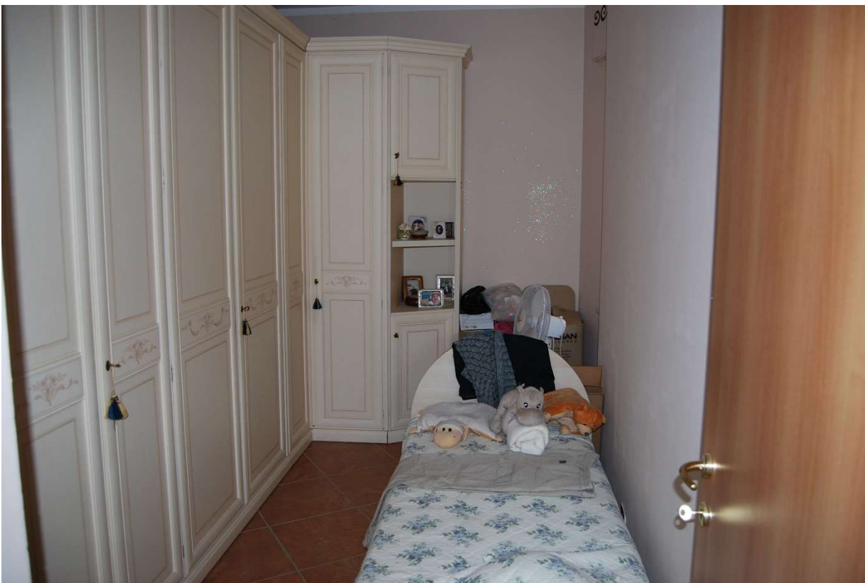
LOTTO 5 - Camera n 1 e n 2 alloggio sub.6, piano 3°, foto 9-10)