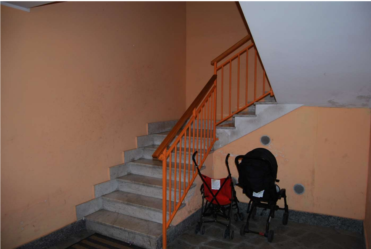
Ingresso pedonale e vano scala condominiale foto 3-4)