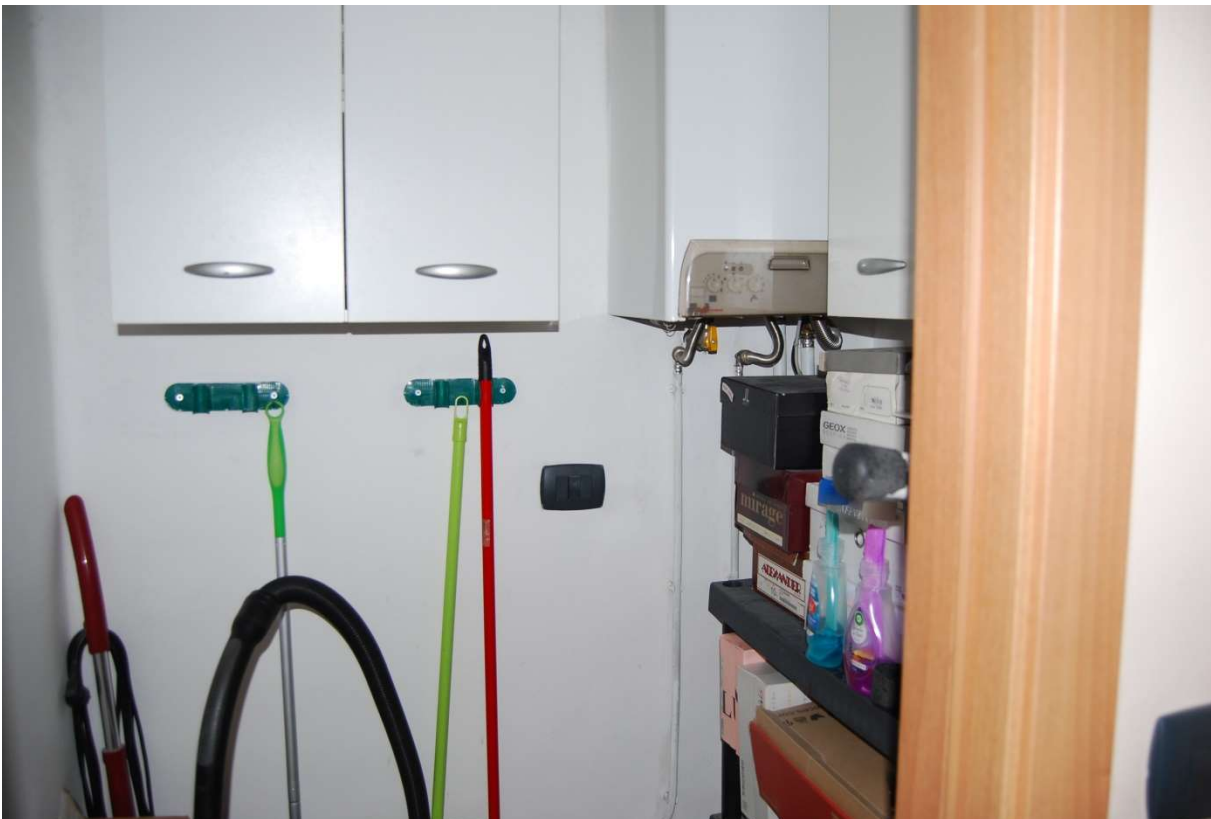
LOTTO 5 - Vista esterna dal balcone su strada e ripostiglio, alloggio sub.6, piano 3°, foto 13-14)