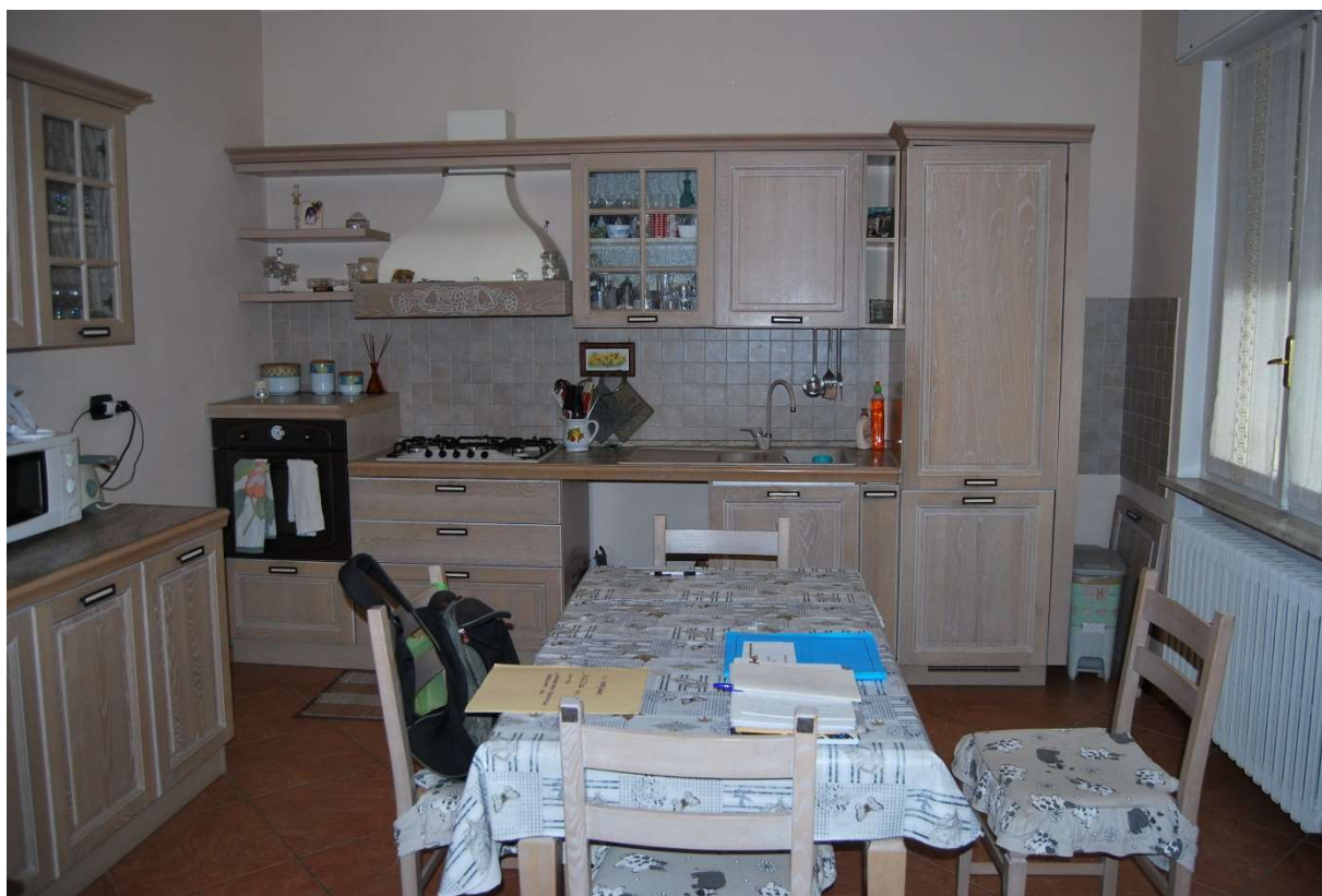
LOTTO 5 - Ingresso-corridoio e cucina alloggio sub.6, piano 3°, foto 5-6)