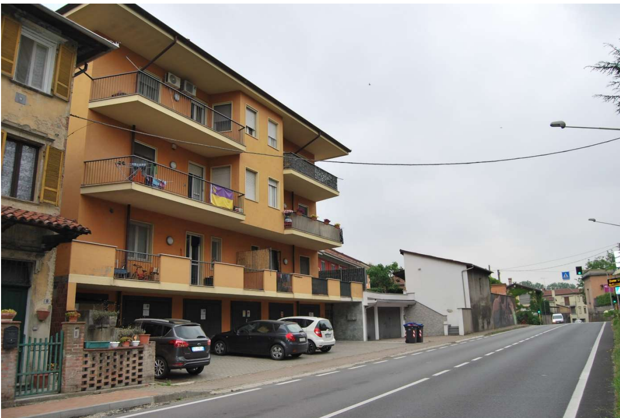
Facciata esterna fabbricato residenziale su strada Padana ovest n 6/A Quattordio. foto 1-2)