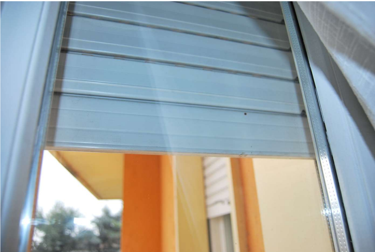
LOTTO 5 - Particolari vetro-camera, serramenti e tapparelle, alloggio sub.6, piano 3°, foto 13-14)