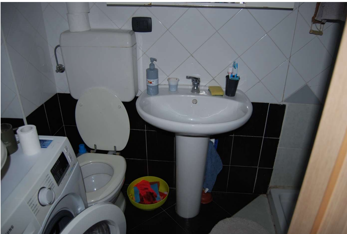
LOTTO 1 - Bagno n 1 e n 2, alloggio sub.1, piano 1°, foto 25-26)