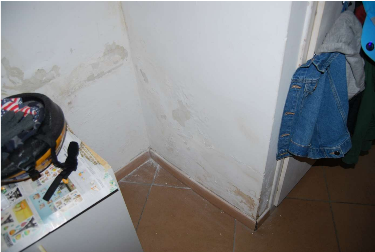
LOTTO 1 - Pareti ingresso interessate parzialmente da umidità, efflorescenze, alloggio sub.1, piano 1°, foto 23-24)