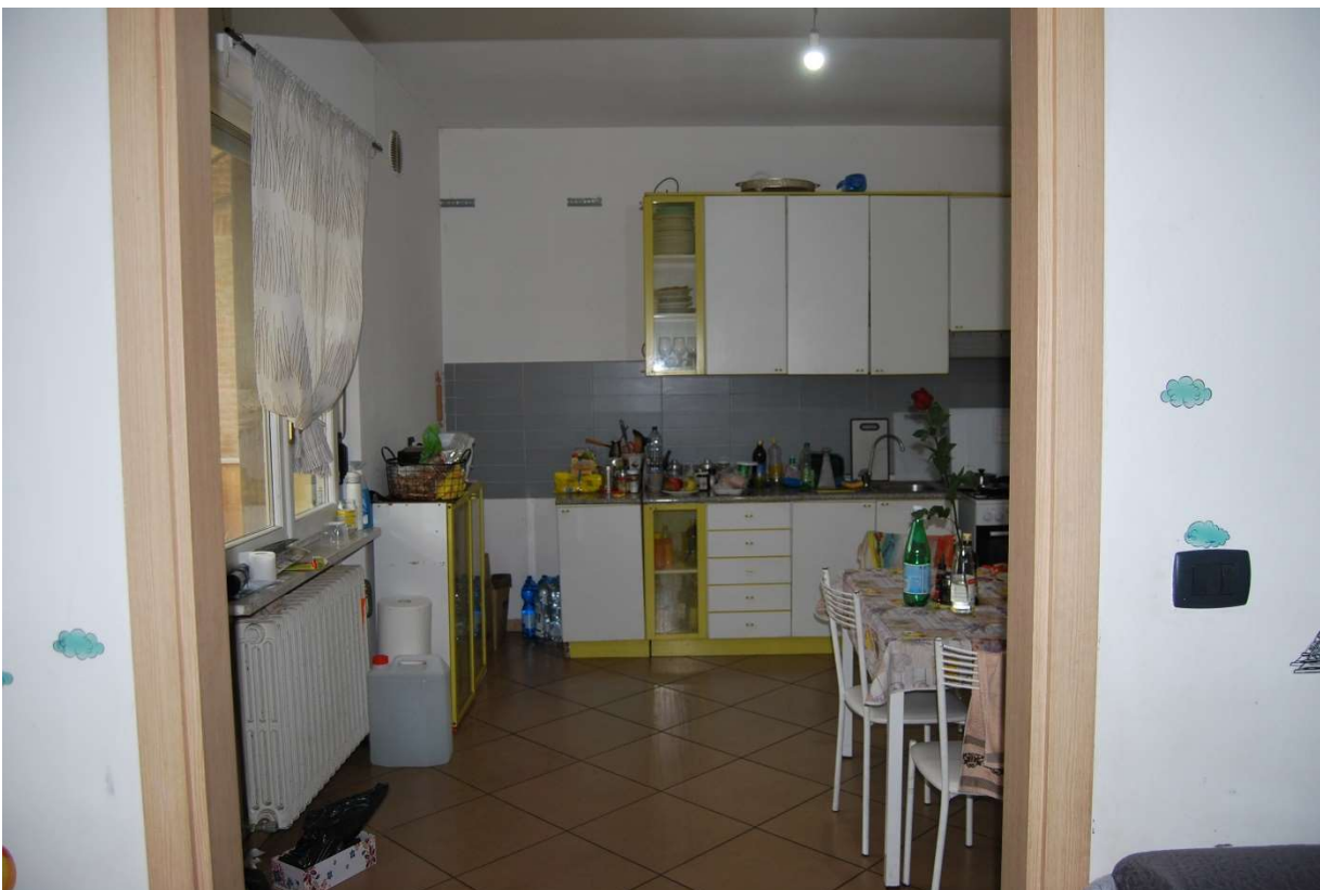
LOTTO 1 - Soggiorno, cucina, alloggio sub.1, piano 1°, foto 21-22)