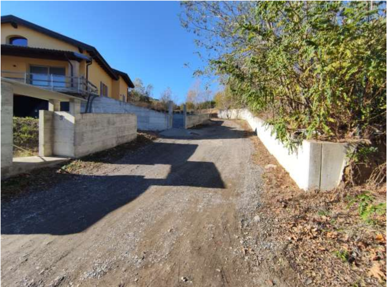
ACCESSO MAPPALE 944 E MAPPALE 944 (foto da n° 1 a n° 30) - Foto n° 1