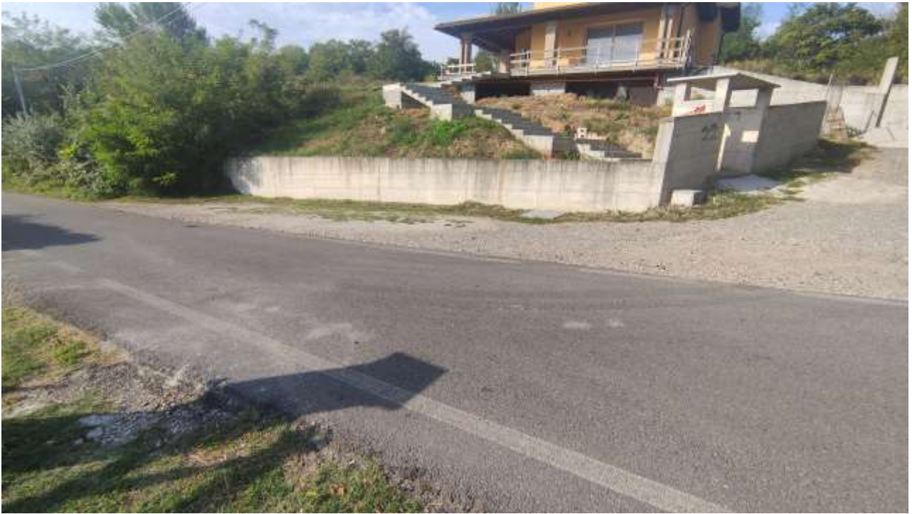
MAPPALI 945-946-942 (foto da n° 31 a n° 38) - Foto n° 31