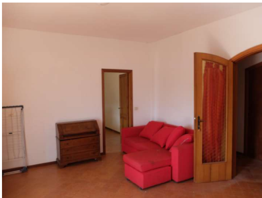
Foto12: Soggiorno- pranzo