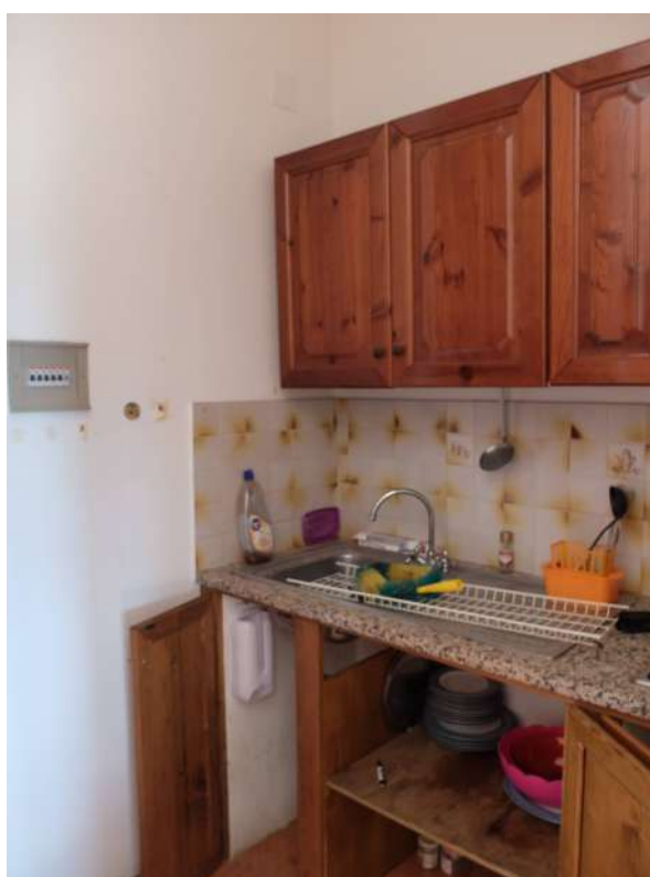
Foto13: Zona cottura