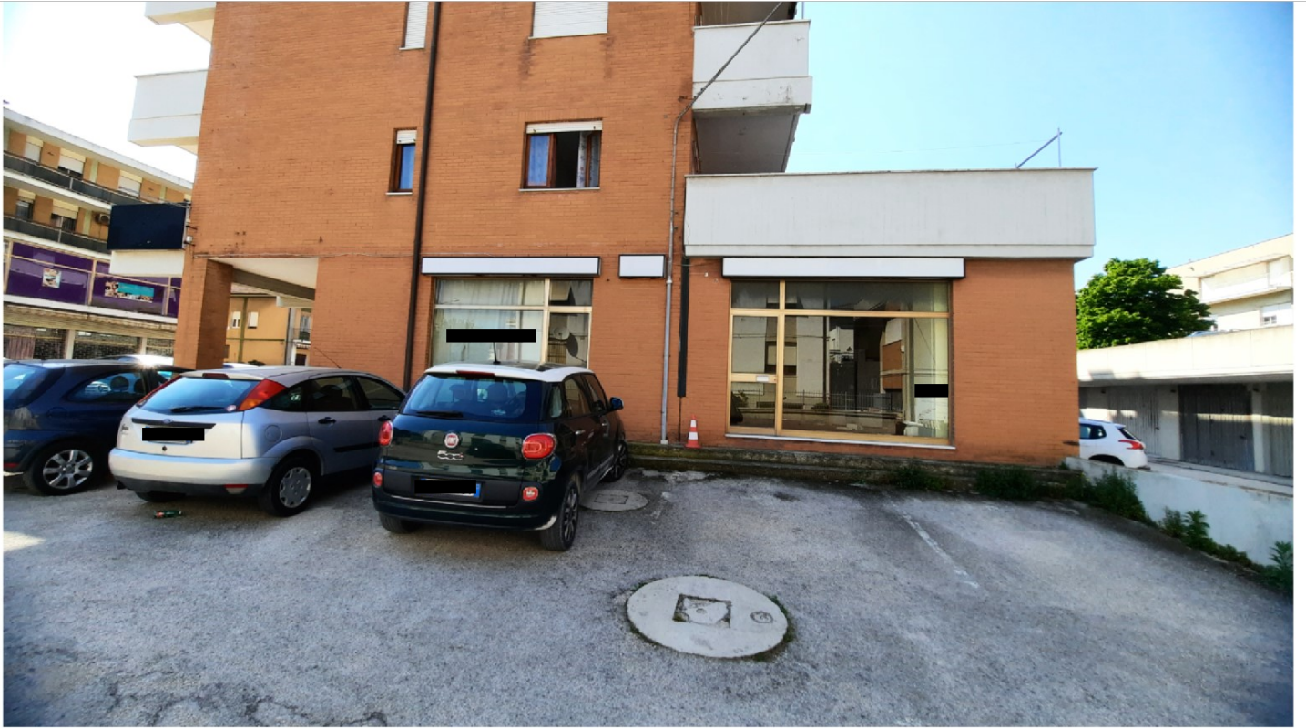
Foto 5 - prospetto nord - vetrine