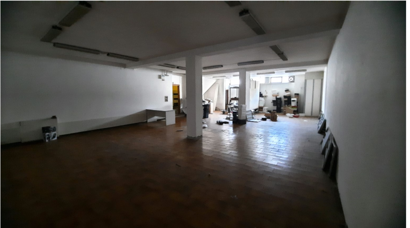
Foto 13 - magazzino al piano sottostrada