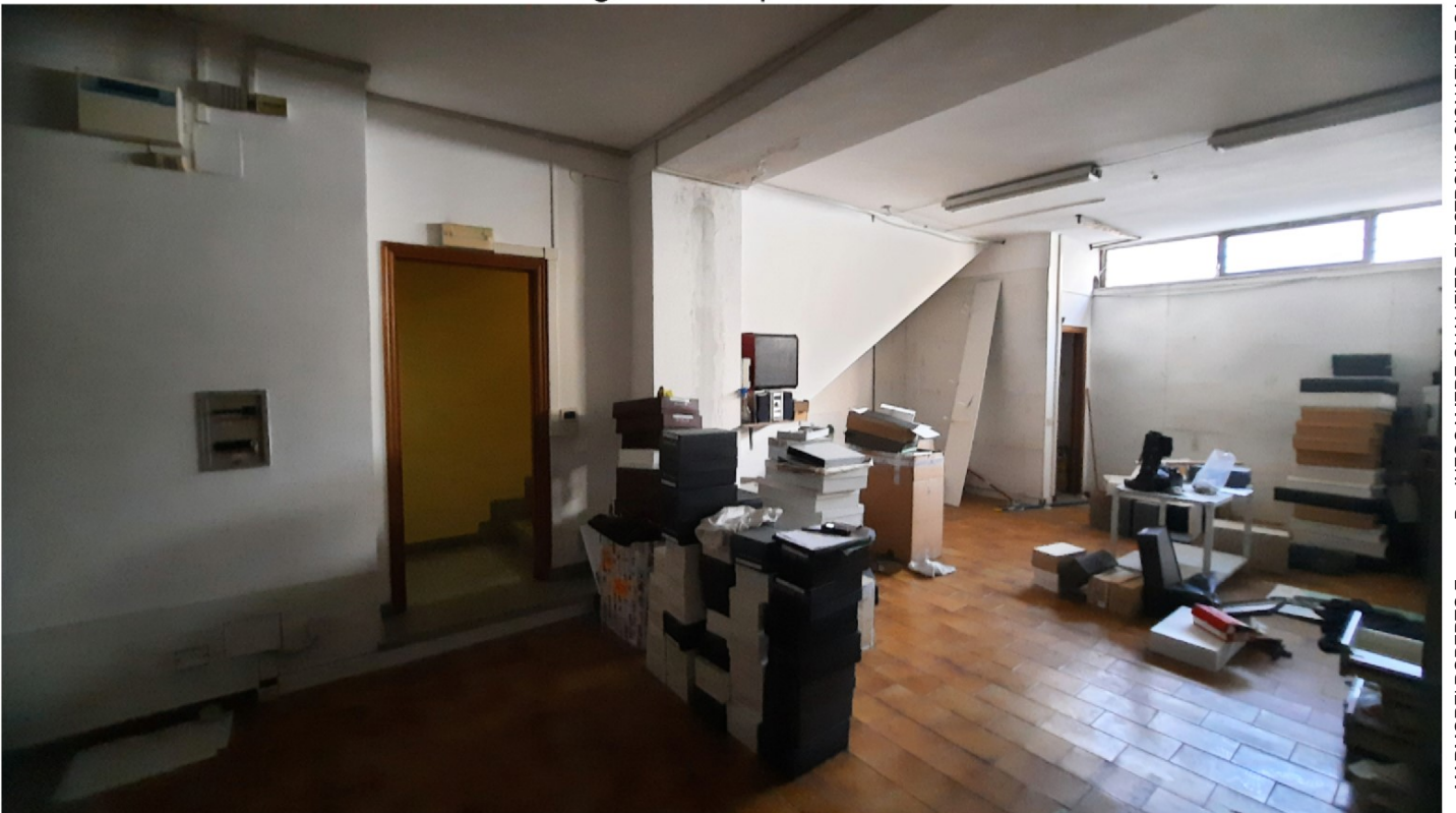
Foto 14 - magazzino al piano sottostrada