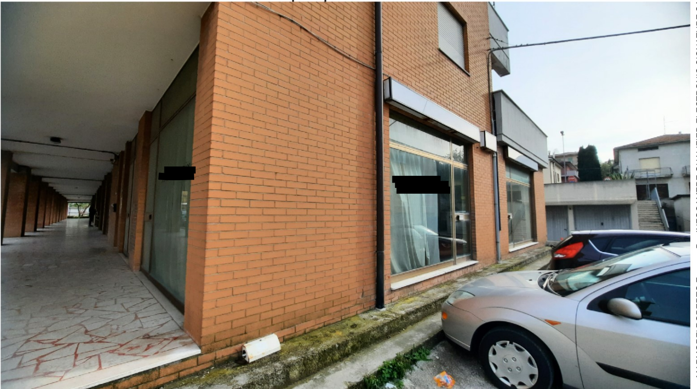
Foto 6 - prospetto nord - vetrine