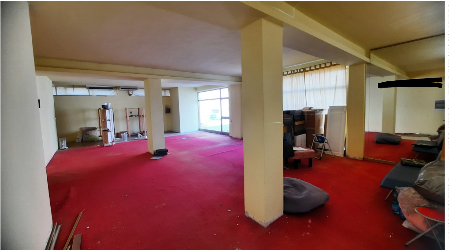
Foto 8 - negozio