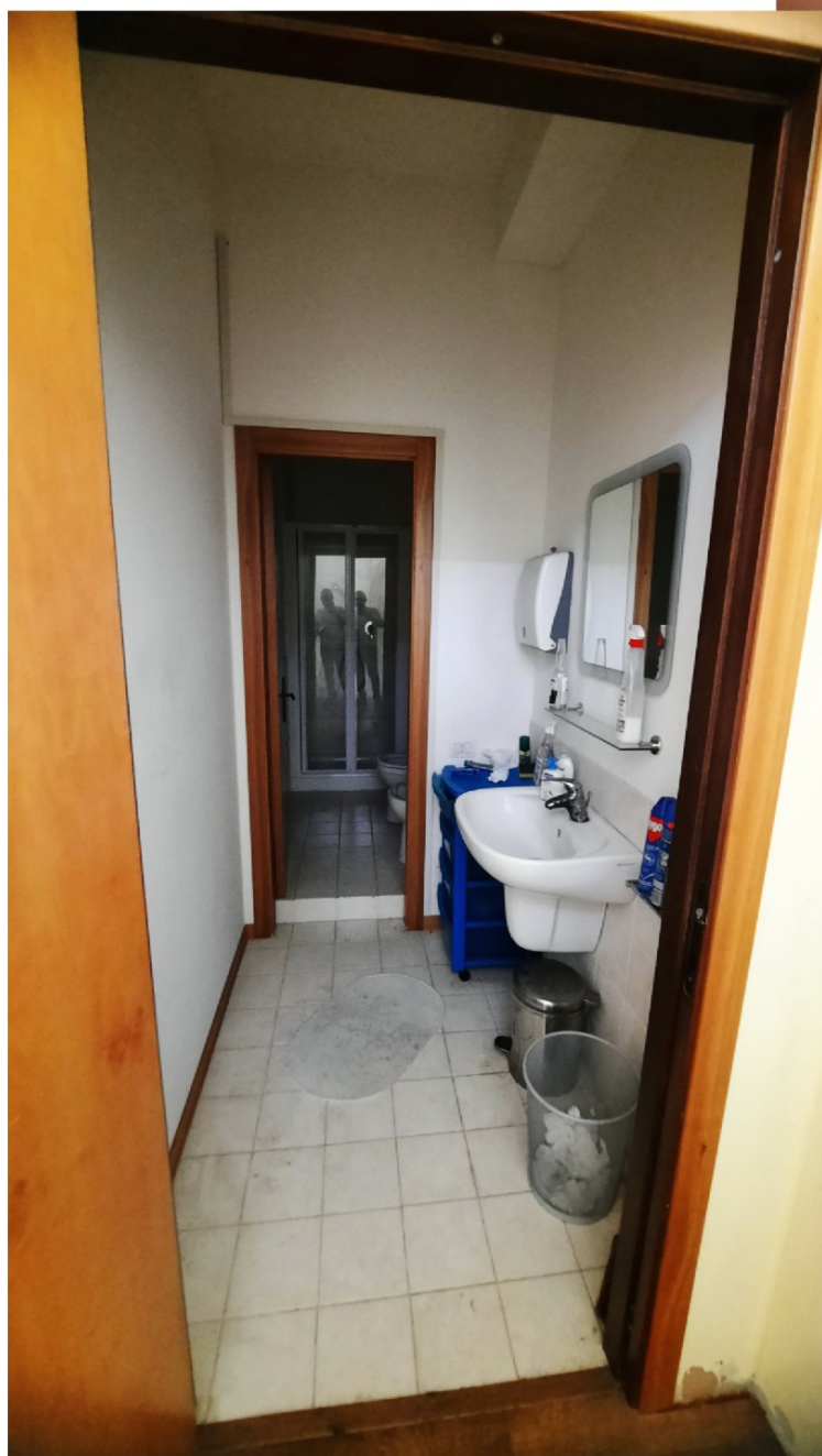
Foto 10 - antibagno