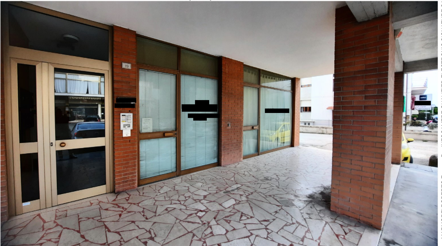
Foto 4 - prospetto est - vetrine