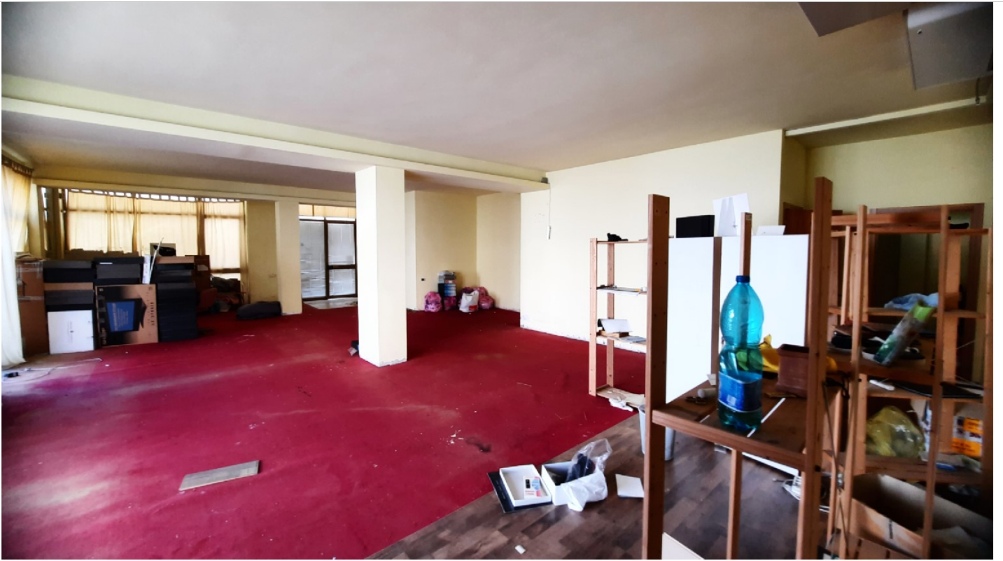
Foto 7 - negozio