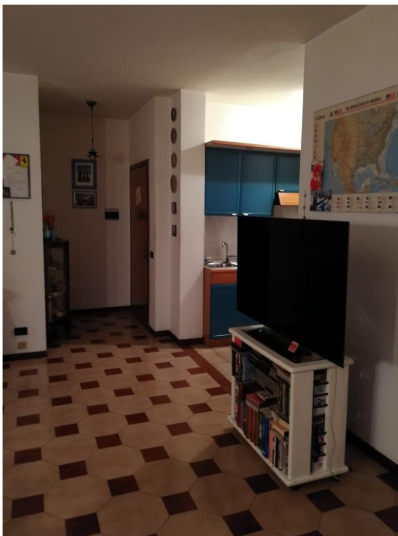
VISTA N.2 Interno della stanza soggiorno-cucina unite;