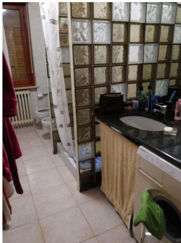
VISTA N.4 Bagno;

STUDIO TECNICO ING. FRANCESCO CICCALÈ VIALE DELLA REPUBBLICA 18 - 63814 TORRE S. PATRIZIO (FM) Tel e fax: +390734510184 CELL. +393332523636, C.F.: CCCFNC63L06L279Q P.I.: 01516120449 E-MAIL: francescociccale1@gmail.com