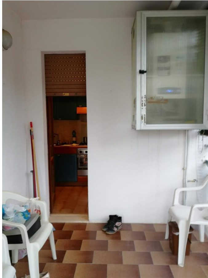
VISTA N.7 terrazzo con veranda con accesso dalla cucina;