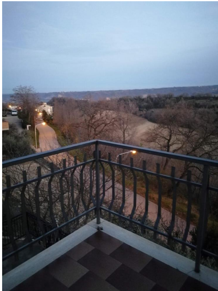
VISTA N.3 Balcone con vista a sud est verso la SP 58;