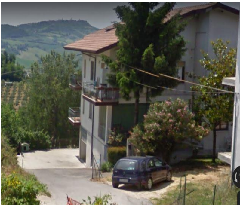
VISTA N.1 Esterno dell'immobile in Via A. Moro n. 36 F. 18 part.425/2 e 425/10;