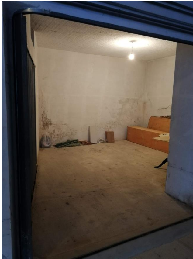
VISTA N.8 Garage F.18 particella 425/10;