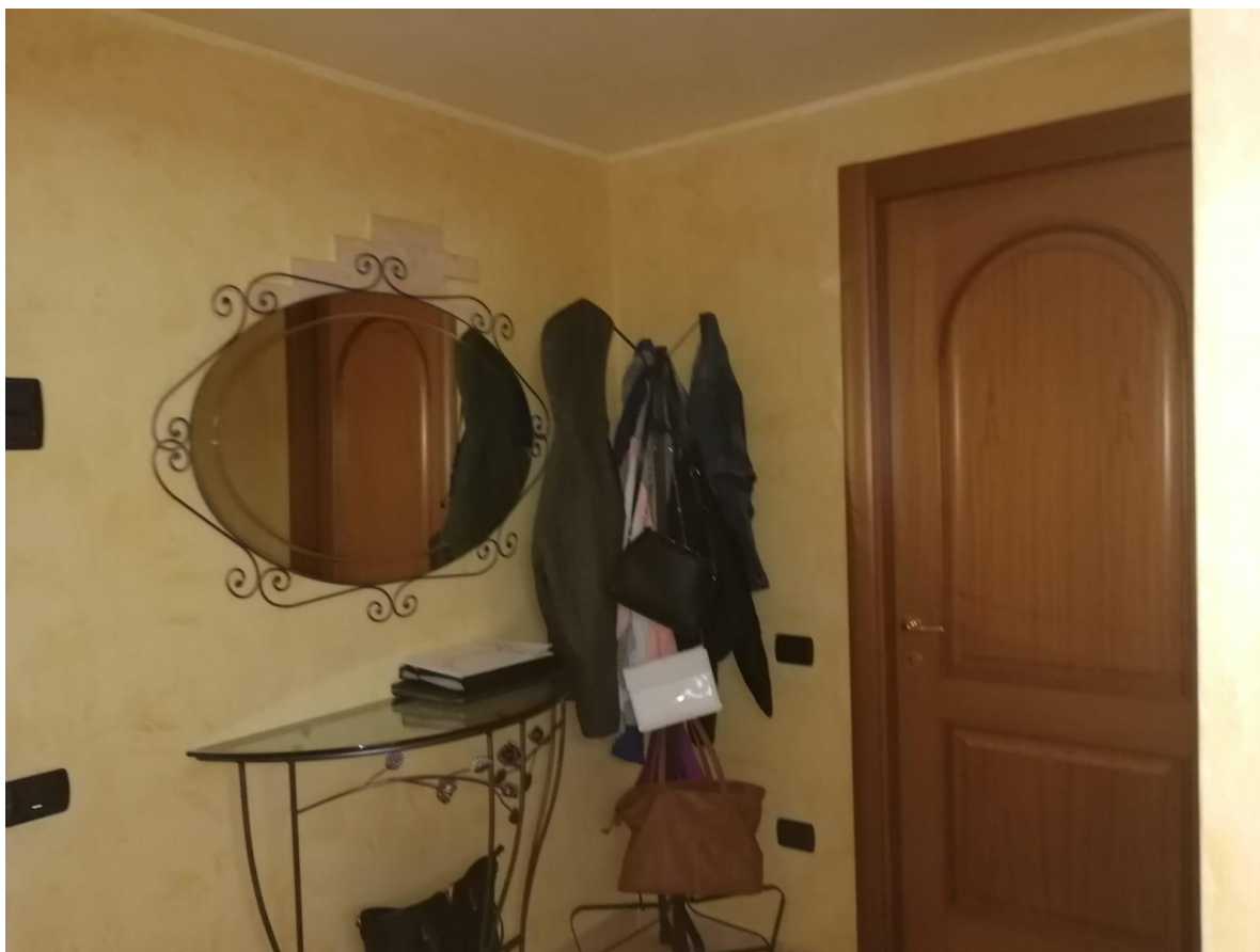
VISTA N.5 F.3 part. 28 sub. 2 ingresso piano primo;