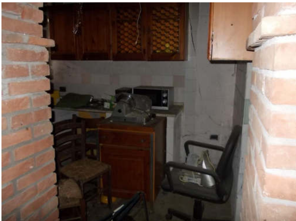
Foto 30 Locale di sgombero (fabbricato interno cortile) piano terra