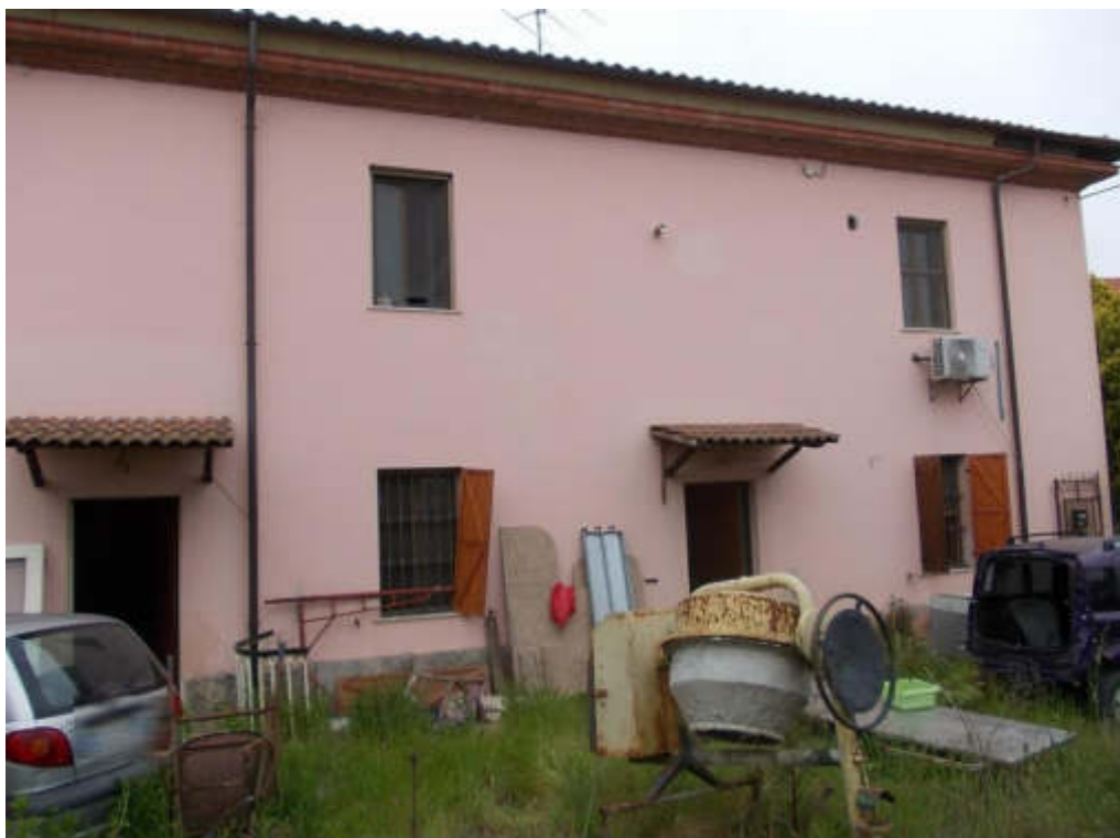
Foto 9 Prospetto sud fabbricato da interno cortile