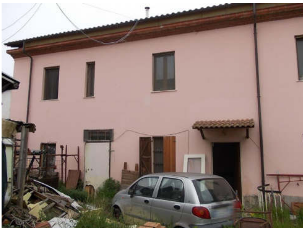
Foto 8 Prospetto sud fabbricato da interno cortile