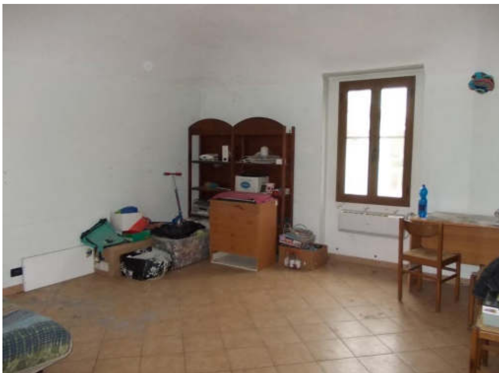
Foto 11 Camera piano primo