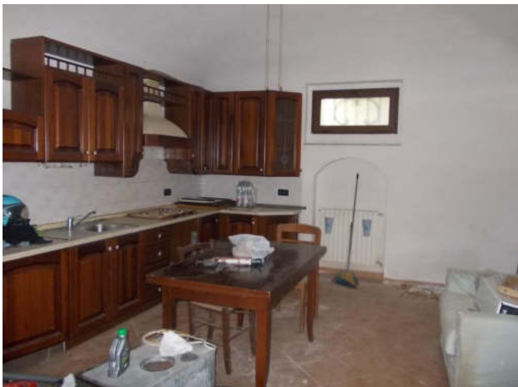
Foto 20 Cucina/soggiorno piano terra