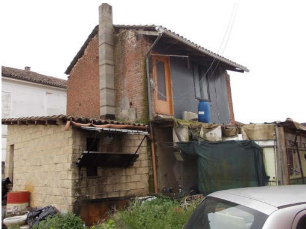
Foto 7 Prospetto nord/est locale di sgombero da interno cortile