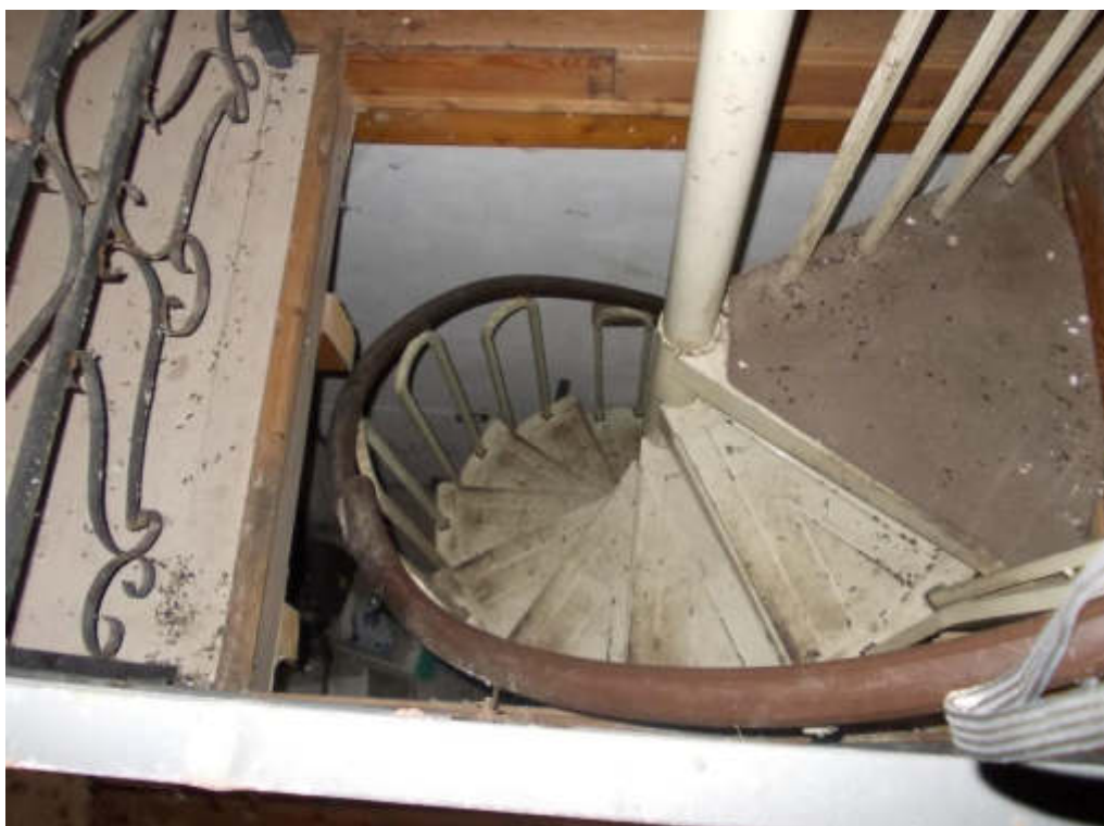
Foto 31 Locale di sgombero (fabbricato interno cortile) scala accesso piano primo