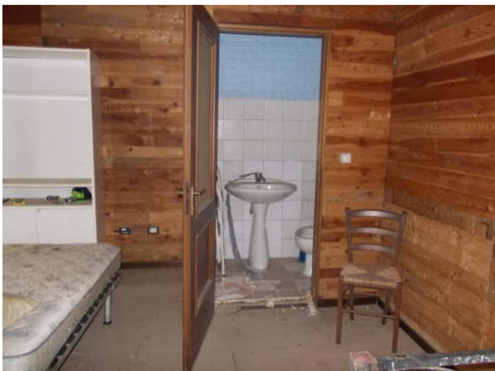
Foto 32 Locale di sgombero (fabbricato interno cortile) piano primo