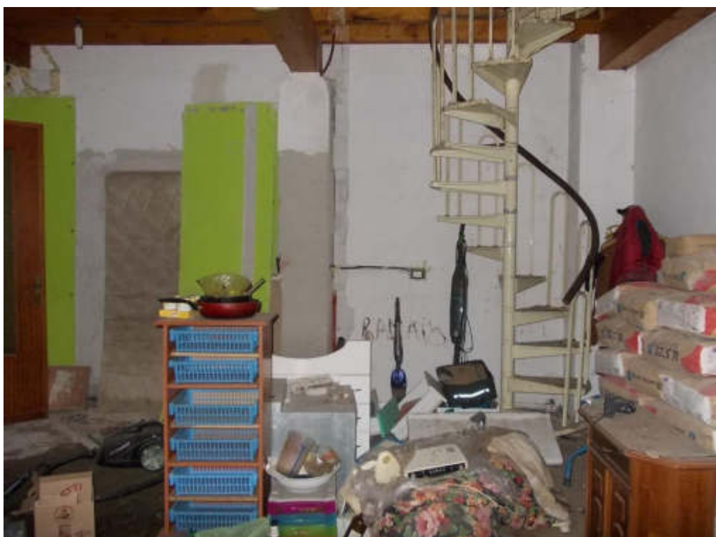
Foto 28 Locale di sgombero (fabbricato interno cortile) piano terra