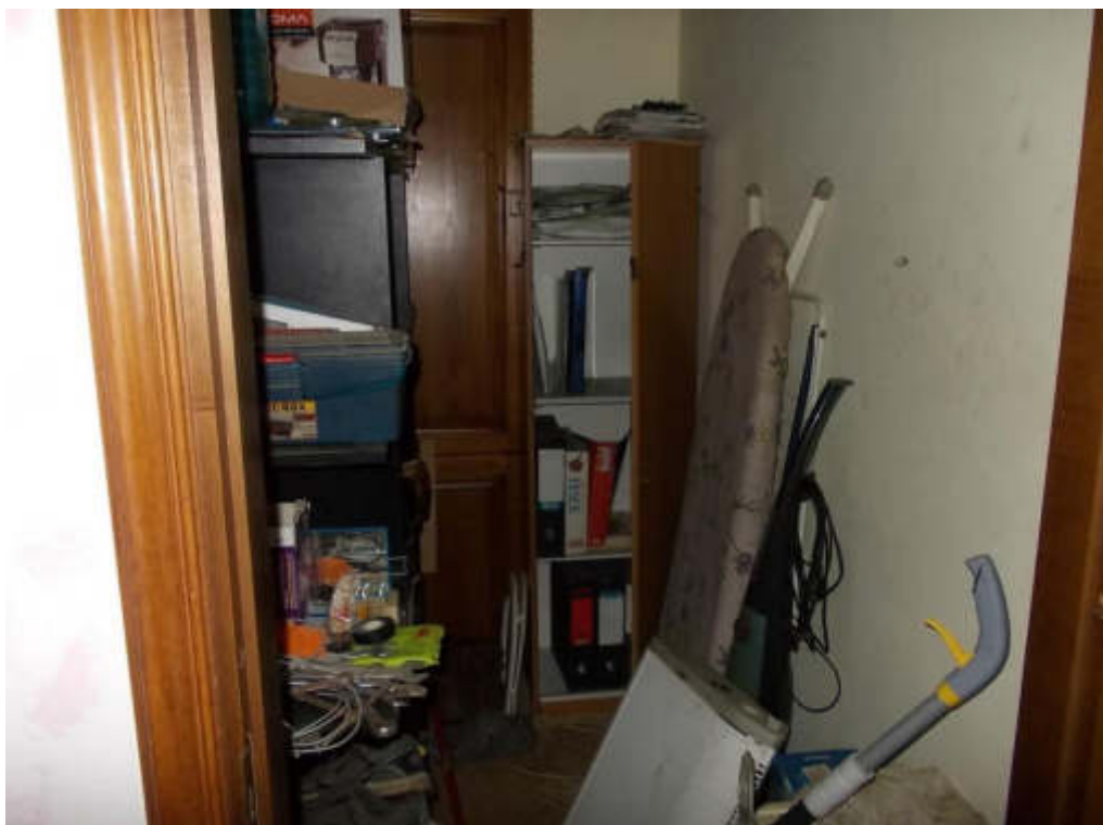
Foto 19 Ripostiglio piano primo