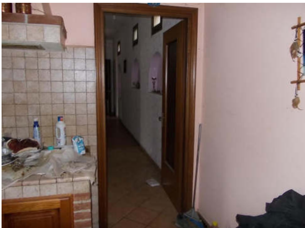
Foto 14 Corridoio piano primo