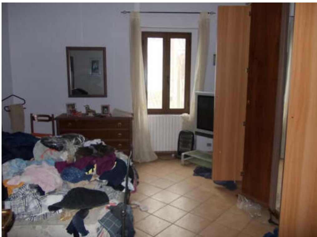
Foto 16 Camera piano primo