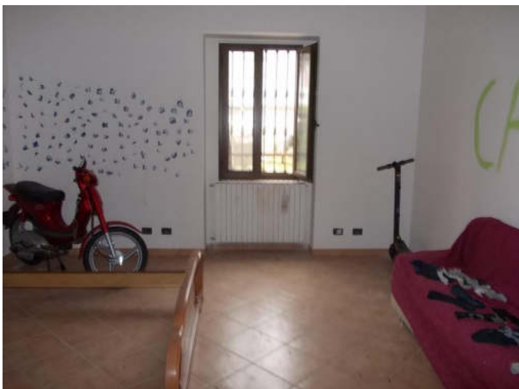
Foto 22 Camera piano terra