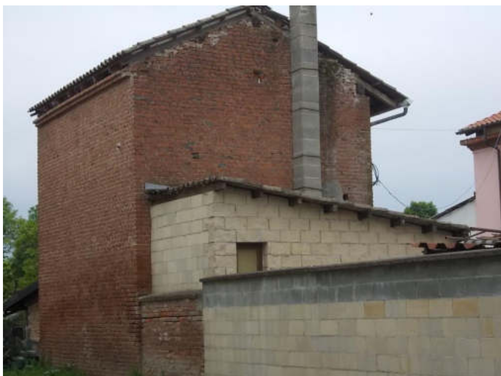
Foto 6 Prospetto sud/est locale di sgombero posto all'interno corrale