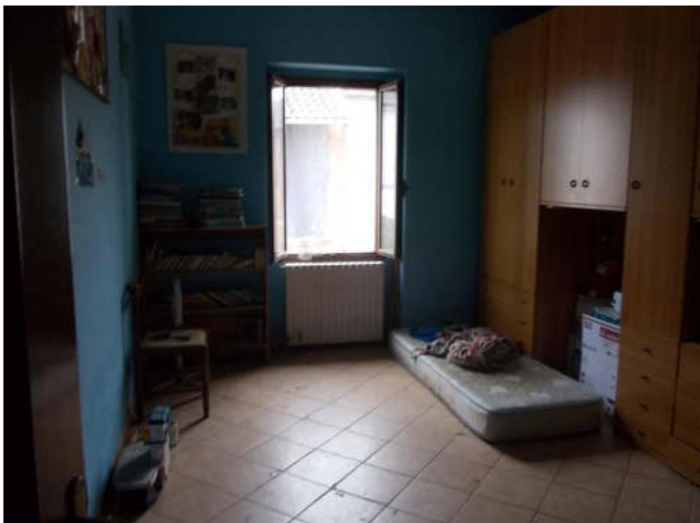
Foto 18 Camera piano primo