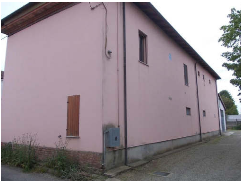
Foto 4 Prospetto nord/est fabbricato da strada