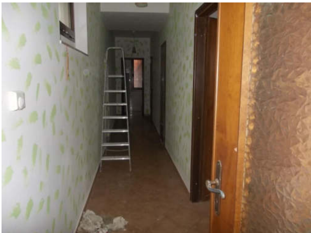
Foto 21 Corridoio piano terra