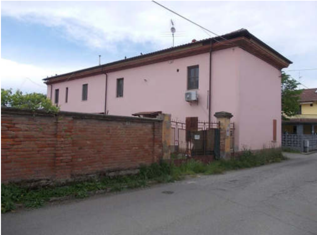
Foto 1 Prospetto sud/est fabbricato da strada