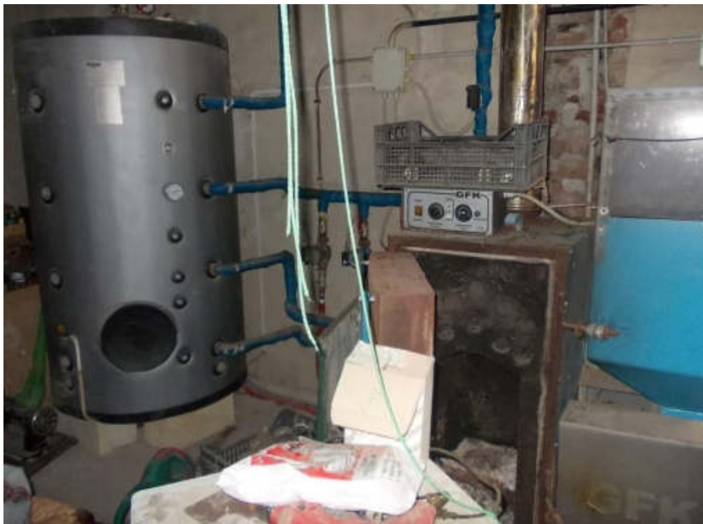
Foto 27 Locale di sgombero c.t. piano terra (particolare caldaia non funzionante)