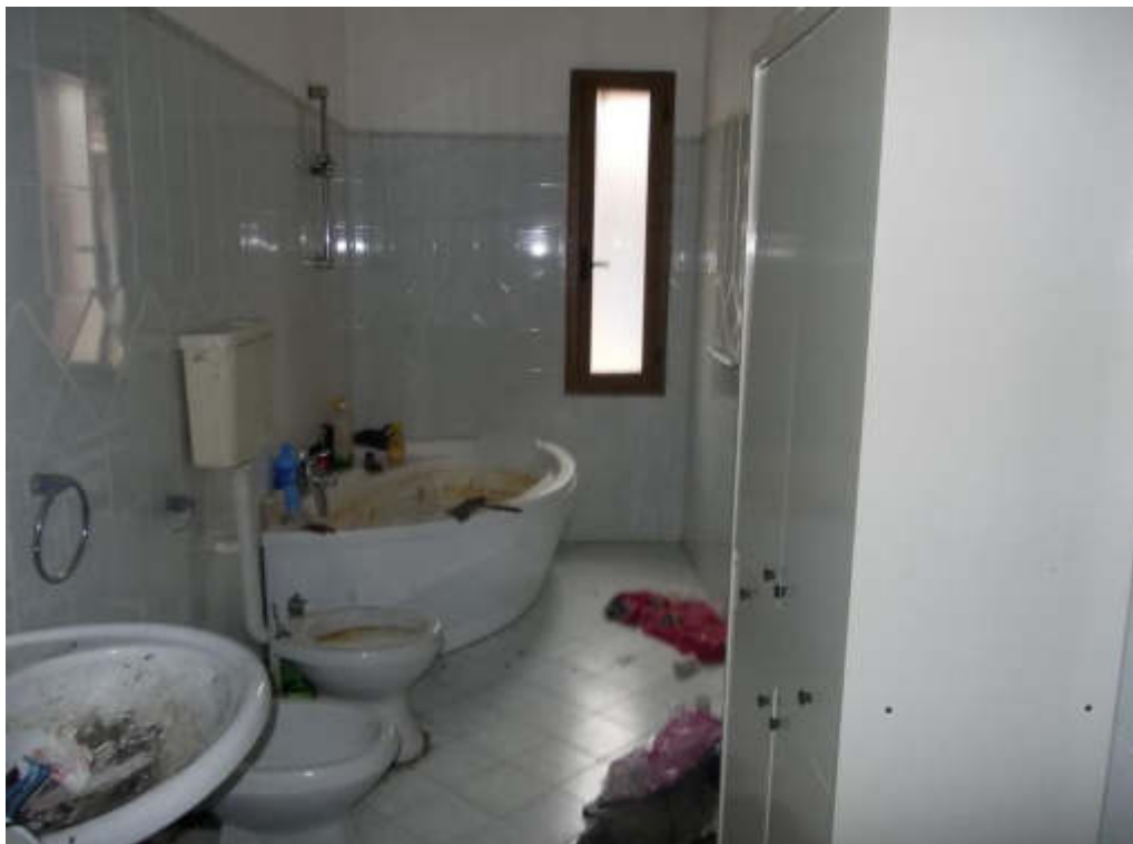
Foto 17 Bagno piano primo