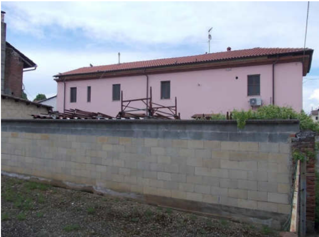
Foto 2 Prospetto sud fabbricato da strada