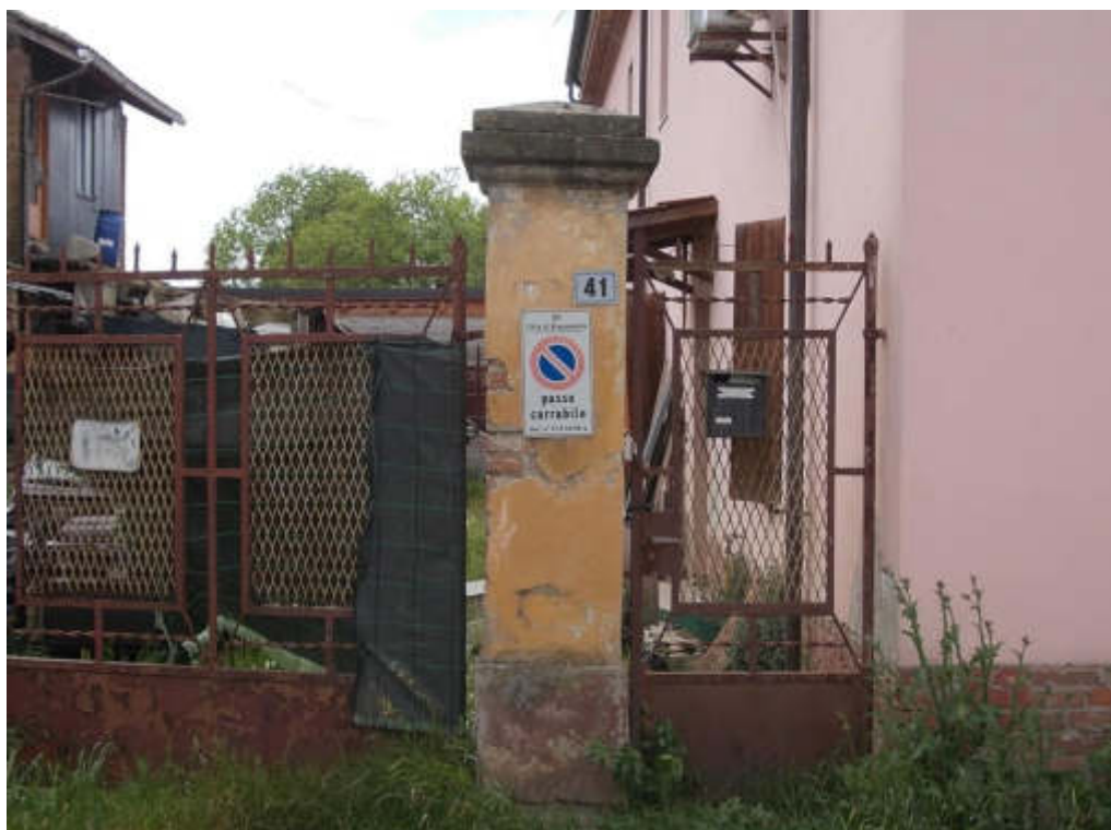
Foto 5 ingresso pedonale/carraio civ.41