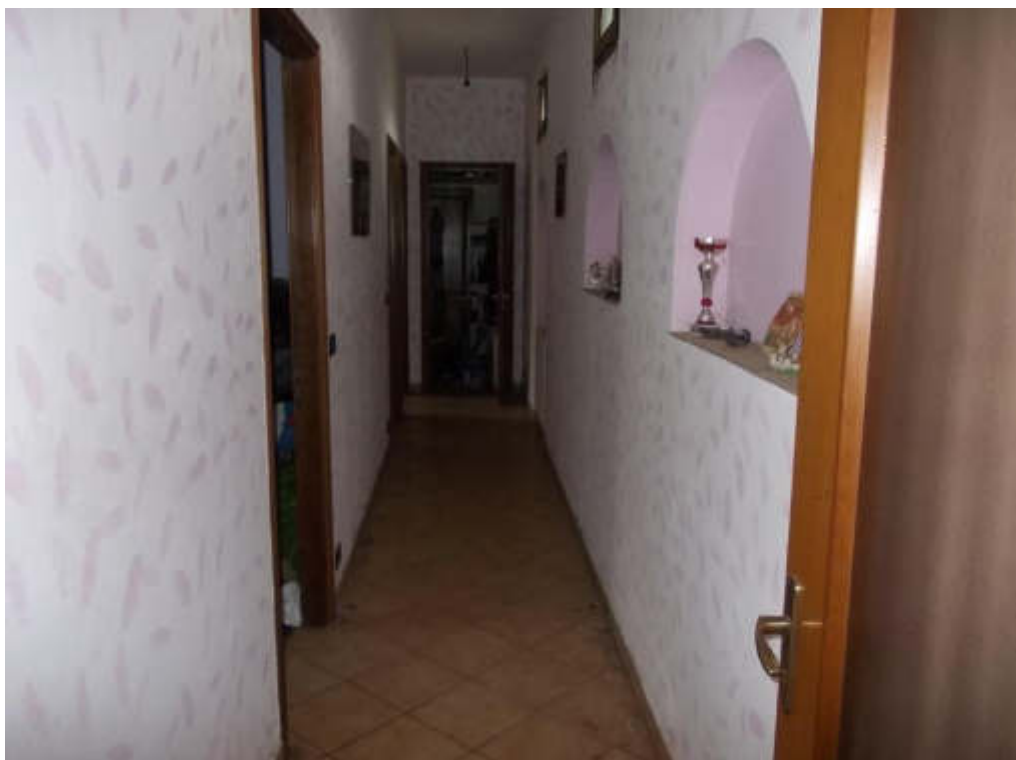
Foto 15 Corridoio piano primo