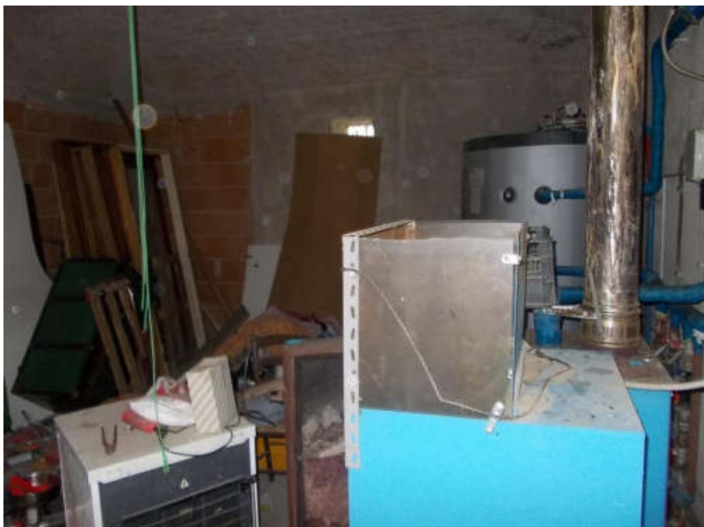
Foto 26 Locale di sgombero c.t. piano terra