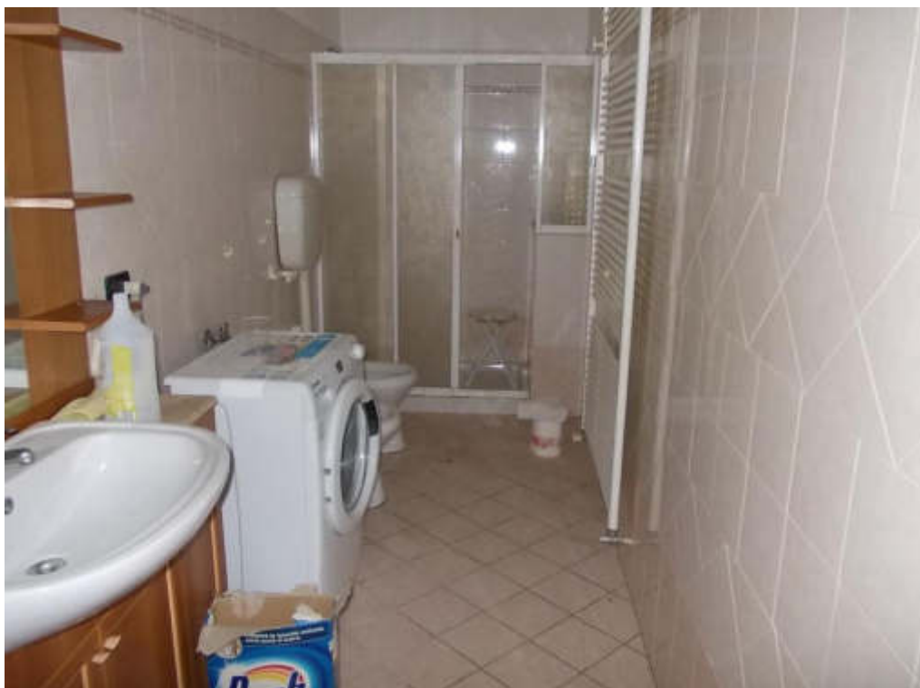
Foto 24 Bagno piano terra