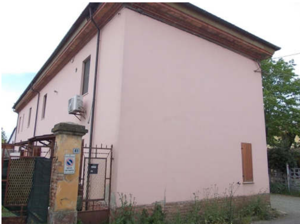
Foto 3 Prospetto est fabbricato da strada