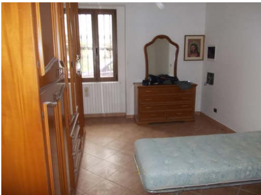
Foto 23 Camera piano terra