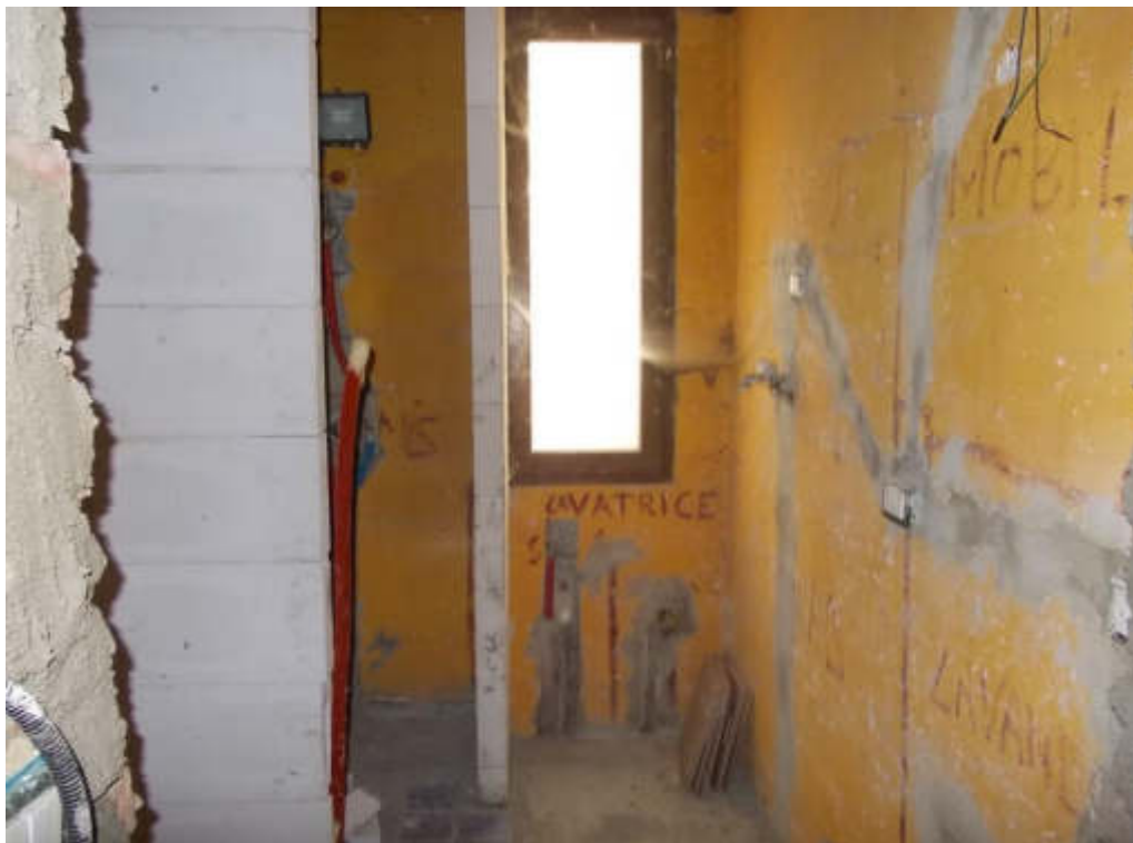
Foto 29 Locale di sgombero (fabbricato interno cortile) piano terra