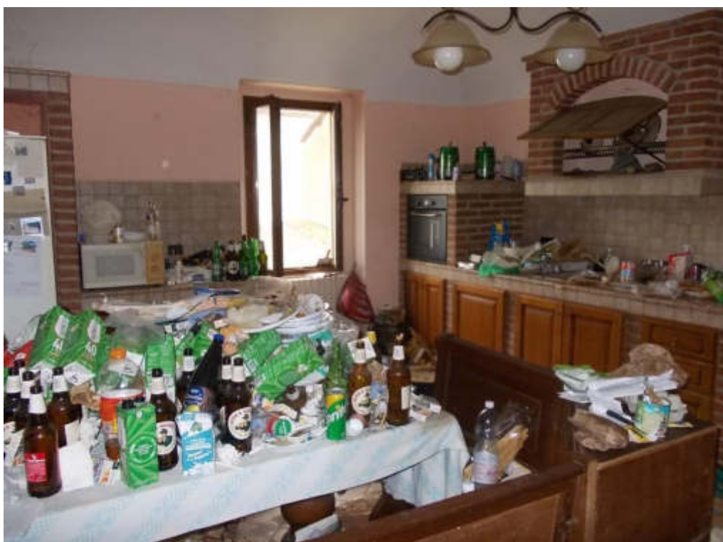
Foto 12 Cucina piano primo