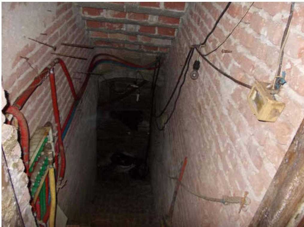
Foto 25 Cantina piano interrato