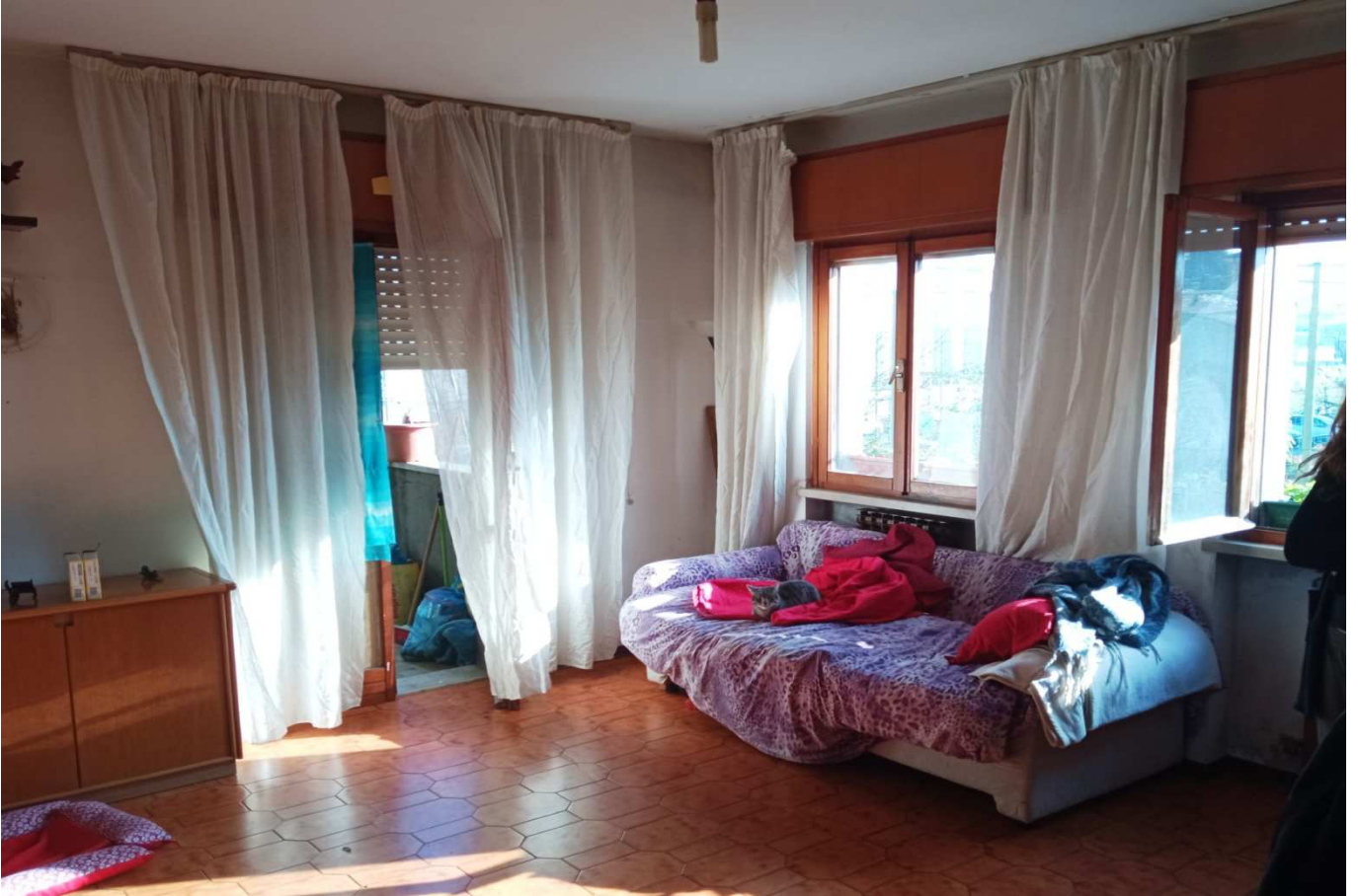
foto 9 - APPARTAMENTO in via Montanara 4, piano 1°, soggiorno - vista dall'interno del soggiorno