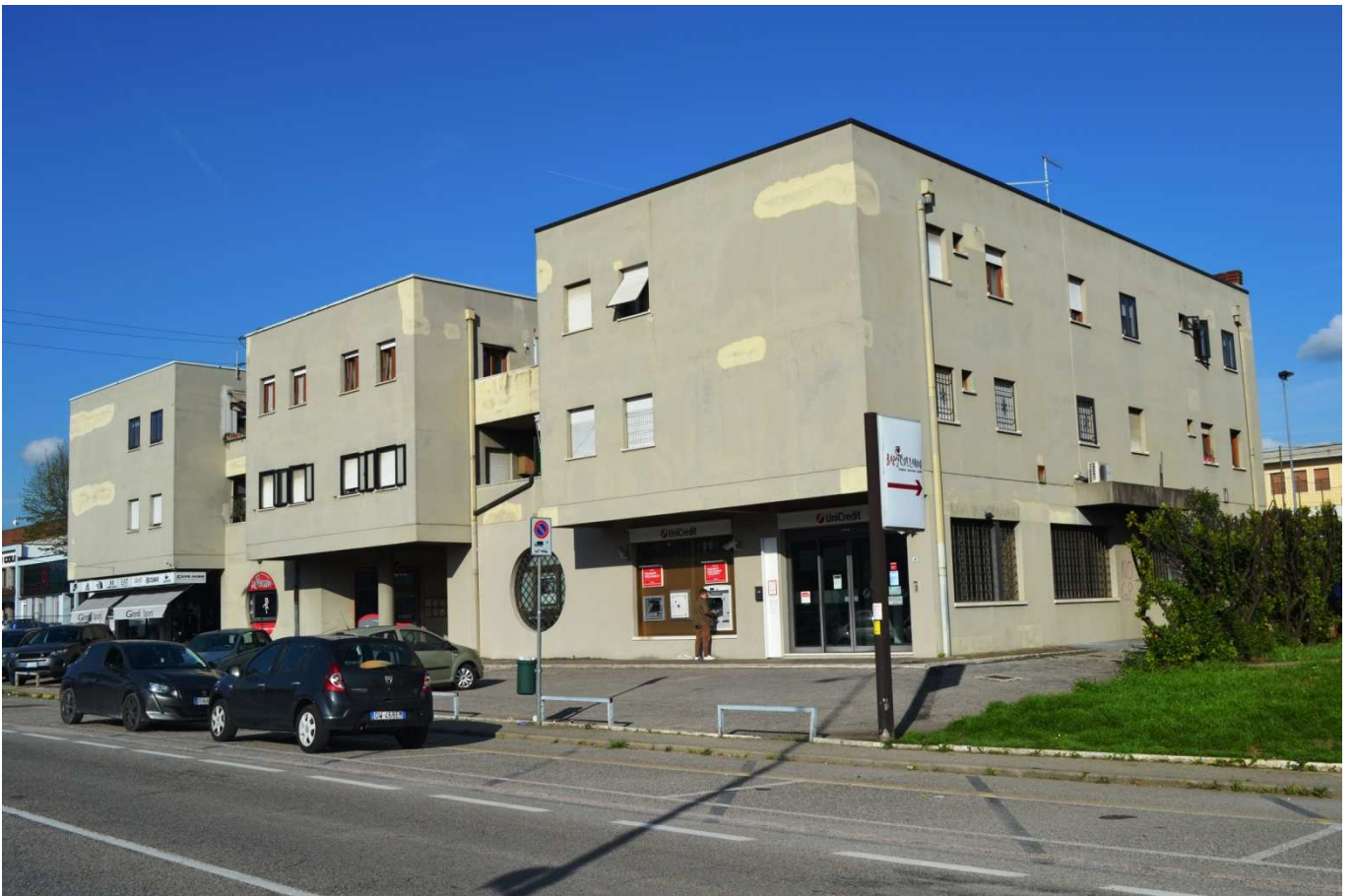
foto 3 - Prospetto ovest del Condominio EX GRATTACIELO in via Montanara n. 4 a Colognola ai Colli