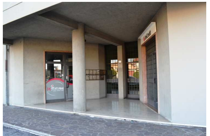
foto 8 - L'ingresso condominiale in via Montanara n. 4