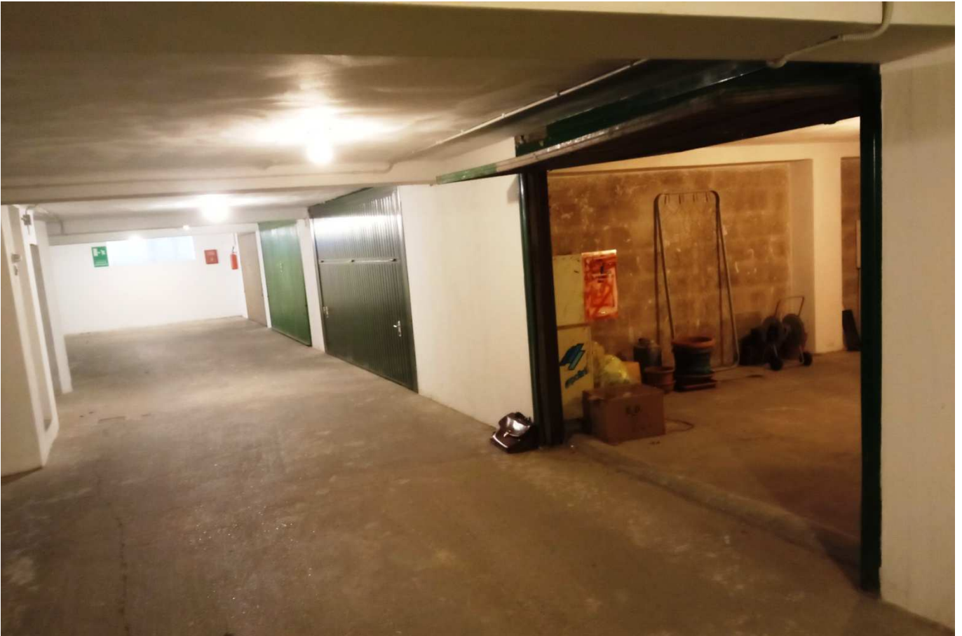
foto 19 - APPARTAMENTO in via Montanara 4, piano S2, autorimessa m.n. 1381 sub 18