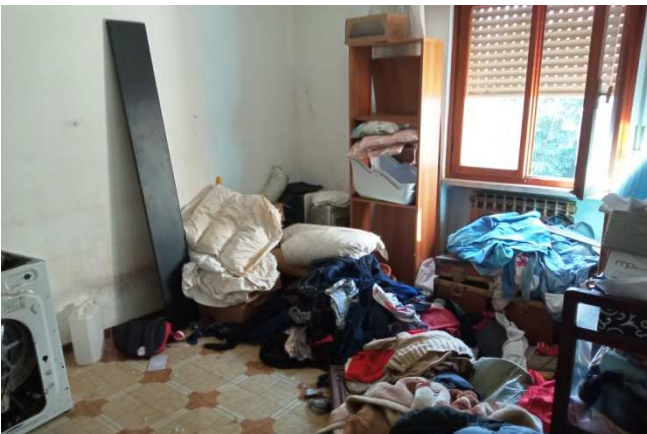
foto 17 - Vista del letto 2 con finestra sul fianco sud