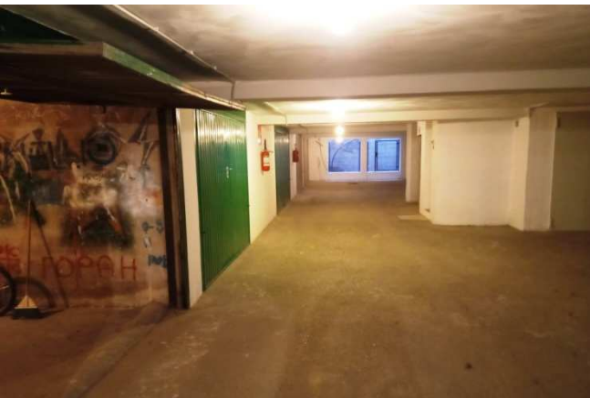
foto 20 - Vista da sud della corsia di manovra