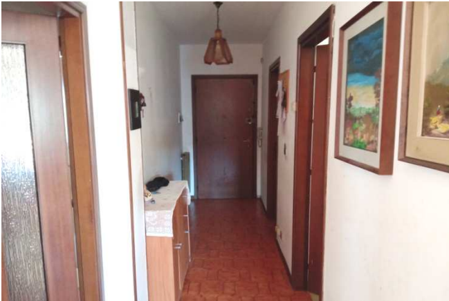
foto 10 - Vista del corridoio con l'ingresso dell'unità