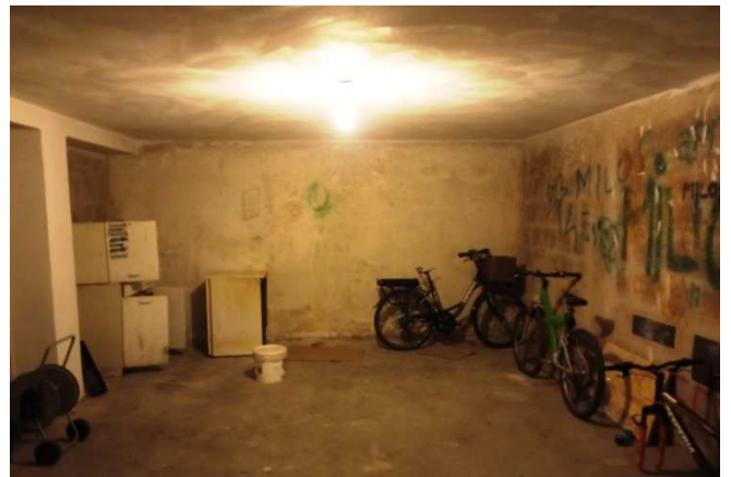
foto 21 - Interno dell'autorimessa m.n. 1381 sub 18