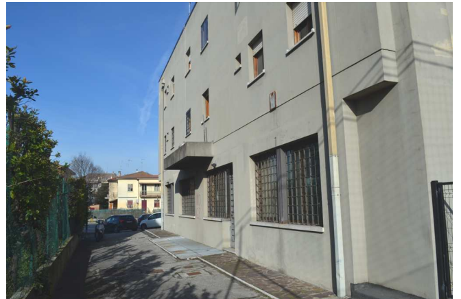
foto 6 - Vista da sud est del fianco sud dell'edificio