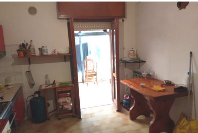
foto 12 - Vista interna della cucina