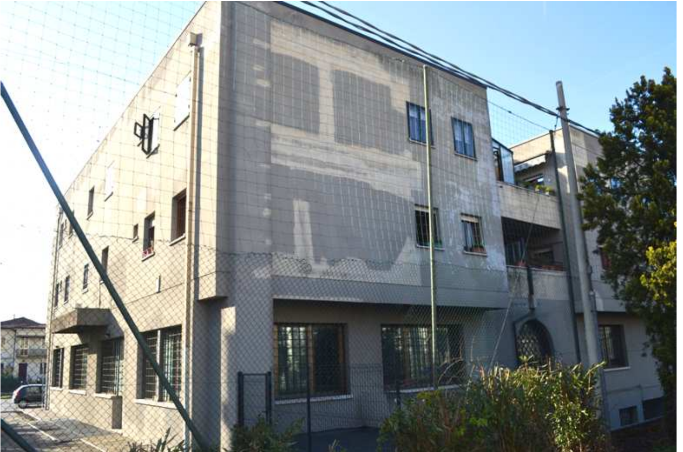
foto 4 - Scorcio dell'angolo sud est dell'edificio con l'unità staggita al piano 1° (al centro nella foto)