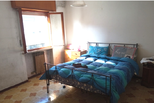
foto 15 - Vista del letto 1 con finestra sul fianco sud