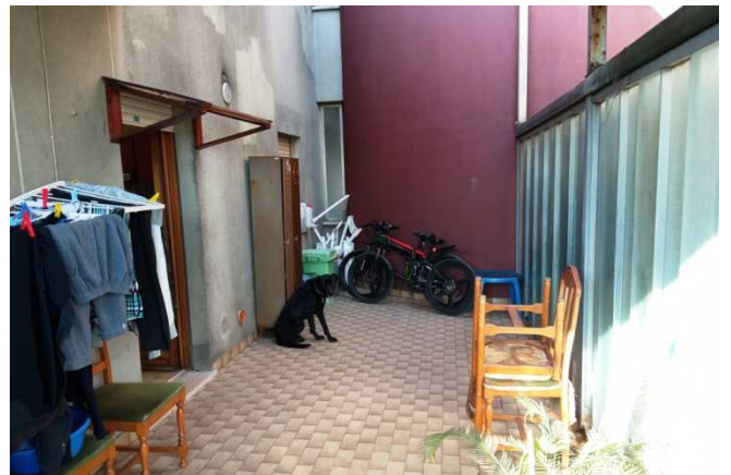
foto 13 - Vista da est della terrazza esclusiva