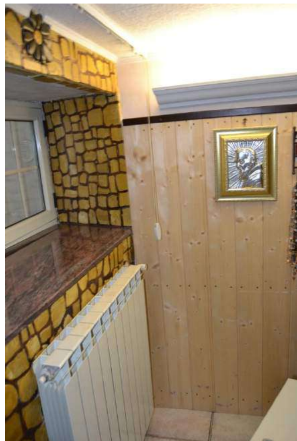
Imm. 23 Vista dei termosifoni in alluminio, finestre in pvc e boiserie in legno su parete della camera da letto.