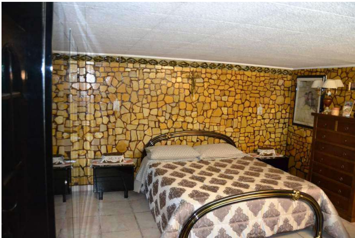
Imm. 13 Vista della camera da letto matrimoniale, con controsoffitto in cartongesso ruvido di colore bianco, pareti rivestite in pietra e finestra alta verso altra proprietà.