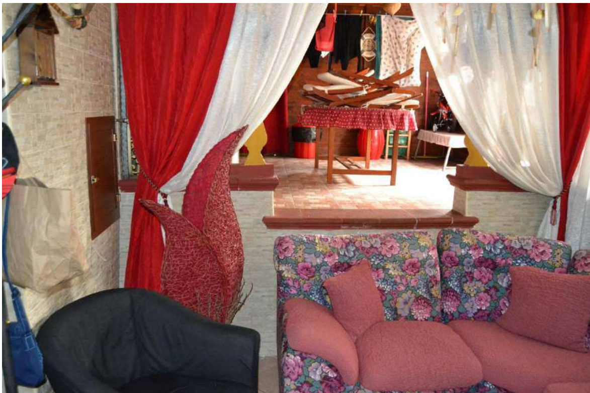
Imm. 8 Vista della zona relax-soggiorno, posta a quota ribassata e intermedia rispetto al piano terra (giardino) e al piano seminterrato (abitazione), ricavata sempre in seguito alla costruzione della struttura in legno che ne costituisce un ampliamento di cubatura e superficie.