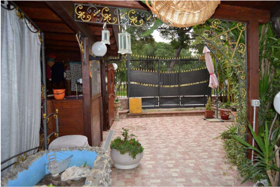
Imm. 5 Vista del giardino di pertinenza dell'abitazione, ad uso esclusivo della proprietà, costituente accesso al piano S-1 p.lla 3041 ex sub. 14.