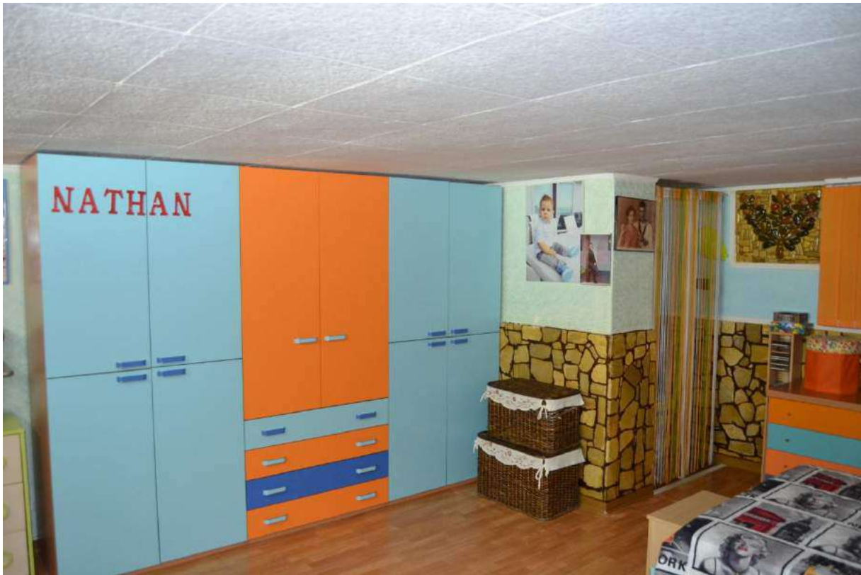
Imm. 17 Vista della scarpiera a muro in cameretta. Soffitto in cartongesso e pareti rivestite in parte in pietra in parte in stucco.