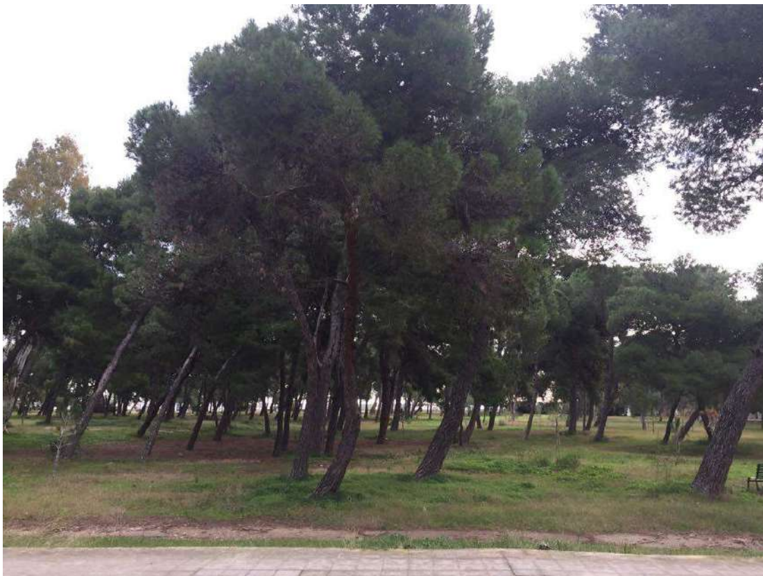
Imm. 3 Vista panoramica della pineta antistante il bene pignorato, tra la strada e la spiaggia del lungomare di Siponto.