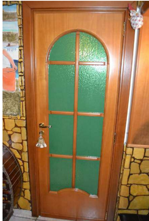
Imm. 20-21 Vista della caldaia installata nello spazio antistante l'abitazione al piano S-1 e delle porte interne, in legno con vetro con applicazione di pellicola coprente.