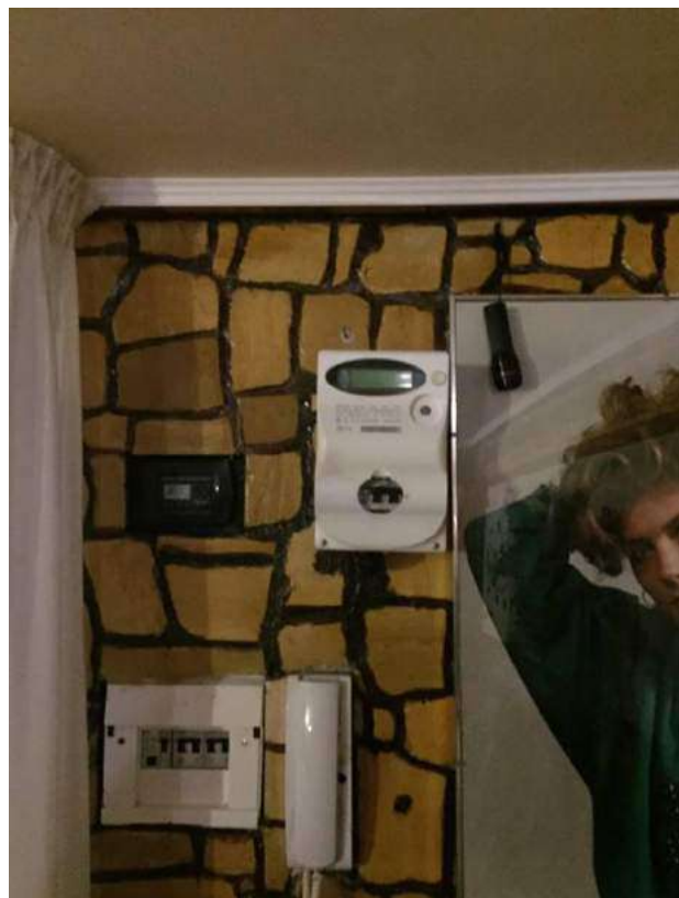
Imm. 18-19 Vista della pavimentazione in cotto con greca decorativa in pietra multicolore e rivestimento murario effetto pietra. Nella zona giorno sono presenti tutte le utenze e gli allacci.