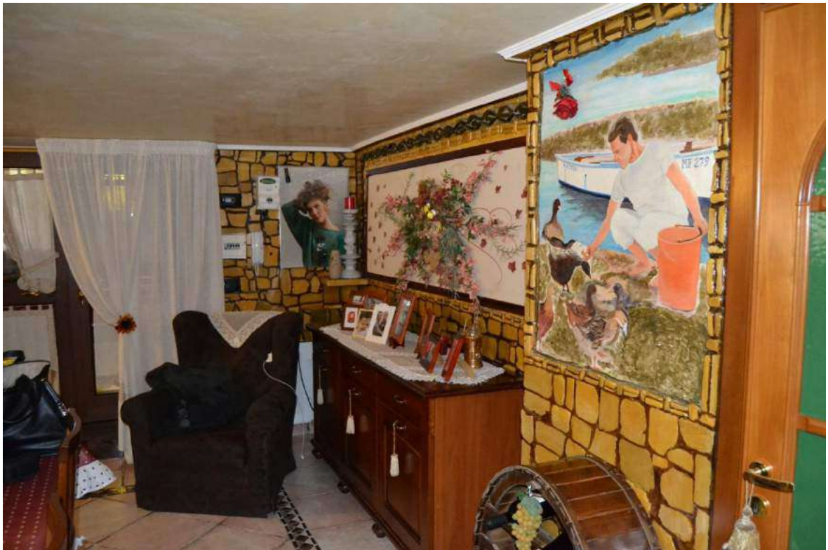
Imm. 9 Vista della porta d'ingresso all'abitazione, zona pranzo-soggiorno, con pareti rivestite effetto pietra a tutt'altezza, soffitti con stucco veneziano e pavimentazione in cotto.