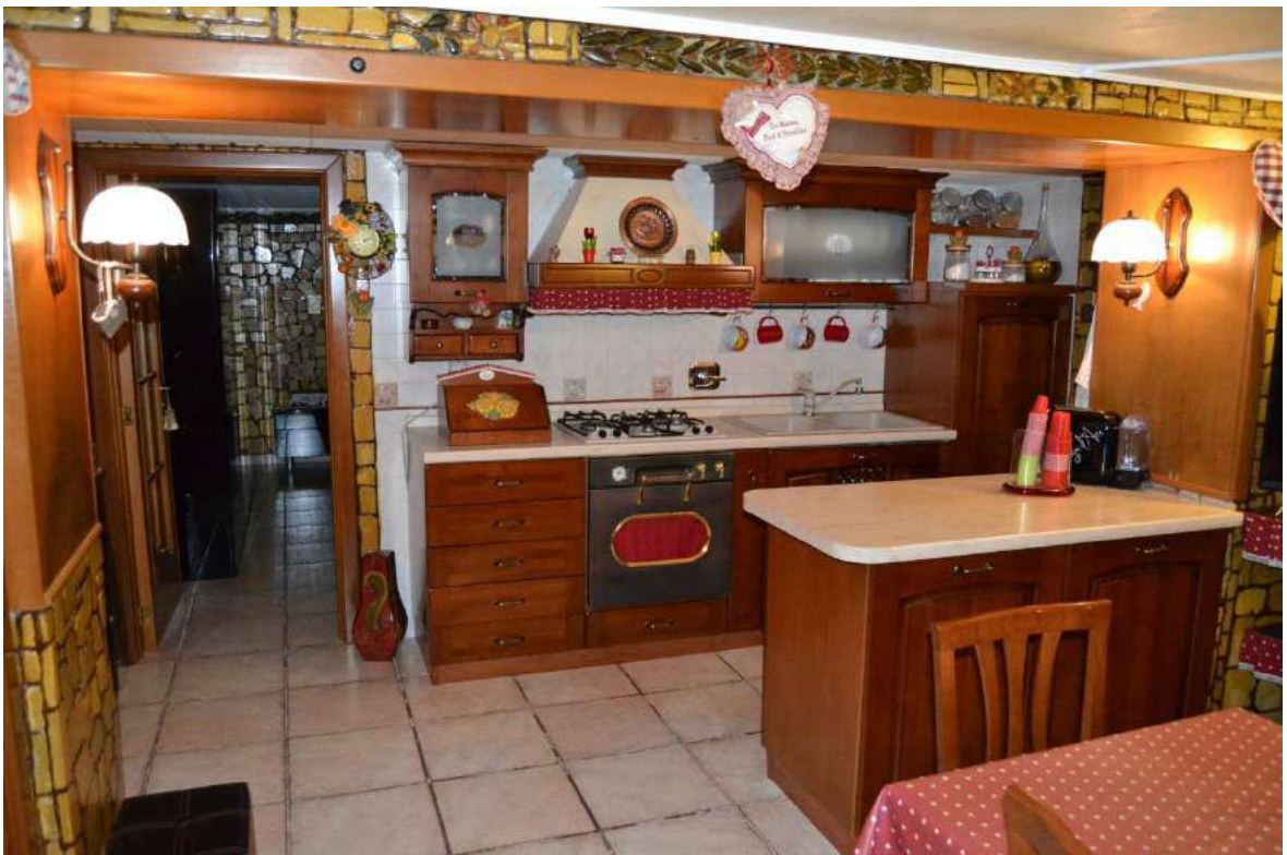
Imm. 10 Vista dell'angolo cottura con penisola aperto verso il soggiorno, parete con rivestimento in piastrelle di colore chiaro e imbotte trave in legno.