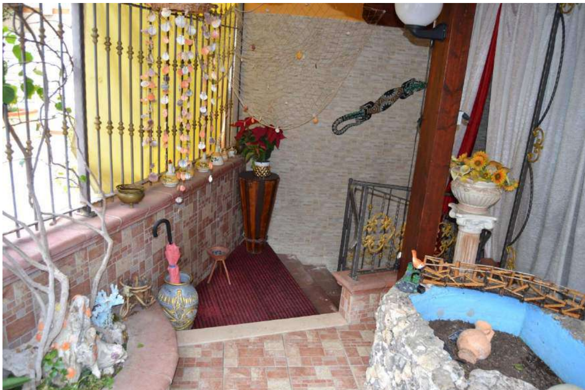
Imm. 6 Vista della scala che dal piano terra, conduce al piano seminterrato, abitazione dei sigg. SANTORO N. e DI CANDIA G.