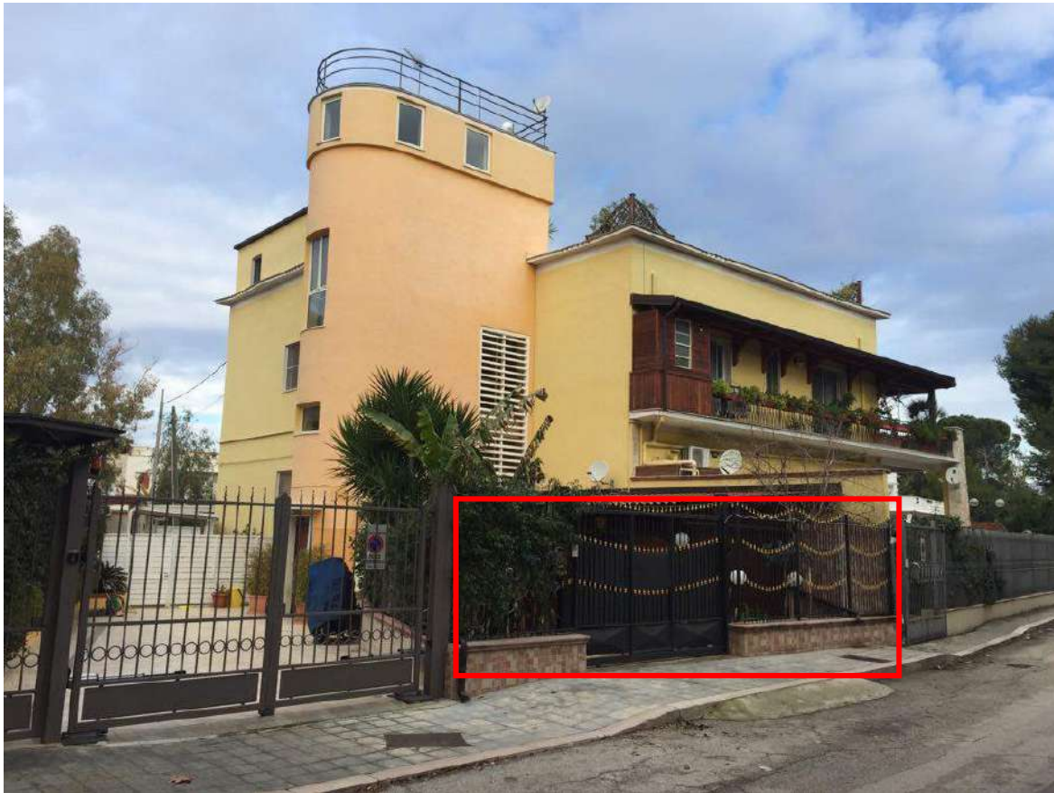
Imm. 1-2 Vista dell'abitazione oggetto del presente pignoramento, sita in loc. Siponto nel Comune di Manfredonia, alla via Pini n.2, piano T e S-1, identificata all'NCEU al foglio 39 p.lla 3041 sub 20-21 (ex 7-14);