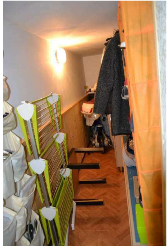
Imm. 14-15 Vista della dispensa ricavata in una nicchia della cucina e del ripostiglio con accesso dalla cameretta.