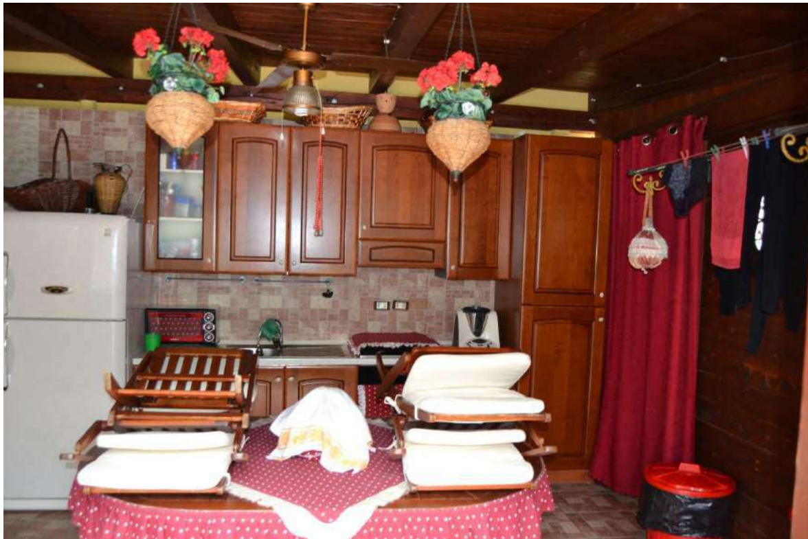
Imm. 7 Vista della cucina abitabile al piano terra, con lavanderia sulla dx, realizzata con struttura di legno sull'area del giardino adiacente all'abitazione.