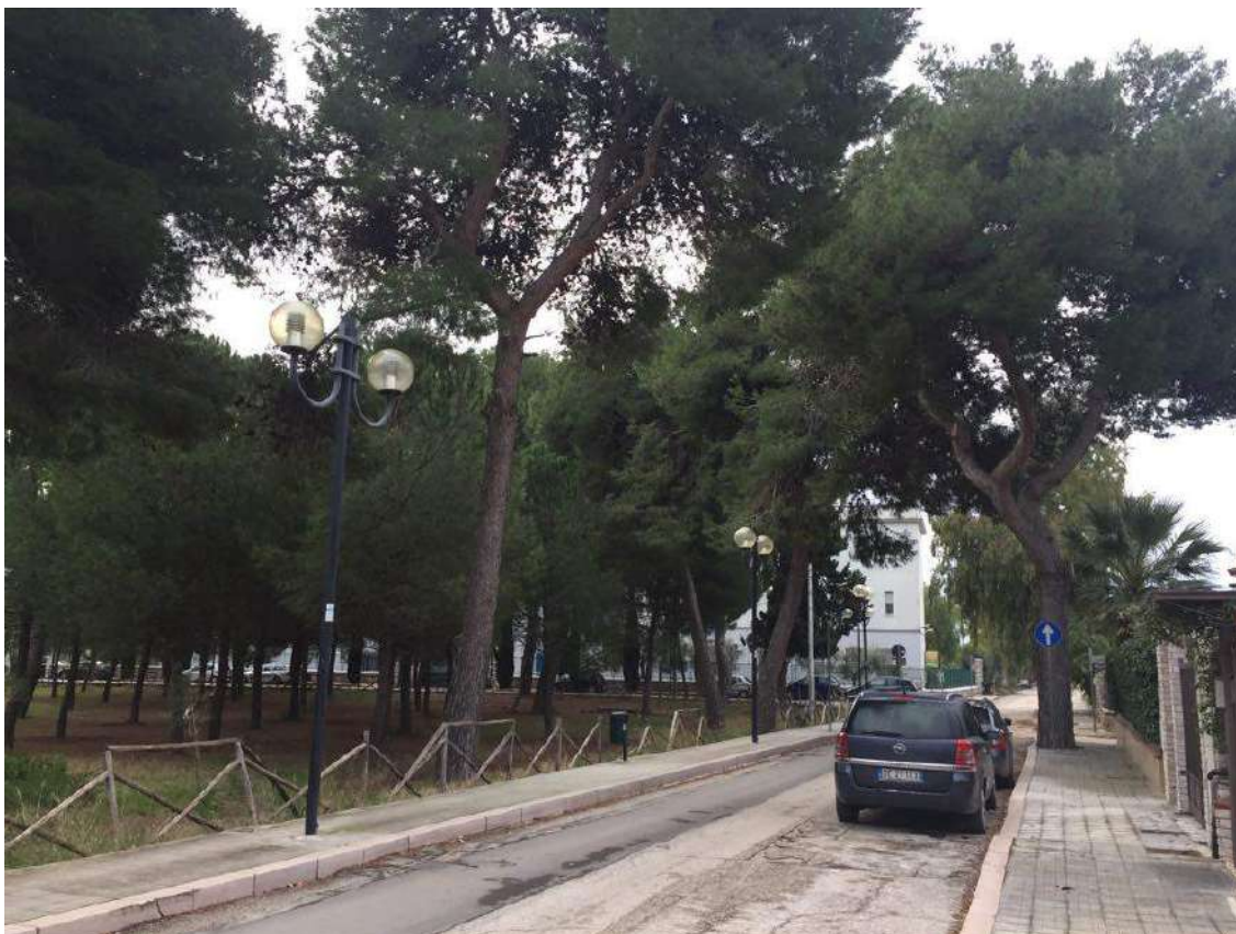
Imm. 4 Vista della via di accesso all'immobile, sito al piano terra di un fabbricato residenziale, in via dei Pini, al civ. n.2, con ingresso indipendente da giardino.