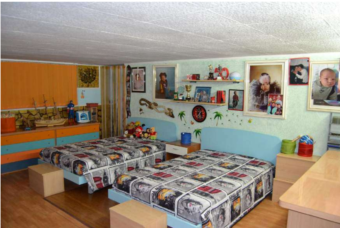
Imm. 16 Vista della cameretta, con porta del ripostiglio e finestra. Pareti in stucco di color celeste e pavimentazione in laminato effetto parquet.