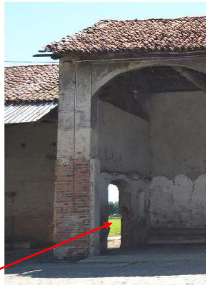
Porta ingresso realizzata