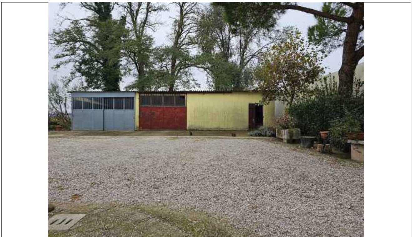
56 Veduta verso i depositi attrezzi e porcile; a Sinistra si nota la porzione di fabbricato in con apertura in metallo grigio, realizzata abusivamente e da rimuovere;