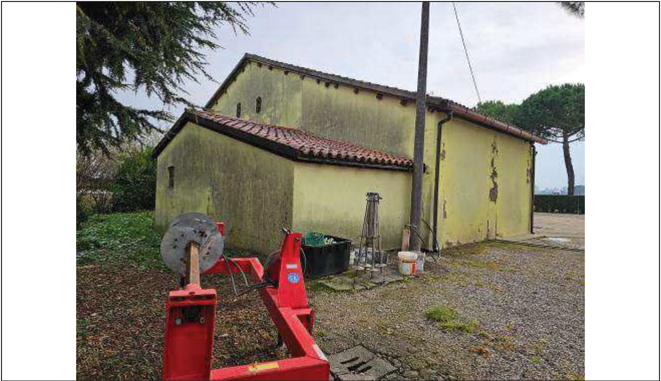
07 Vista dell'angolo Ovest della stalla e ricovero attrezzi;