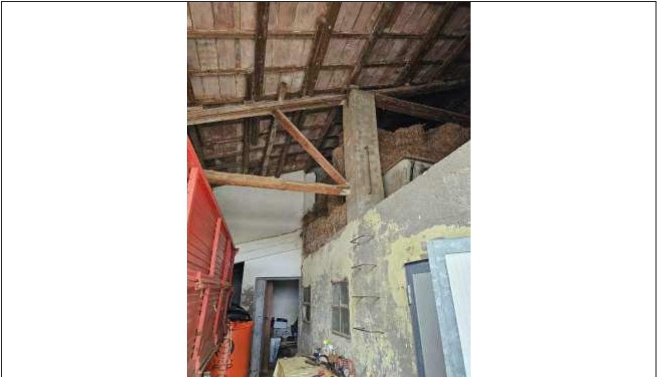
47 Vista dal portico verso il fienile collocato sopra il solaio della stalla ed accessibile mediante scale a pioli;