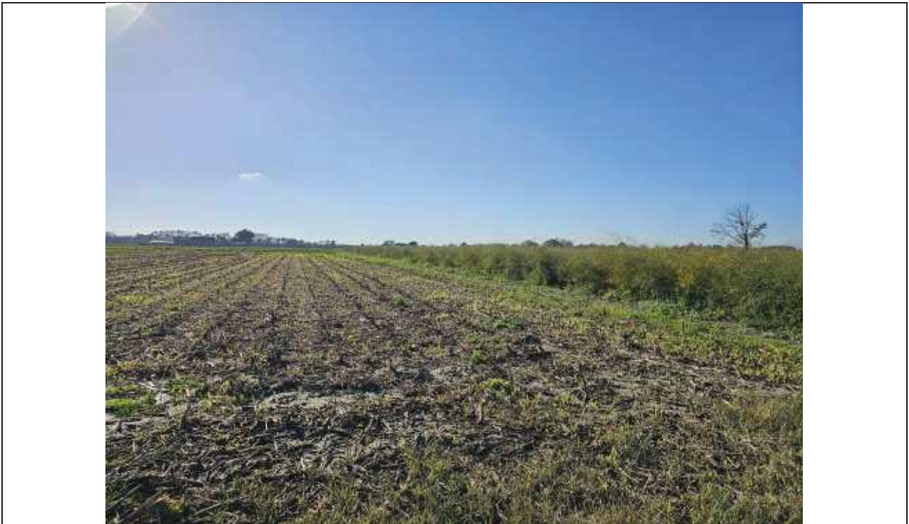
78 Vista della particella 169.