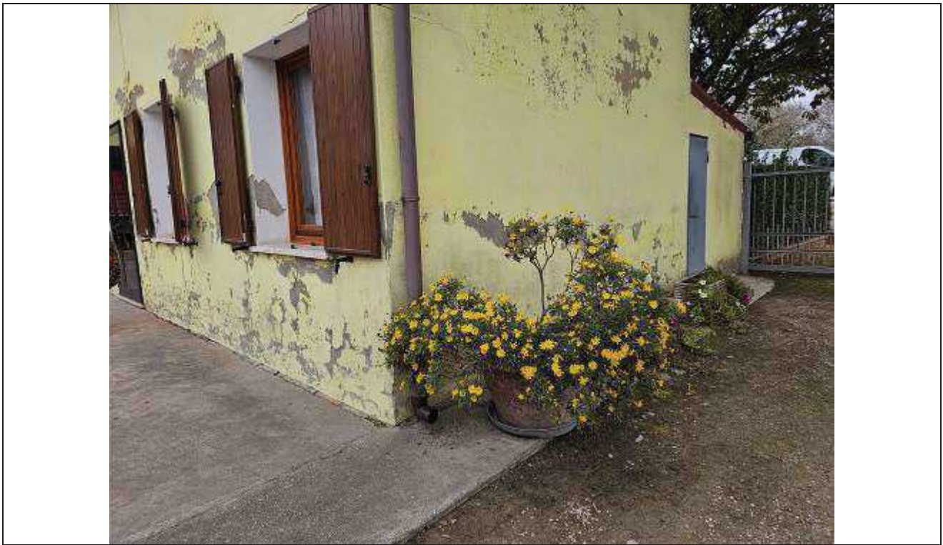
37 Vista del fabbricato rurale angolo Sud-Est con particolare dell'ingresso esterno al vano Ripostiglio;