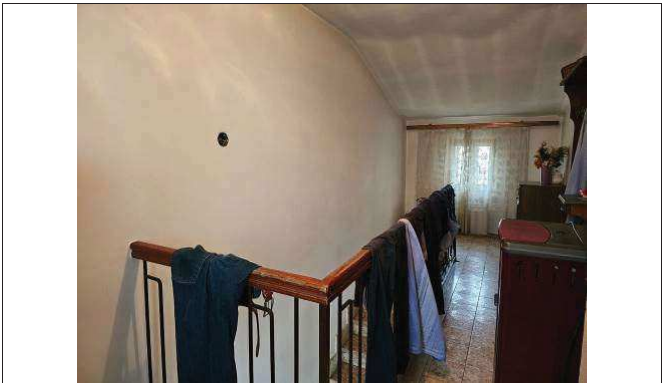
36 Vista del disimpegno verso il vano scale;