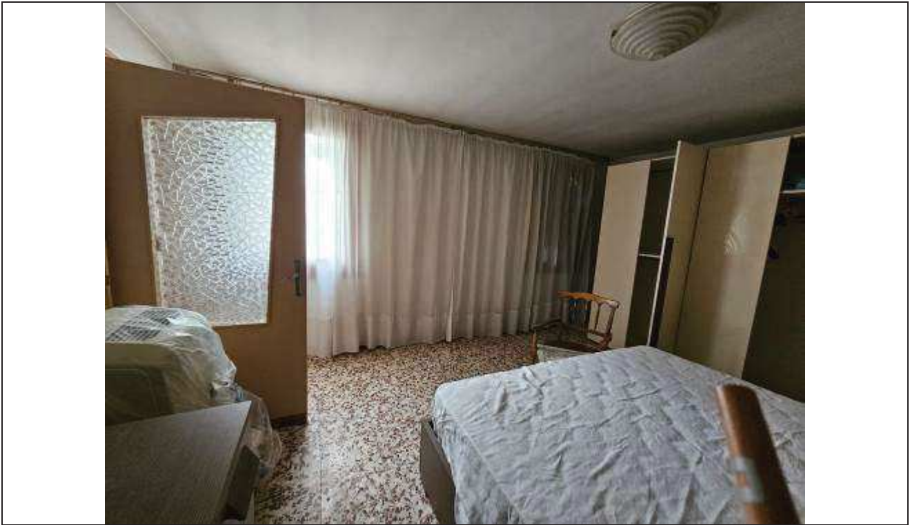
19 Vista del locale pranzo, attualmente adibita a camera da letto;