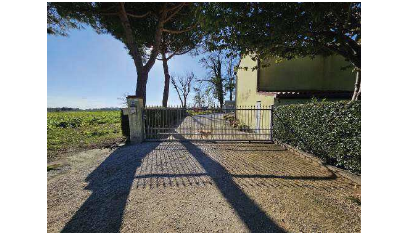
01 Vista della piazzola di sosta interposta tra l’accesso carraio e la SS 309 (via Romea);

-C.T.: fg. 42, part. n. 77, part. n. 494, part. n. 82 e part. n. 169