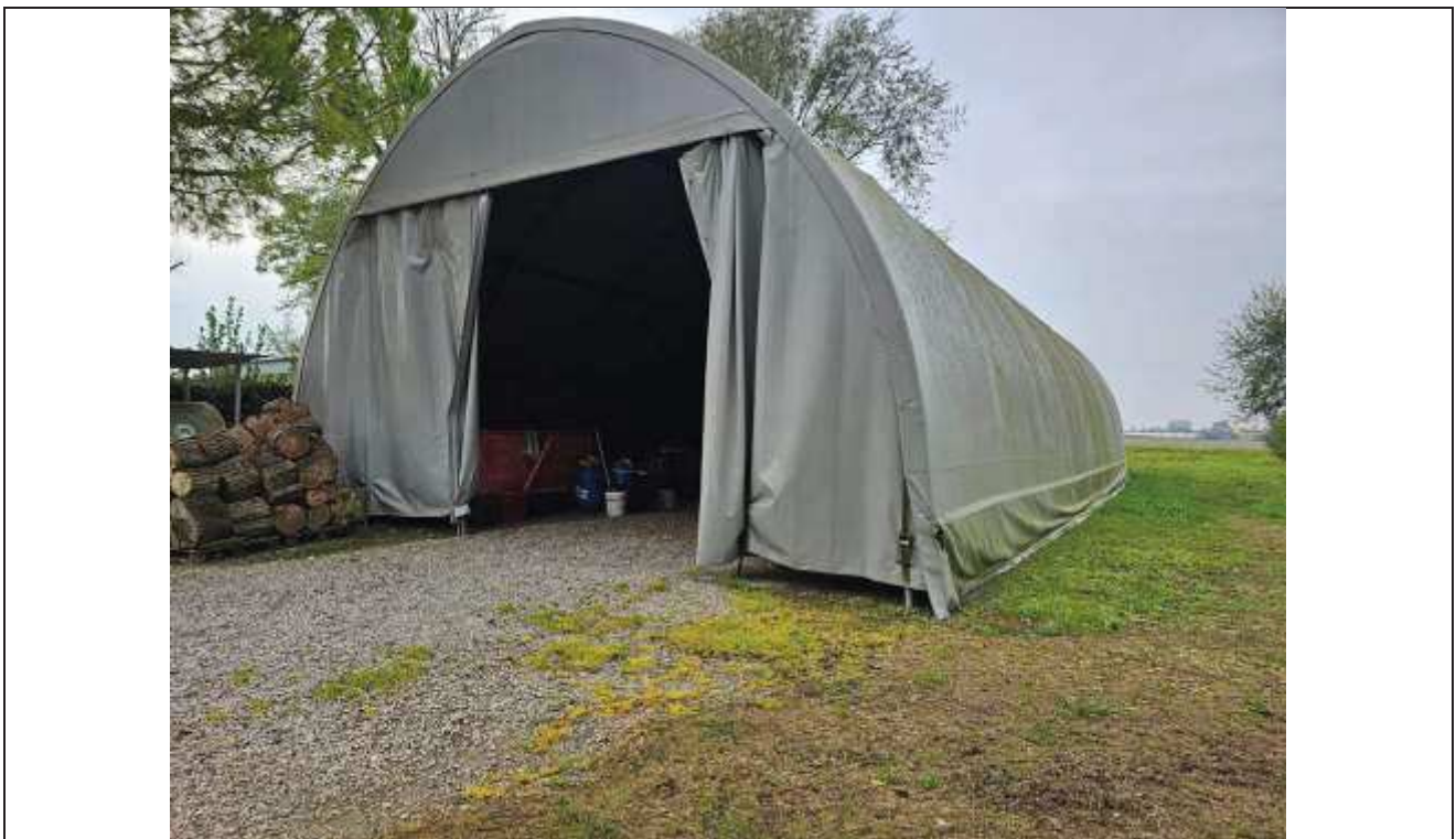
68 Vista della tensostruttura rimovibile adibita a deposito attrezzi e non autorizzata;