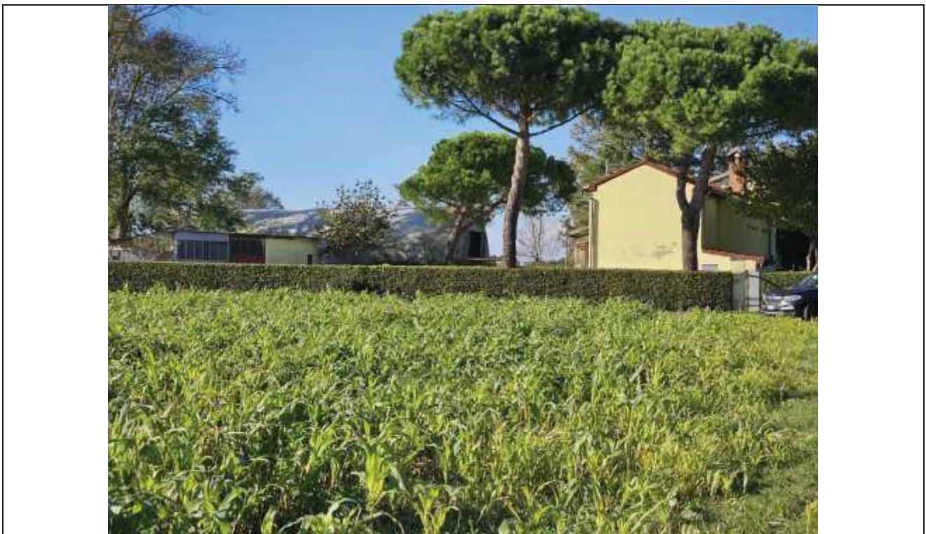
76 Vista del fabbricato rurale e annessi agricoli, dalla particella n. 82;