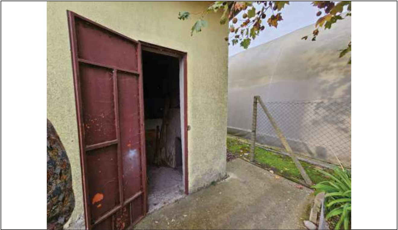
65 Vista dell'accesso al porcile;