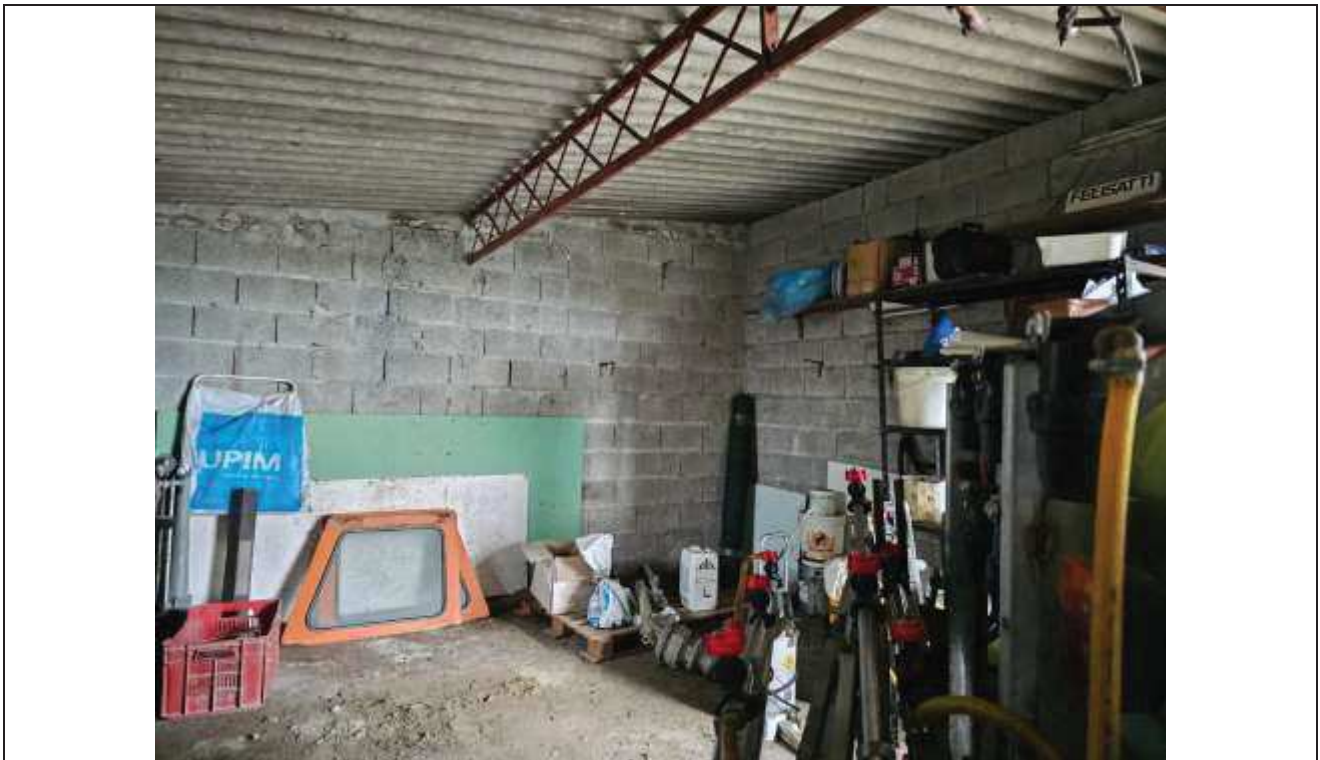
63 Altra vista interna del deposito attrezzi;