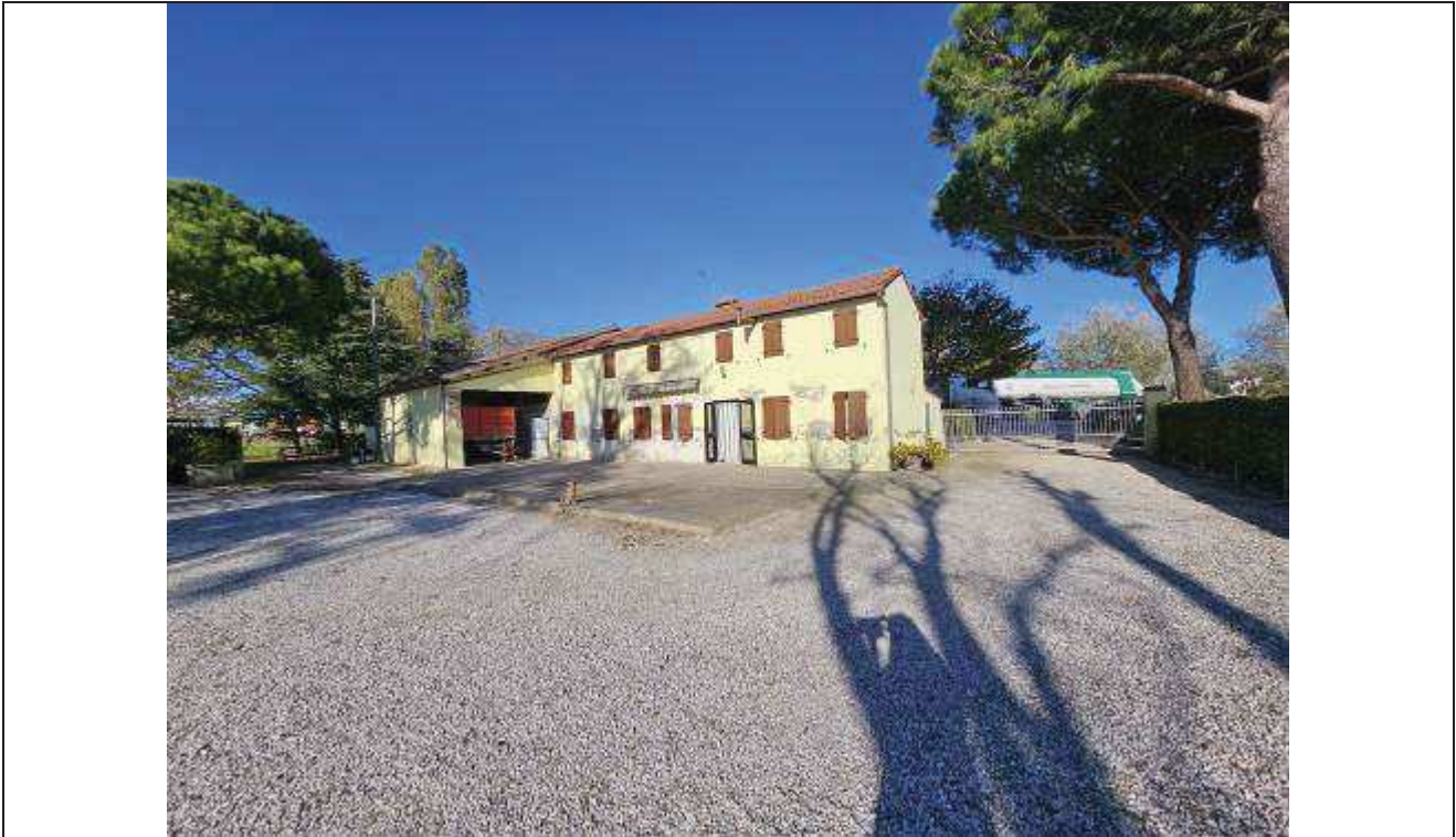
05 Vista del fabbricato rurale lato Sud;