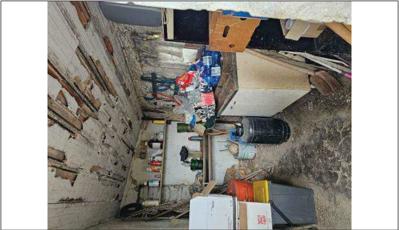
39 Vista interna del ripostiglio;