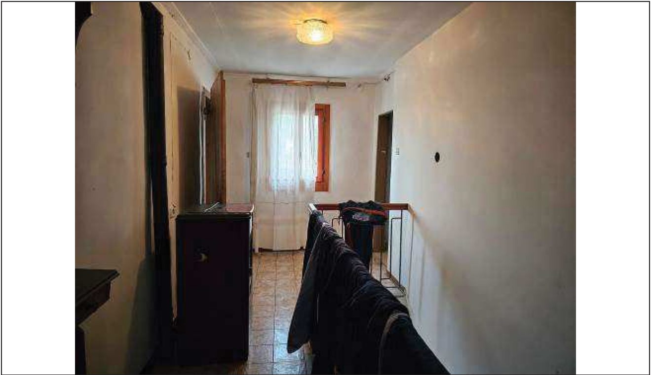
27 Vista dal disimpegno al piano primo;