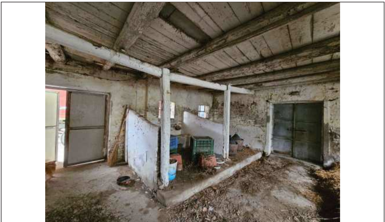
54 Vista interna della stalla e della seconda porta collocata a Nord-Ovest del fabbricato;