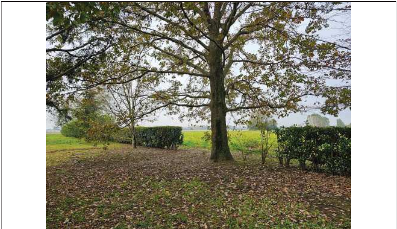
69 Veduta dei terreni agricoli a Nord-Ovest del fabbricato rurale;