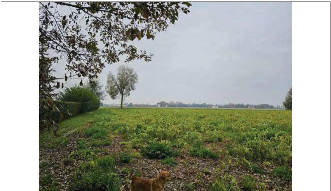
70 Vista dei terreni agricoli -particella n. 77; a Sinistra la siepe di delimitazione dell'area di pertinenza dei fabbricati rurali;