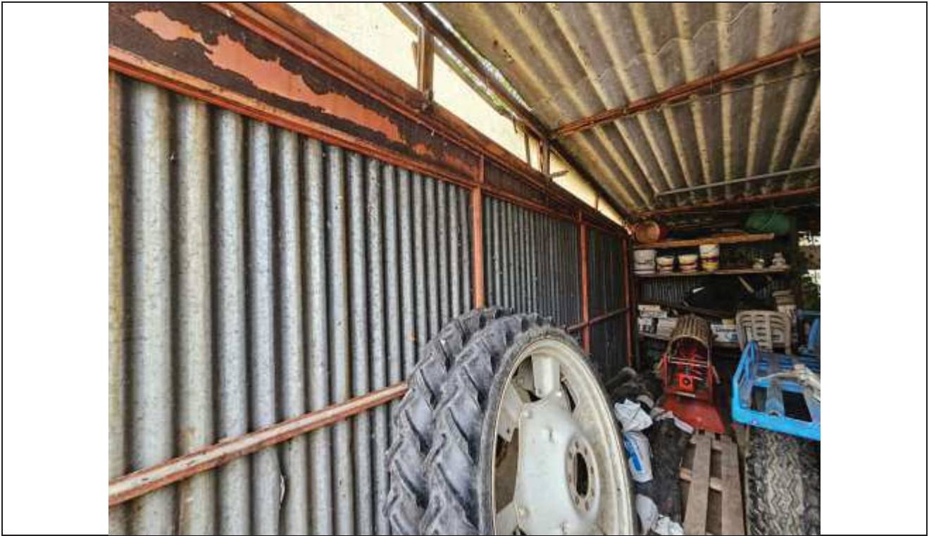
59 Vista interna del deposito attrezzi abusivo;