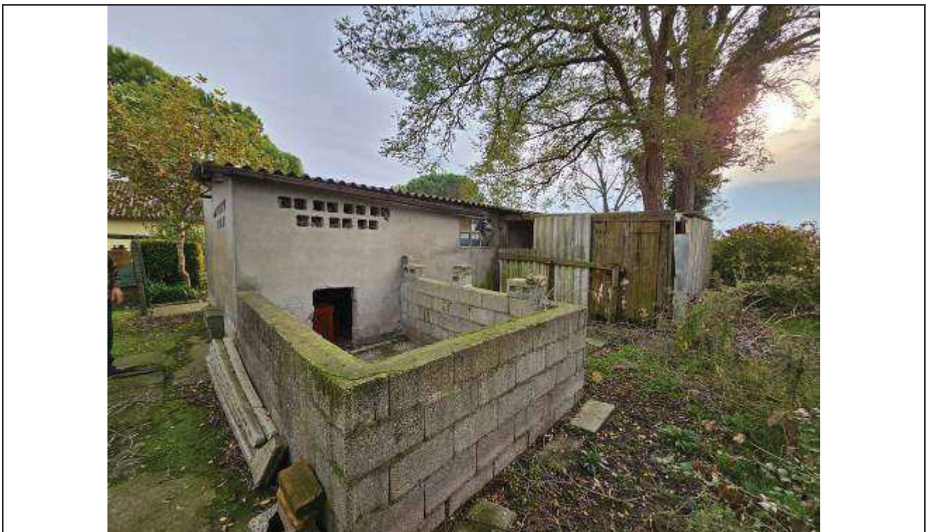
12 Vista del dell'angolo Ovest del deposito attrezzi con manufatto in legno realizzato abusivamente, oggetto di demolizione;