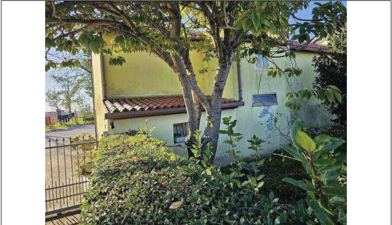
03 Vista del prospetto Nord-Est del fabbricato rurale (porzione residenziale);