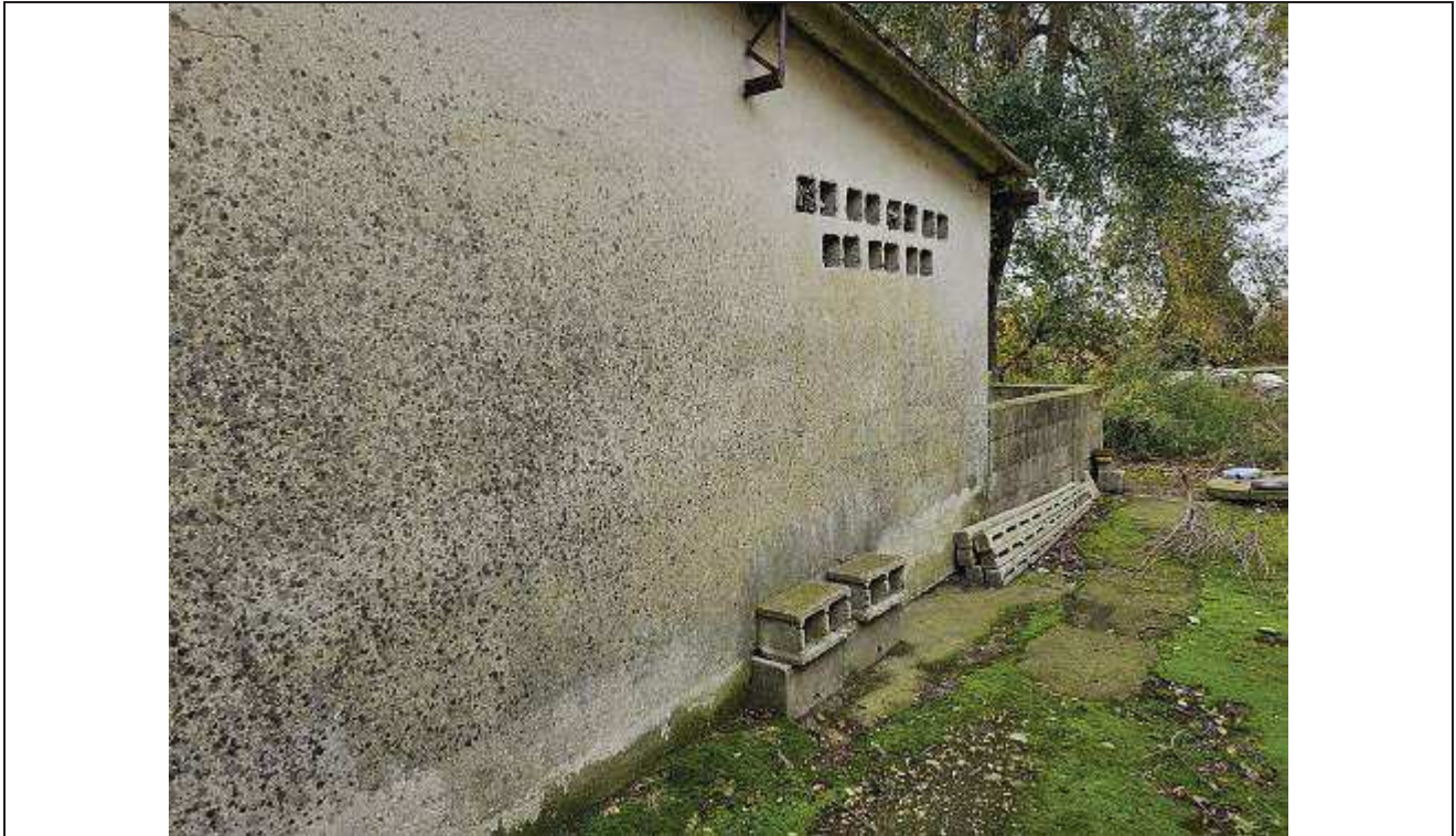
11 Vista del prospetto Est del porcile;