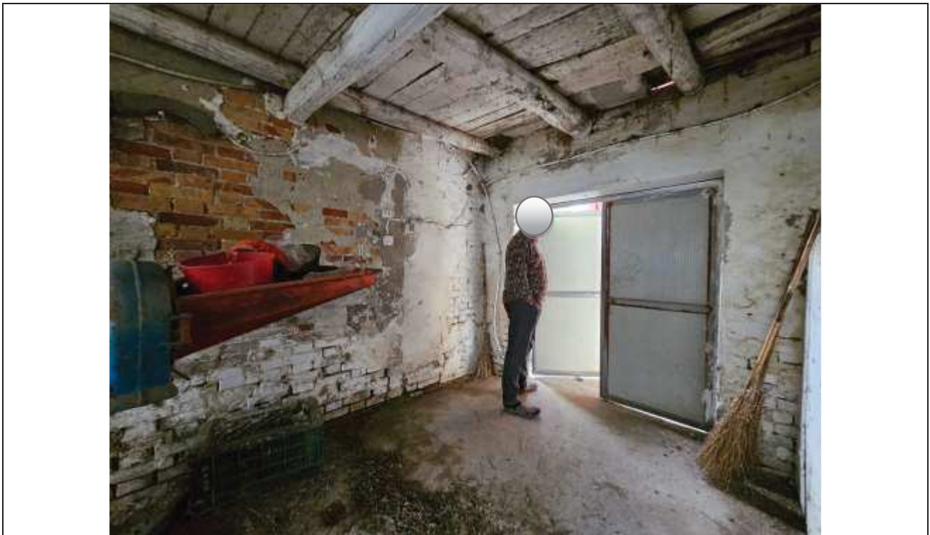
53 Vista interna della stalla verso la porta d'ingresso accessibile dal portico;