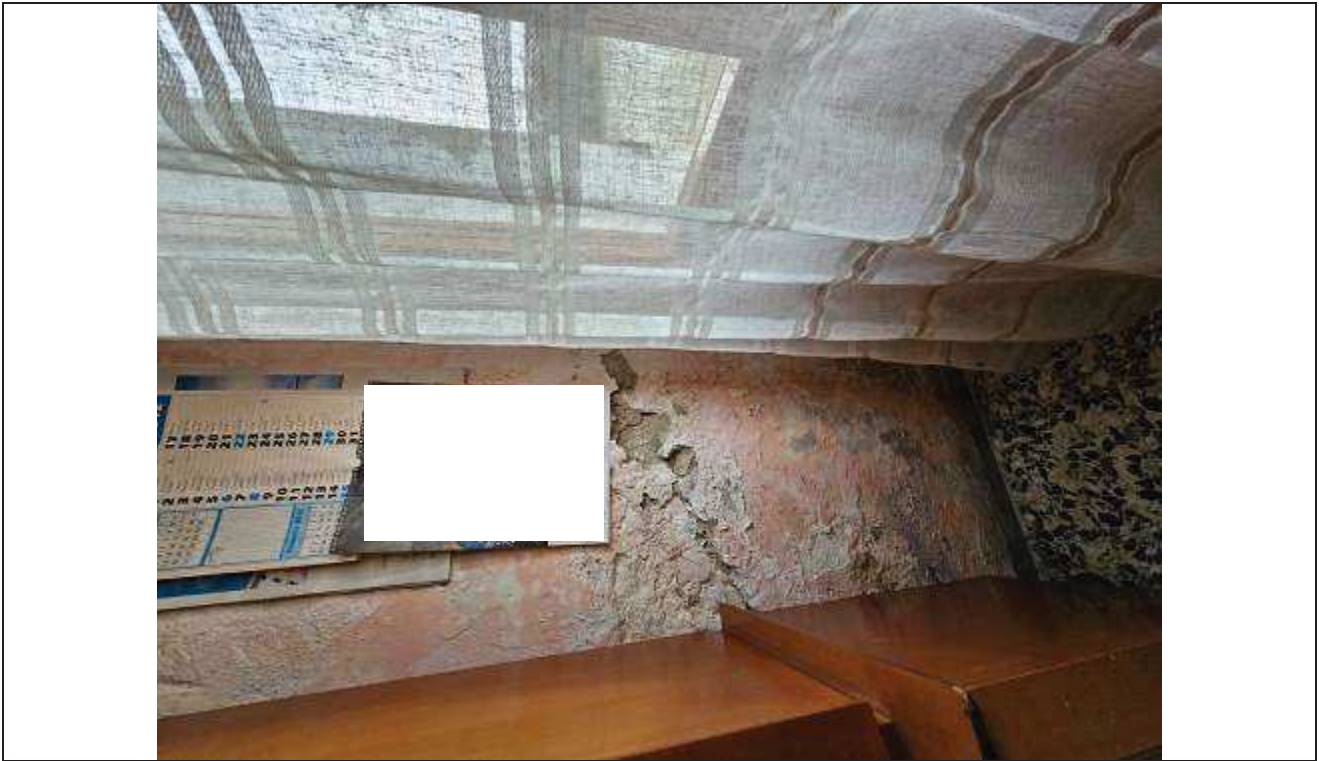
23 Particolare delle fessurazioni e del distacco dell'intonaco sulla parete interna del soggiorno;