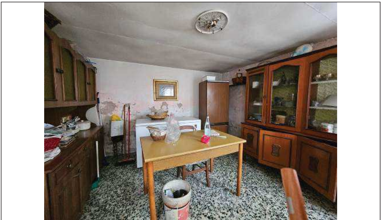
22 Vista del soggiorno;