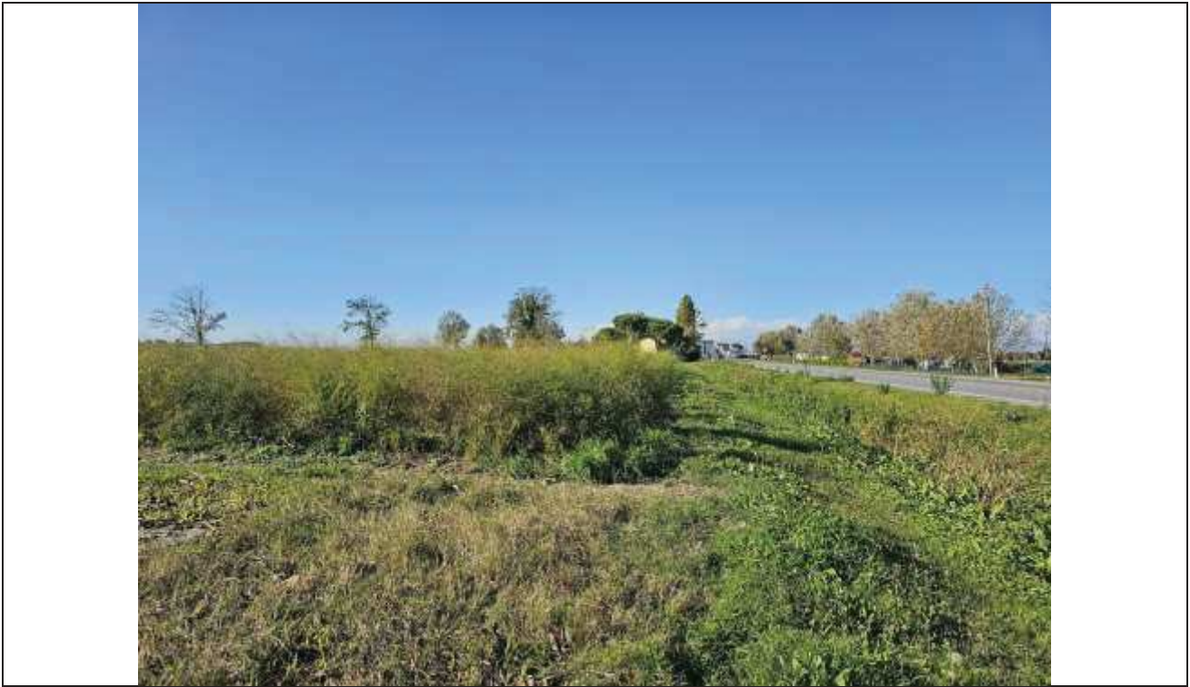
77 Vista dei terreni agricoli ( particella n. 169, particella n. 82) prospettanti la Via Romea;