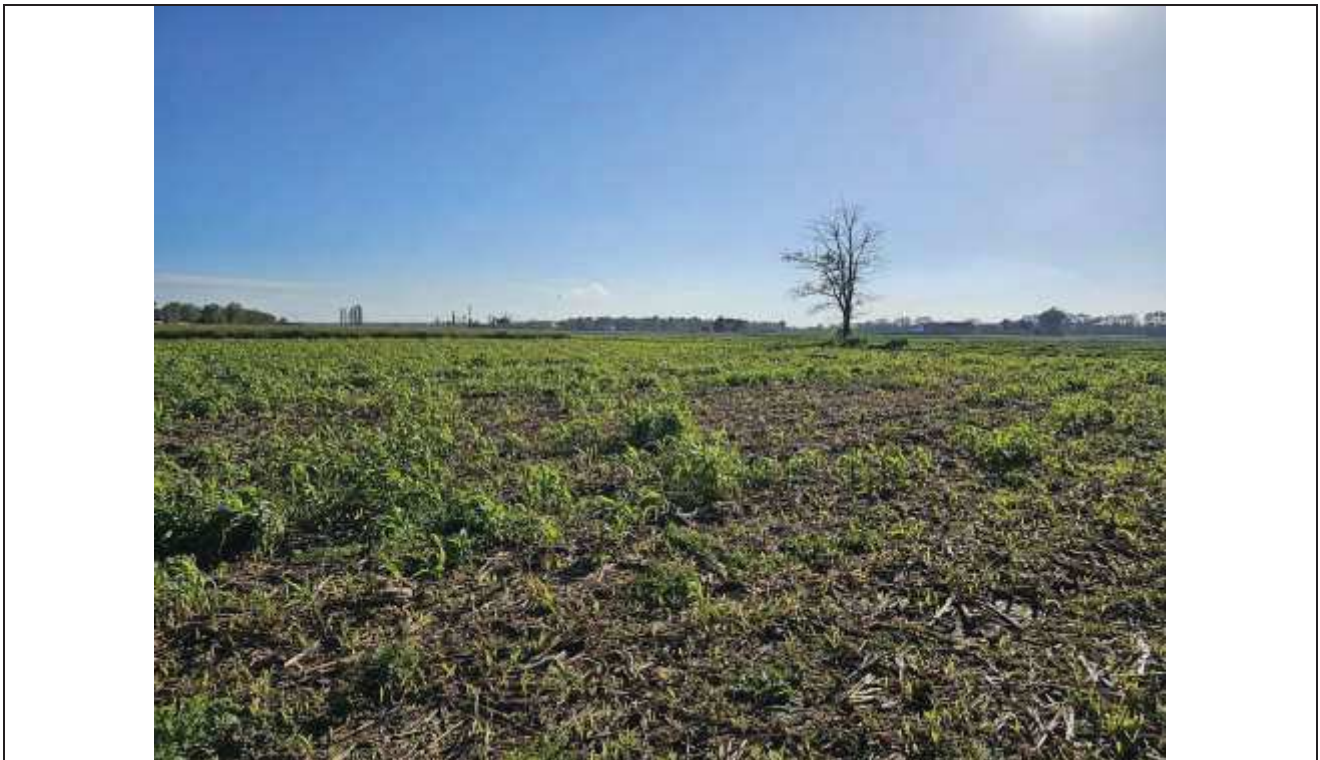
73 Altra vista della particella n. 494;