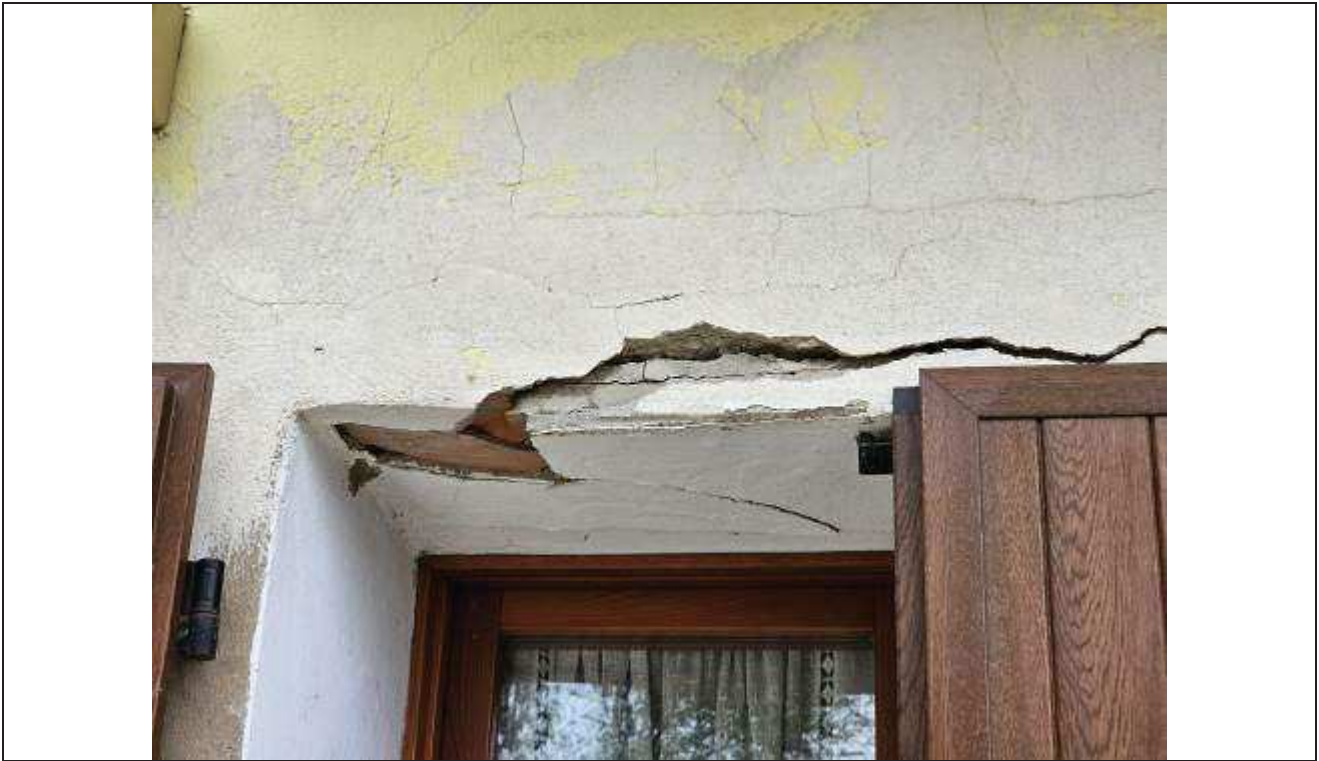
41 Altro particolare del distacco degli intonaci e architrave finestra al piano terra;