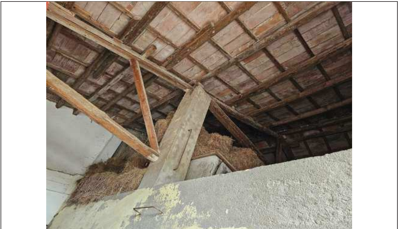
48 Altra vista del fienile;