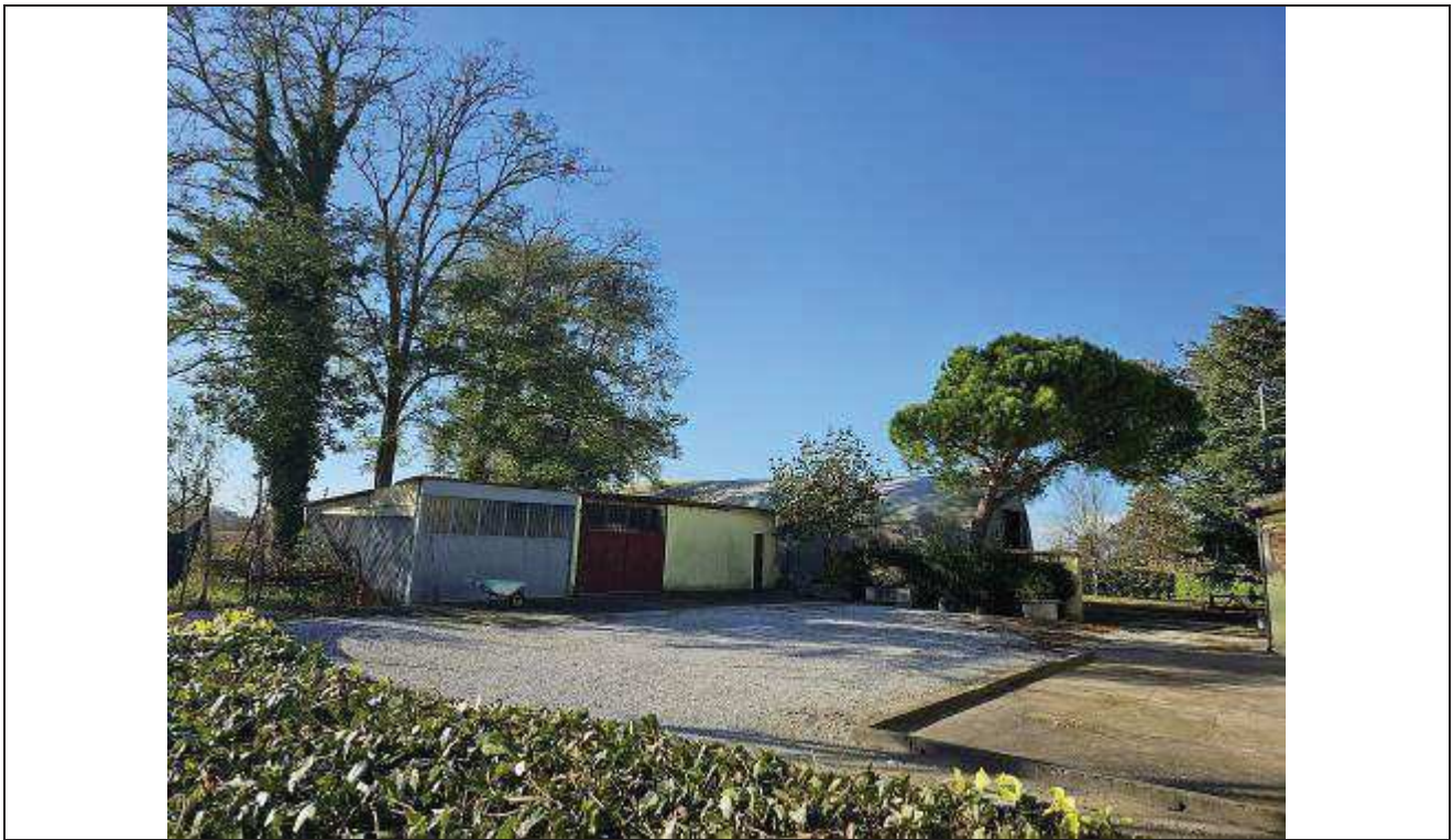
09 Vista del ricovero attrezzi e della porzione realizzata con struttura in lastre in lamiera ondulata, priva di autorizzazione;