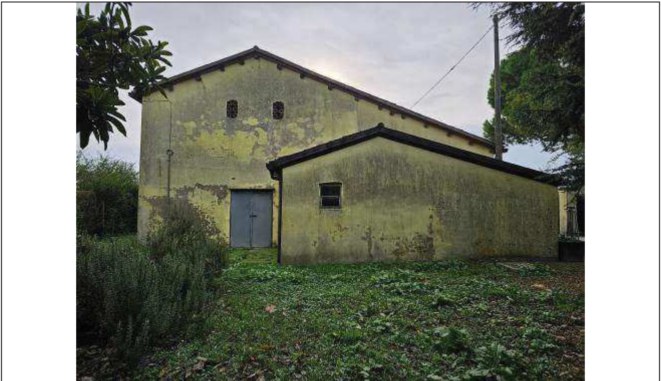
08 Vista del prospetto Nord-Ovest del fabbricato rurale, lato stalla;