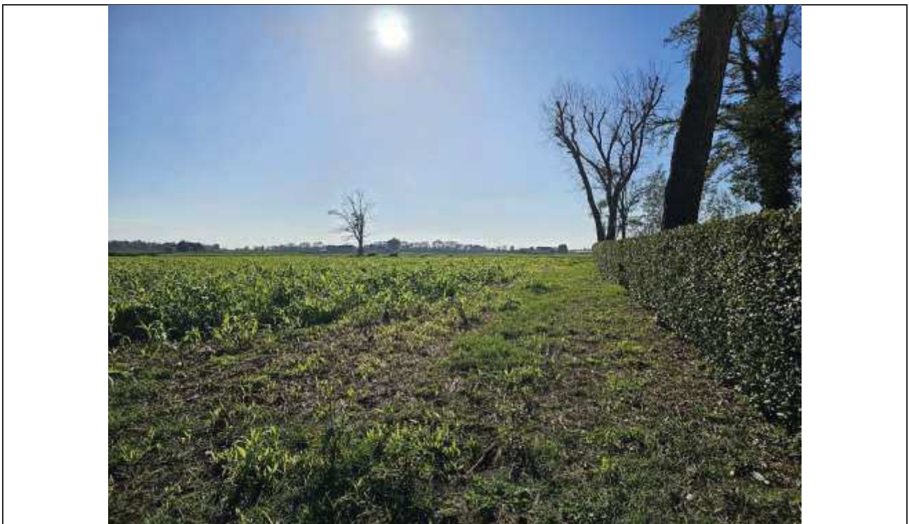
74 Vista della particella n. 82; a destra si nota la siepe di delimitazione dell'area di pertinenza dei fabbricati rurali;