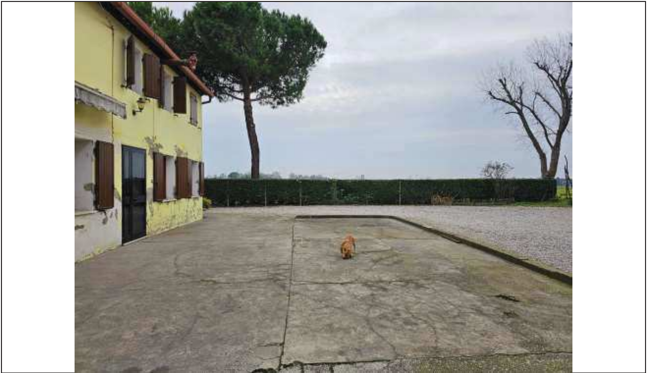
15 Vista dell'area cortilizia pavimentata parte in cemento liscio e parte in ghiaio;