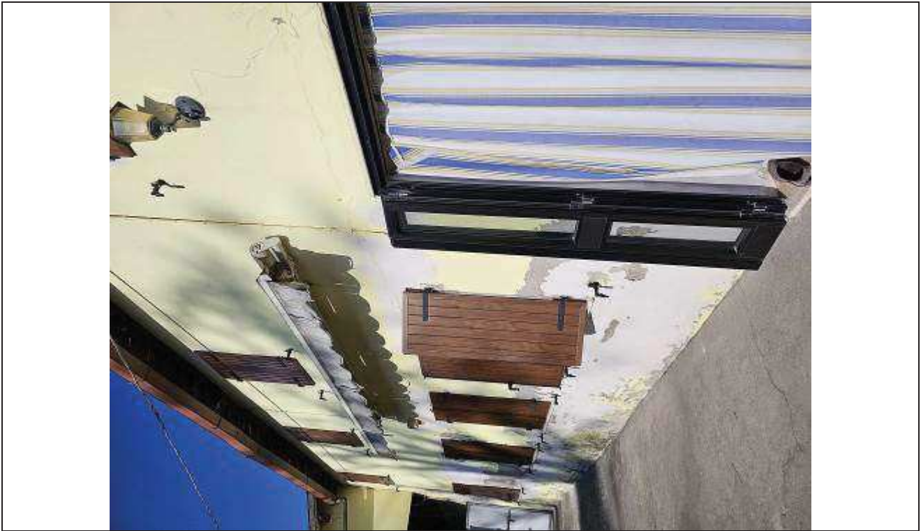
16 Vista dell'ingresso al fabbricato rurale lato Sud-Ovest;