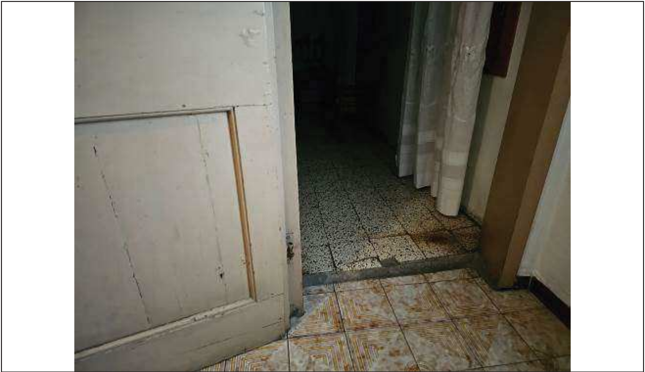
29 Particolare della pavimentazione con gradino dal disimpegno verso la camera da letto;