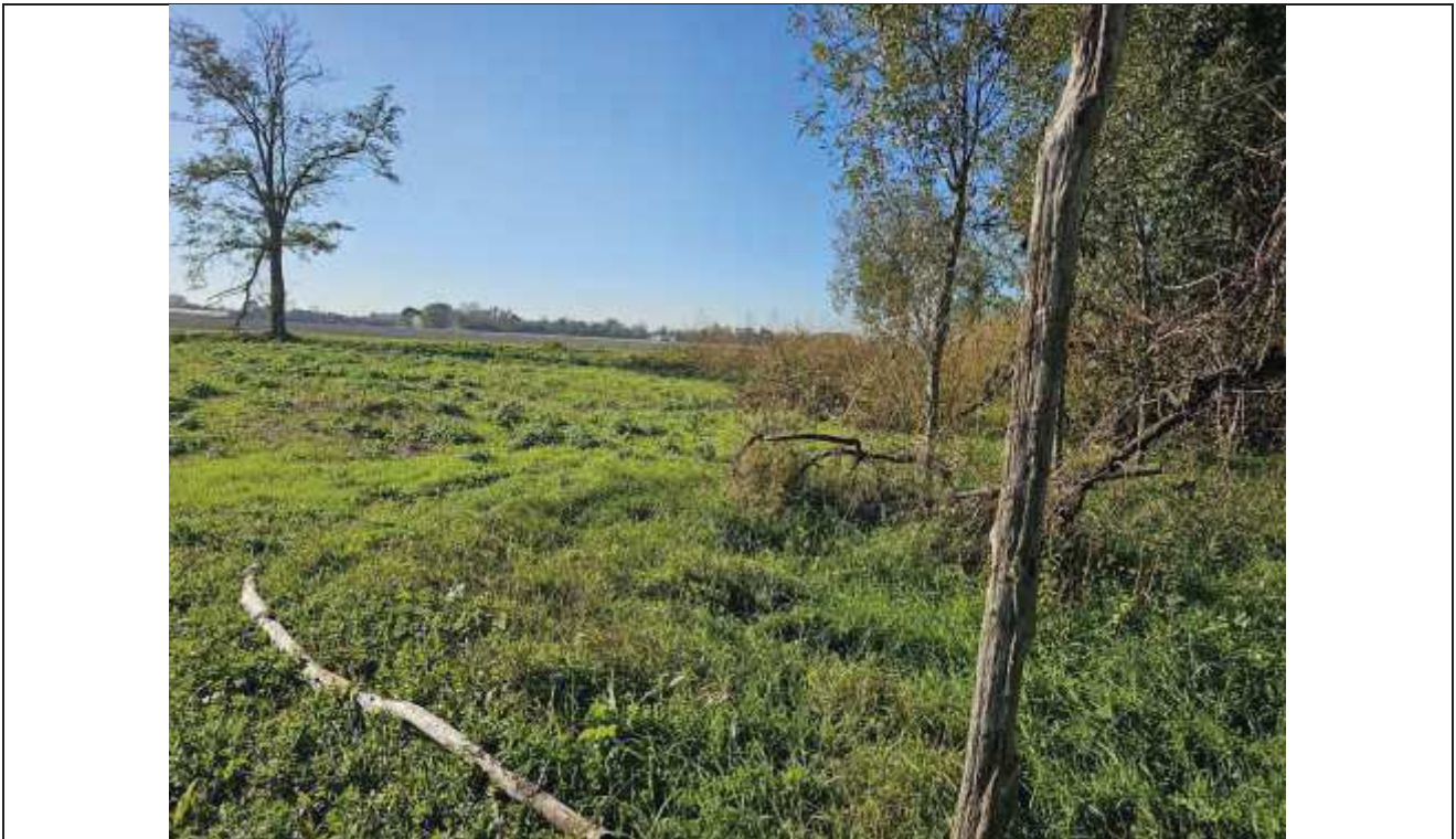
72 Vista della particella n. 494 verso la particella 77;