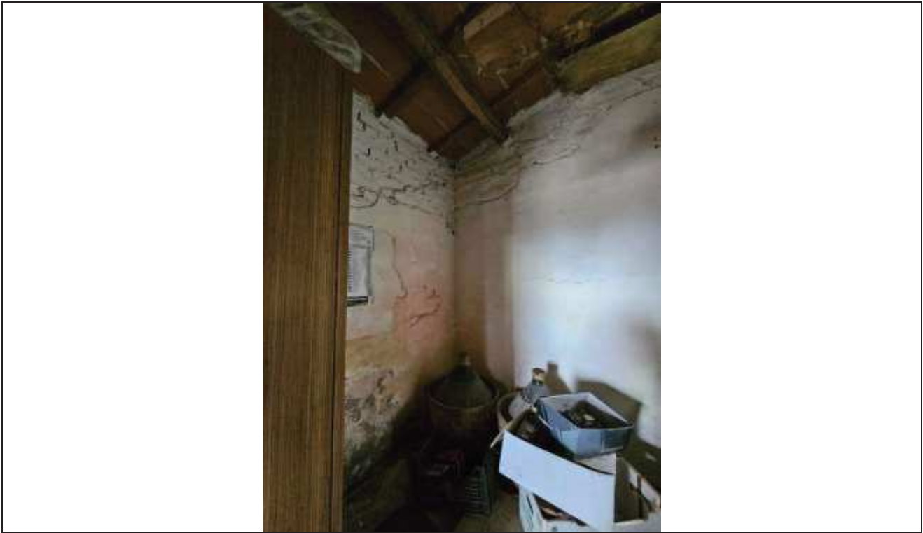
51 Vista della cantina accessibile dal portico;