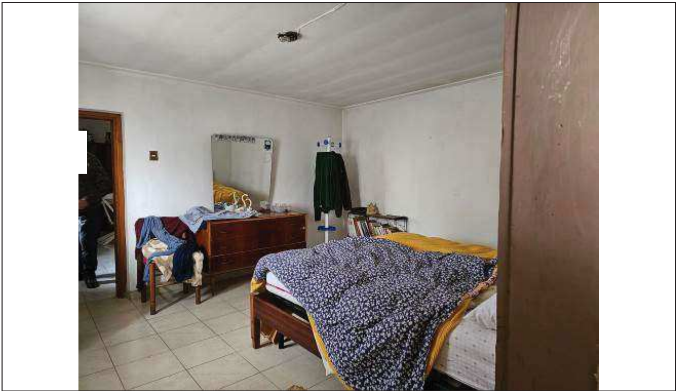
33 Altra vista dall'interno della camera da letto verso la porta che collega ad una terza camera;