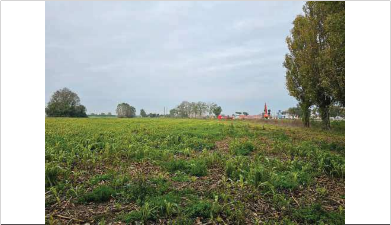
71 Vista della particella n. 77, verso la Strada Statale Romea;