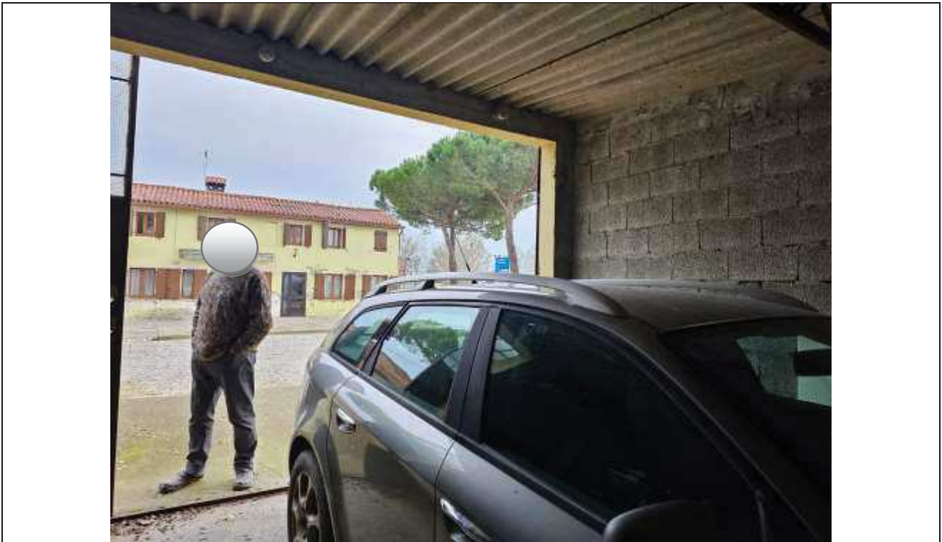
62 Vista interna del deposito attrezzi, verso la corte esterna;