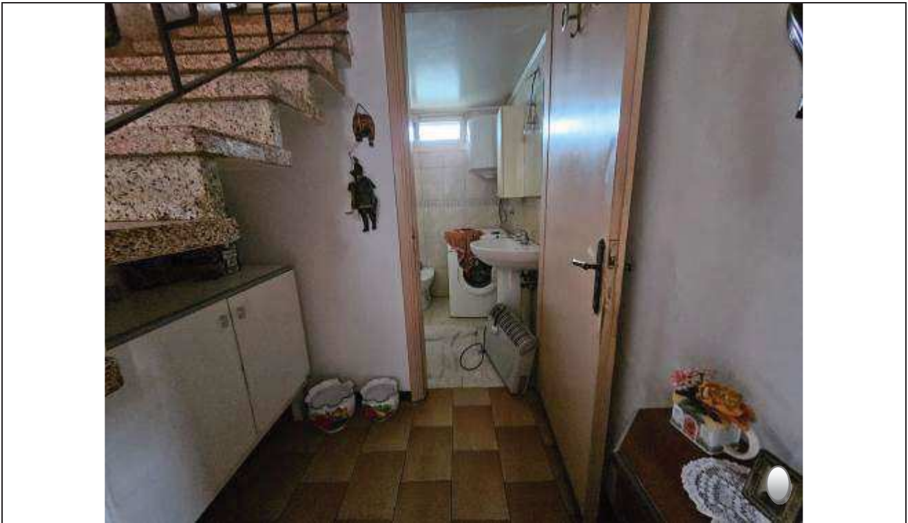
20 Vista del bagno dall'ingresso;