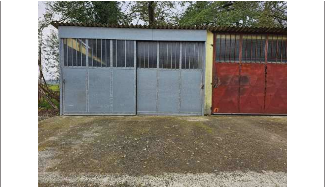
58 Vista del prospetto Nord della porzione in abuso;