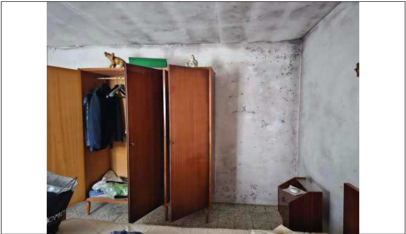
31 Altra vista della camera da letto;