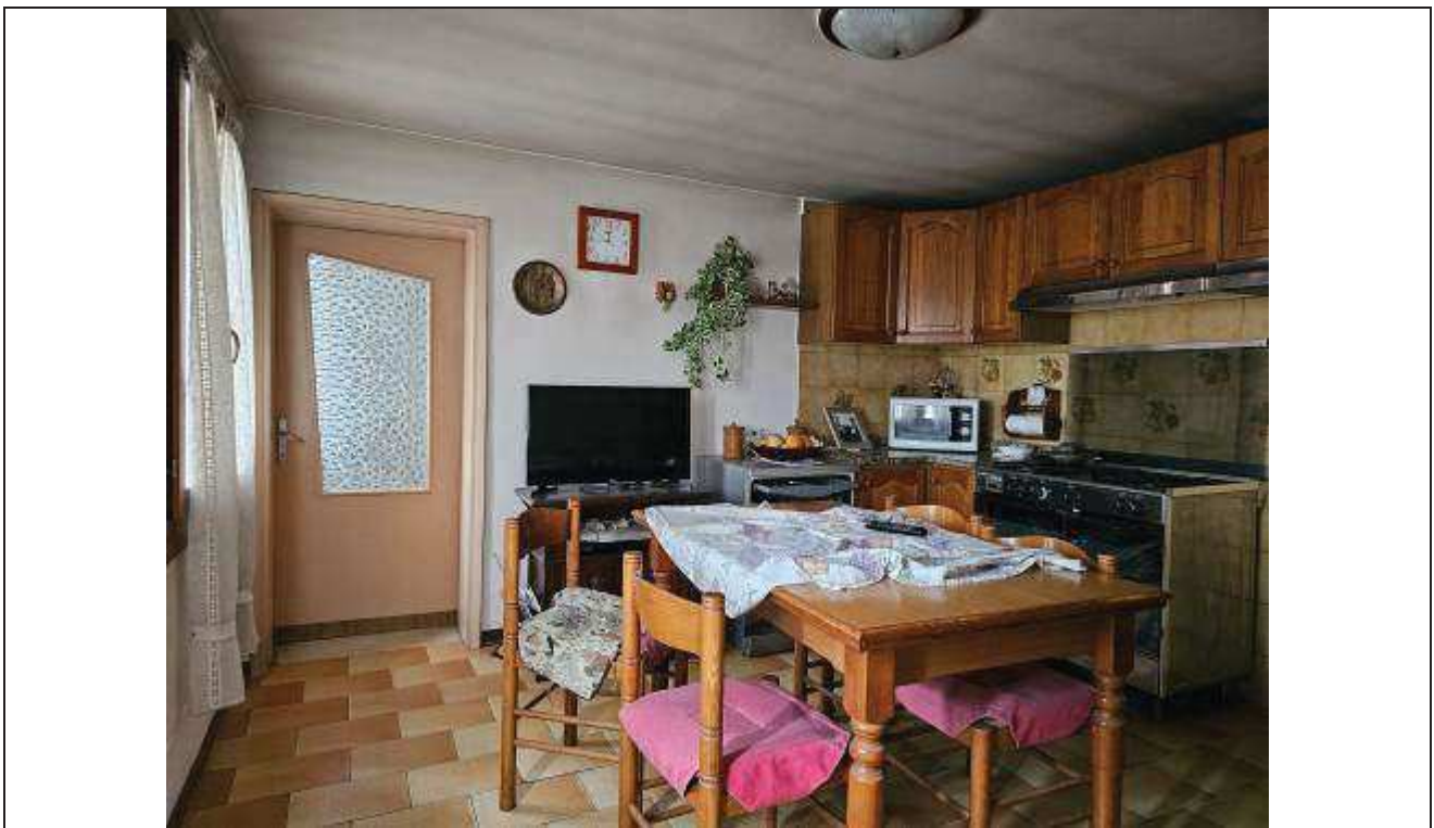
18 Vista del locale cucina;