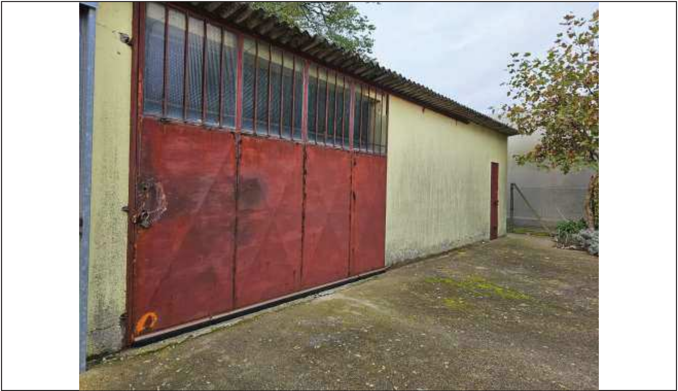
61 Vista del prospetto Nord del deposito attrezzi;