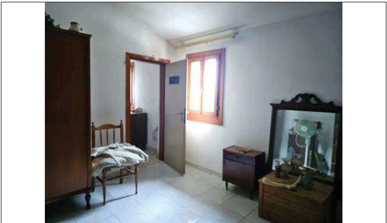
34 Vista dell'ultima camera da letto;