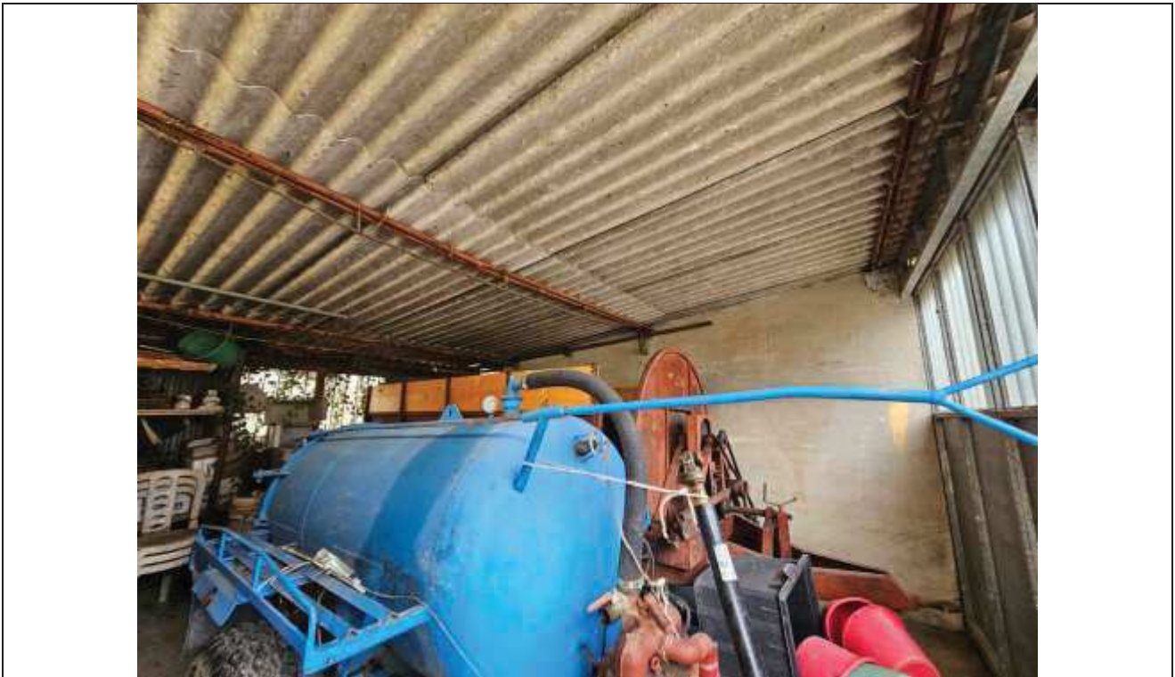
60 Altra vista interna dell'abuso;