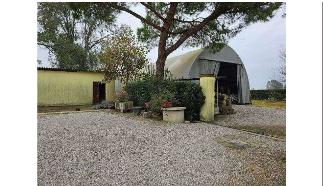
10 Vista dell'accesso al porcile e alla tensostruttura rimovibile non autorizzata, adibita a deposito attrezzi;