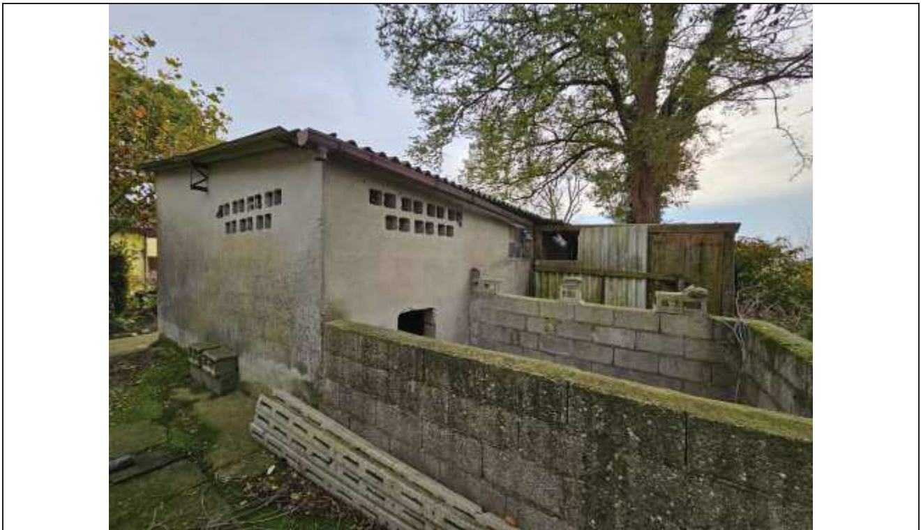
67 Vista dell'angolo Sud-Ovest del porcile e del deposito attrezzi;