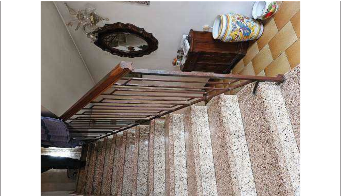
26 Vista del vano scale dall'ingresso;