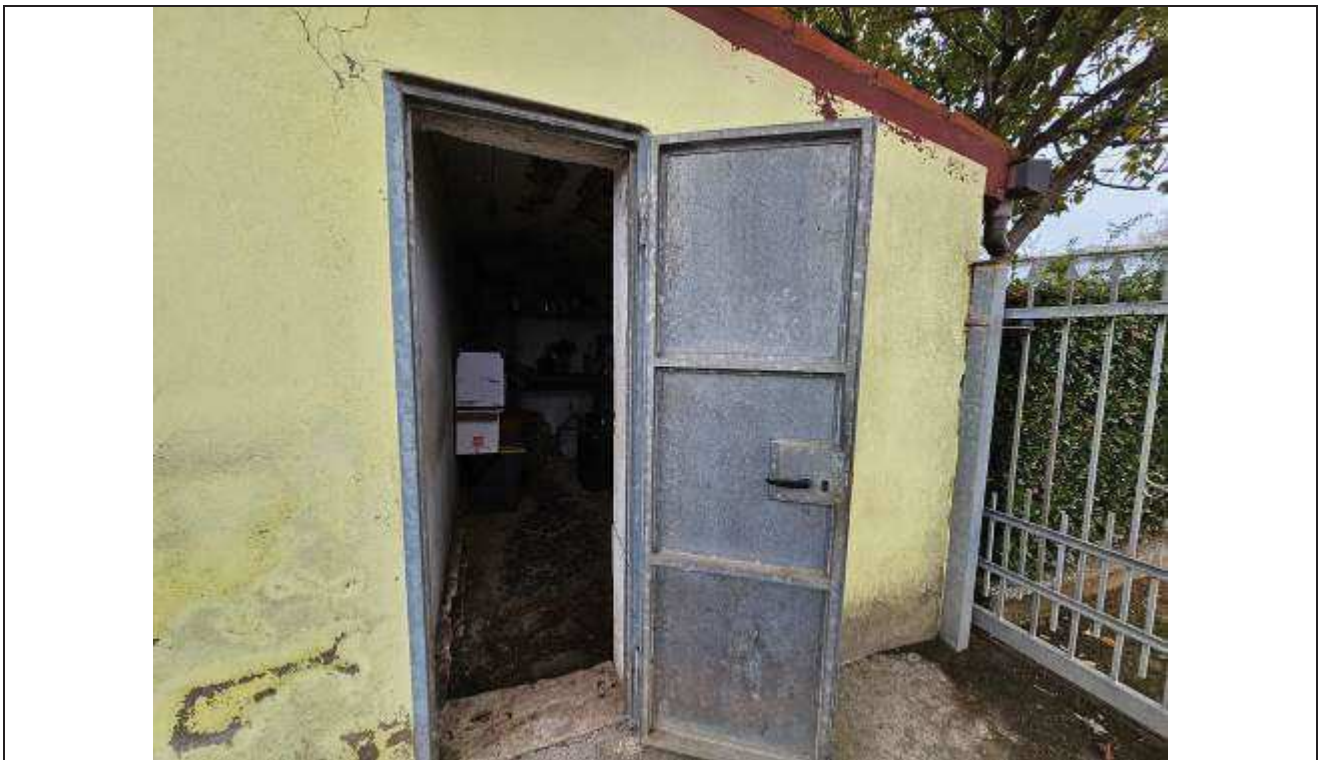
38 Vista del ripostiglio sul lato Sud-Est del fabbricato rurale;