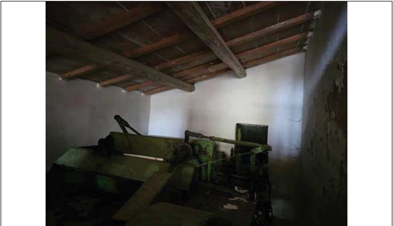
50 Altra vista interna del deposito;