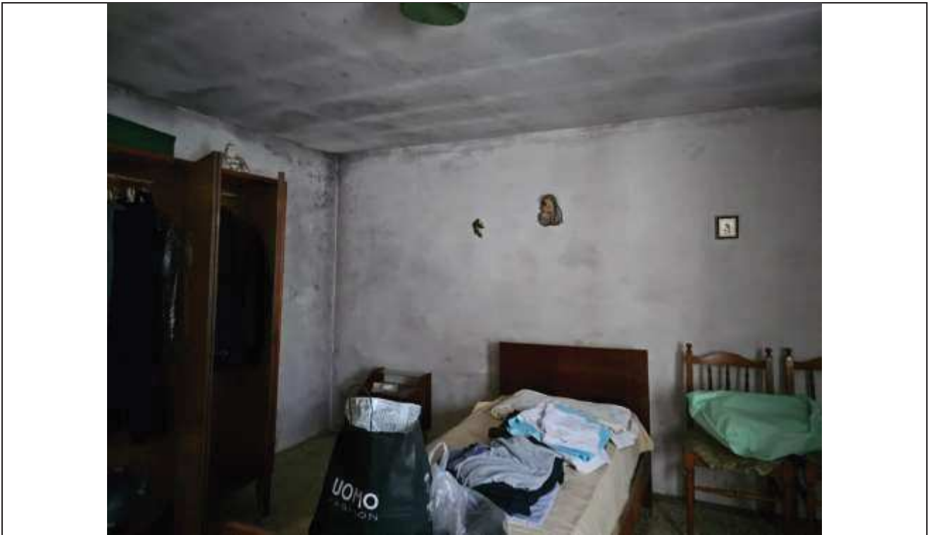
30 Vista della camera a Sud-Est del fabbricato, con evidente presenza di muffe sulle pareti e soffitto;