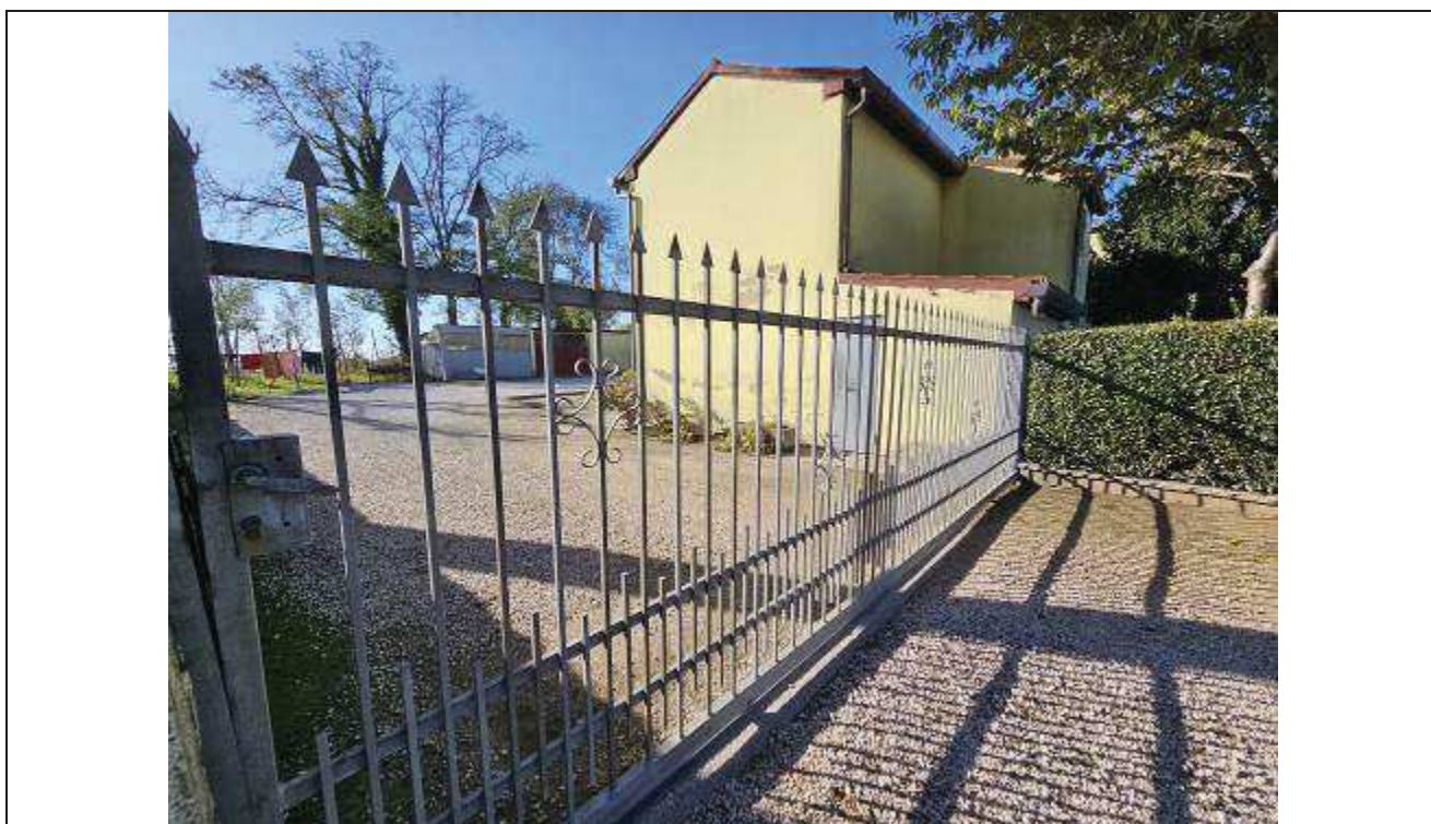
02 Vista del cancello carraio verso l’area interna -angolo Sud-Est del fabbricato rurale;