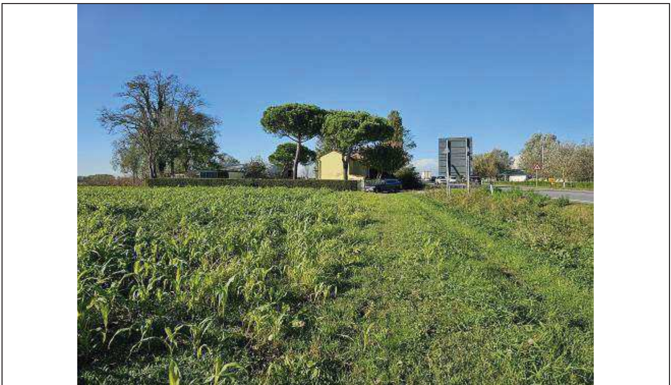
04 Vista del complesso rurale da Sud-Est, con parte dei terreni agricoli identificati al -C.T.: fg. 42, part. n. 82; Veduta lato sviluppato lungo la Strada Statale Romea;