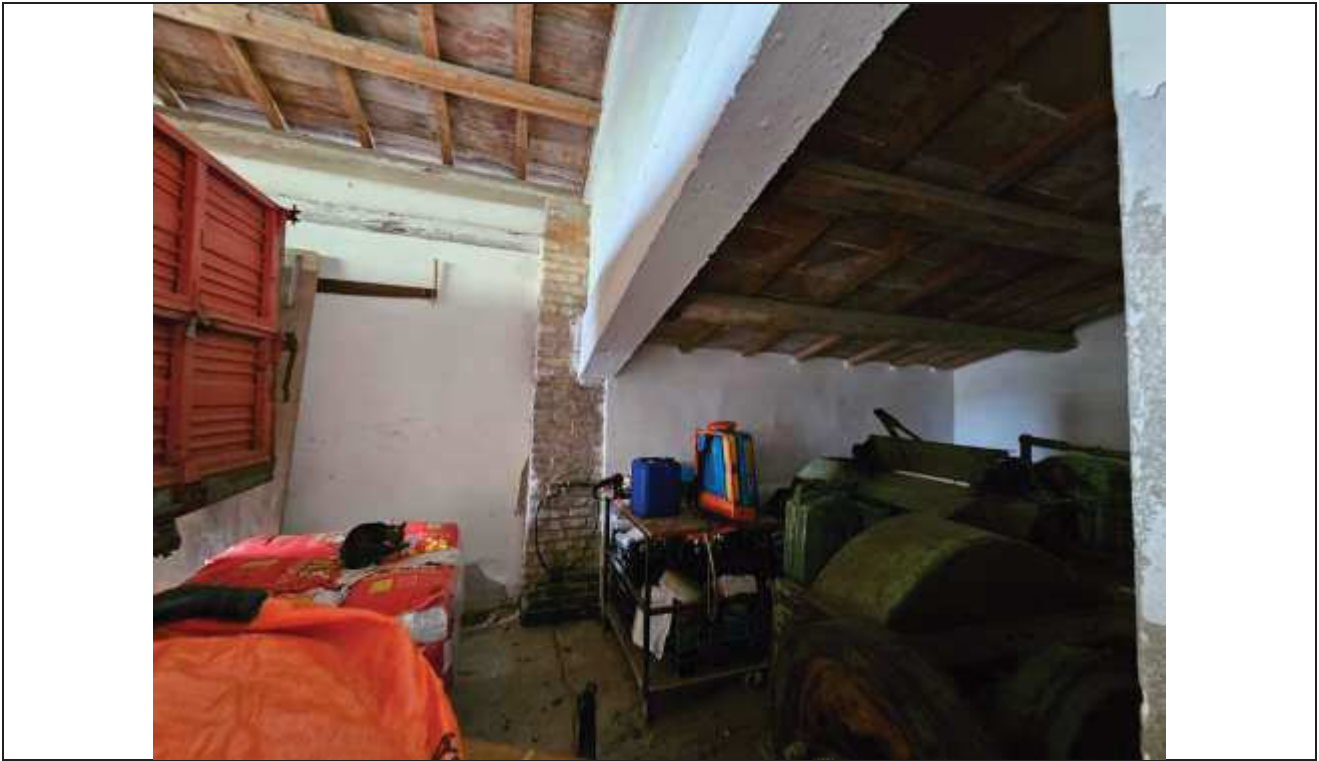
49 Vista del deposito aperto sul portico;