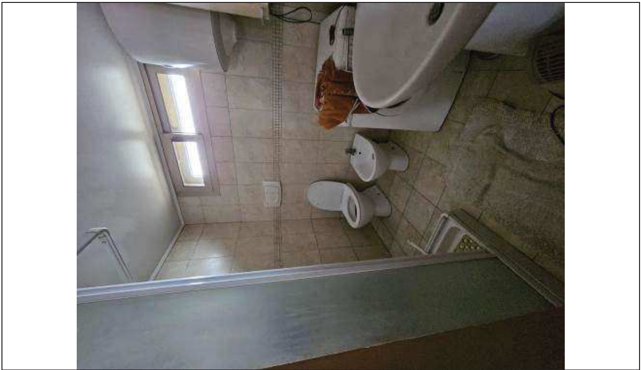
21 Vista interna del bagno;