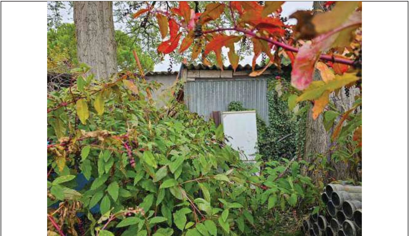
14 Vista lato Sud-Ovest del ricovero attrezzi con addossato il manufatto abusivo;