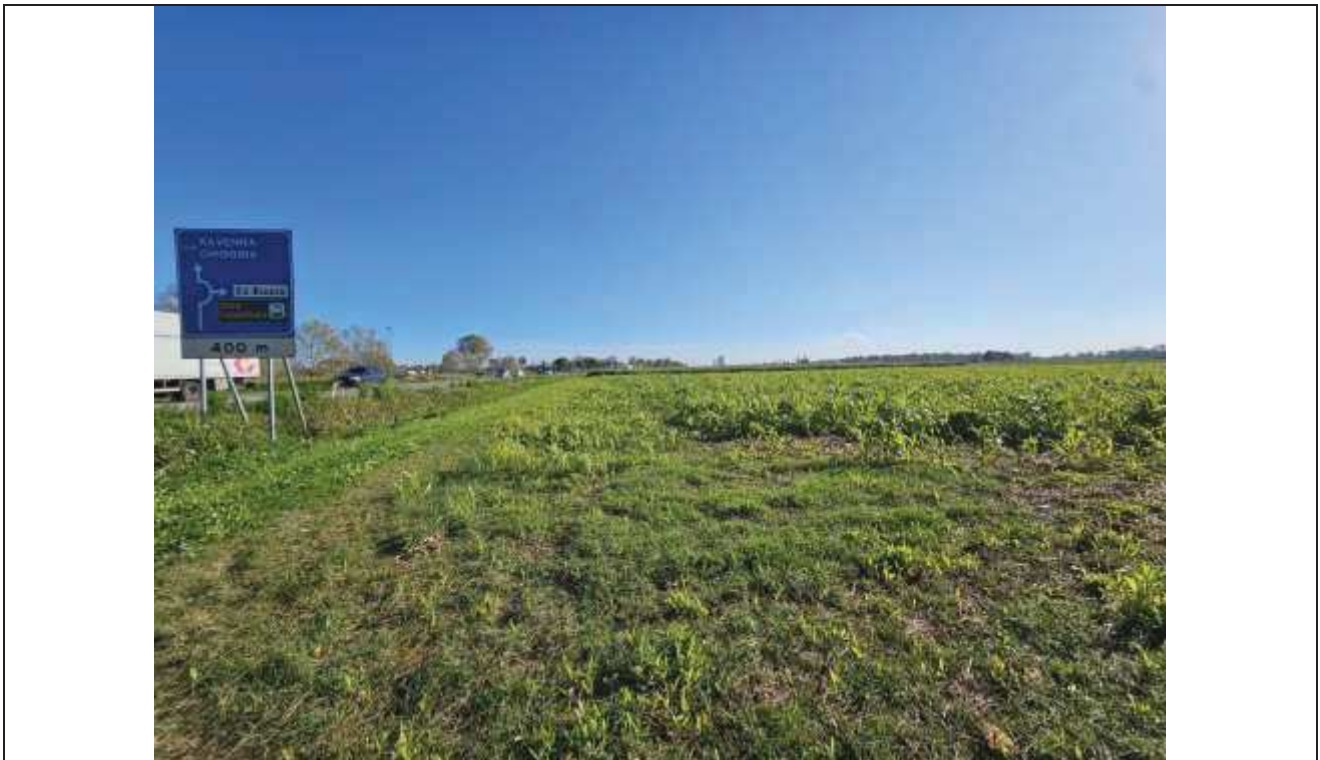
75 Vista della particella n. 82, verso la Strada Statale Romea;