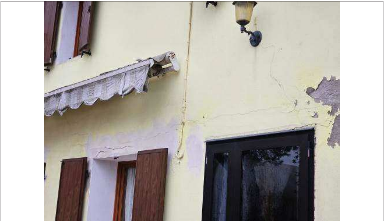
40 Particolare degli scrostamenti e fessurazioni presenti sulla facciata Sud-Ovest, dell'abitazione;