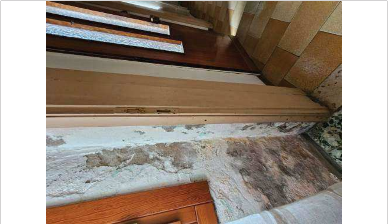
25 Altro particolare del distacco dell'intonaco e presenza di umidità al piano terra;