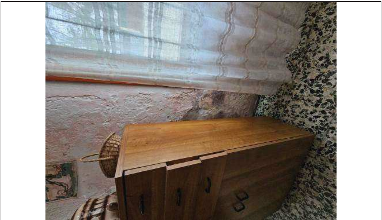
24 Altro particolare della muratura interna al piano terra del fabbricato rurale;