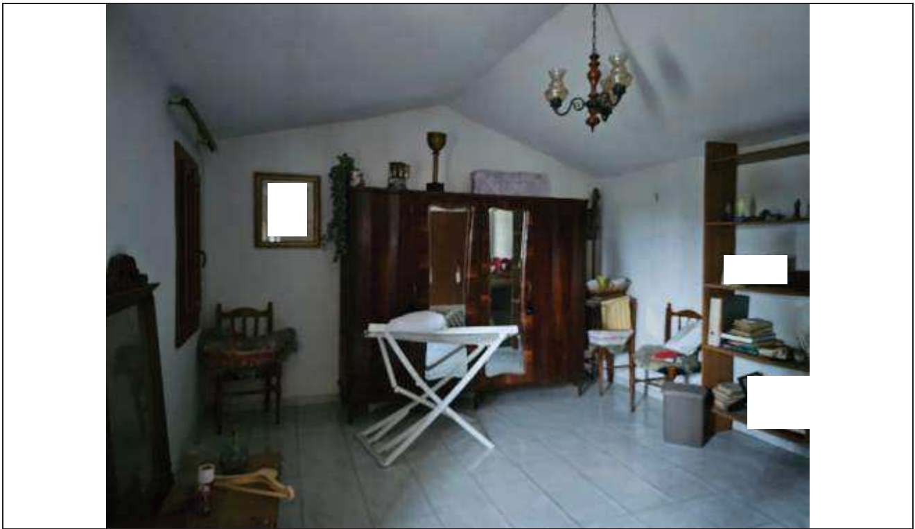
35 Altra vista dell'ultima camera da letto;