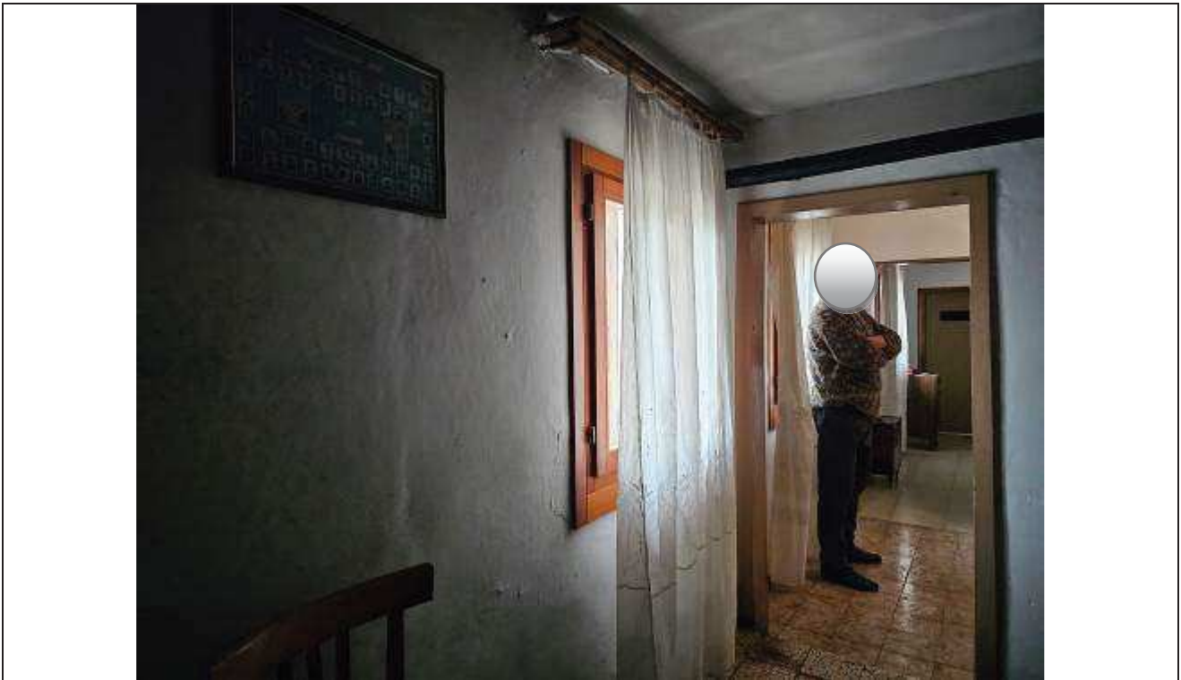
28 Vista dal disimpegno verso la camera singola;