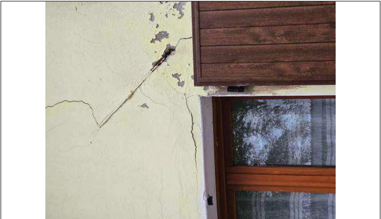
42 Altra vista del particolare delle crepe;