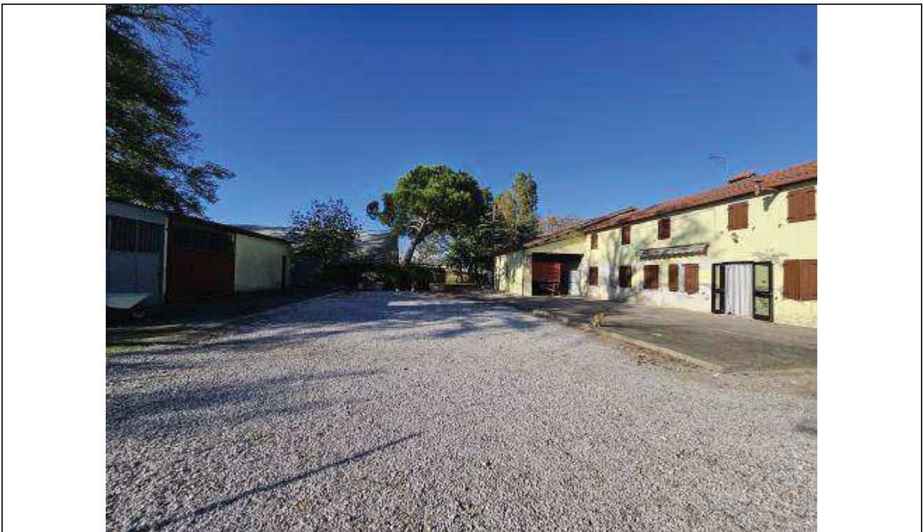
06 Vista dell'area cortiliva con i fabbricati rurali;