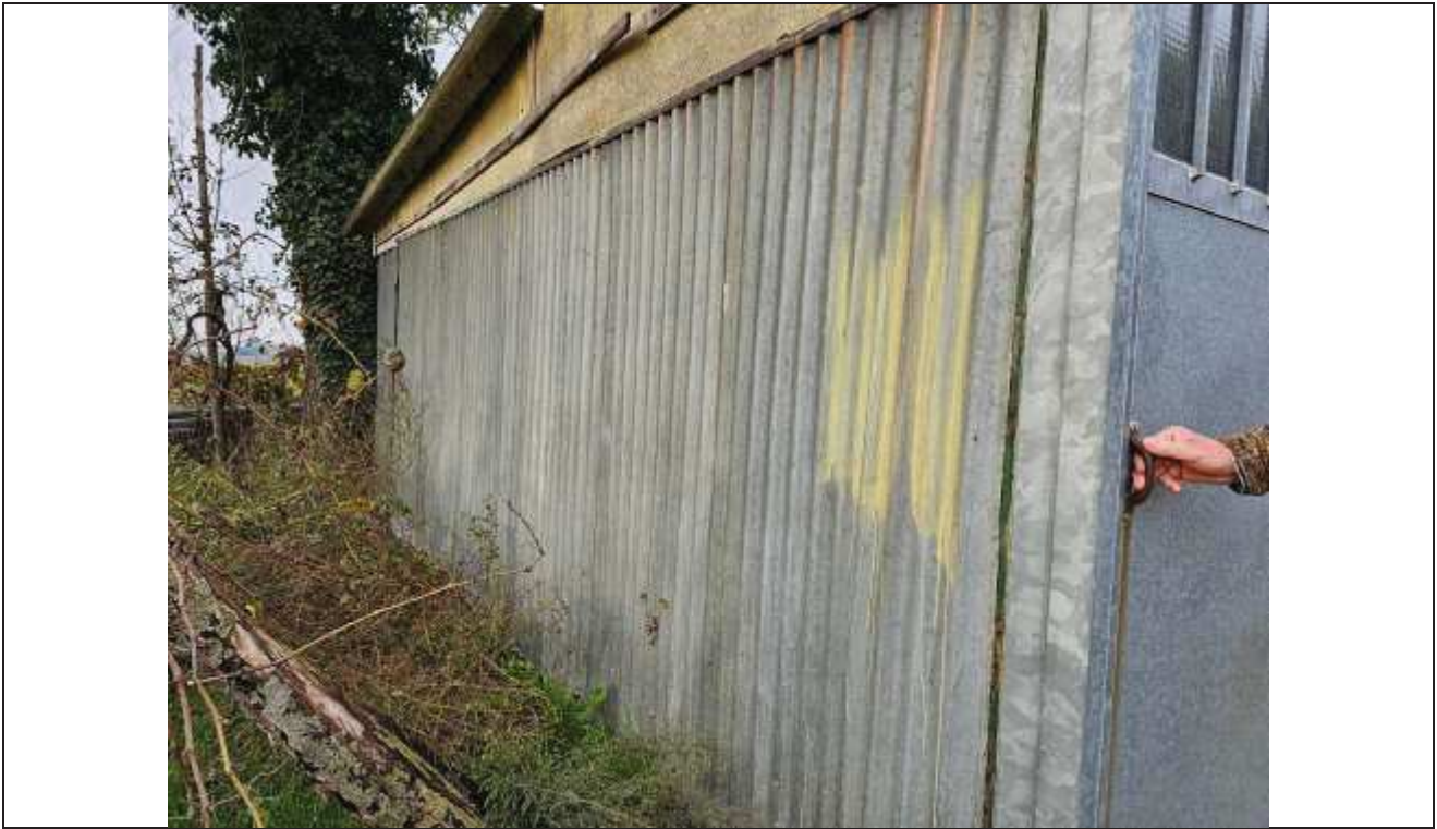
57 Vista della parete Est dell'abuso;