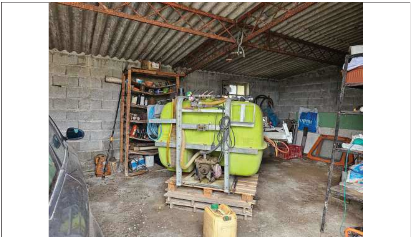
64 Altra vista interna del deposito attrezzi, dal portone d'ingresso;