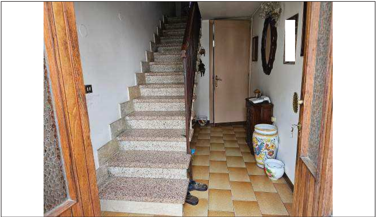
17 Vista dell'ingresso con vano scale e porta di accesso al bagno;