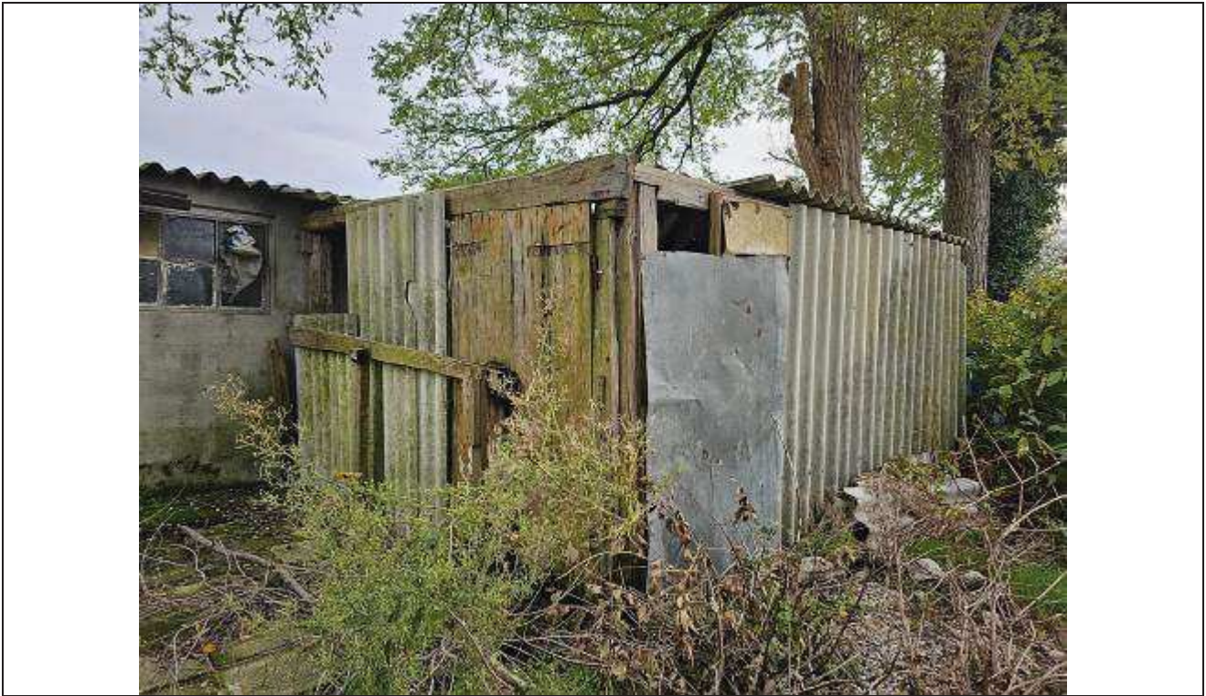
13 Vista manufatto abusivo oggetto di demolizione;