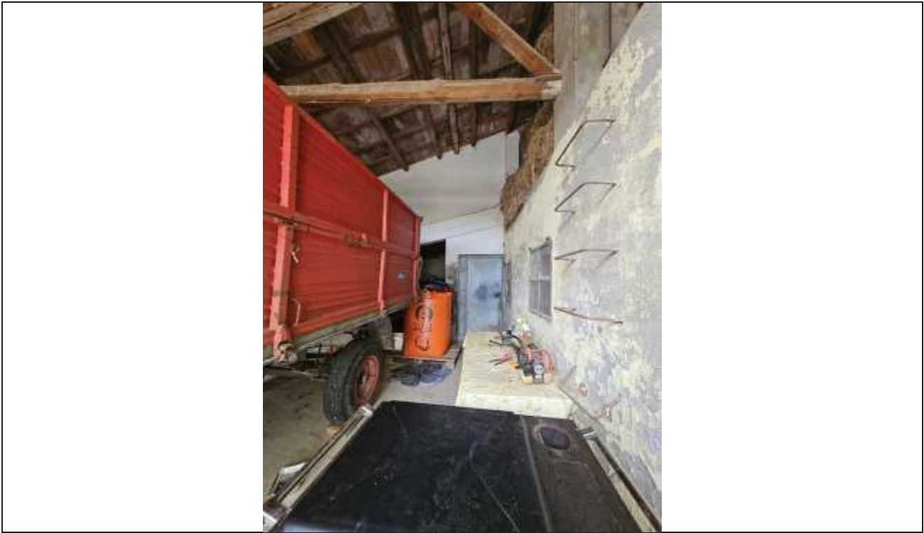
45 Vista interna del portico verso la porta della cantina;