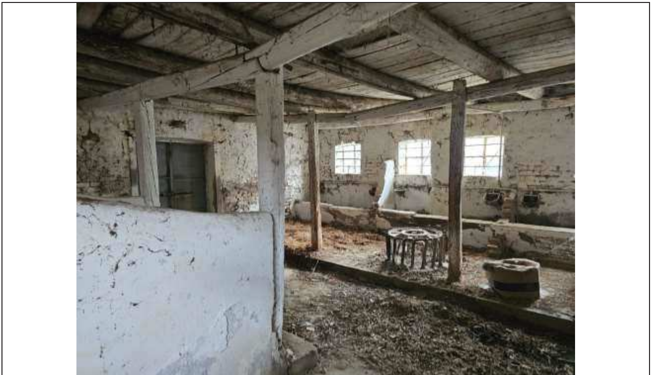
55 Veduta interna della stalla;