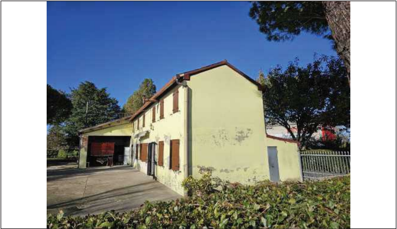
43 Vista del prospetto Sud-Est verso il portico d'ingresso alla stalla;