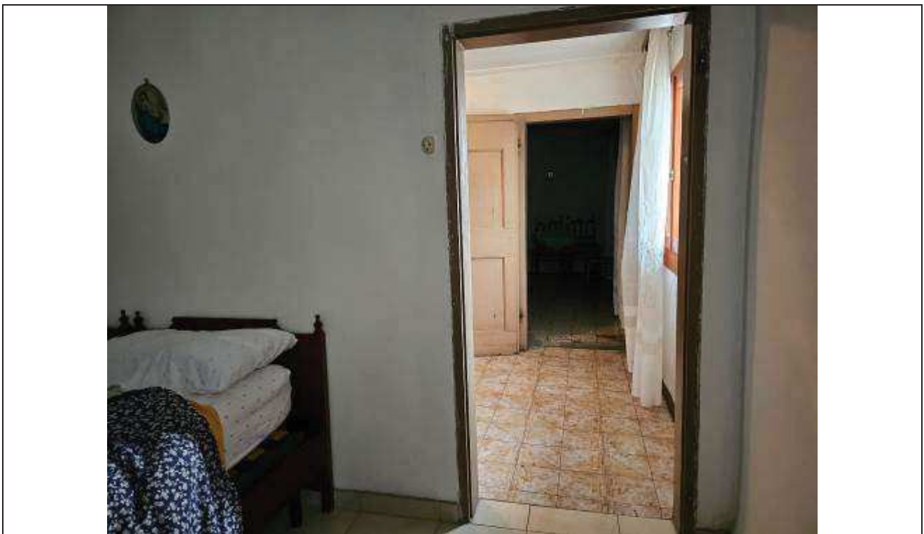
32 Veduta della seconda camera da letto verso il disimpegno;