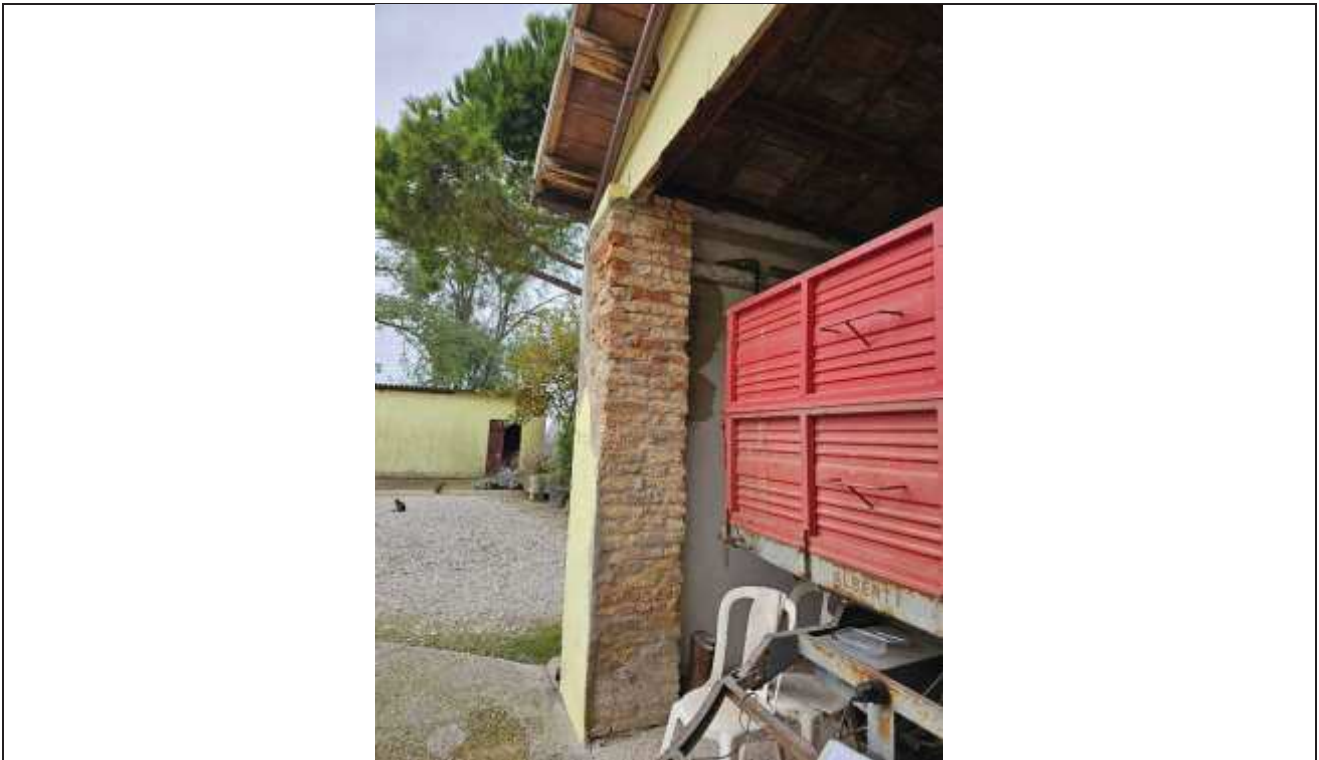
44 Vista dell'accesso al portico;