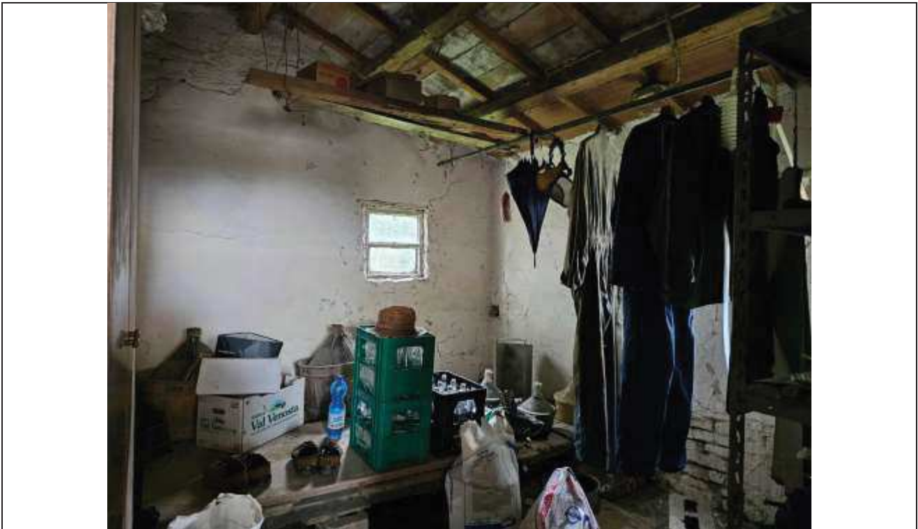
52 Altra vista della cantina;