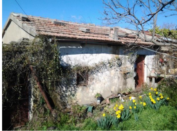
FG 55_Part. 1035