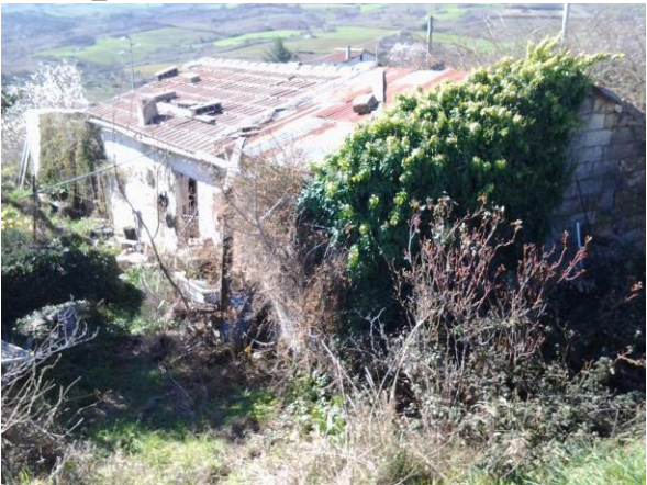
FG 55_P.lla 1035