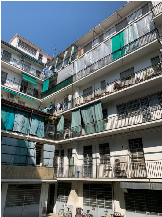
VISTA ESTRENA LATO CORTILE E CORSO GARIBALDI