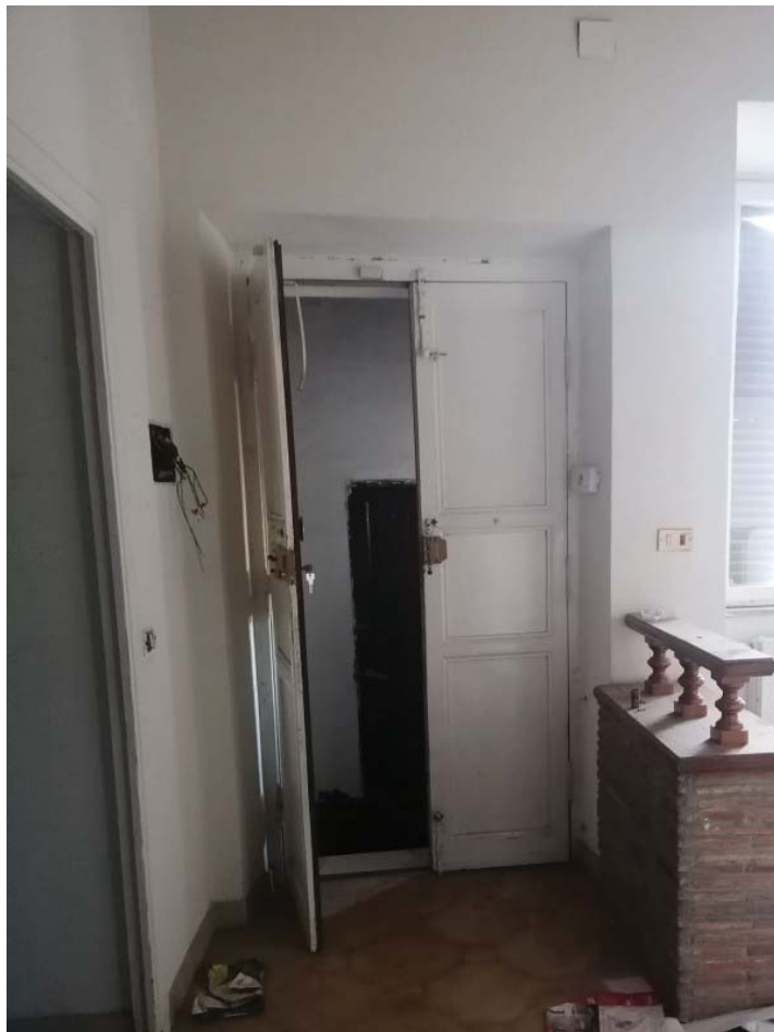
FOTO N. 4 VANO D'INGRESSO