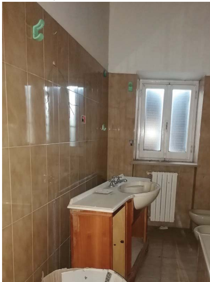
FOTO N. 9 BAGNO