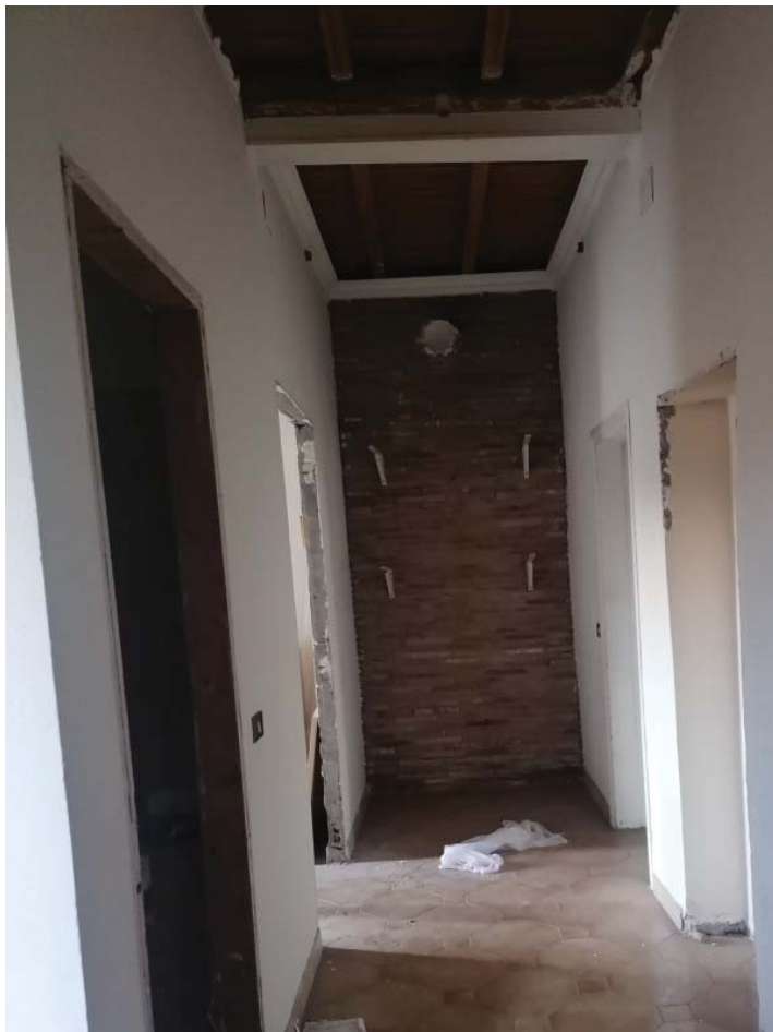
FOTO N. 6 CORRIDOIO