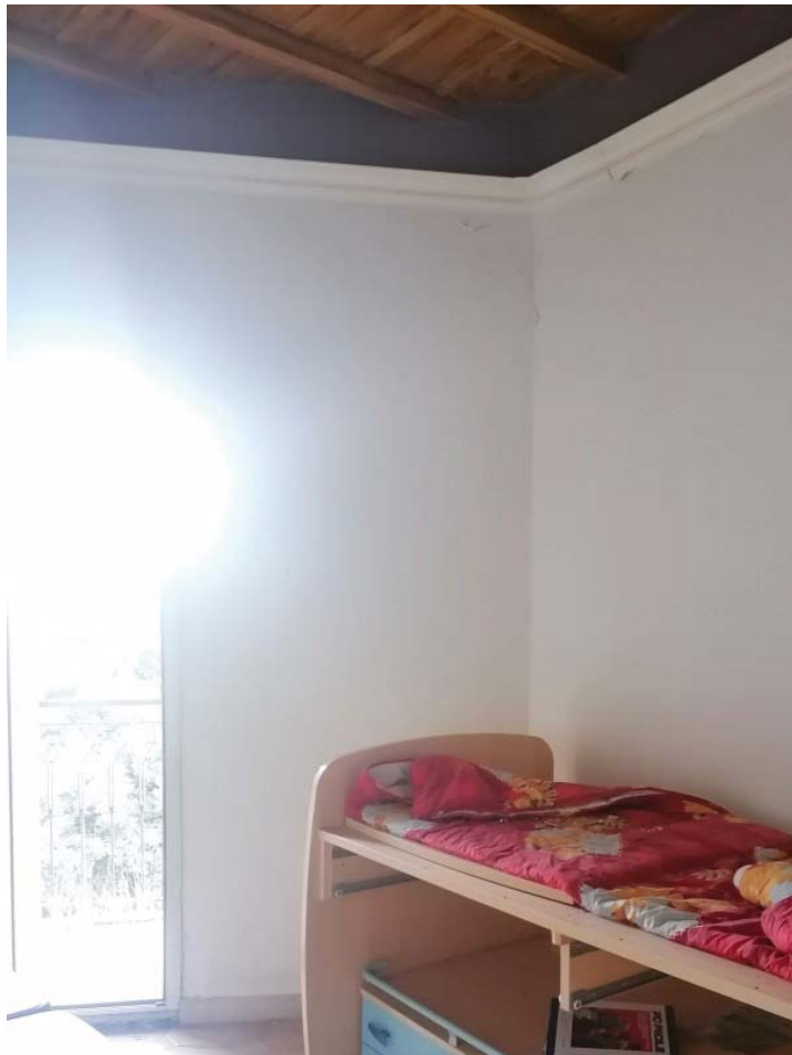
FOTO N. 11 CAMERA SINGOLA