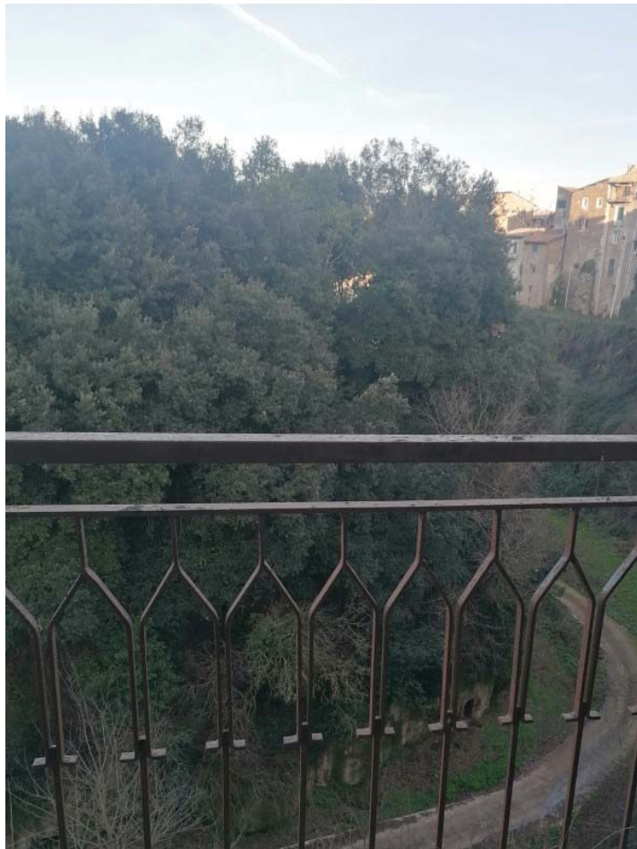
FOTO N. 13 VISTA DALLA CAMERA SINGOLA