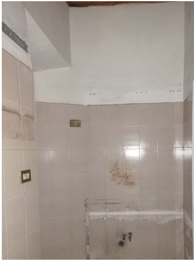
FOTO N. 8 CUCINA ON ANGOLO COTTURA