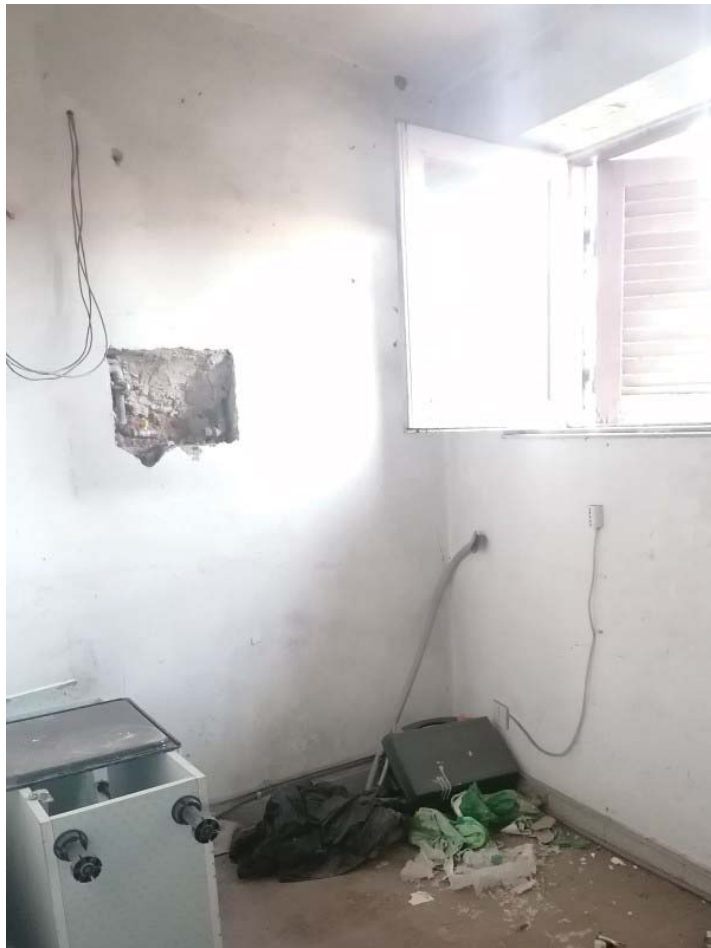
FOTO N. 12 VANO TECNICO