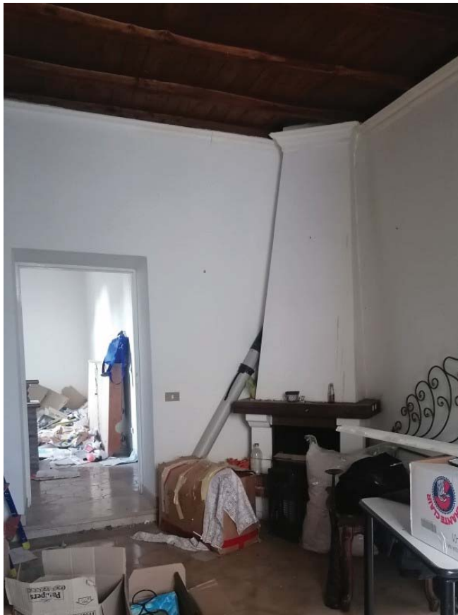
FOTO N. 7 SOGGIORNO-PRANZO