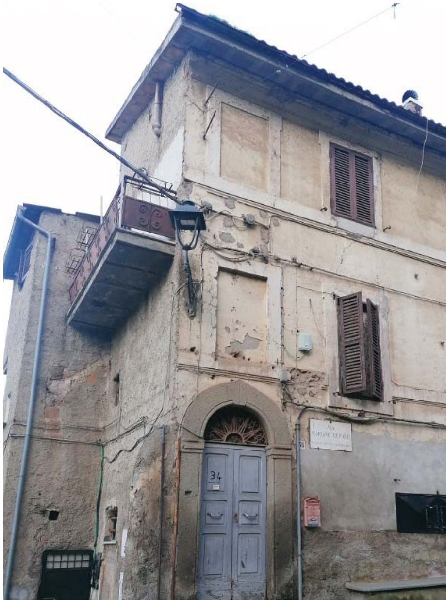
FOTO N. 1 INGRESSO