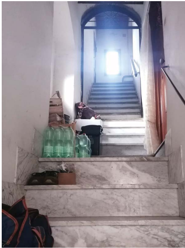
FOTO N. 2 SCALA DI ACCESSO AL SECONDO PIANO