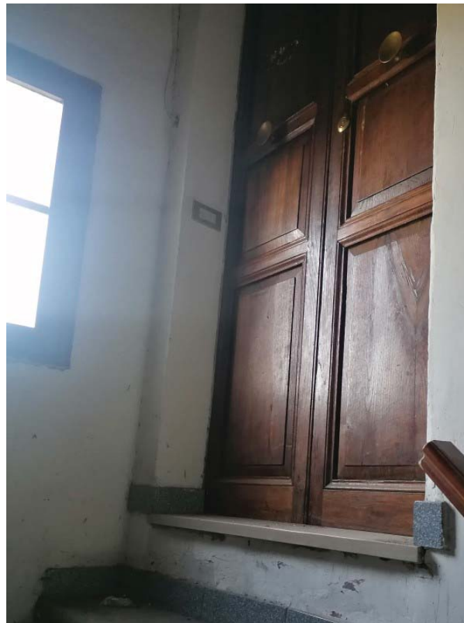
FOTO N. 3 PORTONCINO D'INGRESSO ALL'APPARTAMENTO