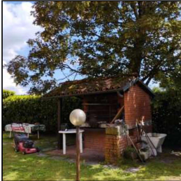
Foto 11 - forno