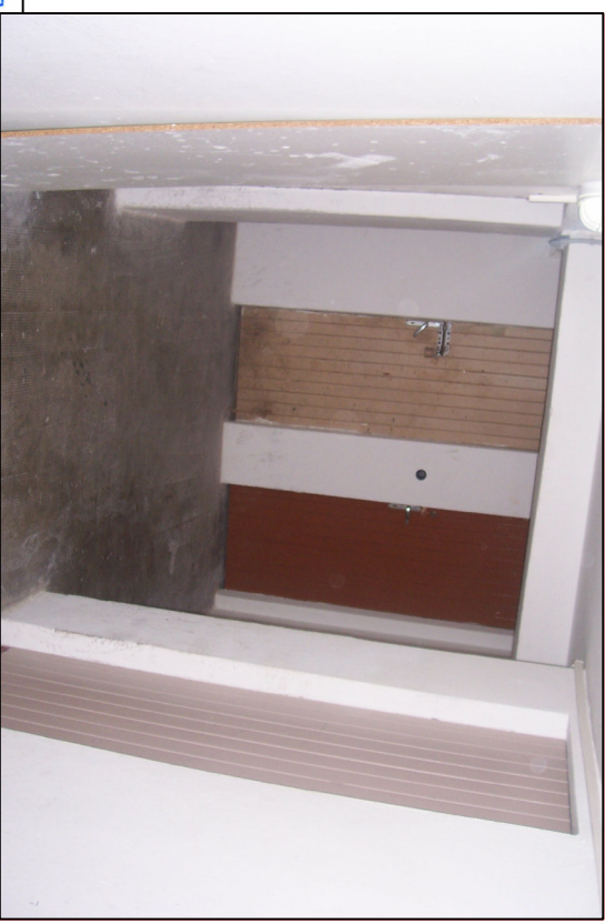
Fot.22 Piano Seminterrato