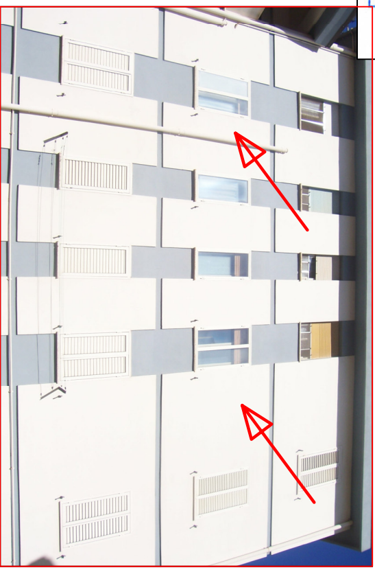
Fot.4 Prospetto Sud/Est (Piano 3°)