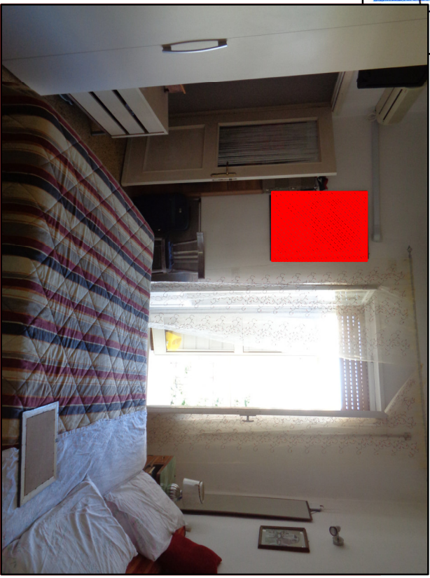
Fot.16 Camera 1