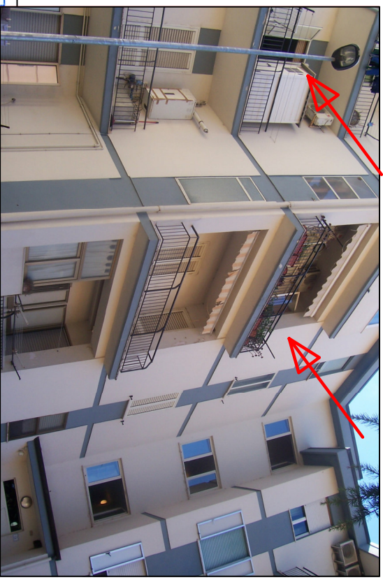
Fot.2 Prospetto Via Aosta (Piano 3°)