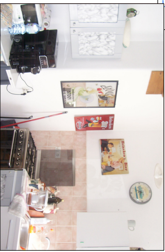
Cucina - (cottura)