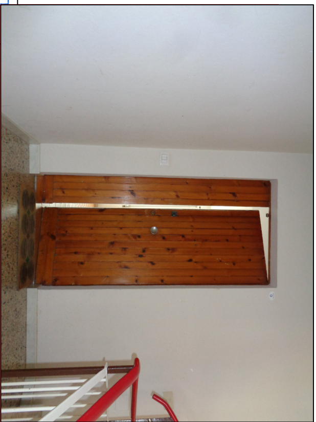
Ingresso Appartamento (Piano 3°) Fot.6