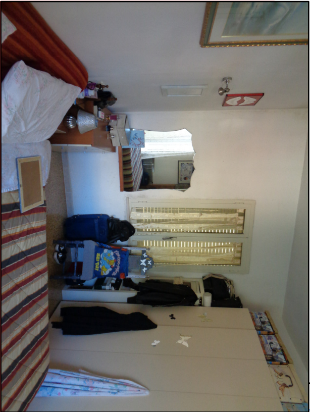
Fot.15 Camera 1

Collegio Provinciale Geometri e Geometri Laureati di Nuovo Iscrizione Albo N. 796 Geometra Ignazio Caria