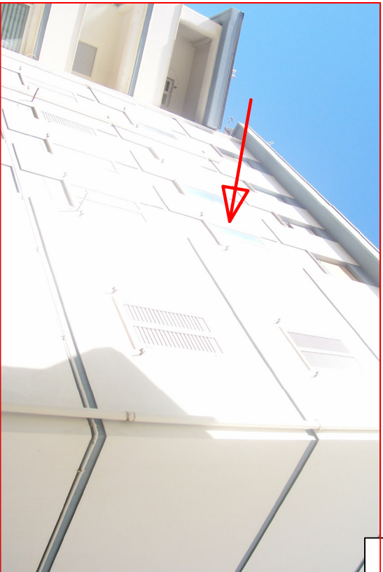
Fot.3 Prospetto Est (Piano 3°)