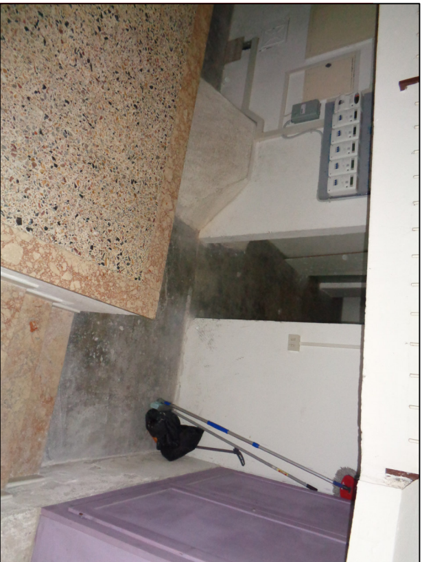
Fot. 21 Piano Seminterrato