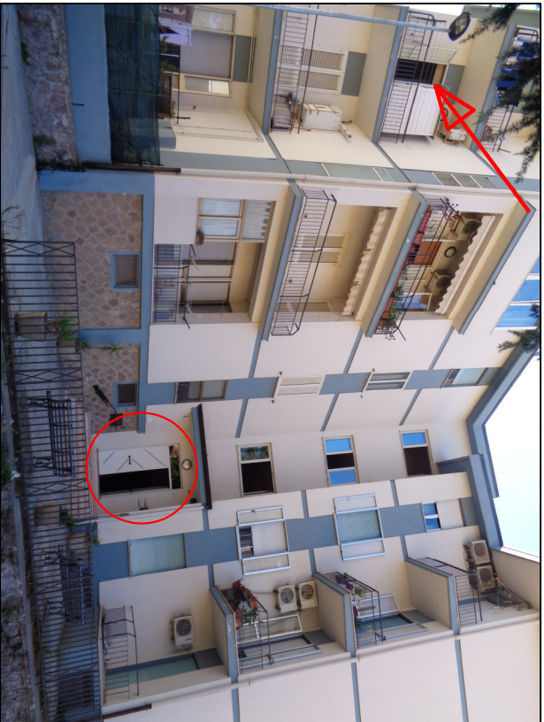
Fot.1 Ingresso Via Aosta