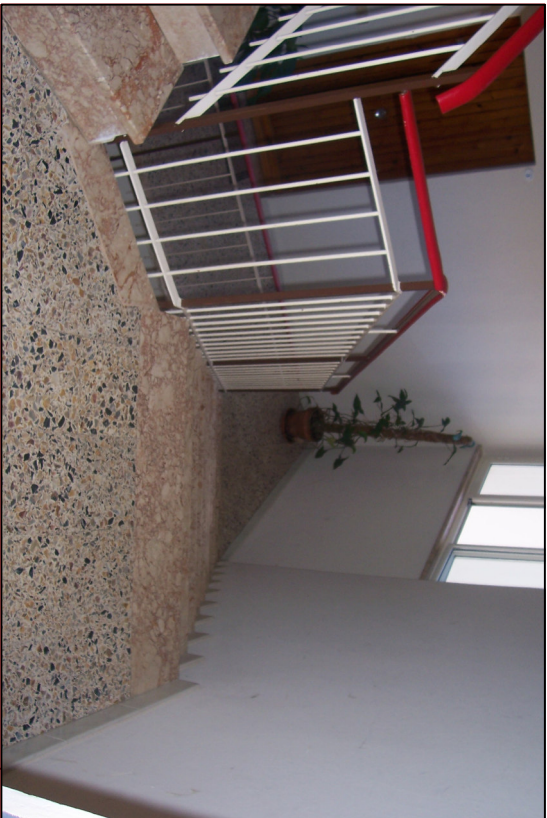
Fot.5 Particolare Scala