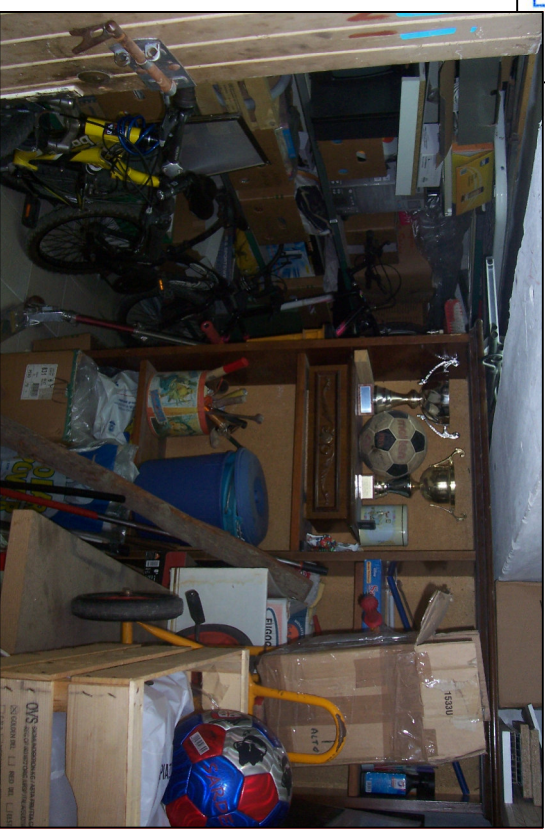
Piano Seminterrato - Cantina Fot. 24