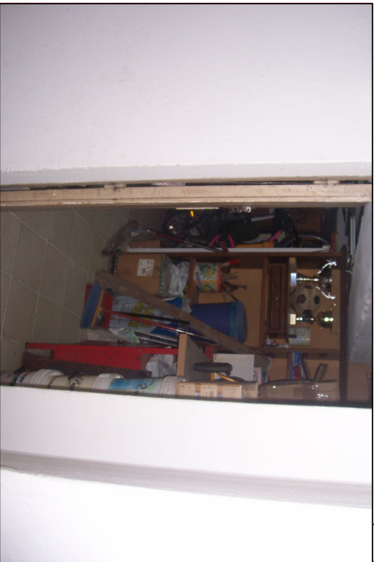
Fot. 23 Piano Seminterrato - Cantina