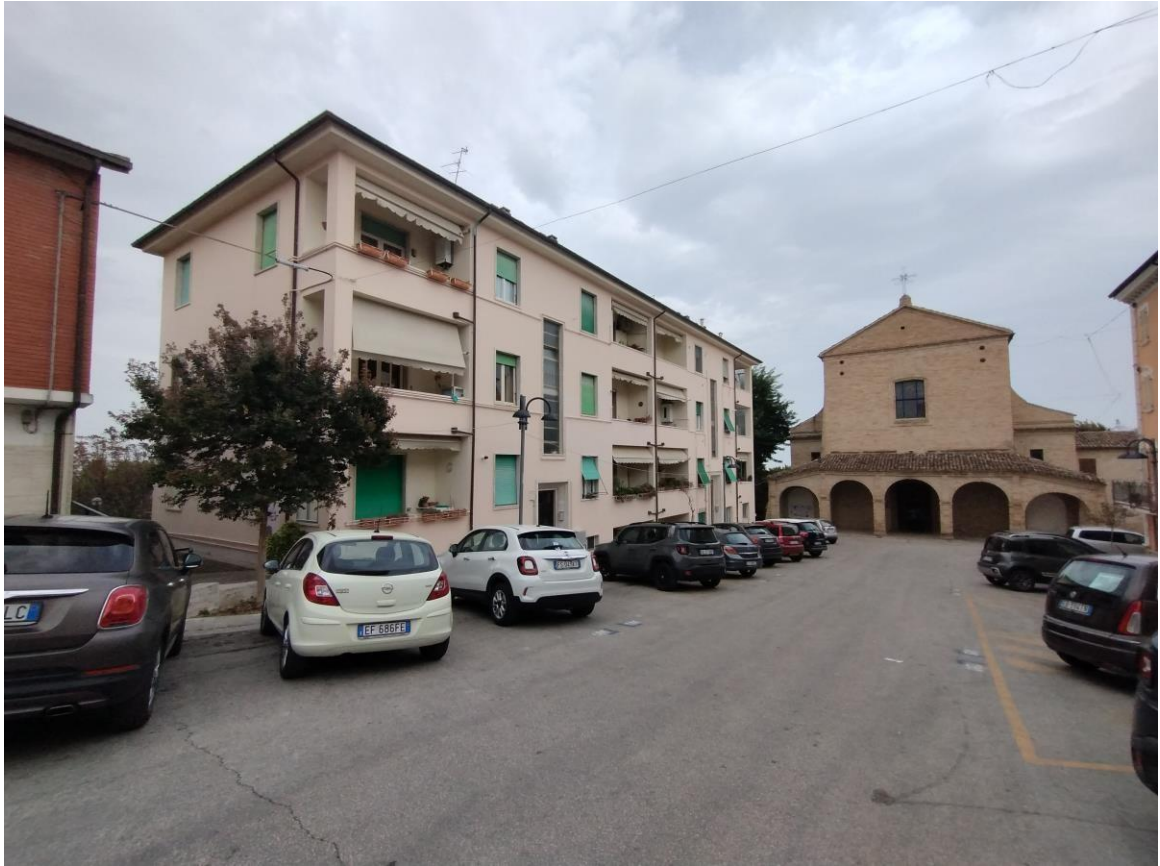
Foto n° 2 - Prospetti Sud ed Est dell'Edificio dove ricade l'immobile