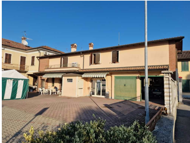
Prospetto su cortile