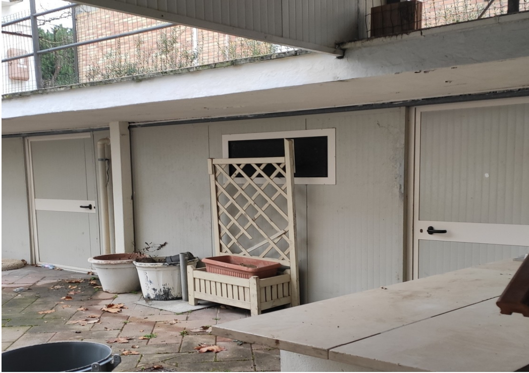
Tamponamento del portico

Il tamponamento del portico e la tettoia non sono sanabili e dovranno essere demolite.