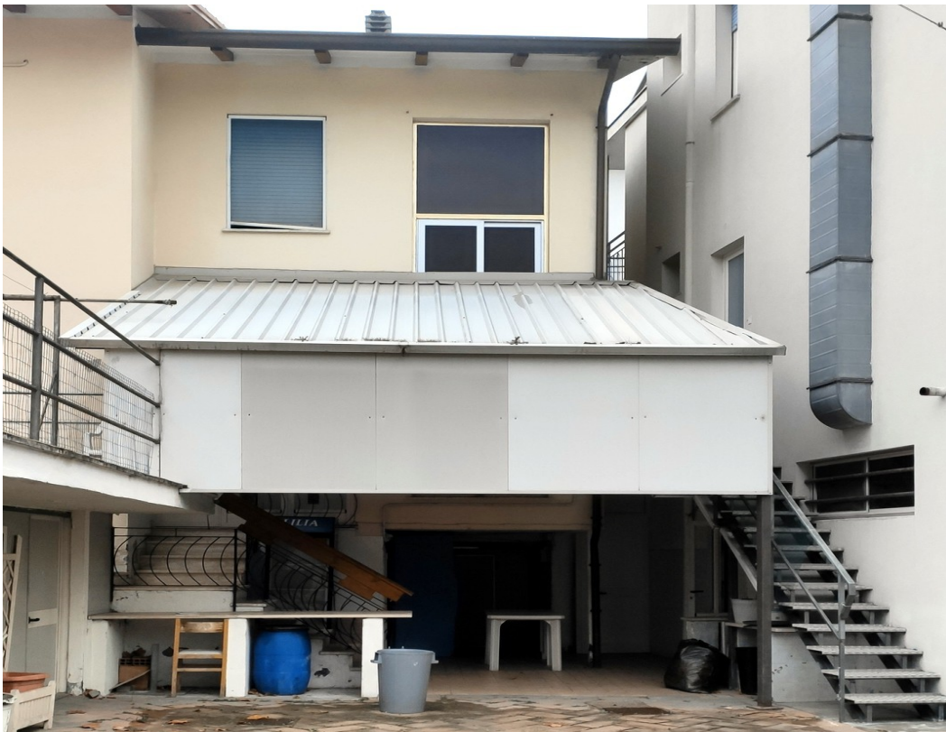
Tettoia da demolire