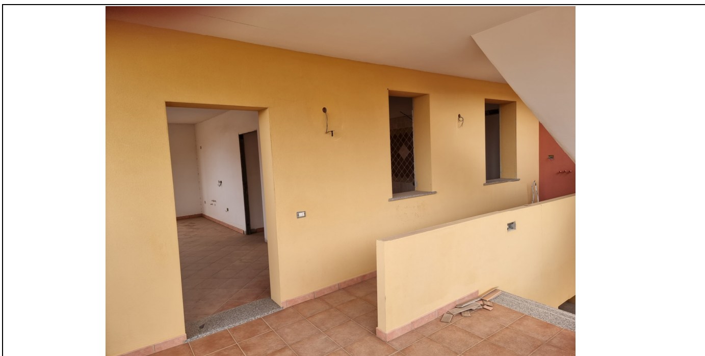
Foto 3 : Vista ingresso caposcala app. rustico p.1 Via Gorizia,1 Capoterra (10/11/23)