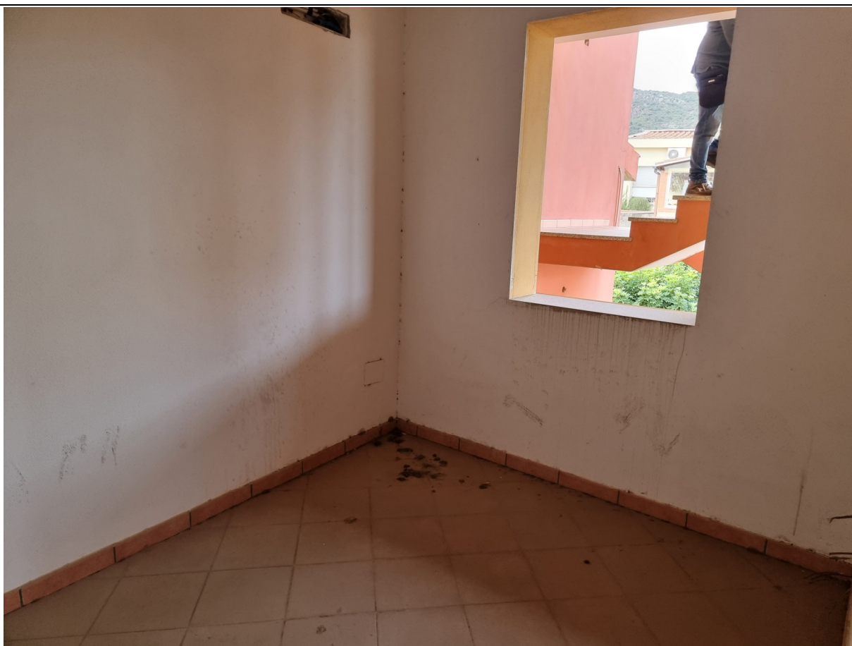
Foto 6 : Vista camera app. rustico p.1 Via Gorizia,1 Capoterra (10/11/23)