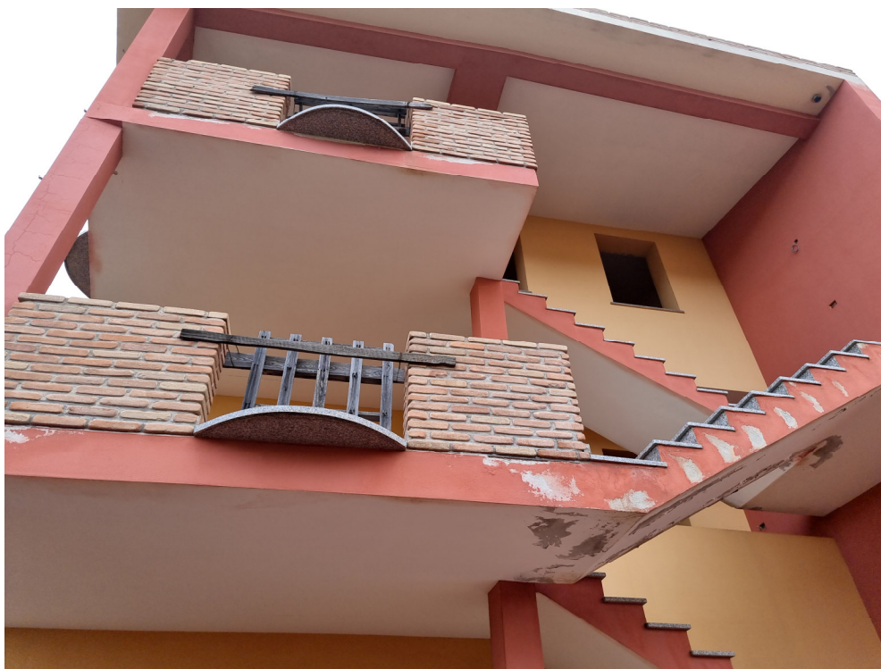
Foto 2 : Vista terrazza posteriore p.1 abitazione Via Olbia, 1-3 Capoterra (10/11/23)