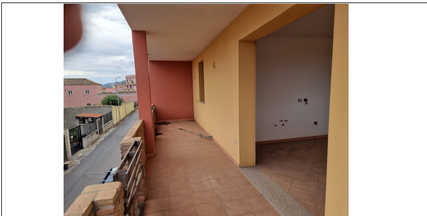
Foto 7 : Vista balcone app. rustico p.1 Via Olbia Capoterra (10/11/23)