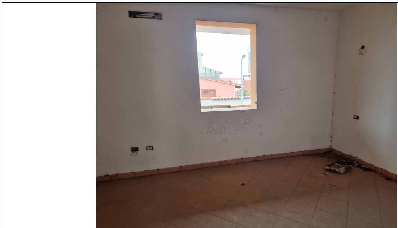
Foto 8 : Vista camera app. rustico p.1 Via Gorizia,1 Capoterra (10/11/23)