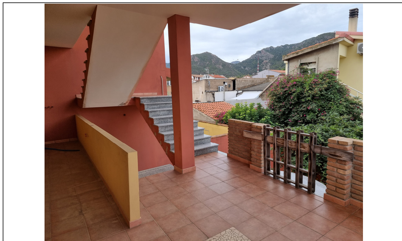
Foto 10 : Vista terrazza posteriore app. rustico p.1 Via Gorizia,1 Capoterra (10/11/23)