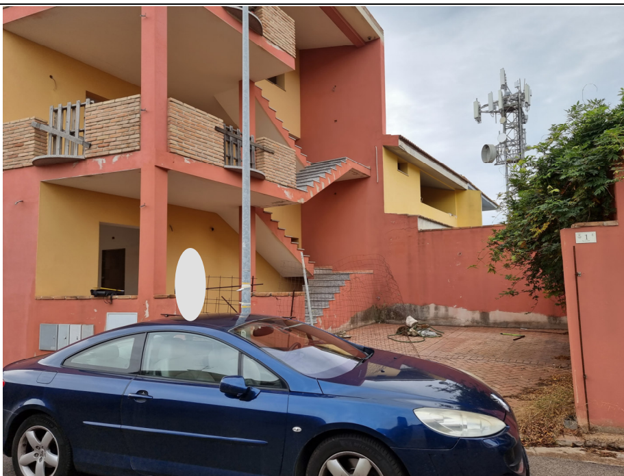
Foto 1 : Vista scala ingresso app. rustico p.1 Via Gorizia,1 Capoterra (10/11/23)