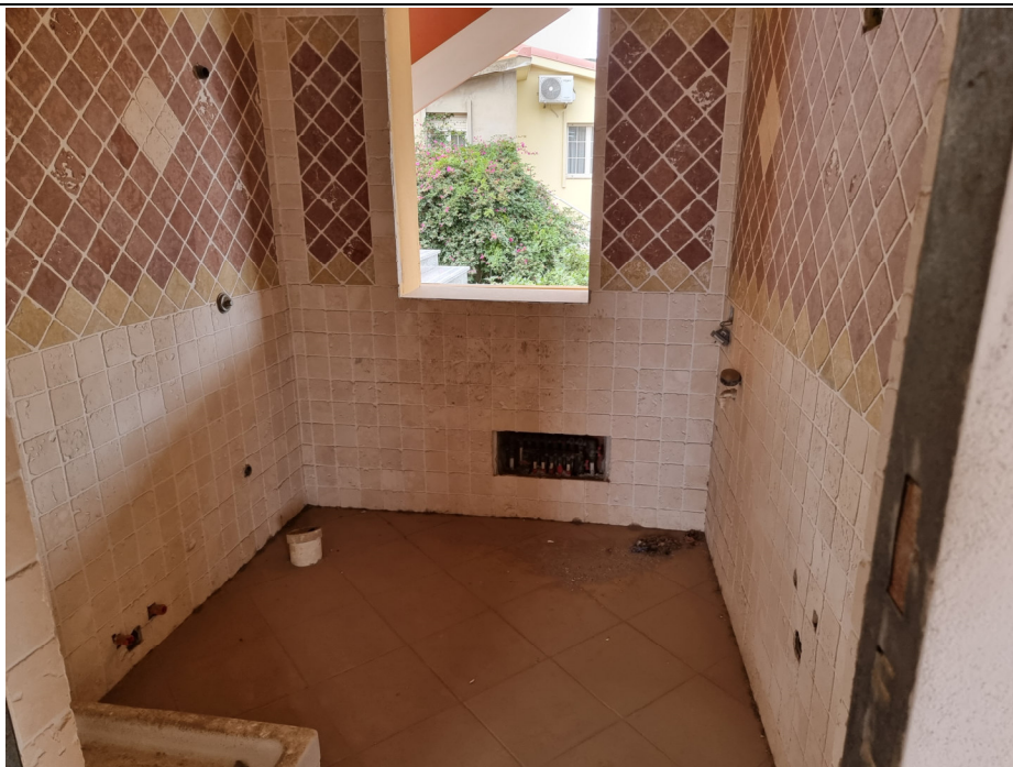
Foto 5 : Vista WC app. rustico p.1 Via Gorizia,1 Capoterra (10/11/23)