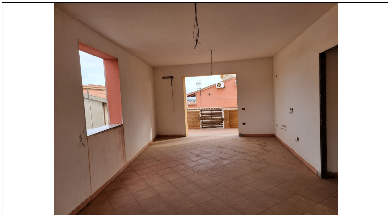
Foto 4 : Vista soggiorno app. rustico p.1 Via Gorizia,1 Capoterra (10/11/23)