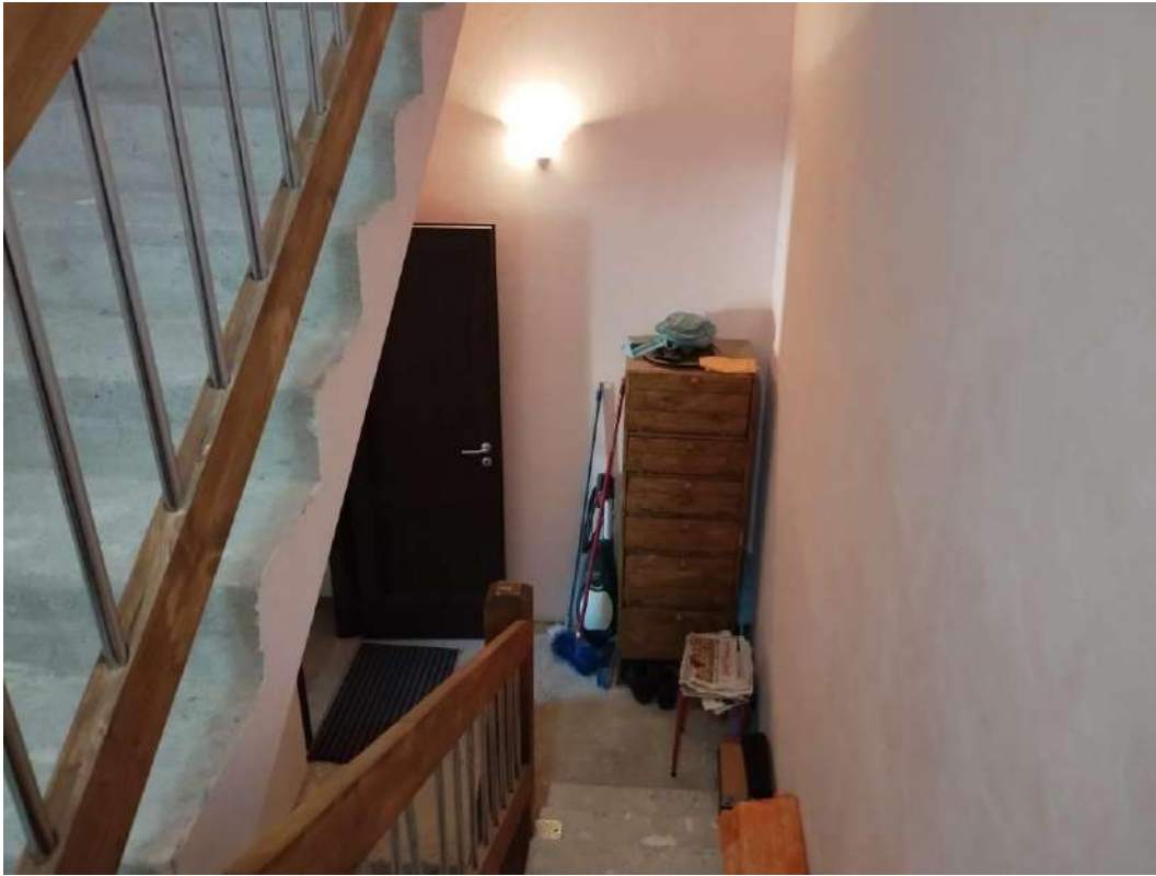
IMG 26_Vano scala