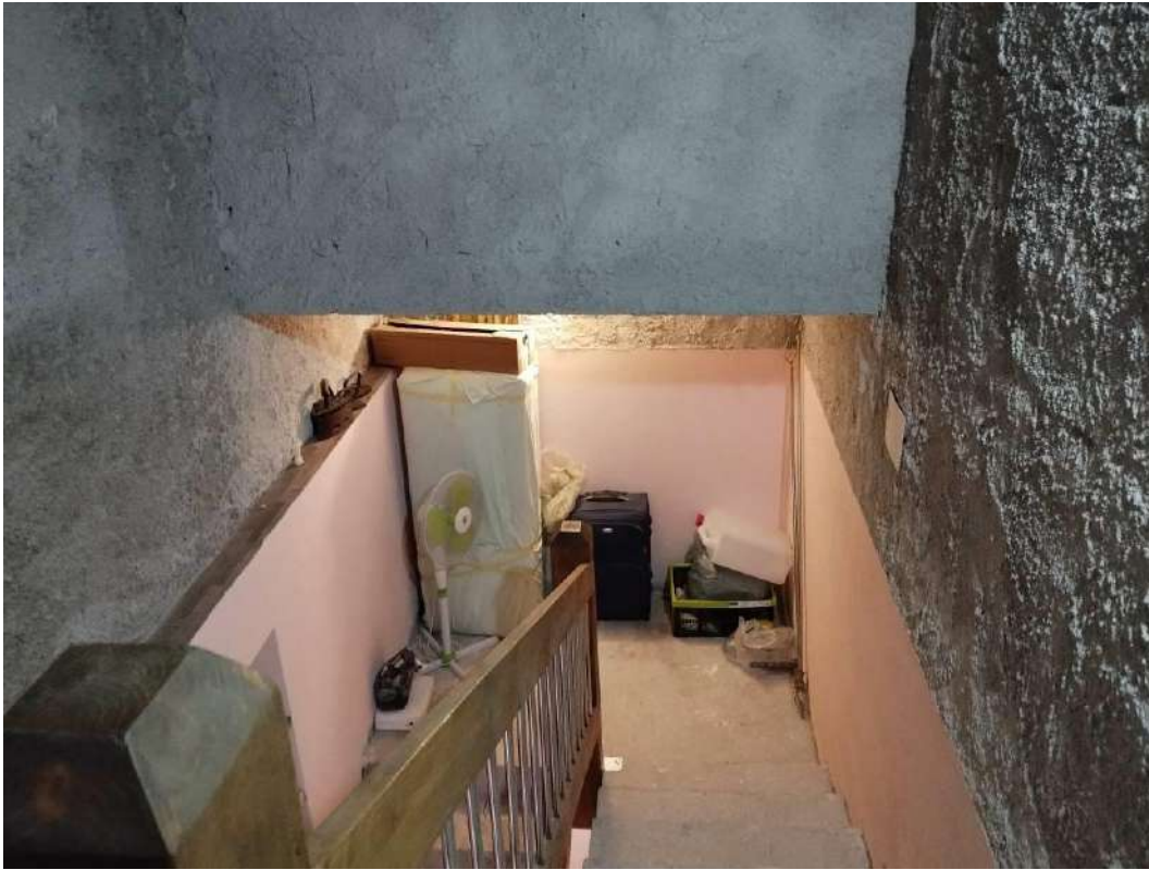
IMG 32_Vano scala