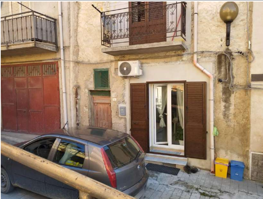
IMG 2_Prospetto Nord