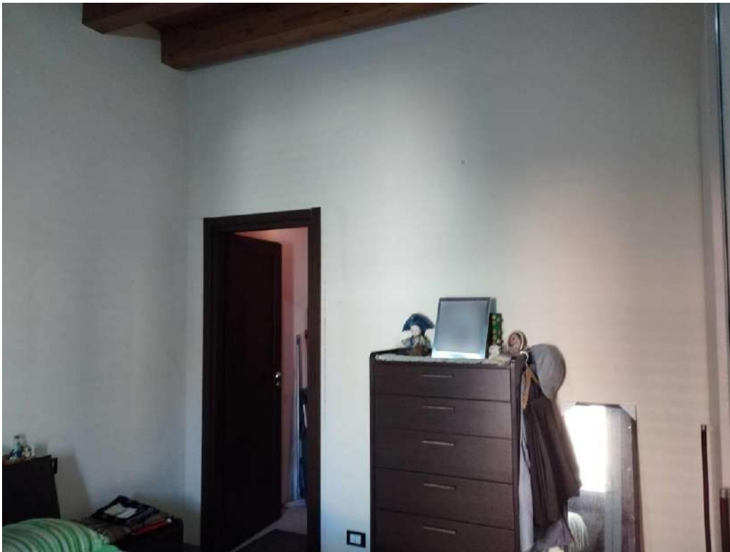
IMG 14_Camera da letto