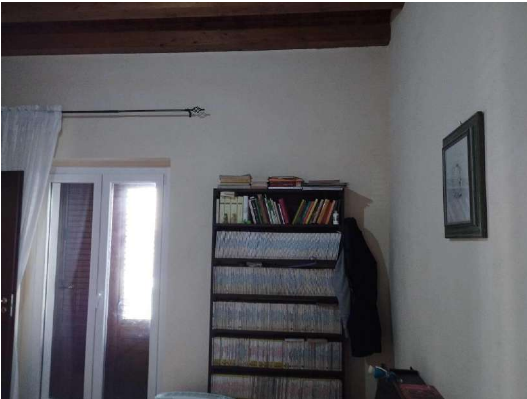
IMG 12_Camera da letto