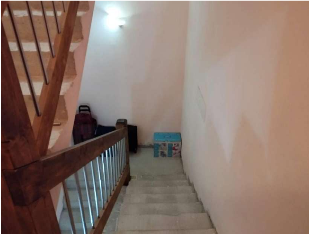
IMG 18_Vano scala