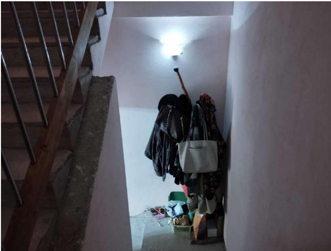
IMG 10_Vano scala