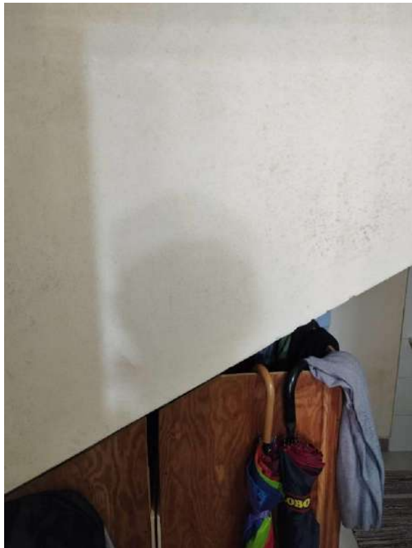
IMG 8_W.C. sottoscala