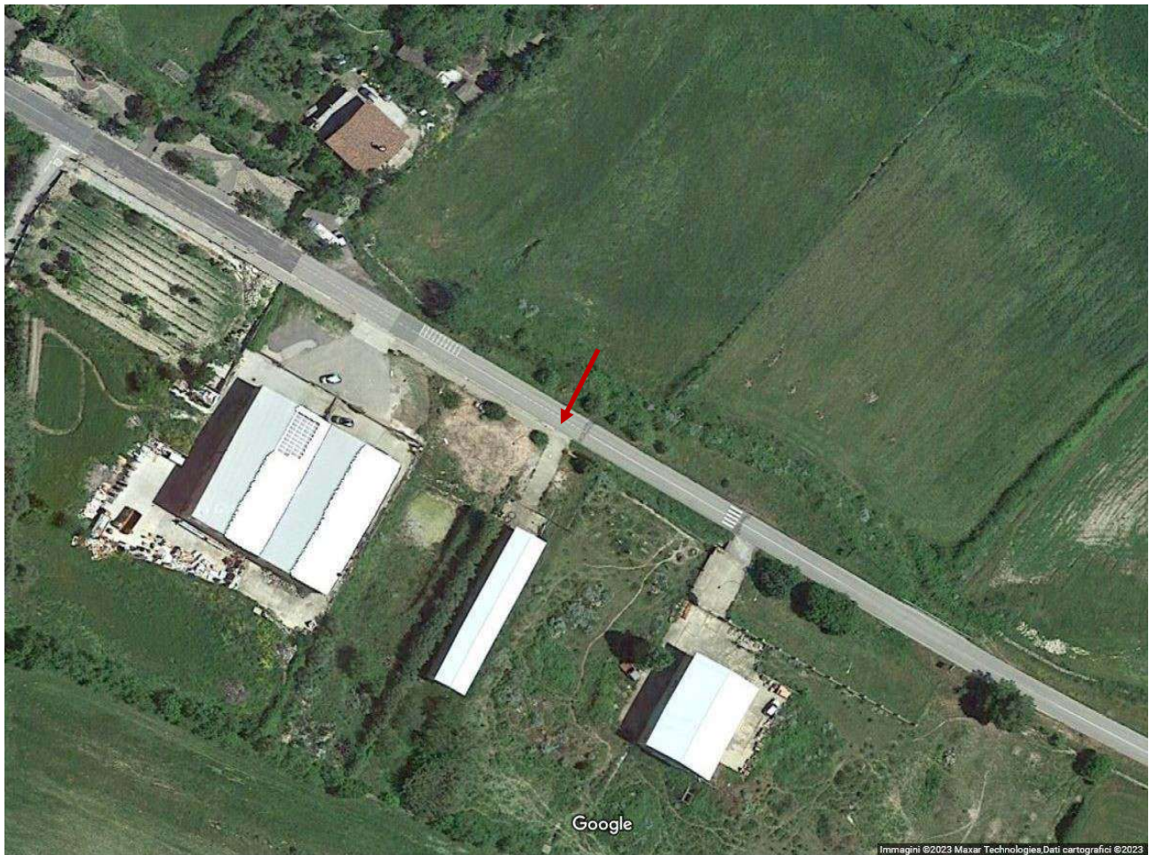
Fotografia 1. Localizzazione dell'immobile