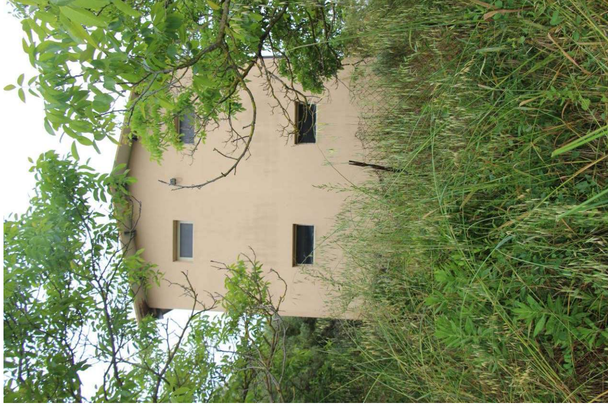
Fotografia 21: vista del prospetto posteriore