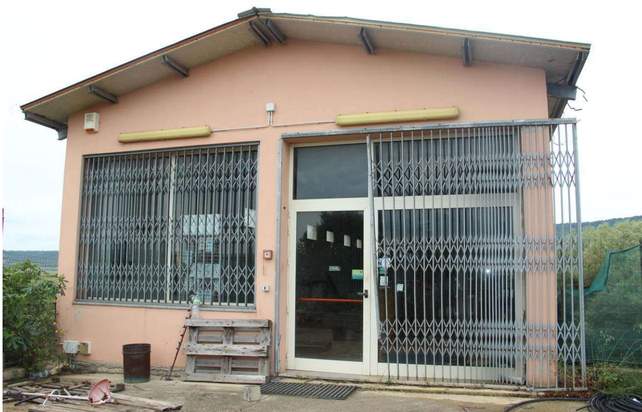
Fotografia 5. Vista del prospetto principale e dell'ingresso al fabbricato