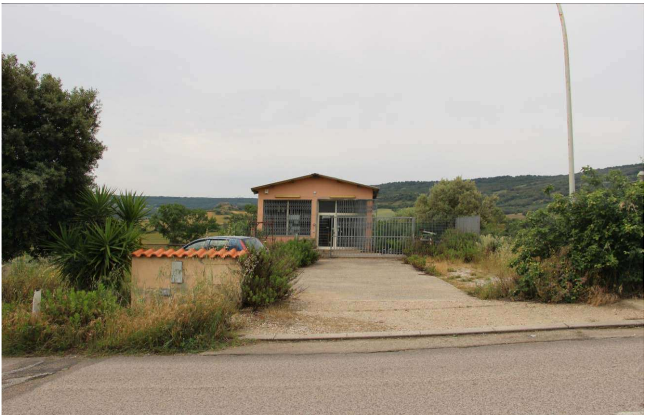
Fotografia 3. Vista dell'accesso al piazzale asfaltato dalla strada provinciale