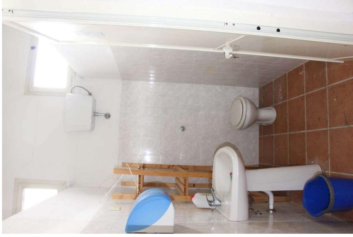
Fotografia 9. Vista del secondo locale wc