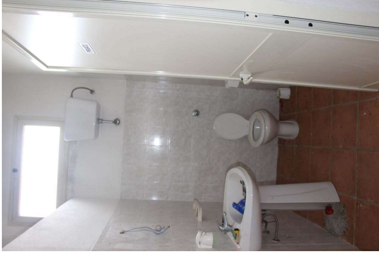
Fotografia 9. Vista del terzo locale wc