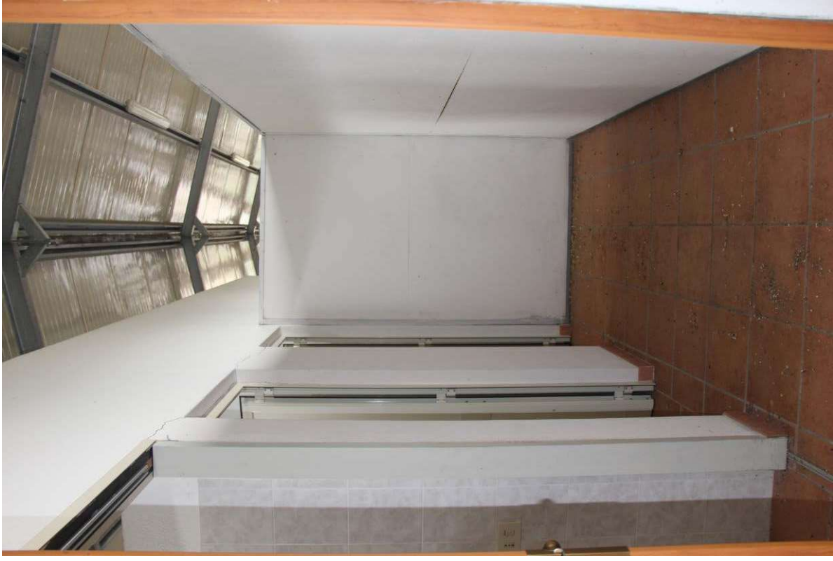
Fotografia 9. Vista del disimpegno davanti ai servizi