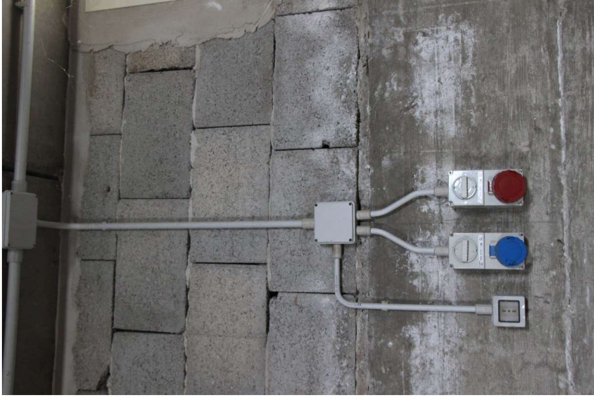
Fotografia 17. Impianto elettrico, dettagli