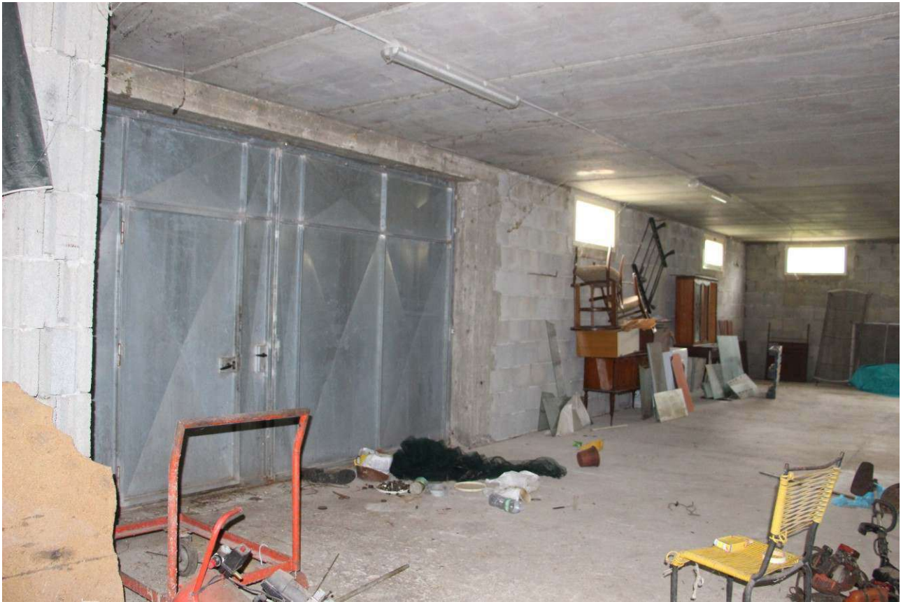
Fotografia 15. Vista del piano seminterrato, ingresso dal piazzale esterno