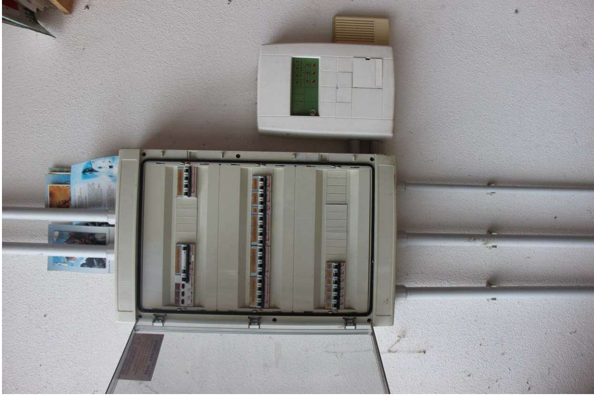
Fotografia 18. Impianto elettrico, quadro