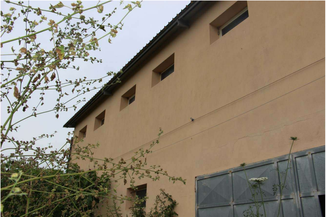
Fotografia 19: vista del prospetto laterale (sud-est) dal piazzale esterno