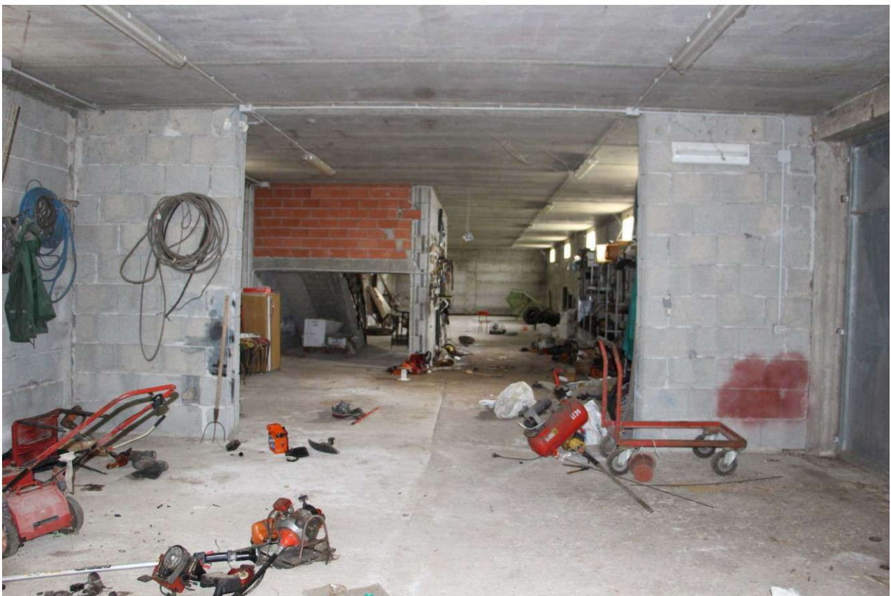
Fotografia 16. Vista del piano seminterrato