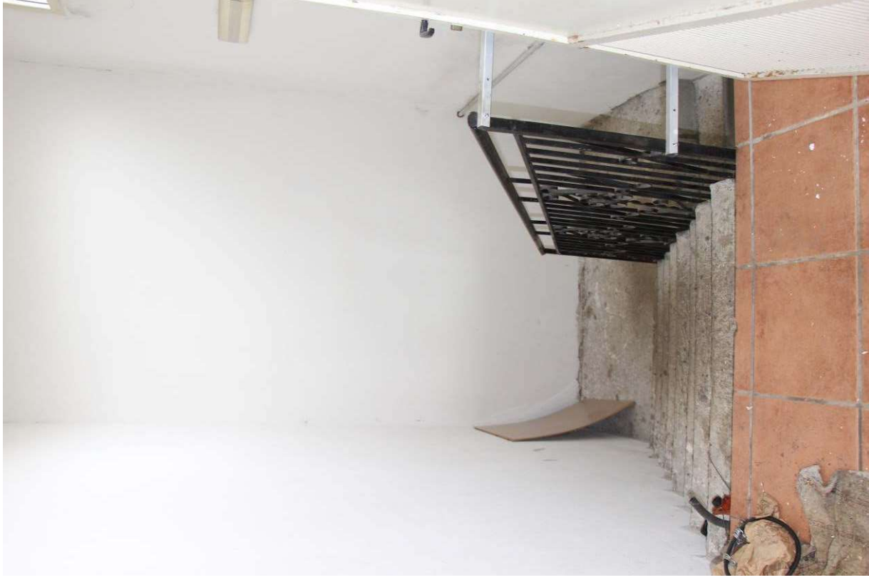
Fotografia 11. Vista del vano scala