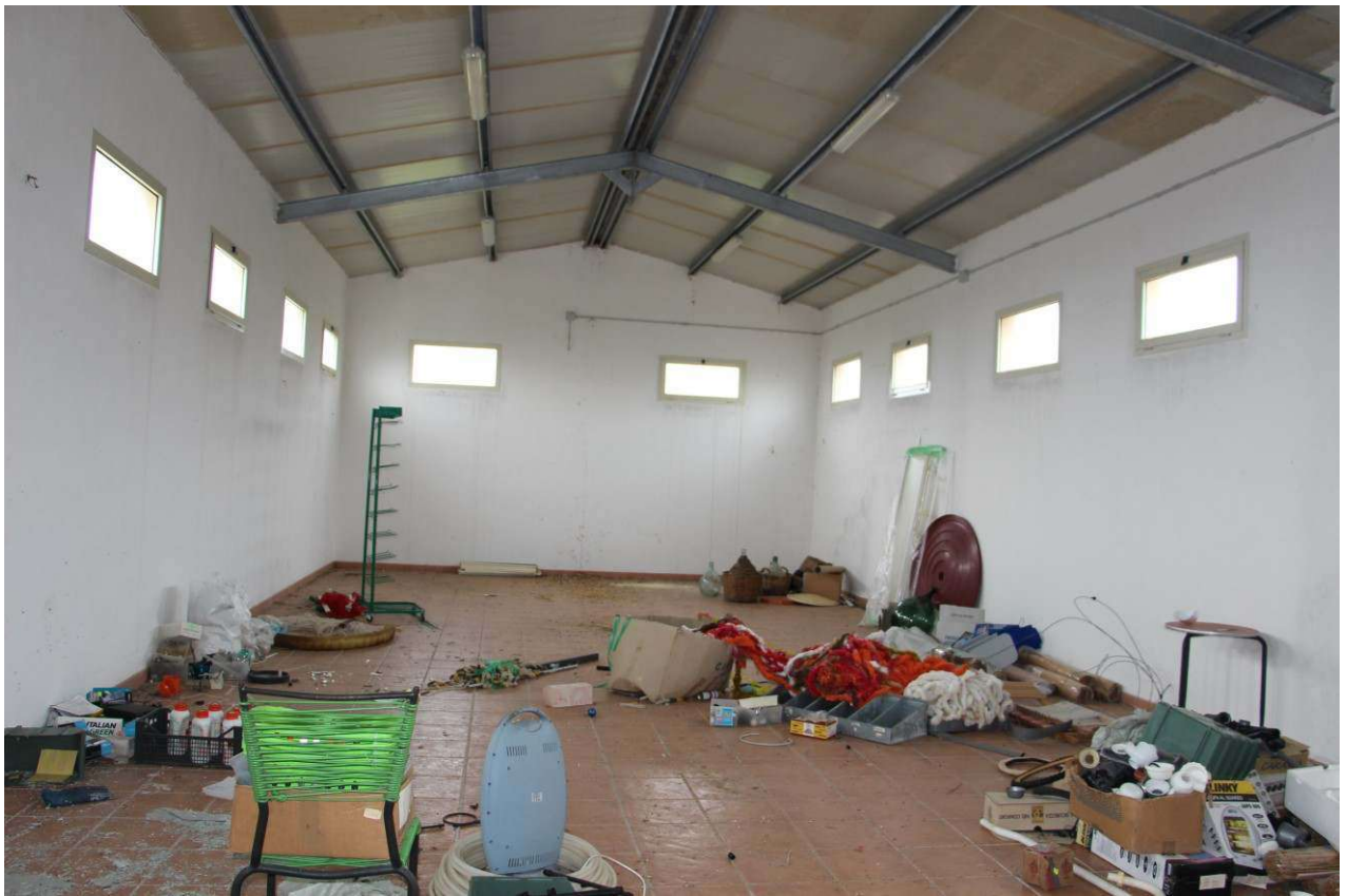
Fotografia 7. Vista dell'interno, piano terra