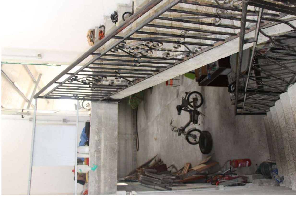
Fotografia 12. Vista del vano scala, verso il piano seminterrato