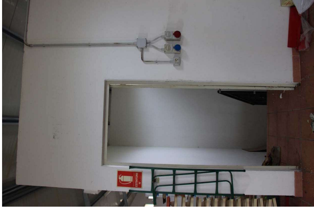
Fotografia 10. Vista dell'ingresso al vano scala