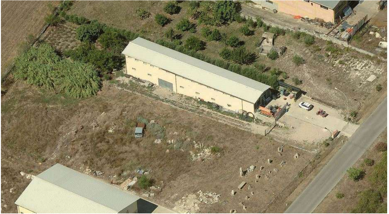
Fotografia 2. Vista aerea (2013)