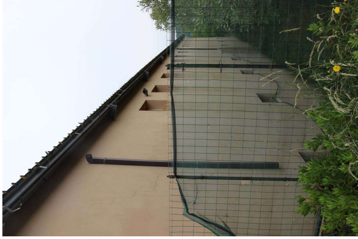
Fotografia 22: vista del prospetto laterale (nord-ovest)