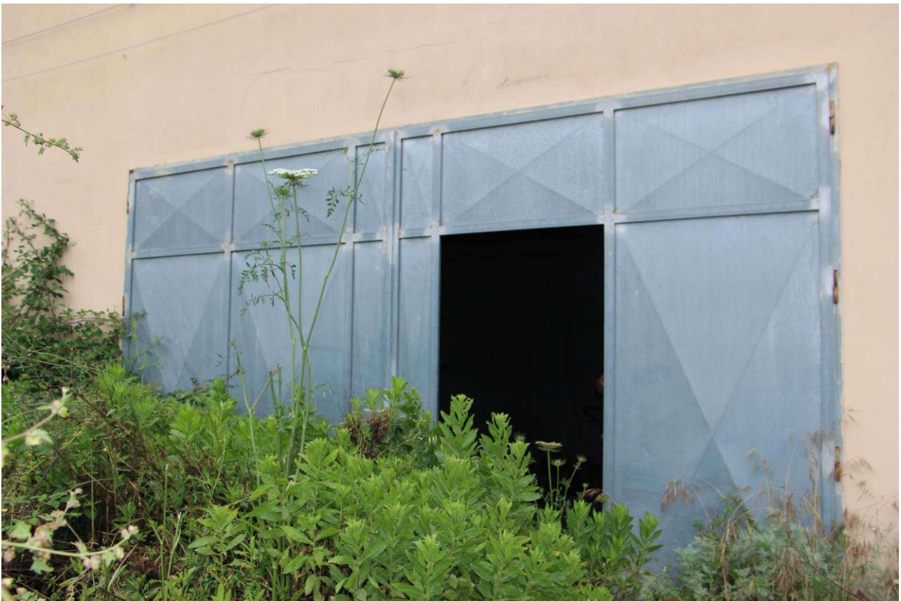
Fotografia 20: vista dell'accesso carrabile dal piazzale