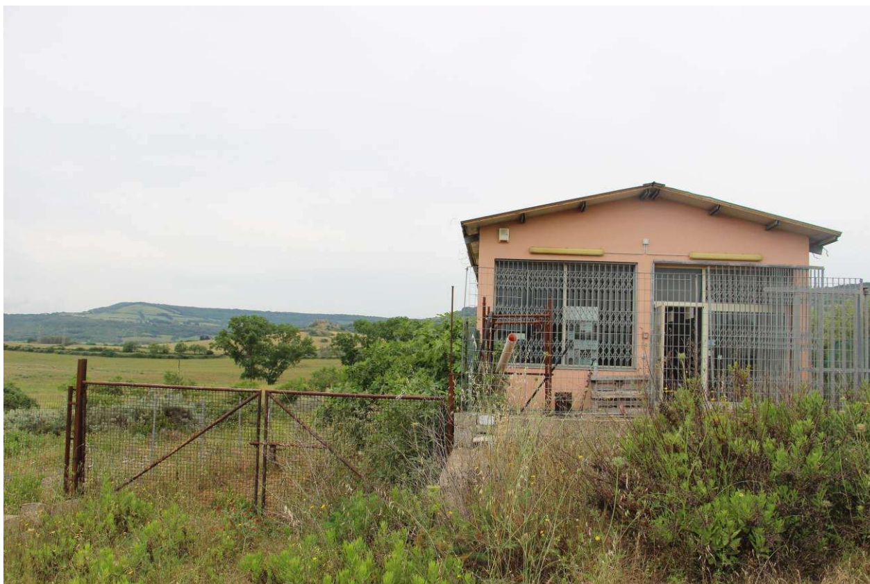
Fotografia 4. Vista del secondo accesso carrabile posto lungo l'area recintata e verso la rampa