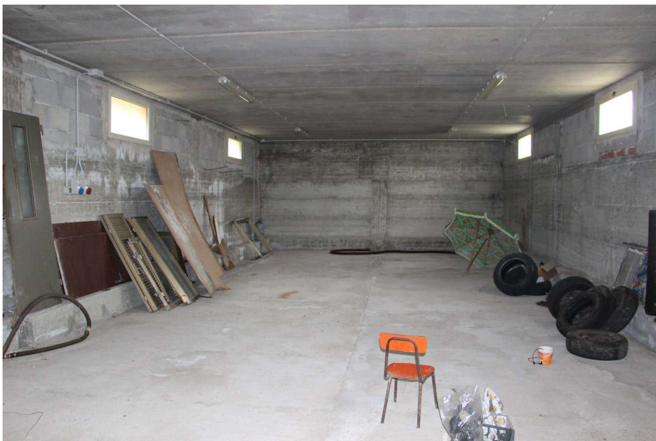
Fotografia 13. Vista del piano seminterrato