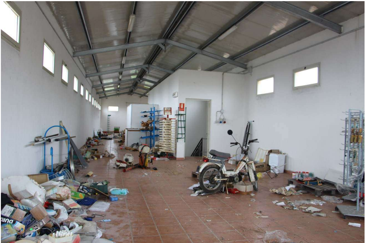
Fotografia 6. Vista dell'interno, piano terra