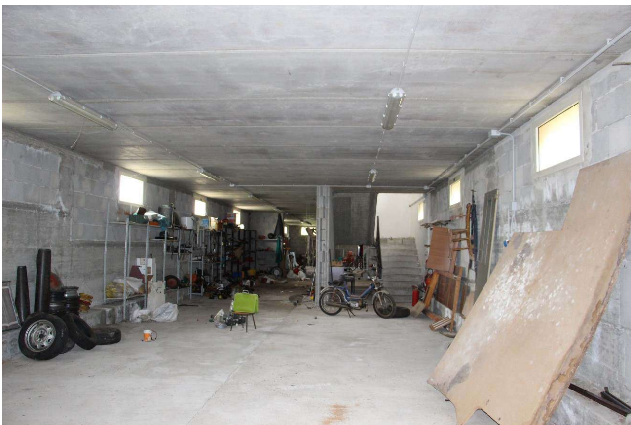
Fotografia 14. Vista del piano seminterrato