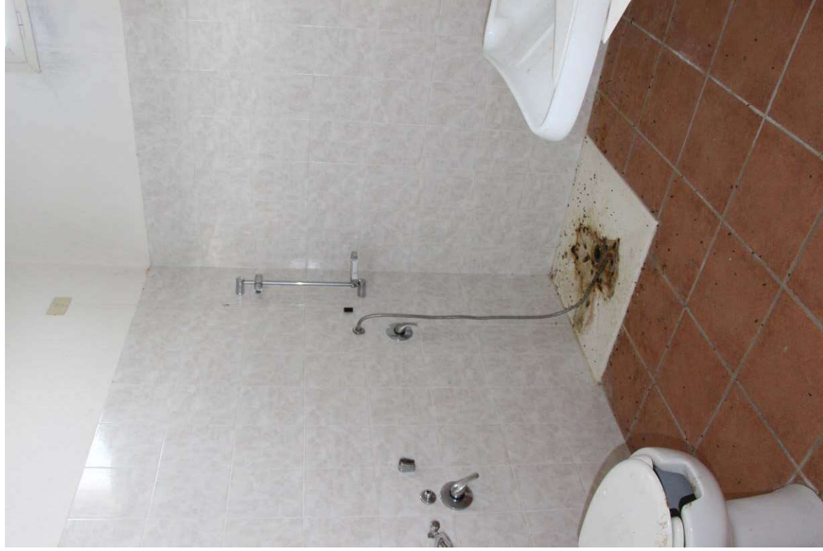
Fotografia 8. Vista del locale wc – disabili