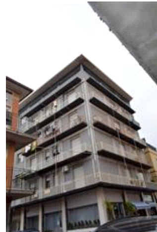
Vista del fabbricato da Via XXV Aprile