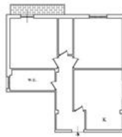
PIANO TERZO (00 - mt. 3,00)