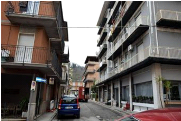
Vista del fabbricato su Via Rosolino Pilo

I beni sono ubicati in un'area residenziale. Il traffico nella zona è locale, i parcheggi sono sufficienti. Sono inoltre presenti i servizi di urbanizzazione primaria e secondaria.