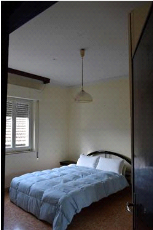
Camera da letto matrimoniale