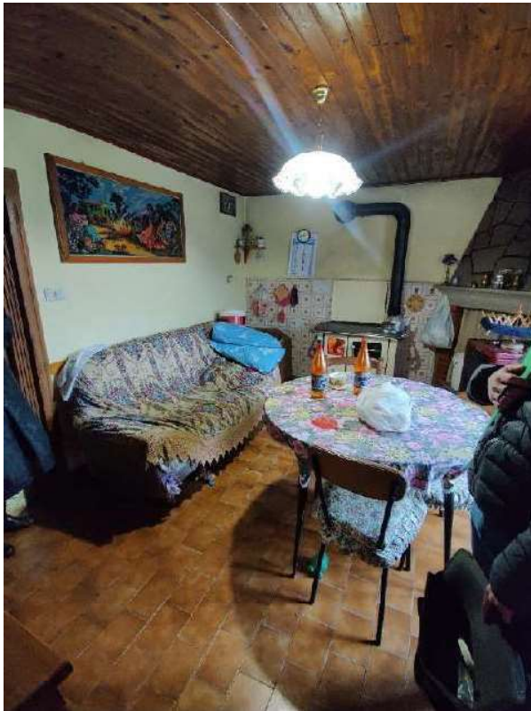
Sub 5 – Piano terra, tinello