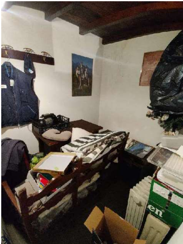
Sub 5 – Piano terra, ripostiglio annesso alla lavanderia