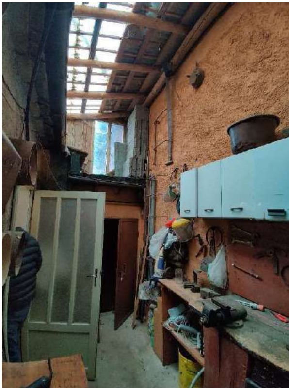
Sub 5 – spazio esterno sul retro dell'edificio