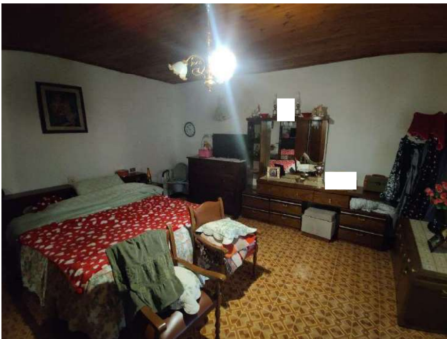
Sub 5 – Piano primo, camera