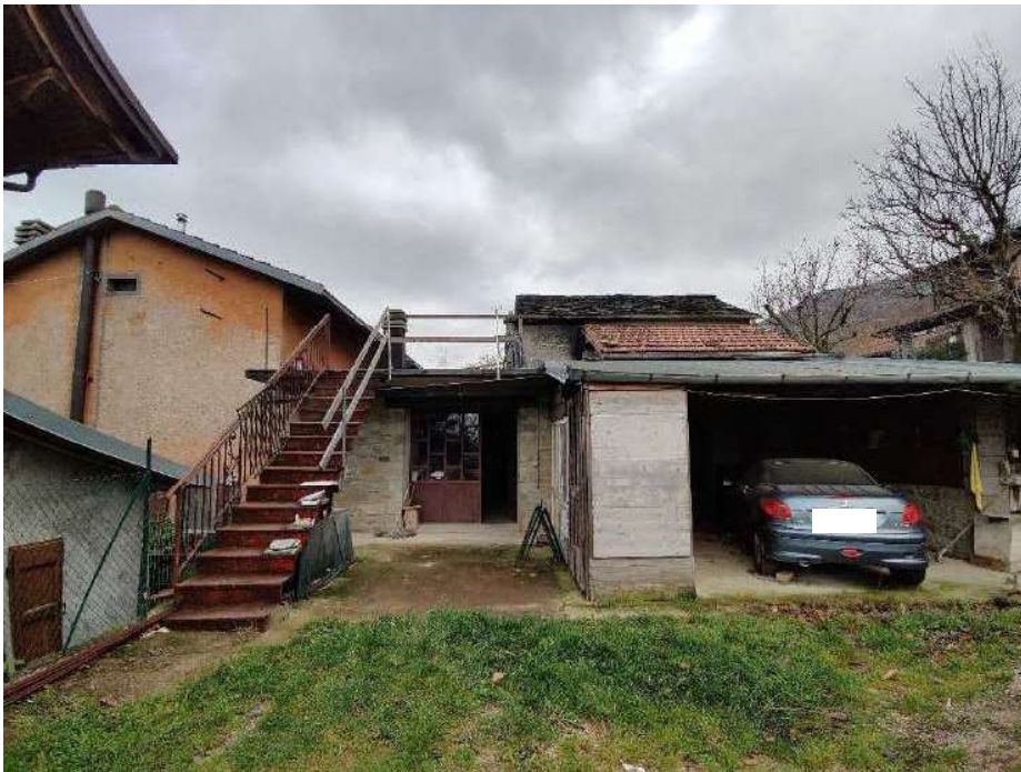
Sub 5 – Vista esterna dell'ingresso alla lavanderia e del porticato esterno