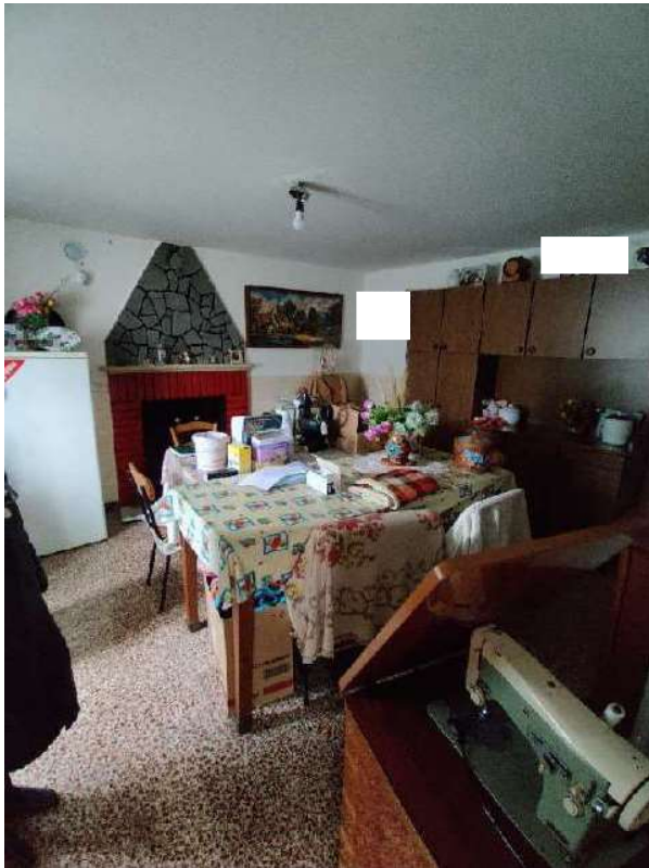
Sub 5 – Piano terra, sala