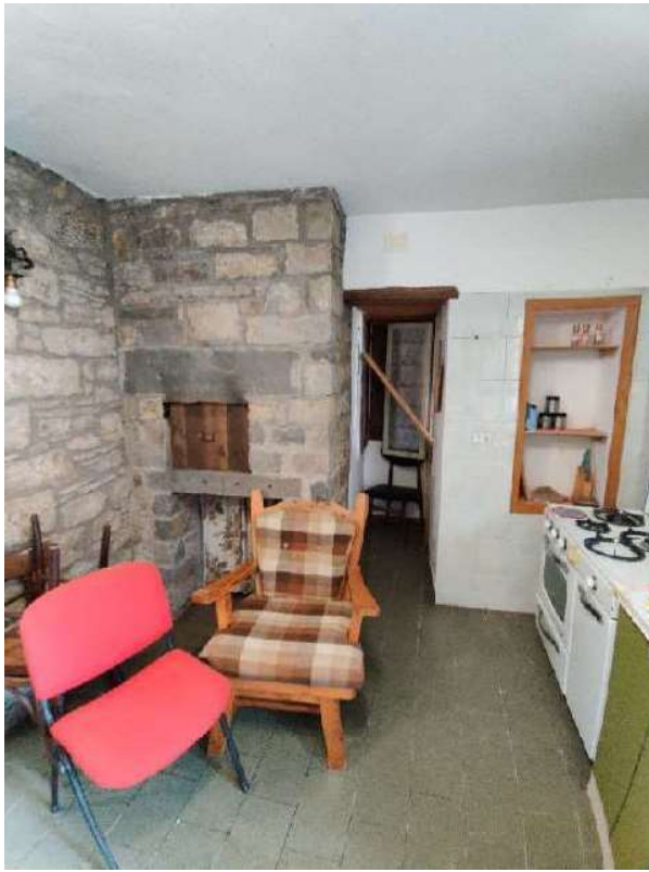
Sub 5 – Piano terra, lavanderia