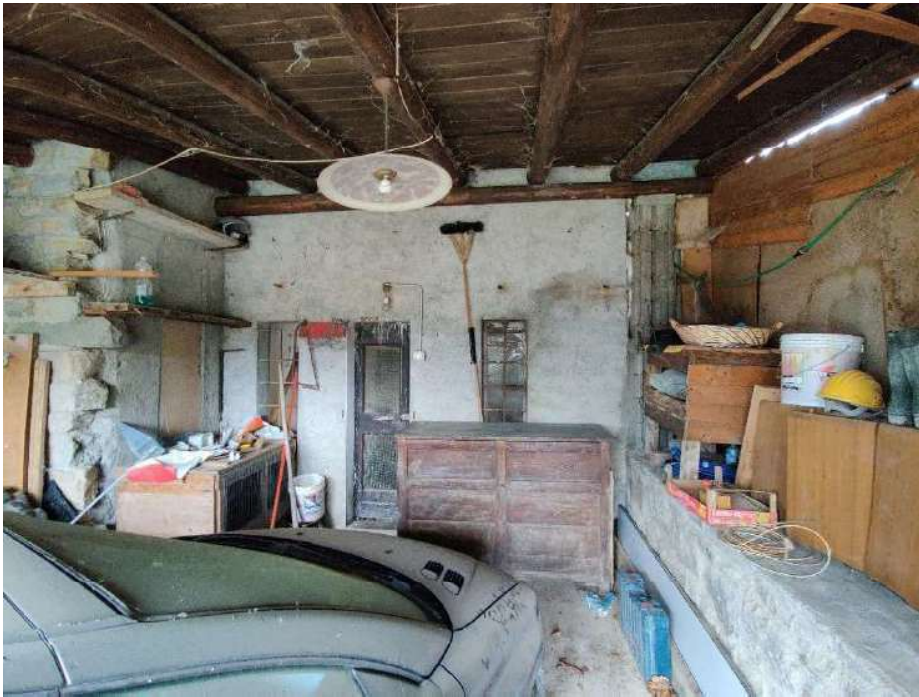
Sub 5 – Vista esterna dell'ingresso al pollaio, sotto al porticato esterno