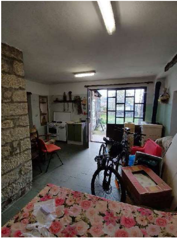
Sub 5 – Piano terra, lavanderia