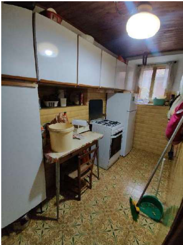
Sub 5 – Piano terra, cucinotto