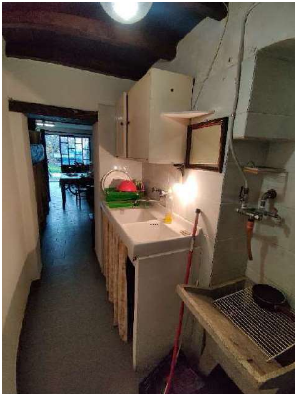
Sub 5 – Piano terra, lavanderia