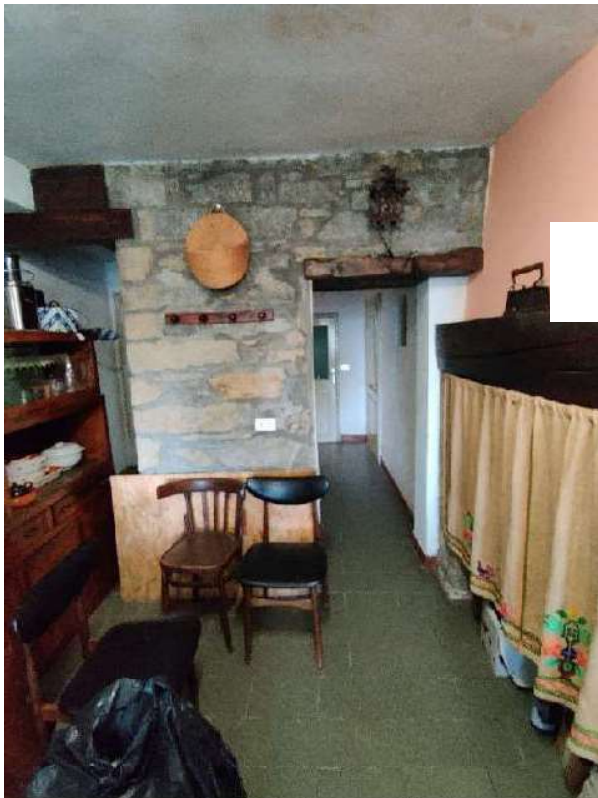
Sub 5 – Piano terra, lavanderia