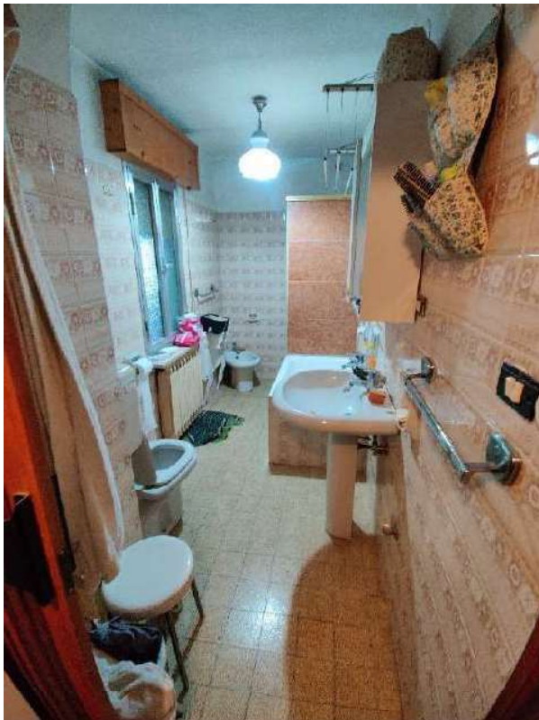
Sub 5 – Piano terra, servizio igienico