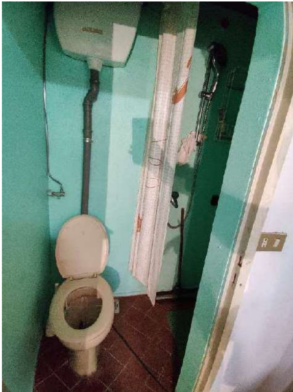
Sub 5 – Piano terra, bagno annesso alla lavanderia