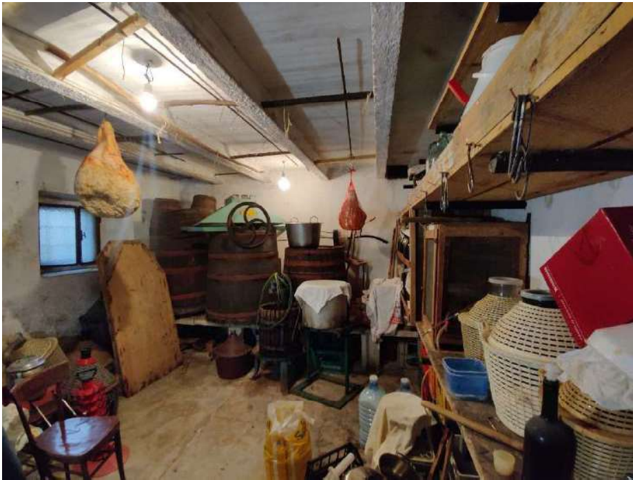
Sub 5 – Piano terra, cantina annessa alla lavanderia