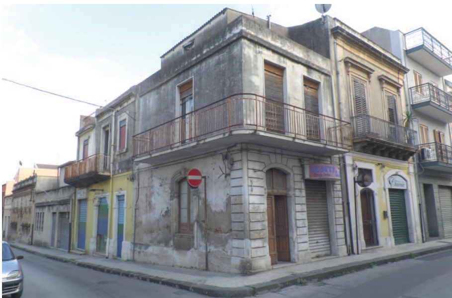
Immagine 1. Immobile sito a Floridia in Via Archimede n° 146 angolo Via Giusti

Sia nel terrazzo che nel balcone prospiciente su Via Giusti non sono definiti i confini con l'unità immobiliare adiacente (lato Est) che in passato costituiva un'unica abitazione con quello oggetto di perizia.