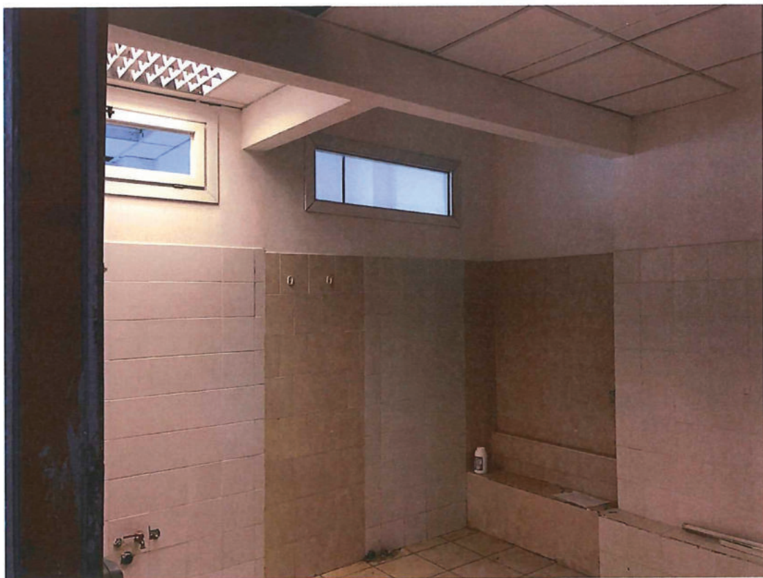
Foto n. 14 – Piano terra. Retro-locale cui si accede dalla porta di foto n. 13.