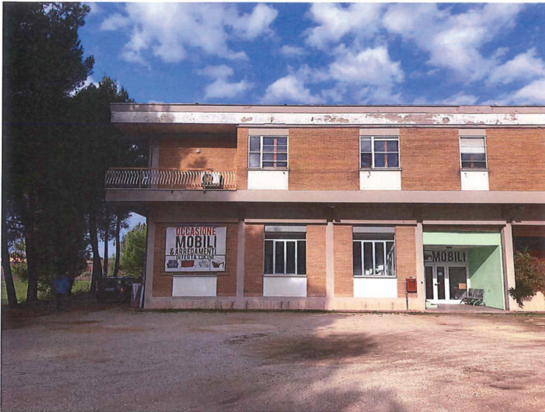
Foto n. 33 – EDIFICIO in SPELLO (foto nn. 33 – 49). Prospetto principale su via S. Claudio.