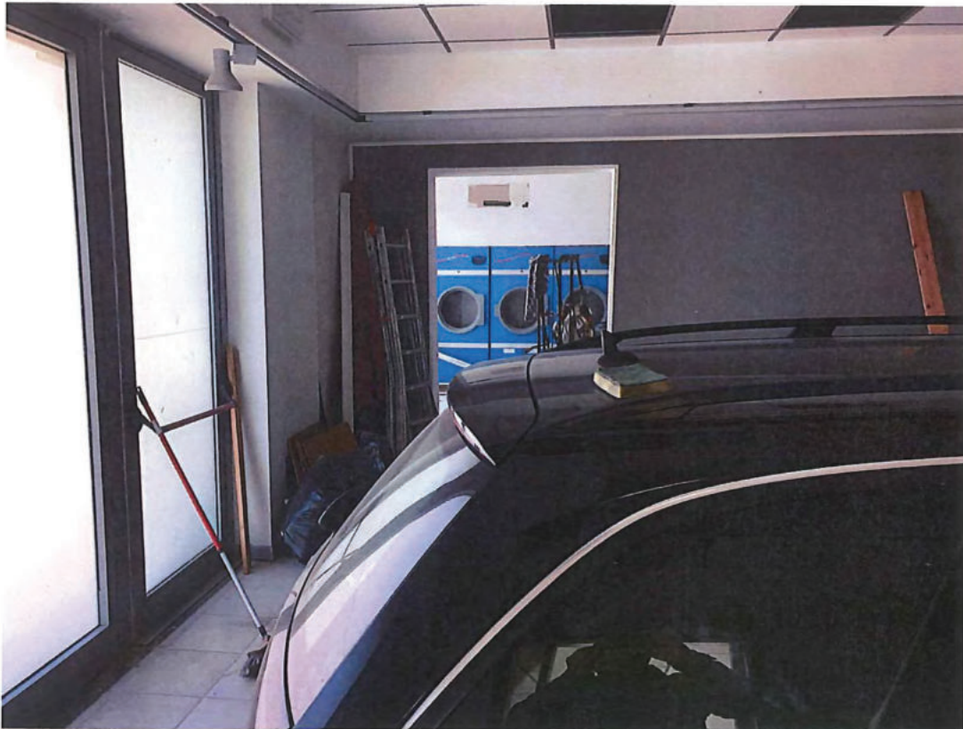
Foto n. 8 – Piano terra. Foto scattata dall'interno del locale centrale al quale si accede dalla porta di foto n. 7 a destra.