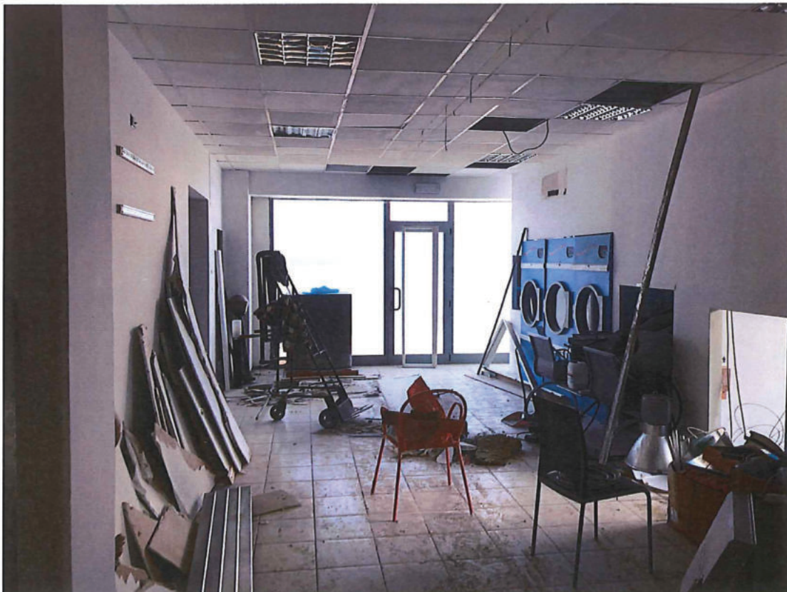
Foto n. 12 – Piano terra. Locale lato nord-ovest (vista in direzione sud-ovest).