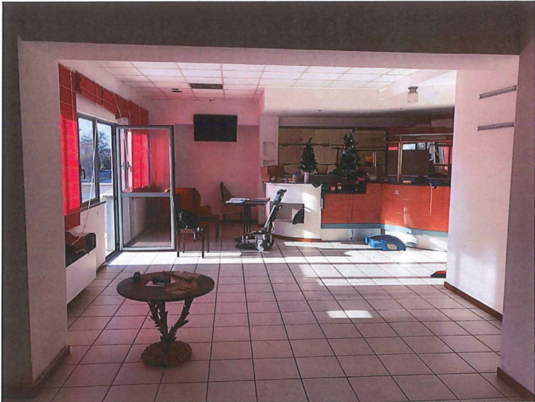
Foto n. 17 – Piano primo. A sinistra porta finestra di ingresso terrazzo di foto nn. 15 e 16.