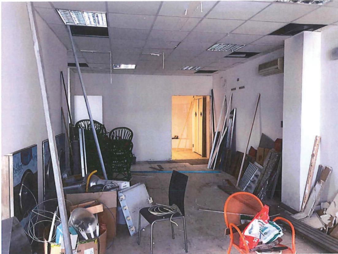
Foto n. 13 – Piano terra. Come foto n. 12 scattata in direzione opposta (nord-est).