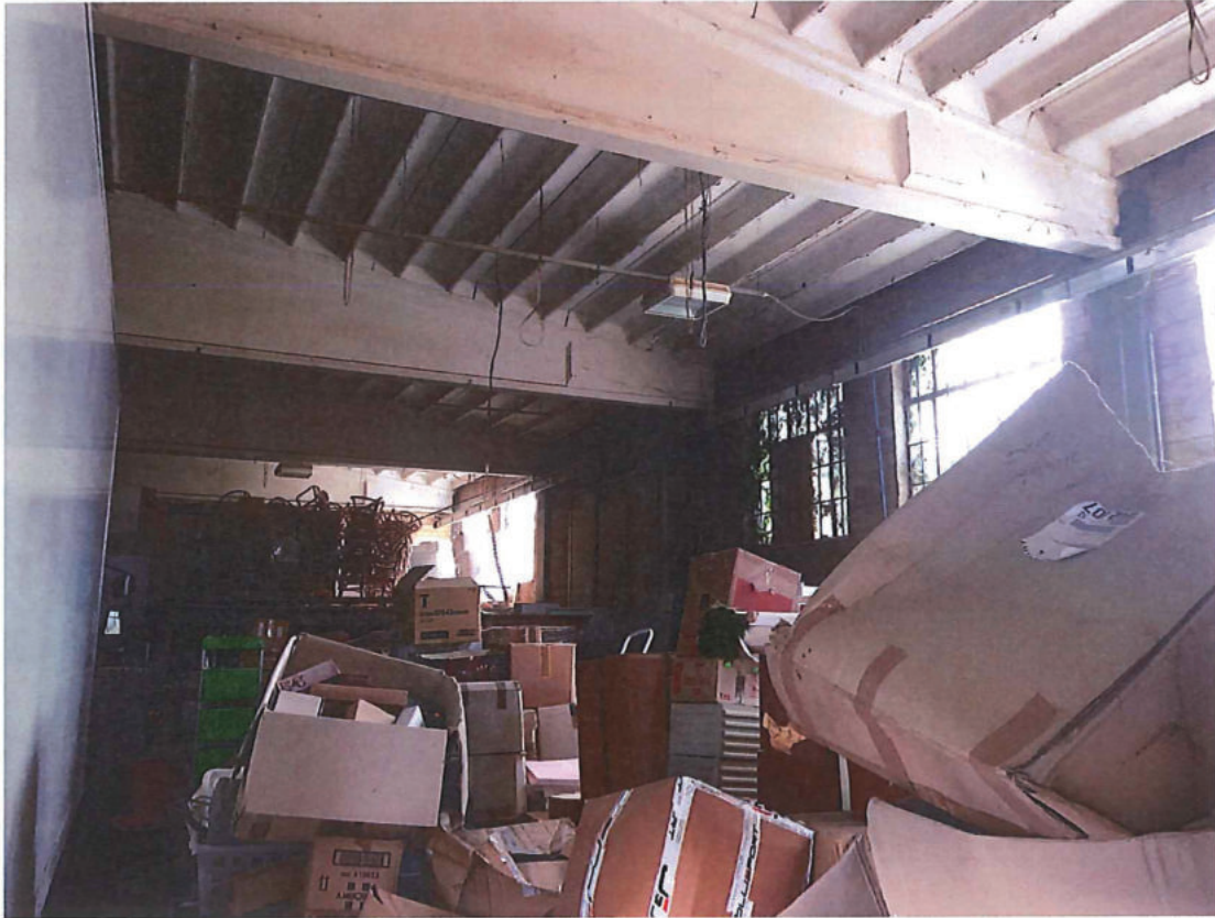
Foto n. 45 – Capannone. Foto scattata da posizione ovest. A sx. la fiancata di un camion.