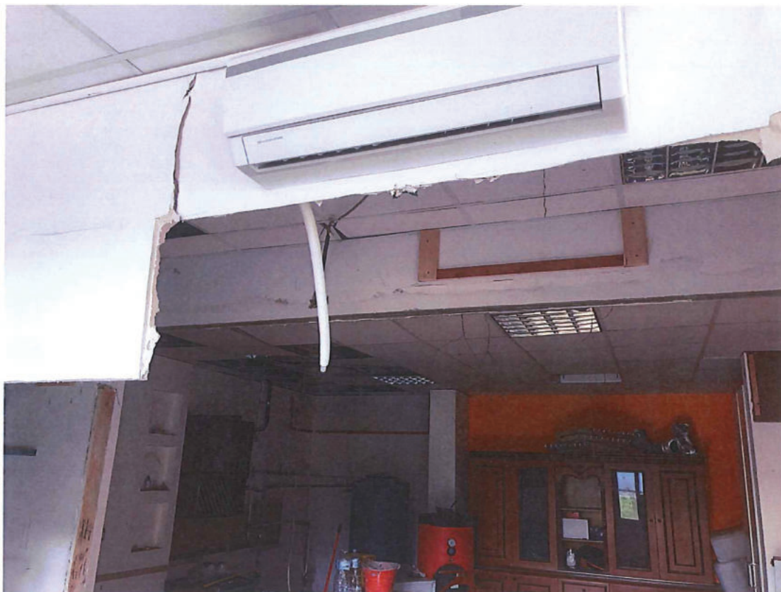
Foto n. 39 – Zona uffici. Particolare delle lavorazioni incomplete.