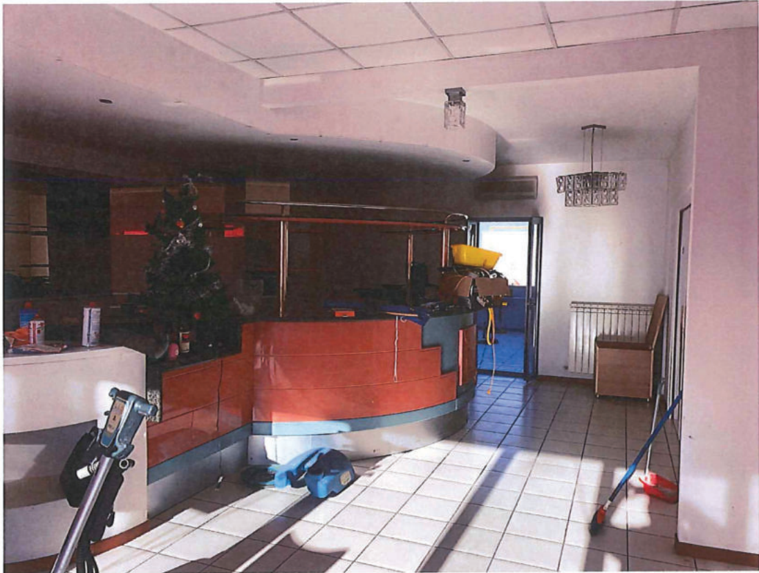
Foto n. 21 – Piano primo. Sullo sfondo la porta di accesso all'altro terrazzo lato nord-ovest.