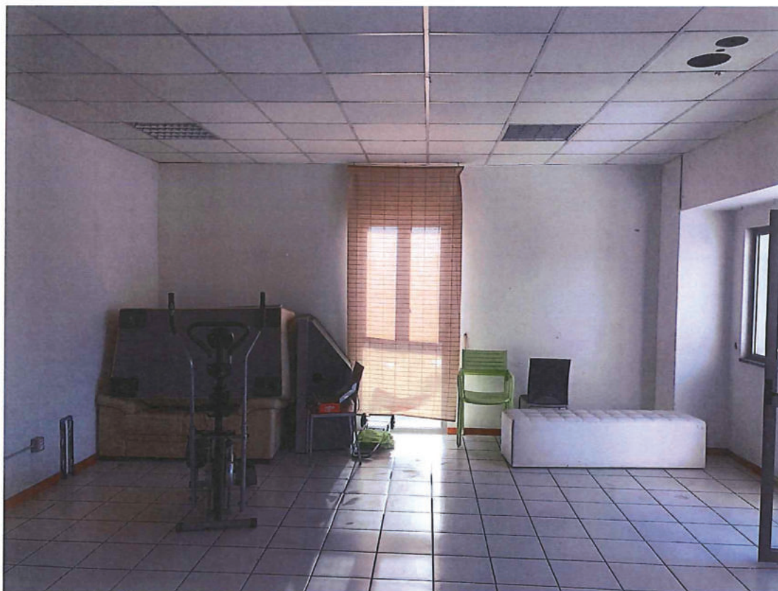
Foto n. 19 – Come foto n. 18 in direzione sud-est (frontestrada).