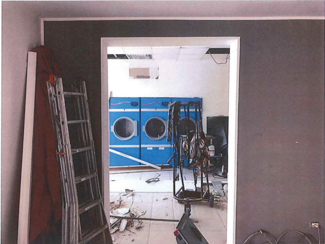
Foto n. 11 – Piano terra. Vista dal locale centrale verso il locale lato nord-ovest.