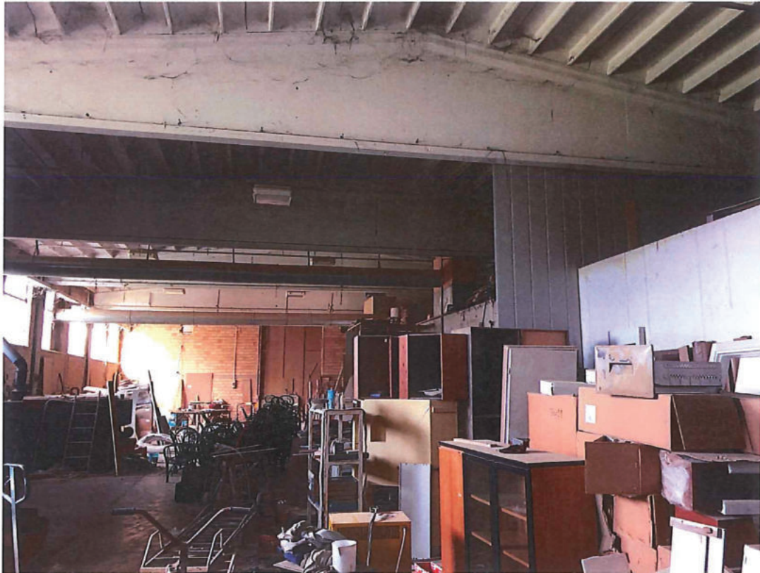
Foto n. 41 – Capannone. Foto scattata di spalle alla zona uffici in dir. nord-ovest. Sullo sfondo la parete tutt'altezza divisoria.