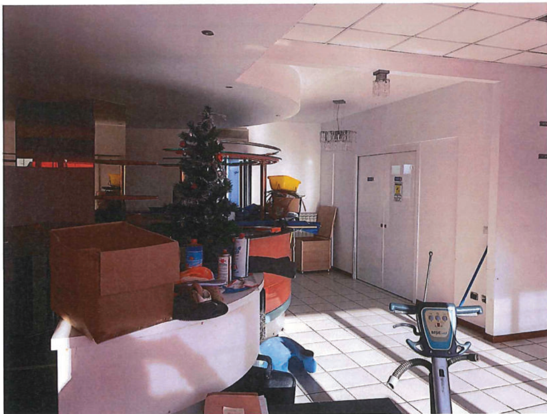
Foto n. 22 – Come foto n. 21. A destra ingresso alla zona appartamento.