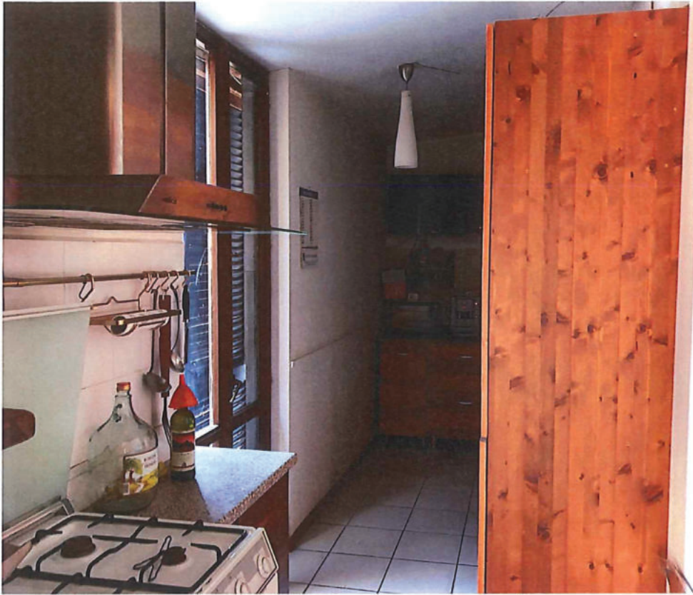
Foto n. 29 – Piano primo. Ambiente cucina (la porta finestra è quella di foto n. 24).