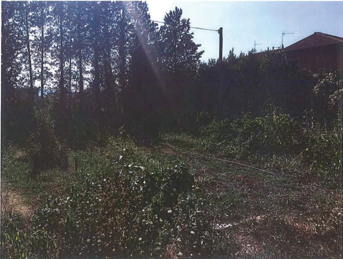
Foto n. 47 – Terreno-corte part. 800 (foto scattata in dir. ovest).