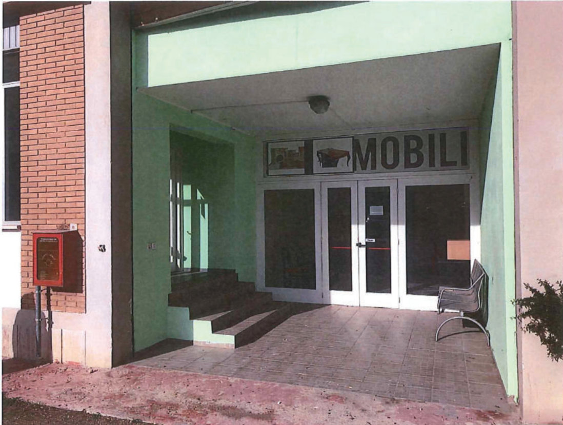
Foto n. 37 – Come foto n. 33. Ingresso zona uffici (lato sud-est).