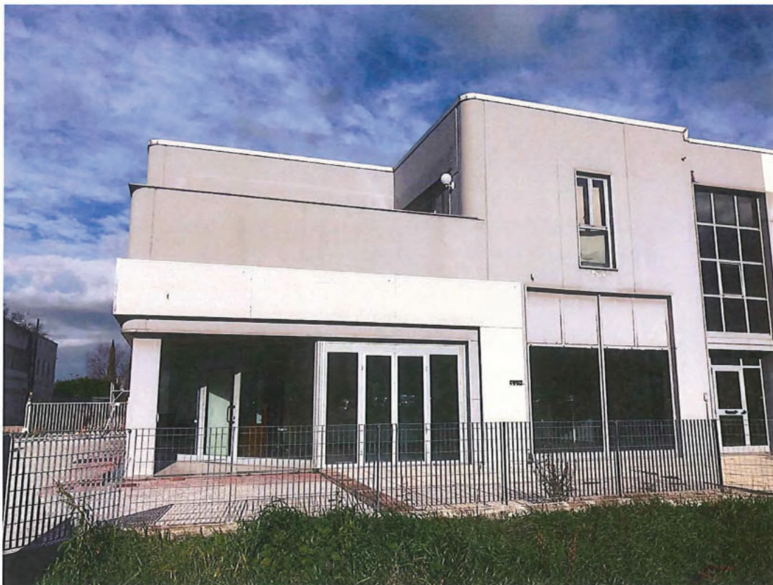
Foto n. 1 – EDIFICIO in FOLIGNO (foto nn. 1 - 32). Facciata frontestrada (via Fedeli).