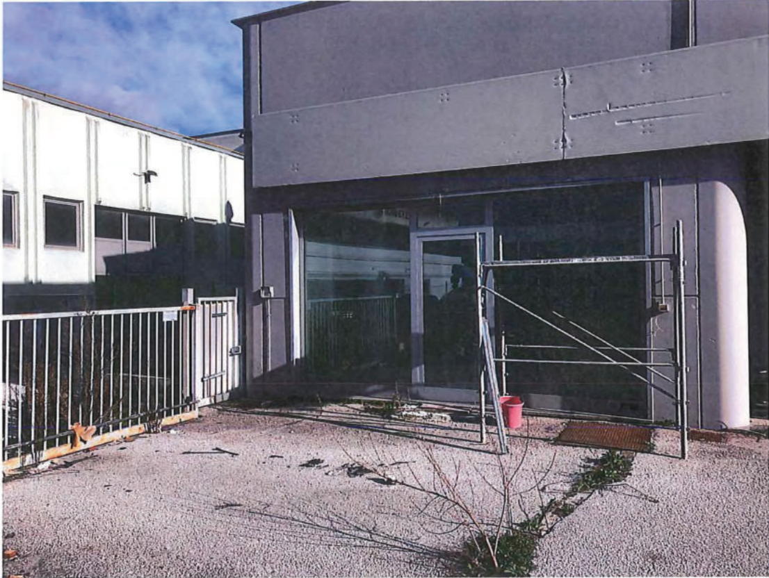
Foto n. 3 – Retro-edificio lato sud-ovest. A sx cancelletto di accesso alla part. 1613 non pignorata.