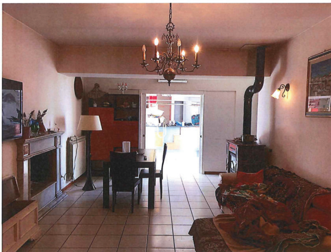
Foto n. 28 – Piano primo. Zona giorno dell'appartamento (foto scattata in dir. sud – ovest).