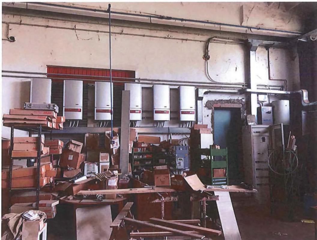
Foto n. 43 – Capannone. Foto scattata dalla stessa posizione delle foto nn. 40 – 42. Sullo sfondo la porta di ingresso alla zona uffici (a dx) e impianti fotovoltaici.