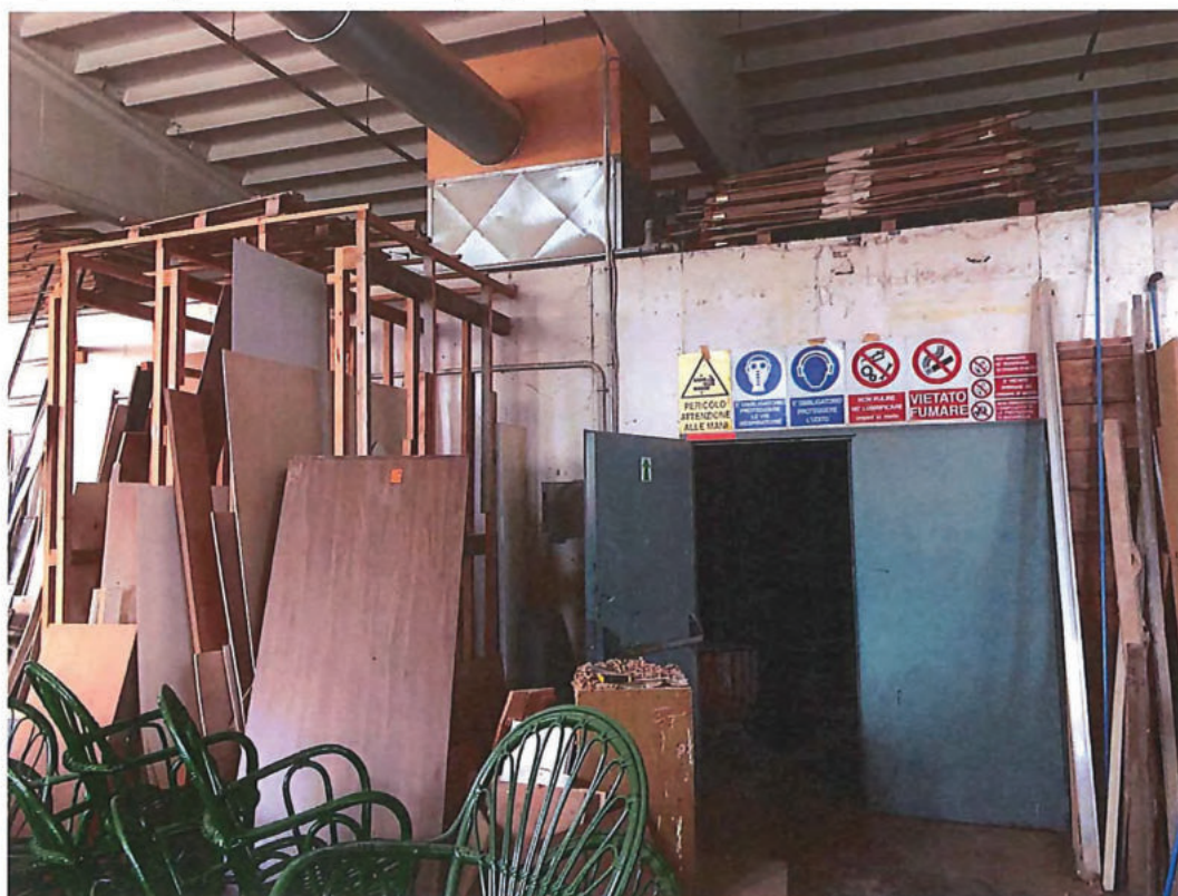
Foto n. 44 – Capannone. Zona cabina di verniciatura (foto scattata di spalle alle vetrate: dir. nord-est).