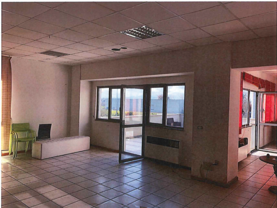
Foto n. 18 – Come foto n. 17 (porte finestre sul terrazzo frontestrada).