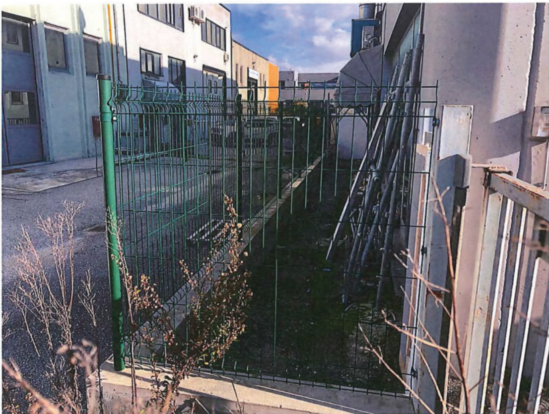
Foto n. 4 – Part. 1613 non pignorata (retro-edificio lato nord-ovest).