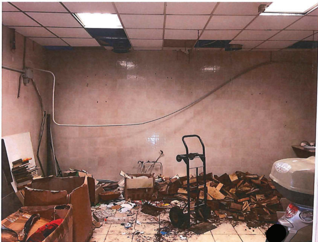
Foto n. 10 – Piano terra. Retro-locale confinante con il vano scale al quale si accede dalla porta centrale di foto n. 9.