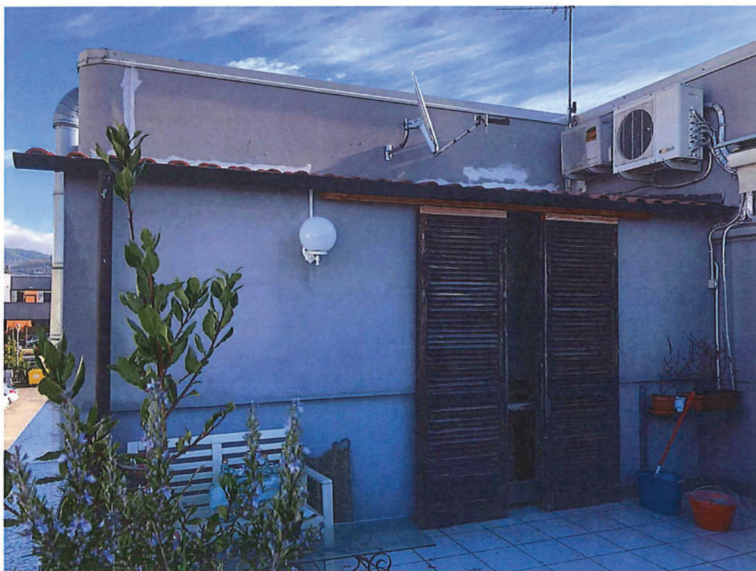
Foto n. 24 – Come foto n. 23. È la seconda porta finestra sul terrazzo nord-ovest (passaggio dal locale cucina).