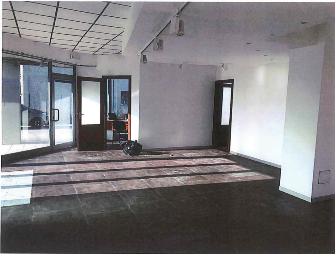
Foto n. 7 – Come foto n. 6 scattata in direzione opposta (sud-ovest).