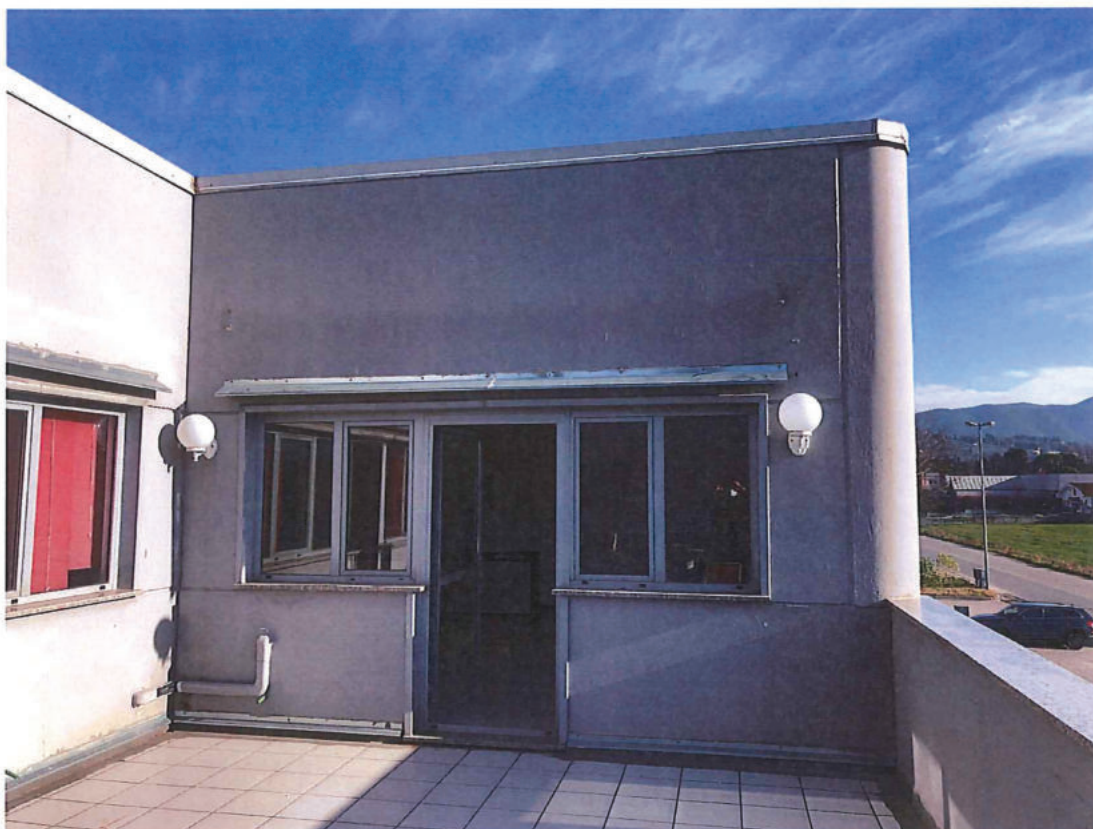
Foto n. 15 – Piano primo. Terrazzo fronte strada (foto scattata in direzione nord- est).