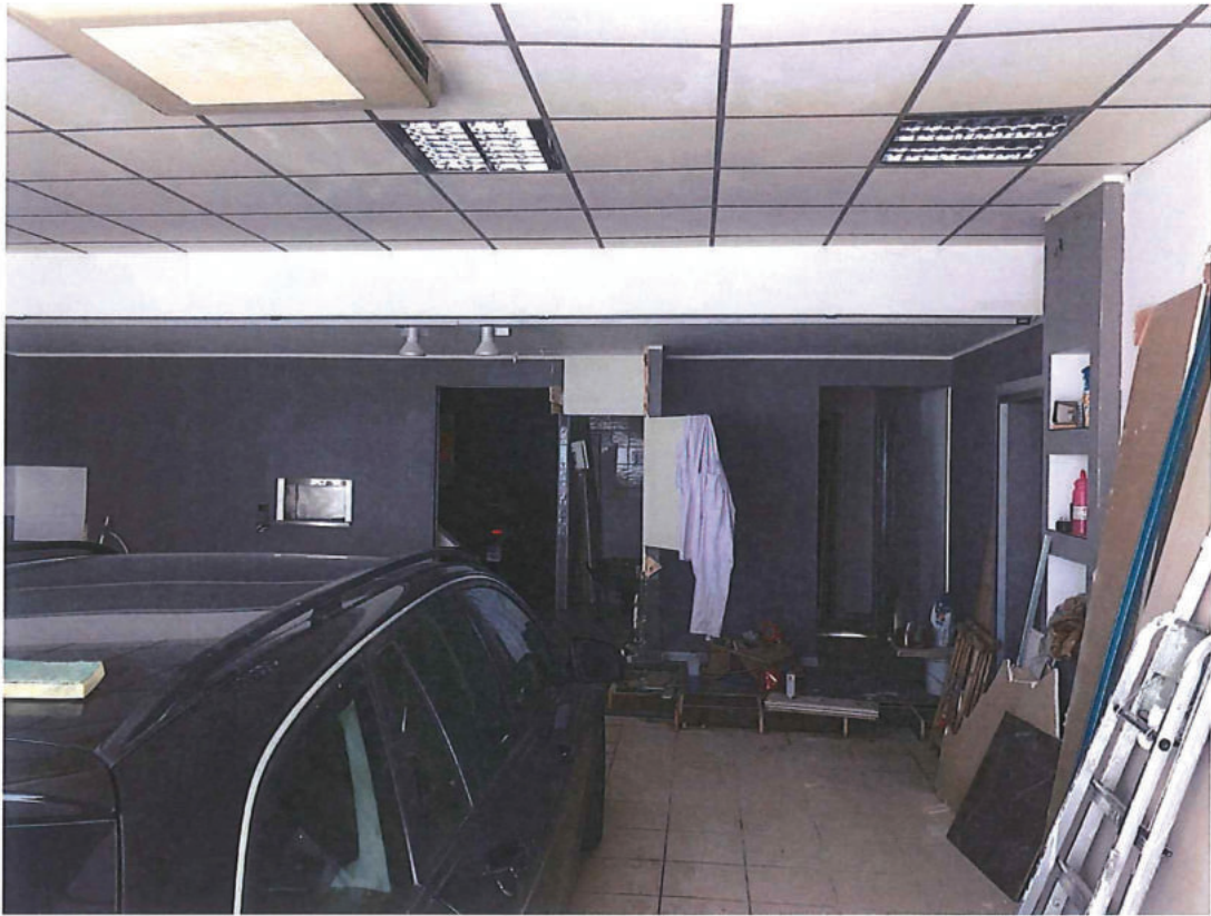
Foto n. 9 – Piano terra. Stesso ambiente di foto precedente (vista in direzione nord-est).