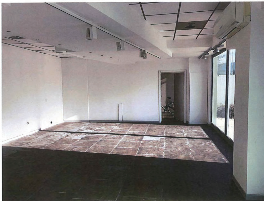
Foto n. 6 – Come foto n. 5 (sullo sfondo porta di accesso al vano scale).