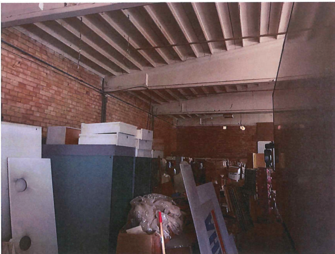
Foto n. 46 – Capannone. Come foto precedente. Sullo sfondo parete divisoria interna.