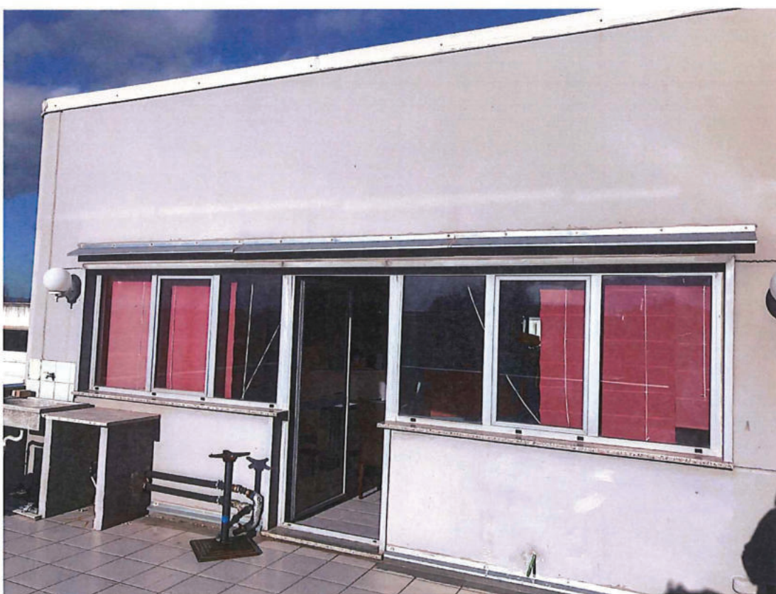
Foto n. 16 – Come foto n. 15 (foto scattata di spalle a via Fedeli).