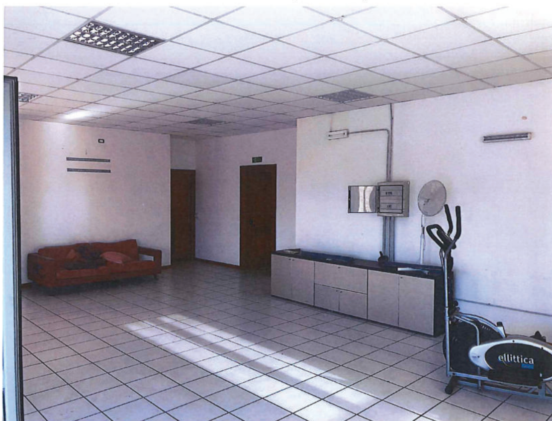
Foto n. 20 – Piano primo. Sullo sfondo a destra la porta verso il vano scale.