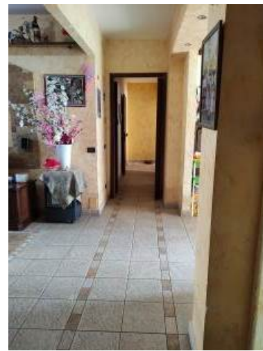
Foto 8,9. Ingresso appartamento