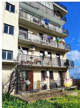
Foto 2,3,4. Fabbricato in cui è sito l'immobile