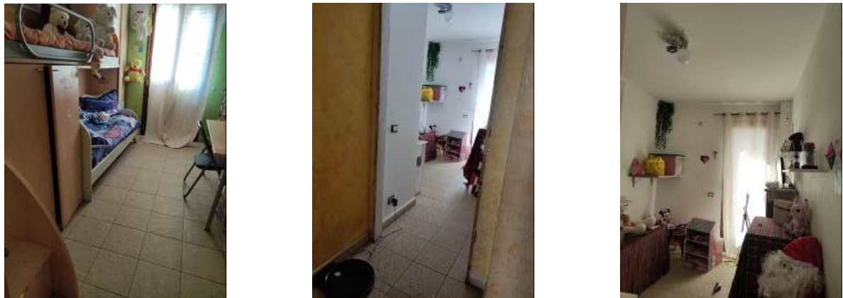
Foto 24,25,26. Camere 1 e 2