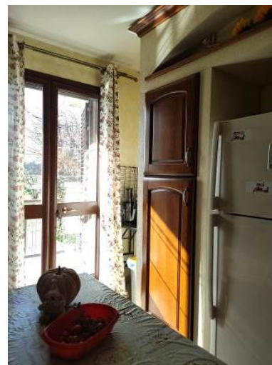
Foto 13,14,15,16. Cucina