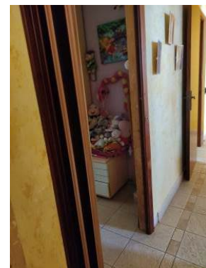
Foto 17,18,19. Disimpegno