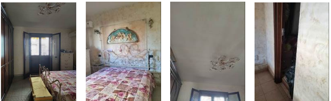
Foto 27,28,30,31. Camera 3