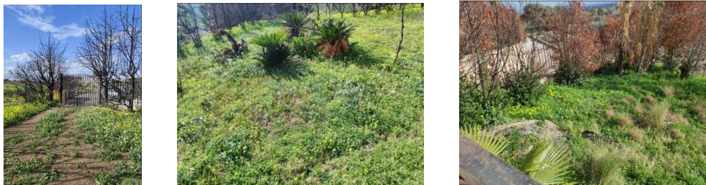
Foto 35,36,37. Terreno di pertinenza lato Ovest