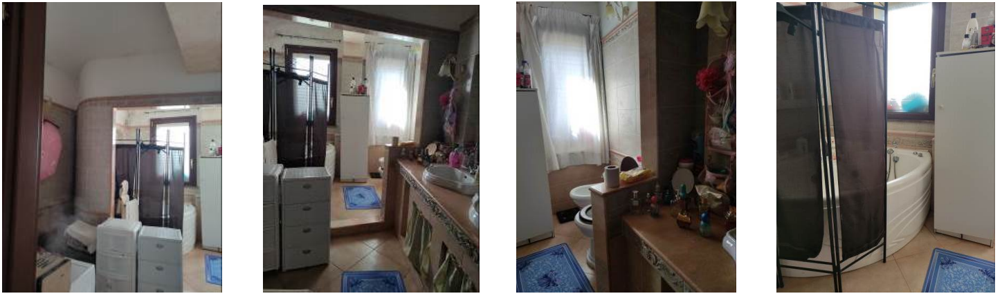
Foto 20, 21,22,23. Bagno