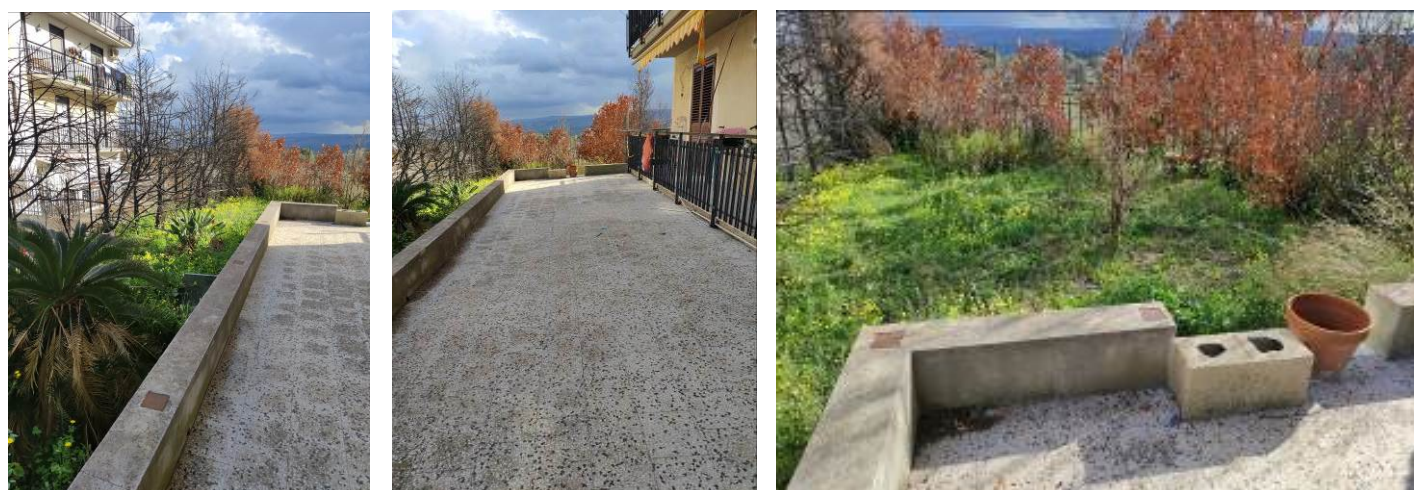
Foto 38,39,40,41,42,43. Balcone 2 e Terreno di pertinenza lato Est