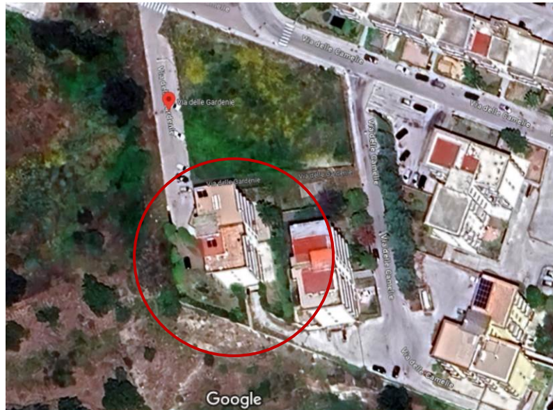
Foto 1. Inquadramento territoriale, fabbricato sito in via delle Gardenie n 3

Immobile A, sito in Melilli (Sr), C.da Corvo, Via delle Gardenie n. 3 NCEU MELILLI, F. 15, p.lla 1276, sub 4 Appartamento, piano terra