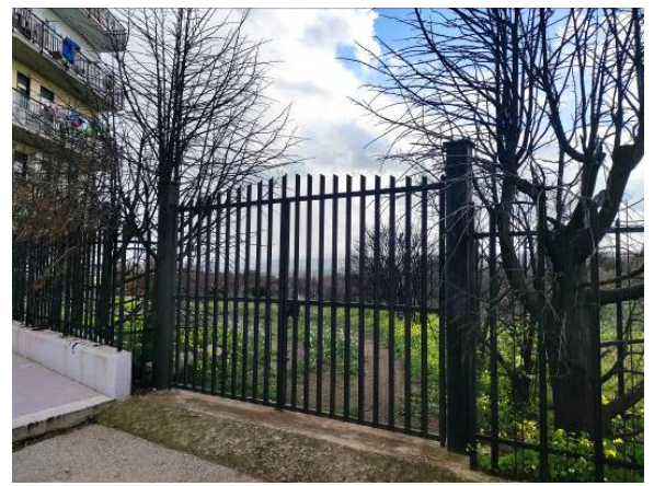
Foto 5,6,7. Ingresso fabbricato condominiale, ingresso appartamento e ingresso lotto di pertinenza lato Ovest