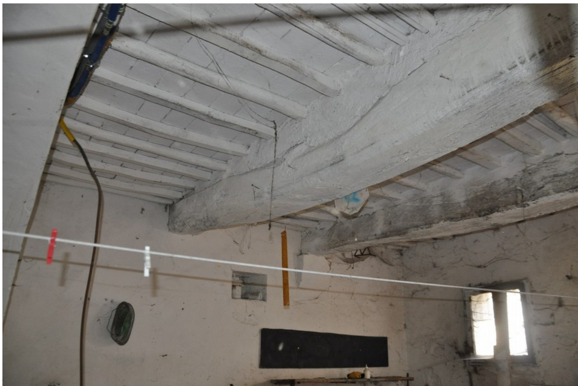
FOTO 10 PIANO TERRA FONDO