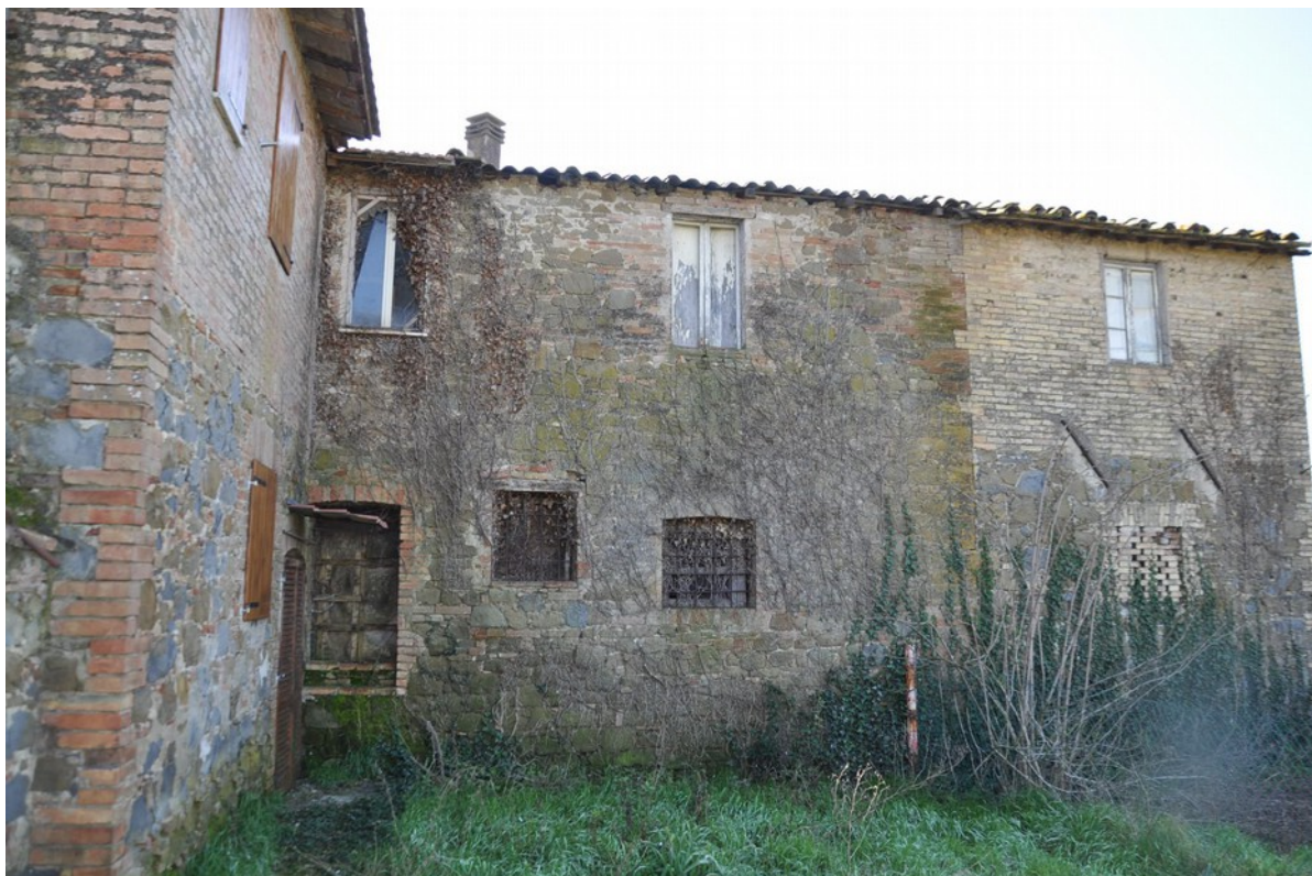
FOTO 4 PROSPETTO POSTERIORE PARTICOLARE COPERTURA