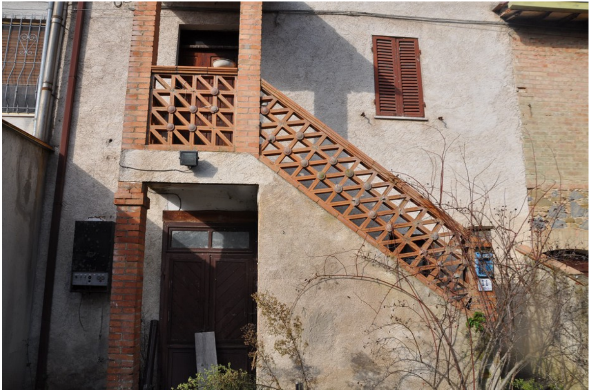
FOTO 6 INGRESSO PIANO TERRA