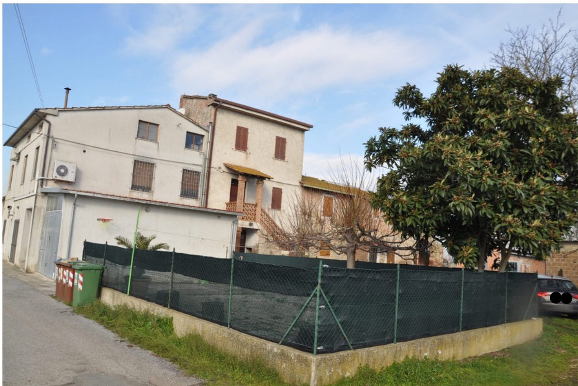
FOTO 2 PROSPETTO ANTERIORE CON CORTE