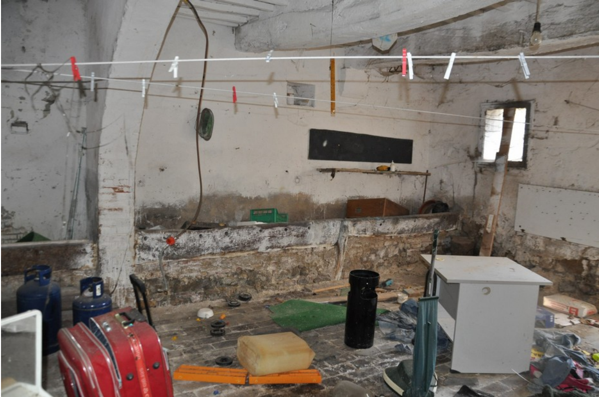
FOTO 8 PIANO TERRA FONDO