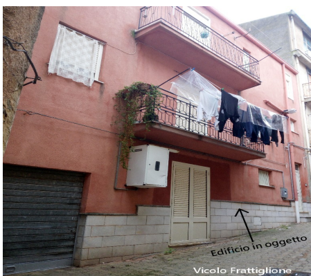
Prospetto su Vicolo Frattiglione

L'esterno dell'edificio, al momento del sopralluogo, era privo di indicazioni dei numeri civici; tuttavia gli ingressi (due) sono riportati in catasto e corrispondono ai civici 9 e 11 del Vicolo Frattiglione.