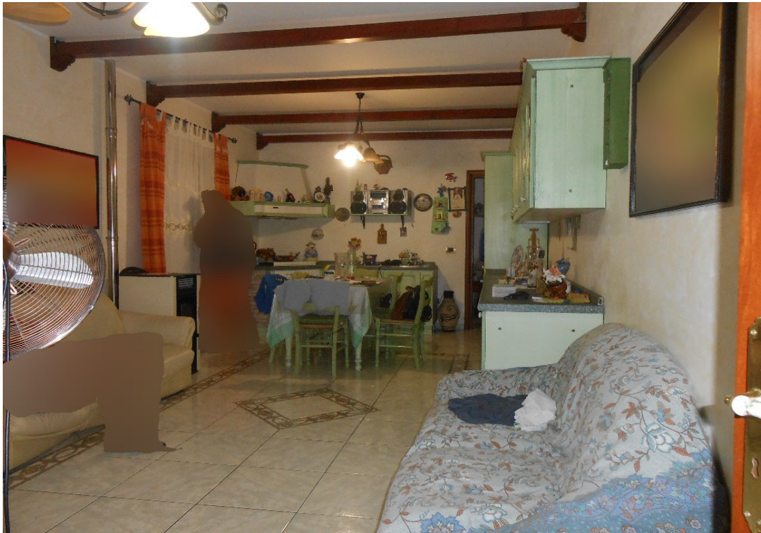
7. Primo piano, soggiorno-pranzo