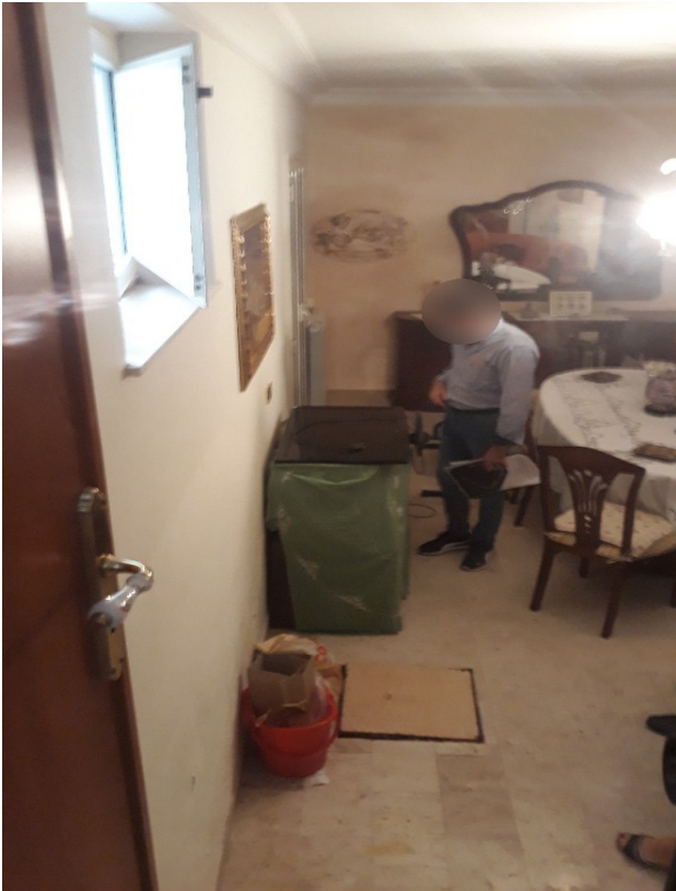
2. L'interno del piano terra, nel pavimento si nota la botola della cisterna interrata