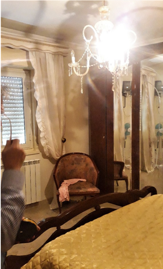
14 Piano secondo, camera matrimoniale