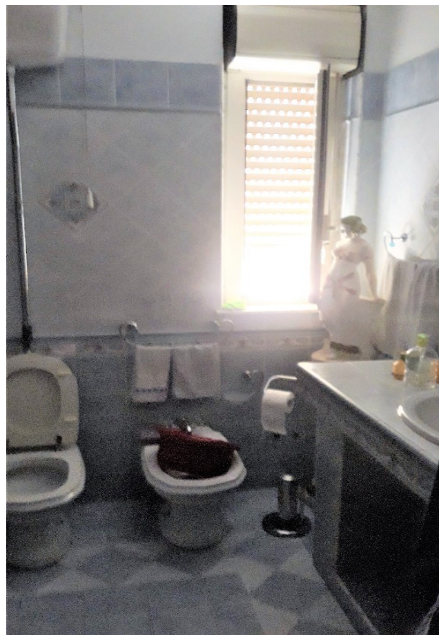
10. Secondo piano, WC bagno con doppio lavabo