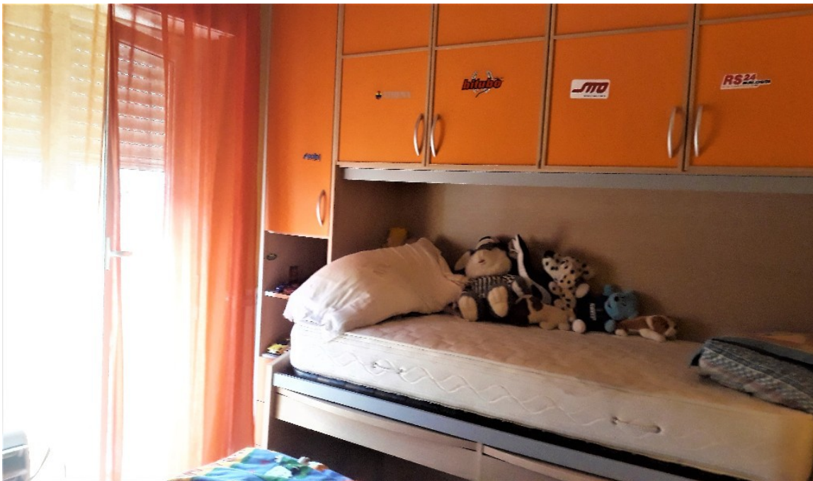
13. Secondo piano, camera letto ragazzi