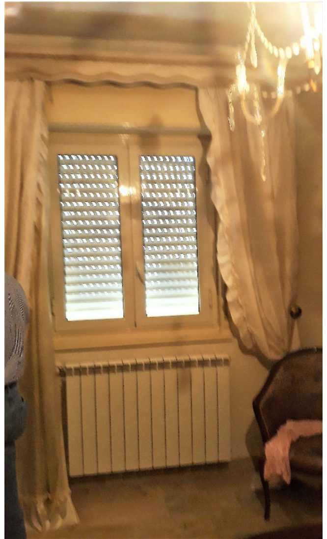
15. Piano secondo, camera matrimoniale, particolare dell'impianto termico [disattivato]