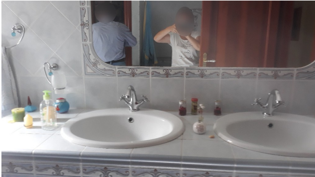
12. Secondo piano, il doppio lavabo in bagno