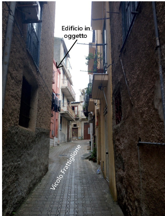
6. Vicolo Frattiglione