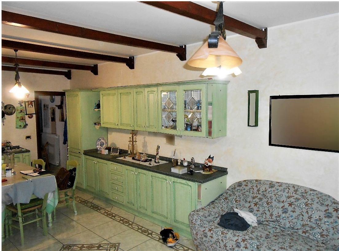
8. Primo piano, soggiorno-pranzo, in fondo l'accesso alla cucina