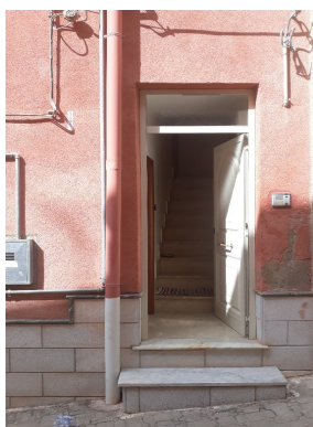
Il prospetto è privo delle indicazioni dei numeri civici