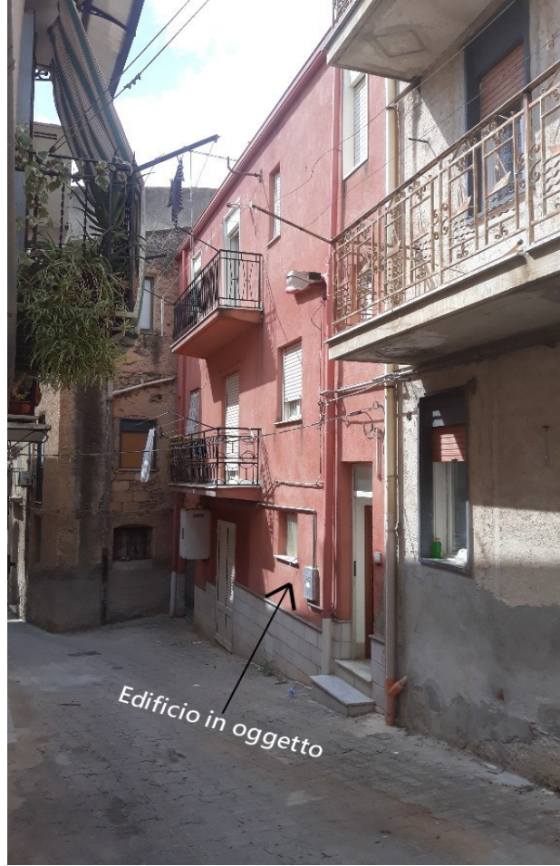
5. Prospetto su Vicolo Frattiglione