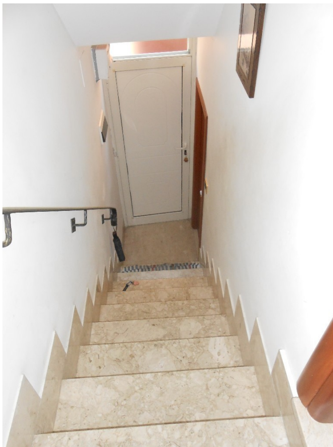
9. La rampa che dal piano terra conduce al primo piano. In fondo il portoncino d'ingresso sul Vicolo Frattiglione