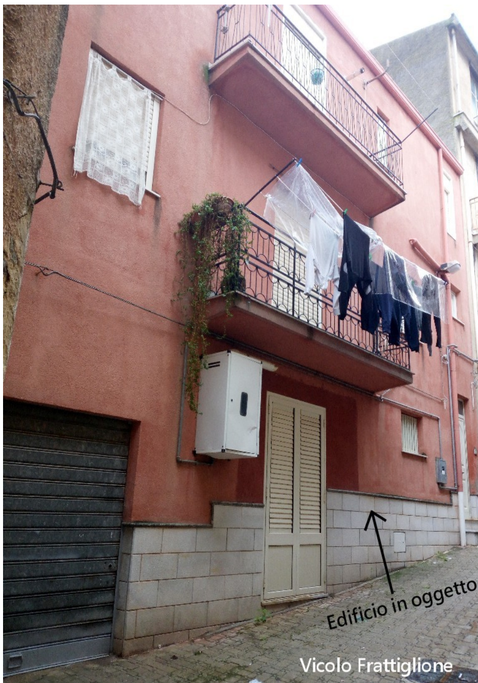
4. Prospetto su Vicolo Frattiglione

Il piano terra ha dimensioni planimetriche inferiori rispetto ai piani primo e secondo in quanto la parte a sinistra del piano terra guardando il prospetto (non riportata nella TAV 1 Pianta dello stato di fatto ma visibile nella seguente foto 4 in basso a sinistra, con saracinesca) non fu oggetto, nel 2000, della compravendita e dunque non appartiene agli odierni esecutati.