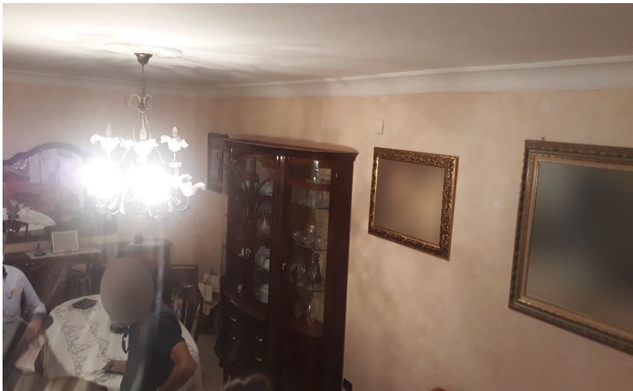
1. L'interno del piano terra

L'appartamento nel suo complesso è in buono stato di manutenzione.