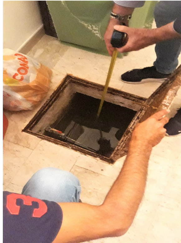
3. La botola della cisterna interrata, al piano terra