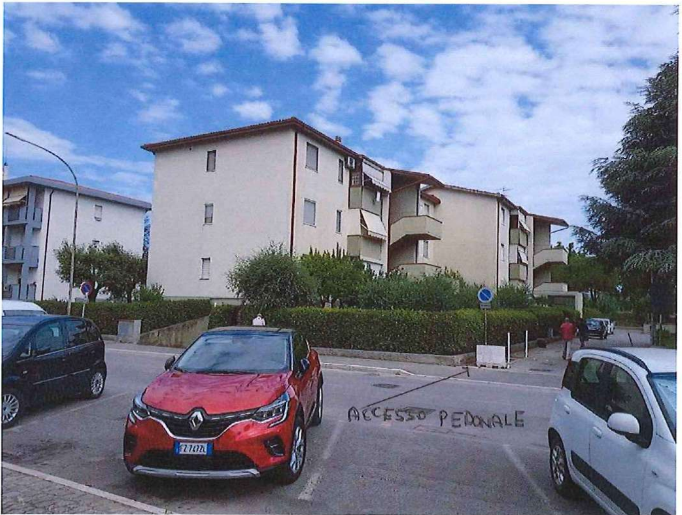
EDIFICIO VIA DELLA PACE N. 85-