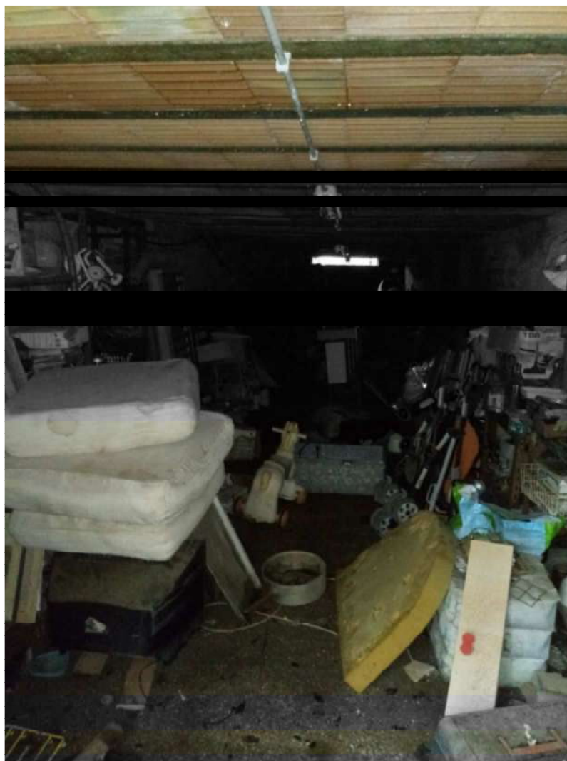
INTERNO INTERCAPEDINE RISTORANTE AGRITURISTICO