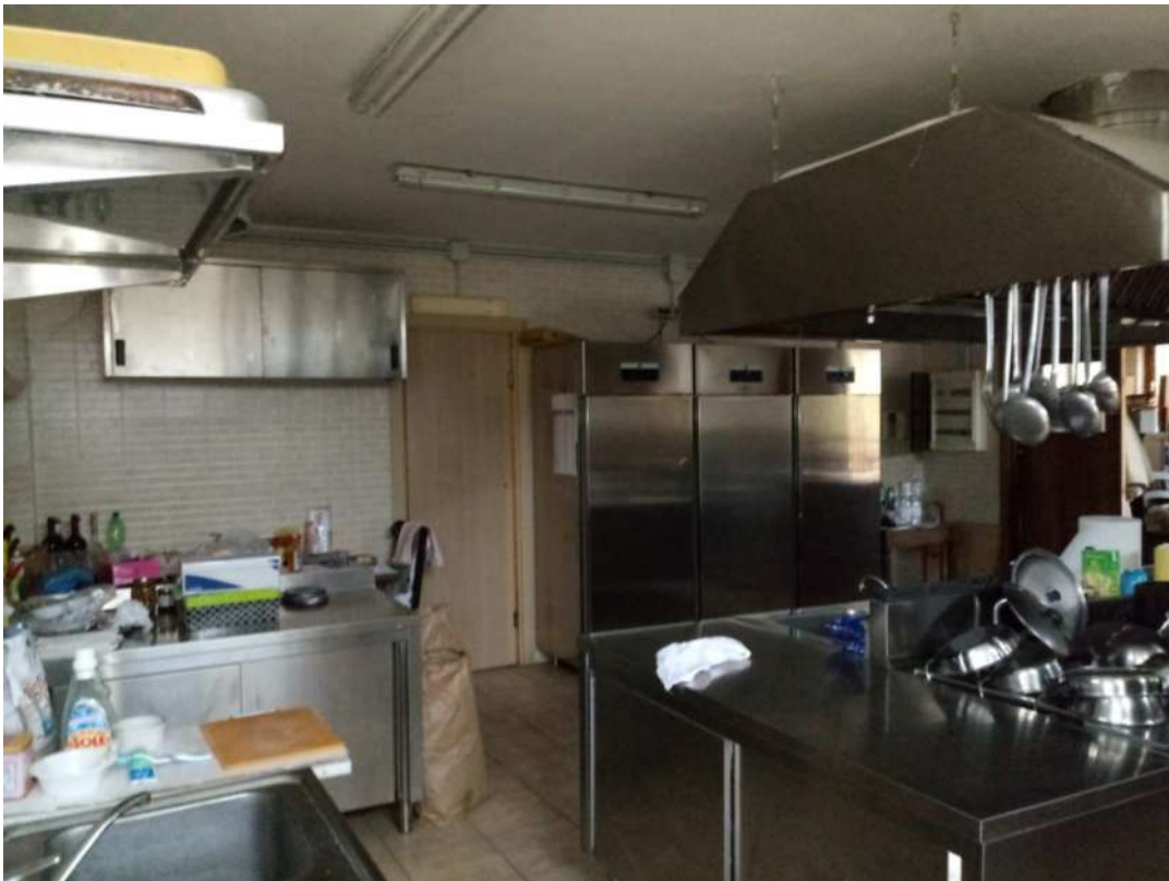
RISTORANTE AGRITURISTICO-INTERNO CUCINA