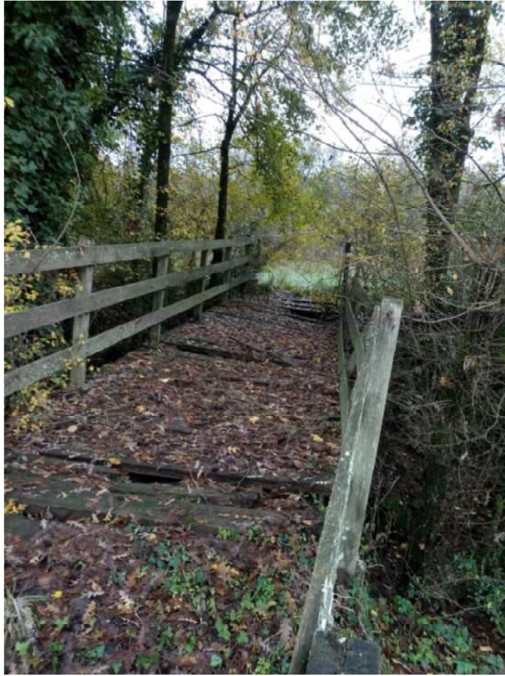
AREA ESTERNA-PONTICELLO IN LEGNO