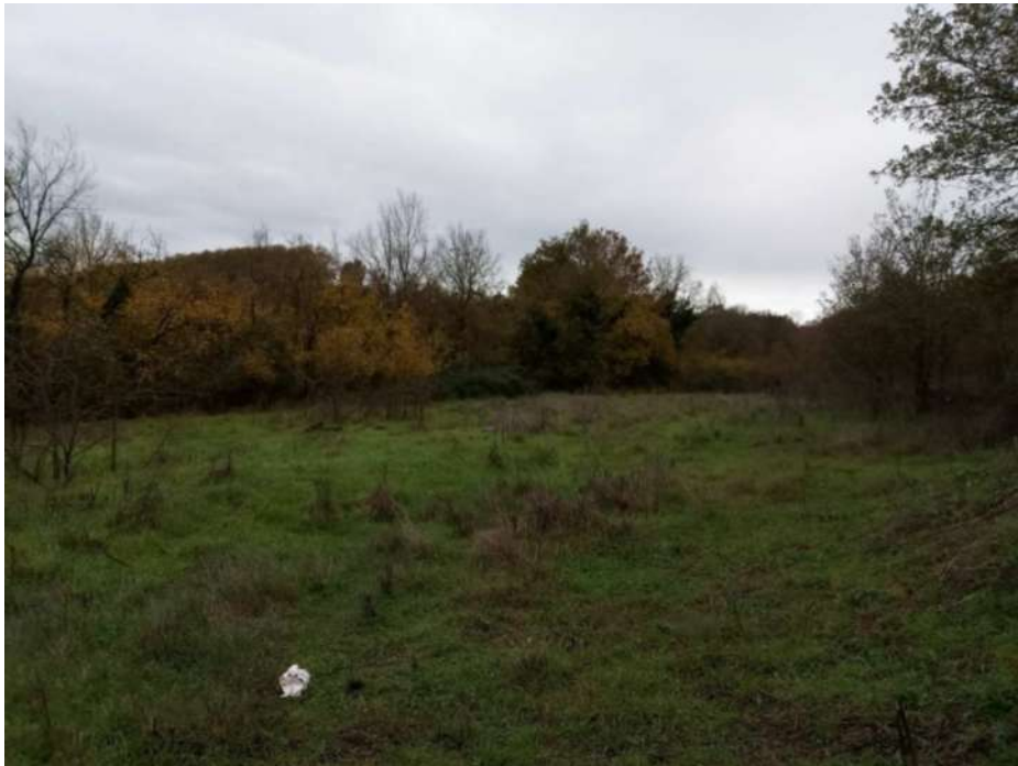
TERRENO AGRICOLO DI PERTINENZA