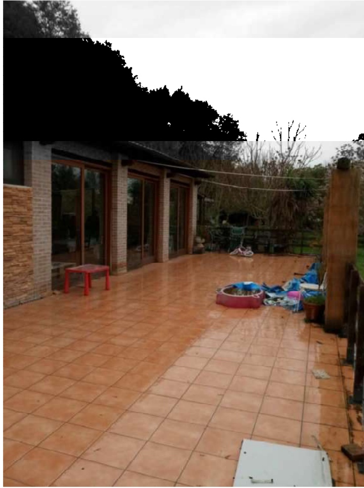
RISTORANTE AGRITURISTICO-PERTINENZE ESTERNE