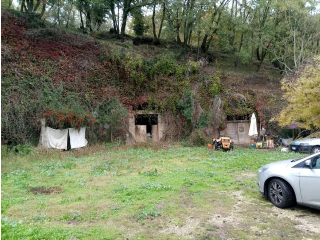
PERTINENZE INTERNE ALLA PRORIETA'