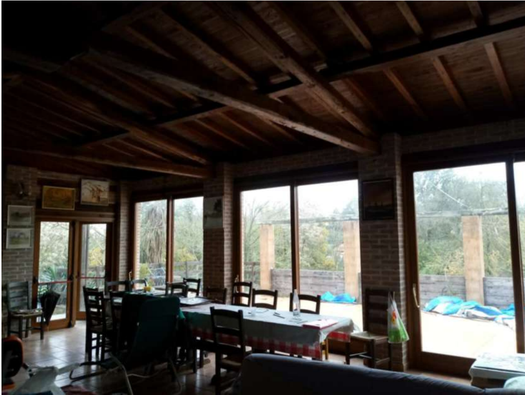
RISTORANTE AGRITURISTICO-SALA INTERNA