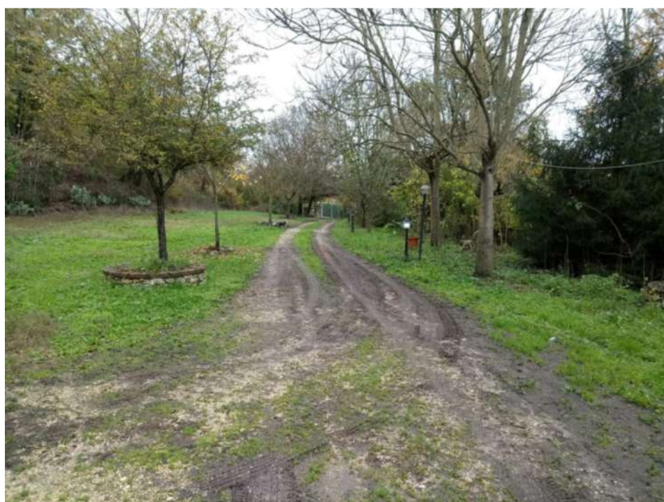
AREA INTERNA – VIALETTO