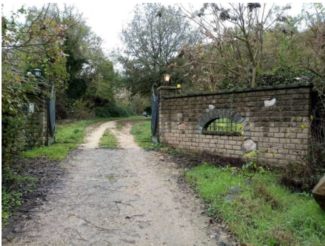
ACCESSO ALLA PROPRIETA'