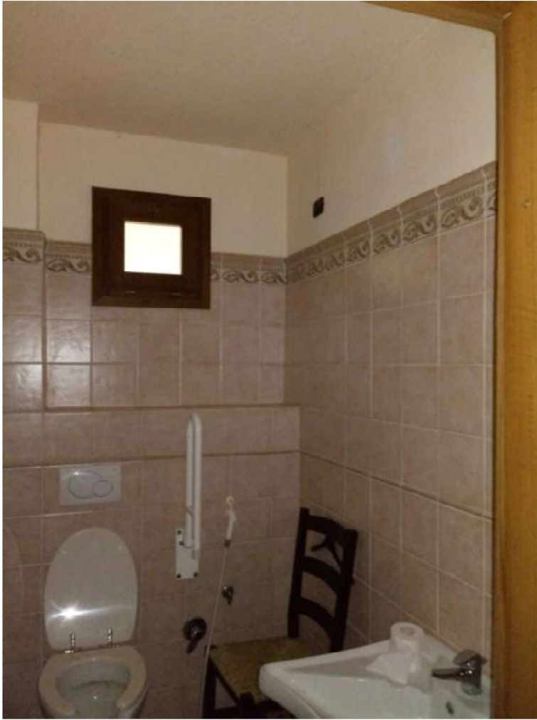
RISTORANTE AGRITURISTICO-INTERNO SERVIZI IGIENICI