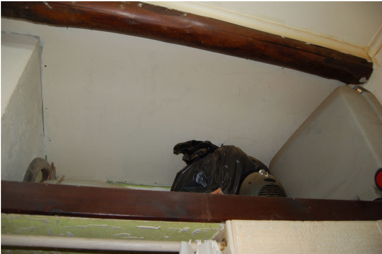
Foto 31 -Soppalco sopra la doccia