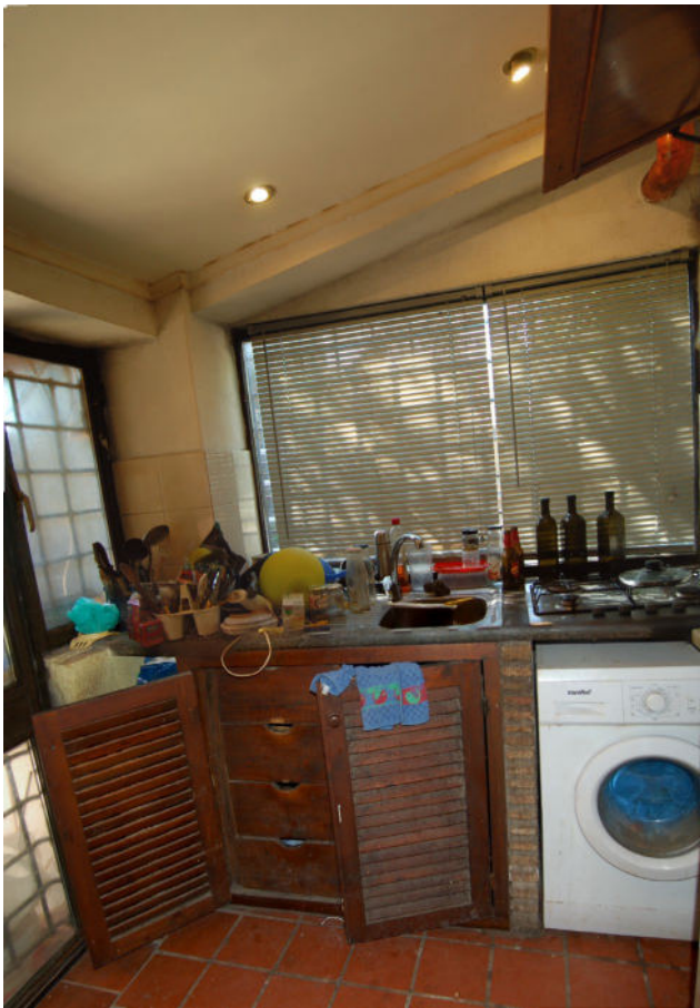
Foto 27 - Vista angolo cottura