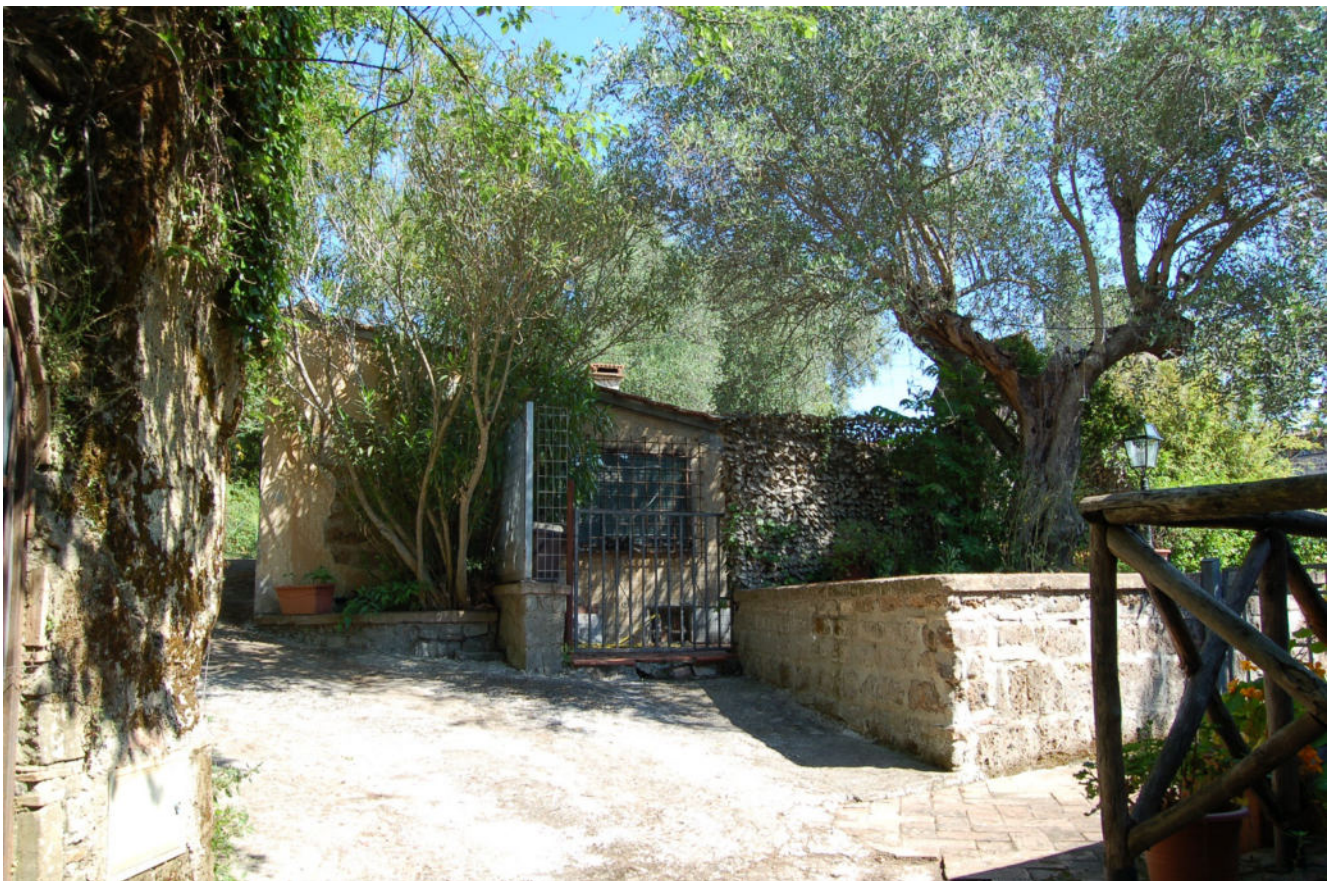
Foto 4 - Ingresso al villino unifamiliare, prospetto sud