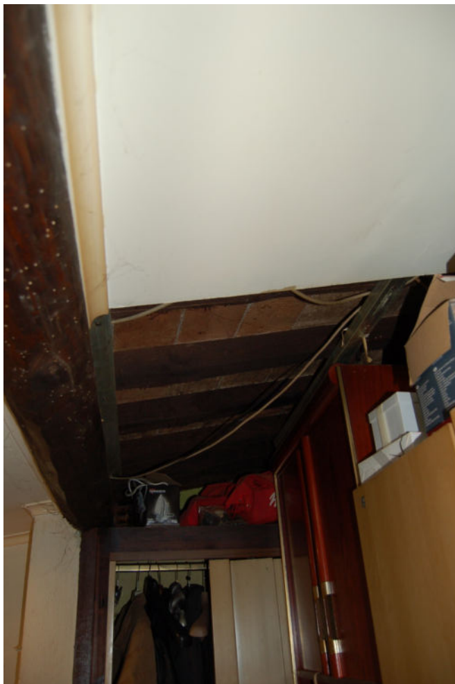
Foto 32 - Vista controsoffitto e piccolo soppalco armadio