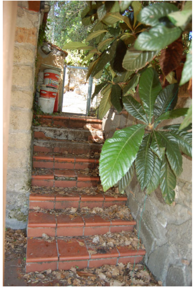
Foto 13 - Vista dei due ingressi al compendio pignorato dal giardino privato del villino