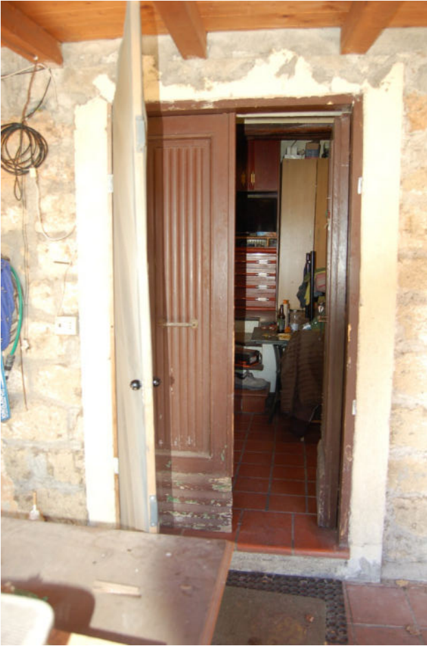
Foto 21 - Portoncino d'ingresso all'unità abitativa