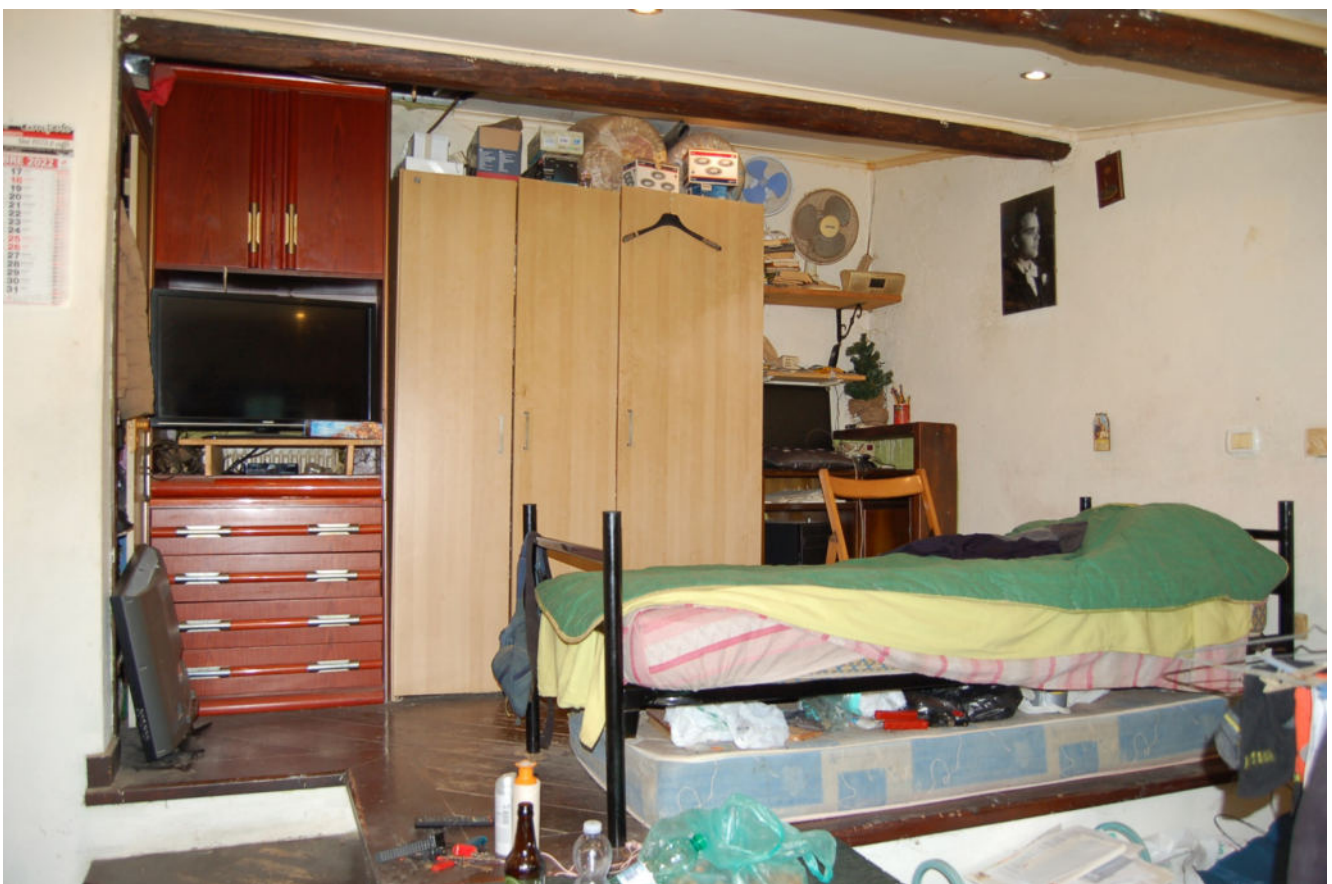
Foto 24 - Vista della zona ingresso-salotto