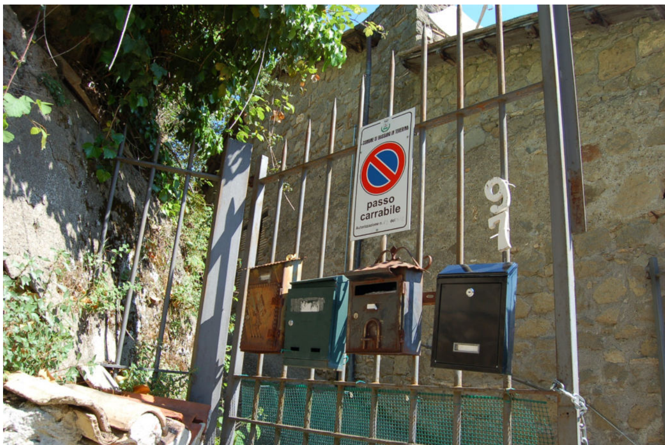
Foto 2 - Cancello d'accesso al compendio pignorato (passo carrabile autorizzazione n°68/2021)