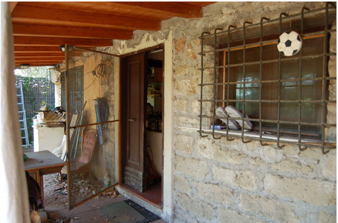
Foto 20 - Portoncino d'ingresso all'unità abitativa