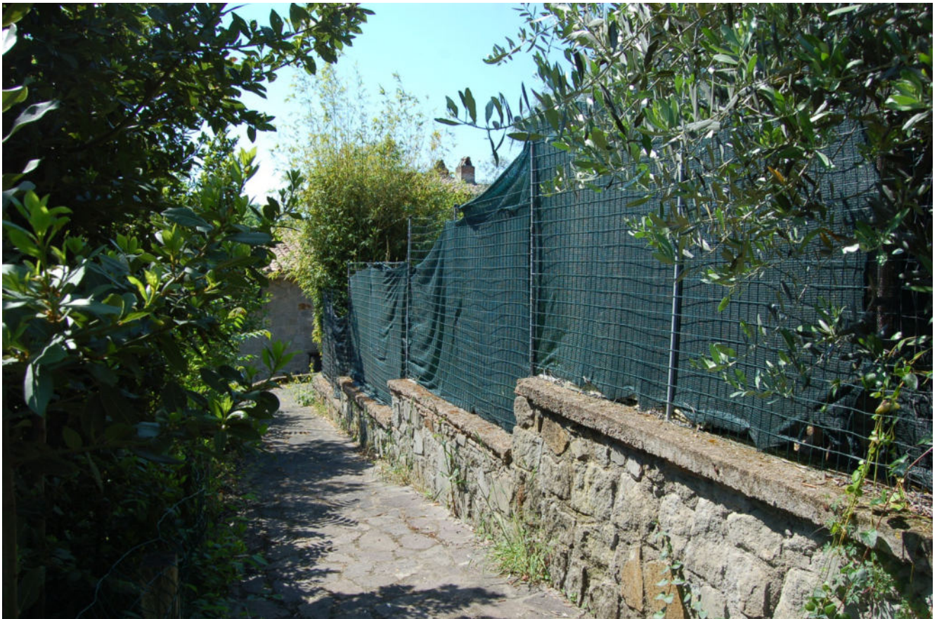
Foto 9 - Muretto di confine dell'unità abitativa, prospetto est