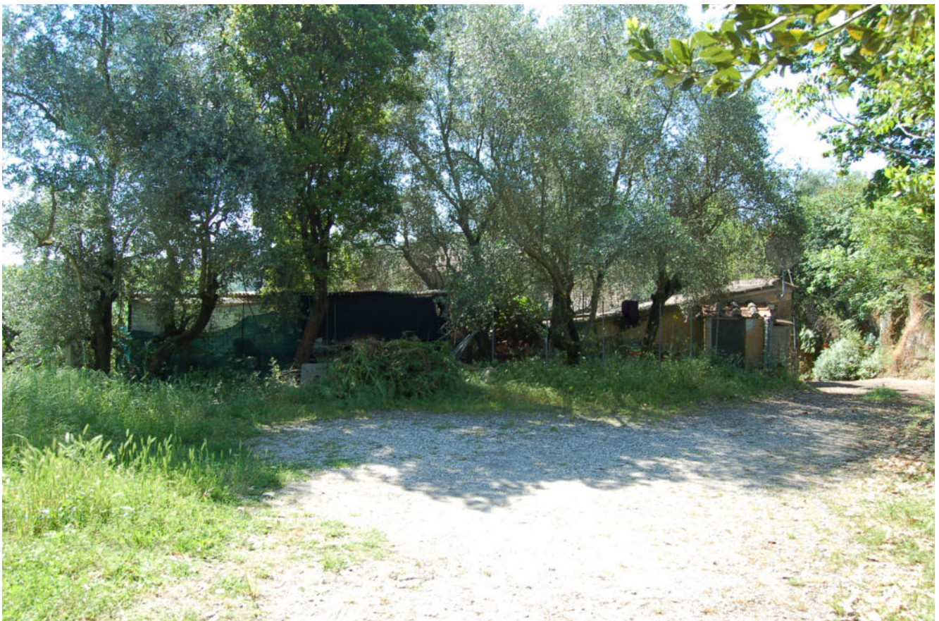
Foto 12 - Vista dell'area adibita ai posti auto