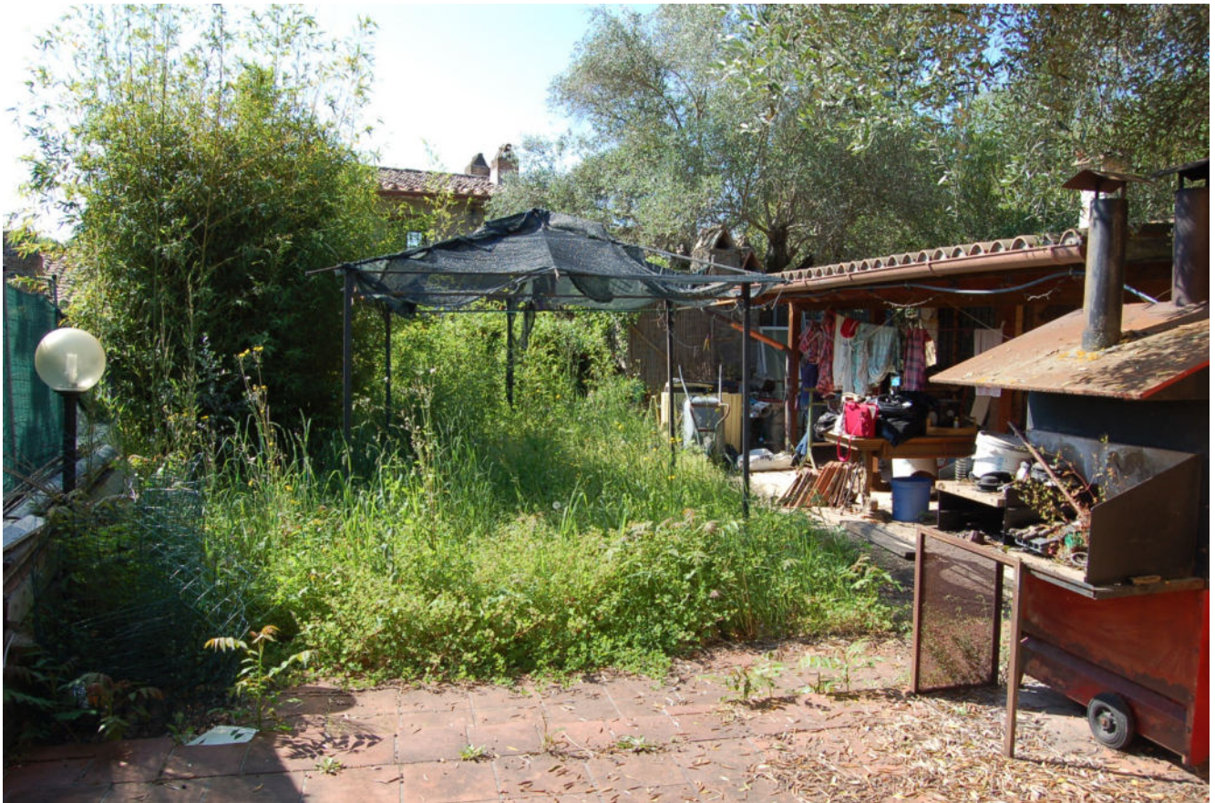
Foto 15 - Giardino esterno di proprietà esclusiva