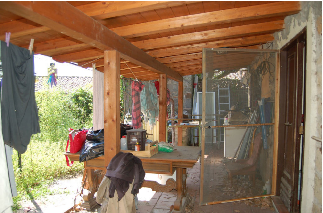
Foto 18 - Porticato antistante l'ingresso all'unità abitativa