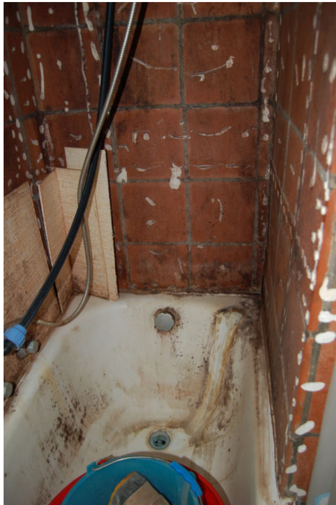
Foto 30 - Vista del bagno