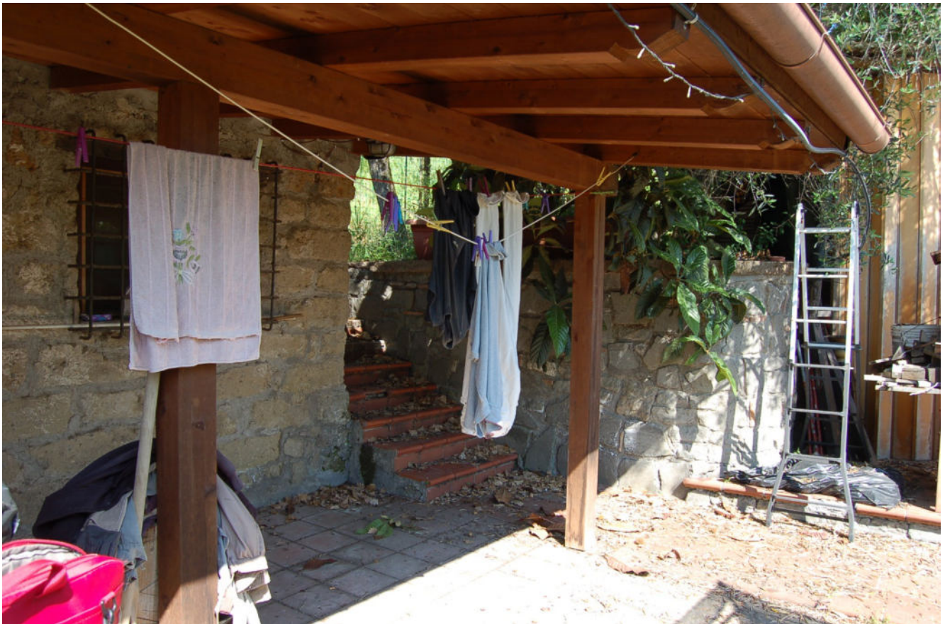
Foto 19 - Porticato antistante l'ingresso all'unità abitativa