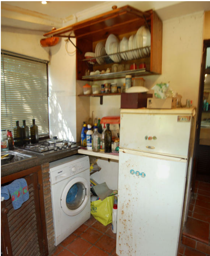
Foto 28 - Vista angolo cottura