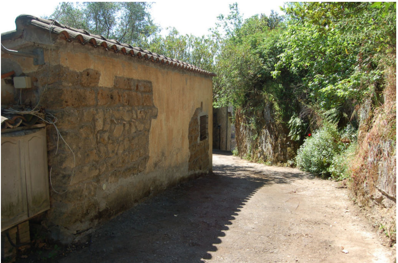
Foto 6 - Parete di confine dell'unità abitativa, prospetto ovest