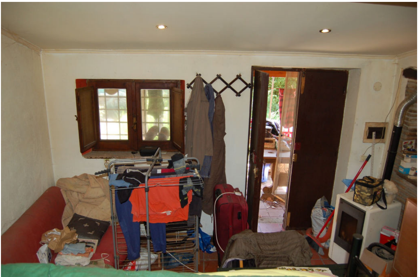
Foto 22- Vista della zona ingresso-salotto