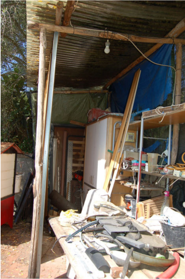
Foto 17 - Tettoia interna al giardino