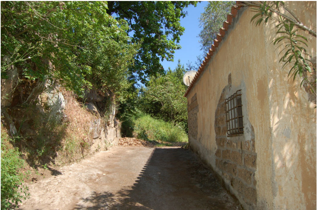
Foto 5 - Parete di confine dell'unità abitativa, prospetto ovest