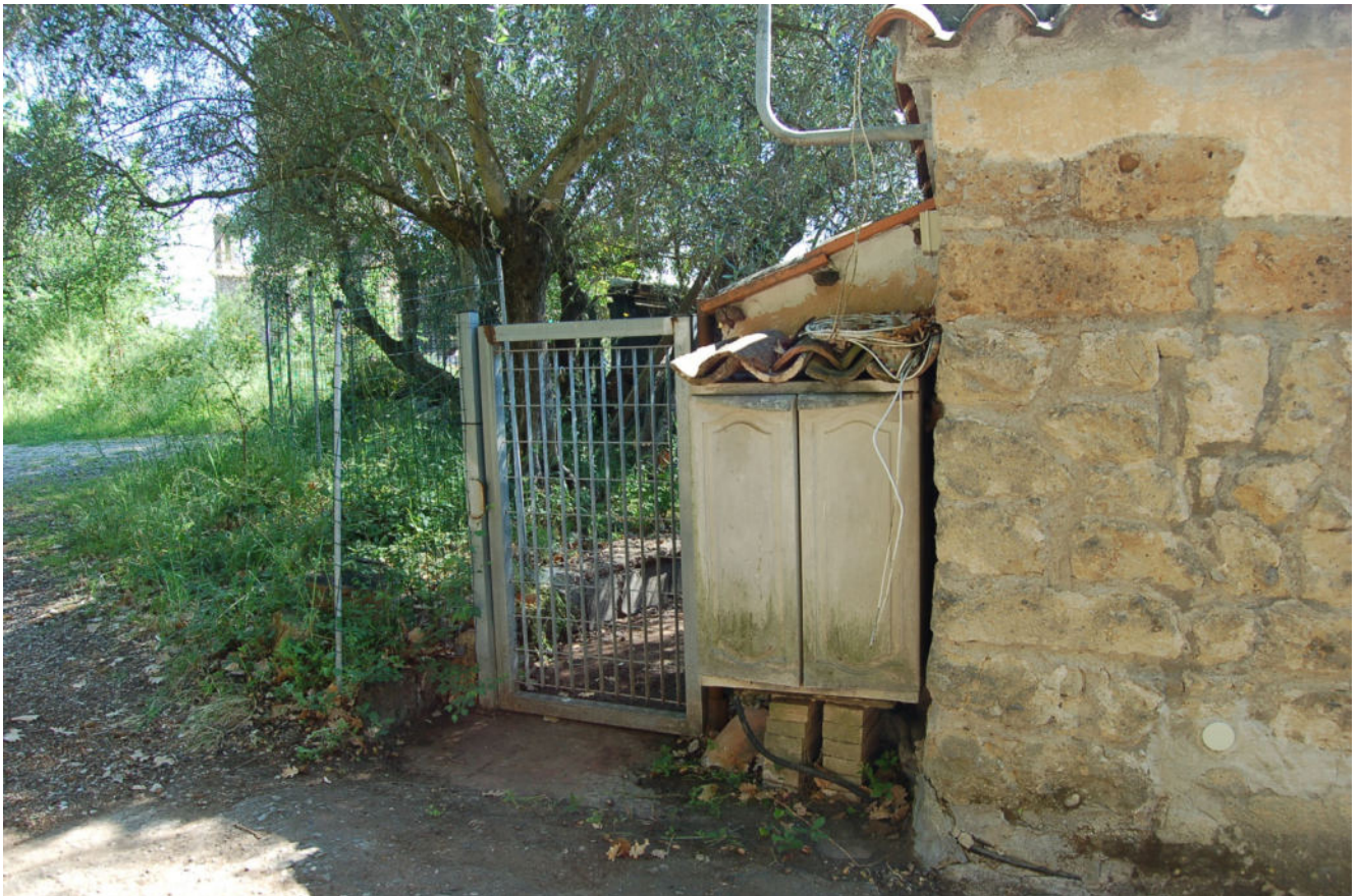
Foto 8 - Ingresso al villino unifamiliare, prospetto ovest