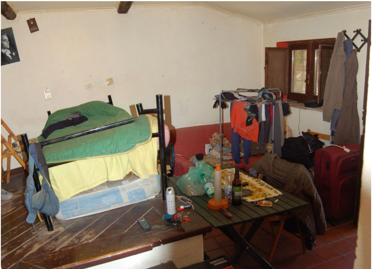
Foto 23 - Vista della zona ingresso-salotto