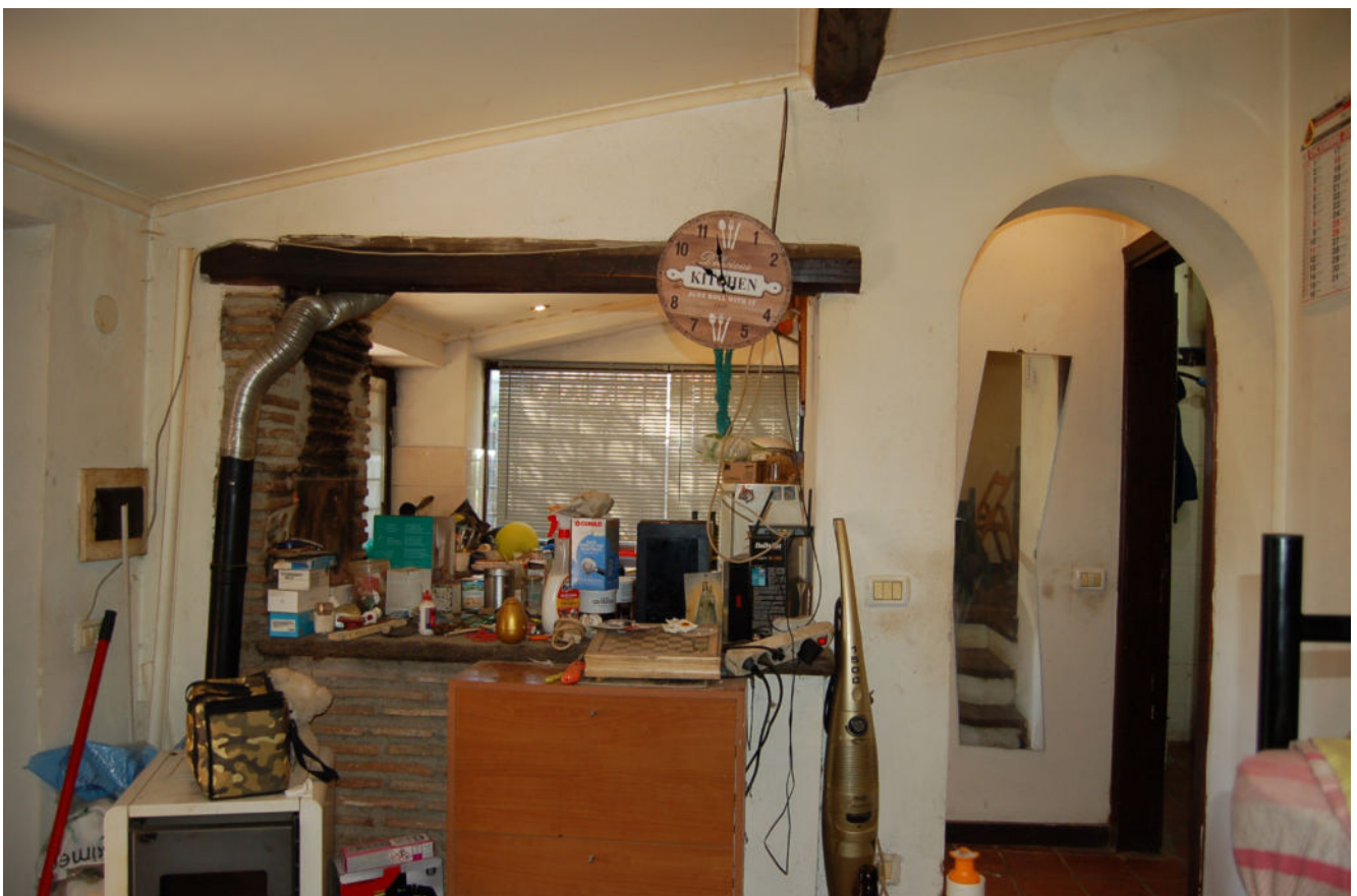
Foto 26 - Vista della zona angolo cottura