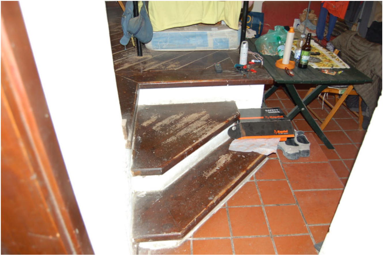
Foto 25 - Vista della zona ingresso-salotto