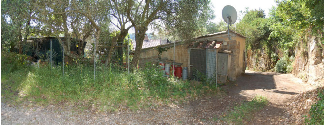
Foto 7 - Recinzione di confine dell'unità abitativa, prospetto nord