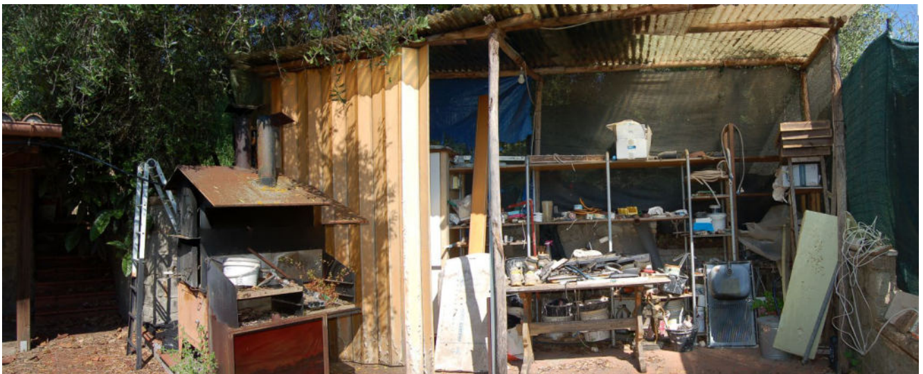
Foto 16 - Tettoia interna al giardino