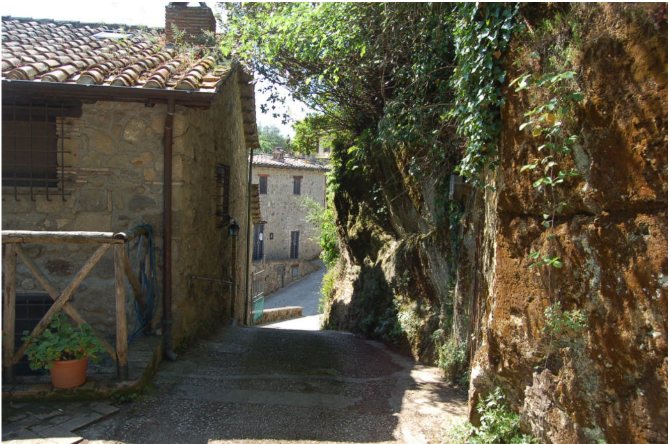
Foto 3 - Unica via d'accesso al compendio pignorato