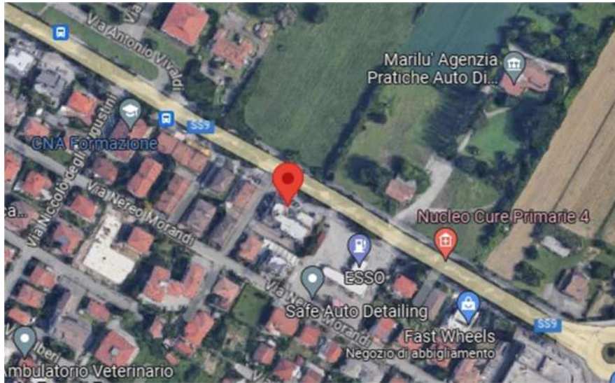
Viale Roma, 284/286 Forlì FC – Inquadramento

sub. 12, 19, 20, 21, 22, 23, 28 1 oltre al sub.18 (BCNC – corte comune ai sub.19,20,21,22,23 e 28 oltre al sub.24 (BCNC- sottoscala, ingresso,vano scala-comune ai sub.19,20,21,22,23 e 28), oltre al sub.26 (BCNC-disimpegno-comune ai sub. 19,20,21,22,23) 2 . Il tutto su particella di terreno distinta al Catasto Terreni di Forlì al Foglio 224 mappale 313 di mq. 1595 – ente urbano.