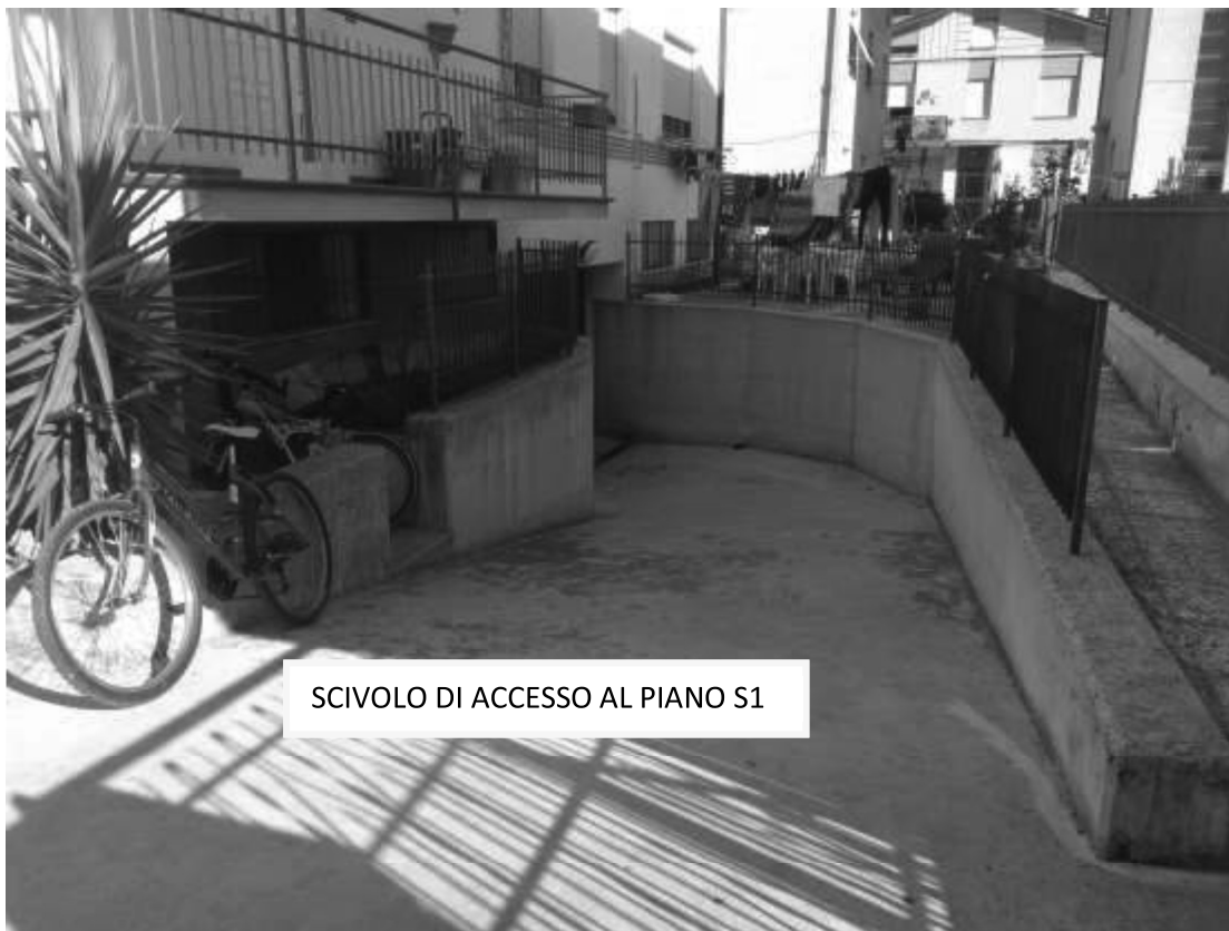
SCIVOLO DI ACCESSO AL PIANO S1