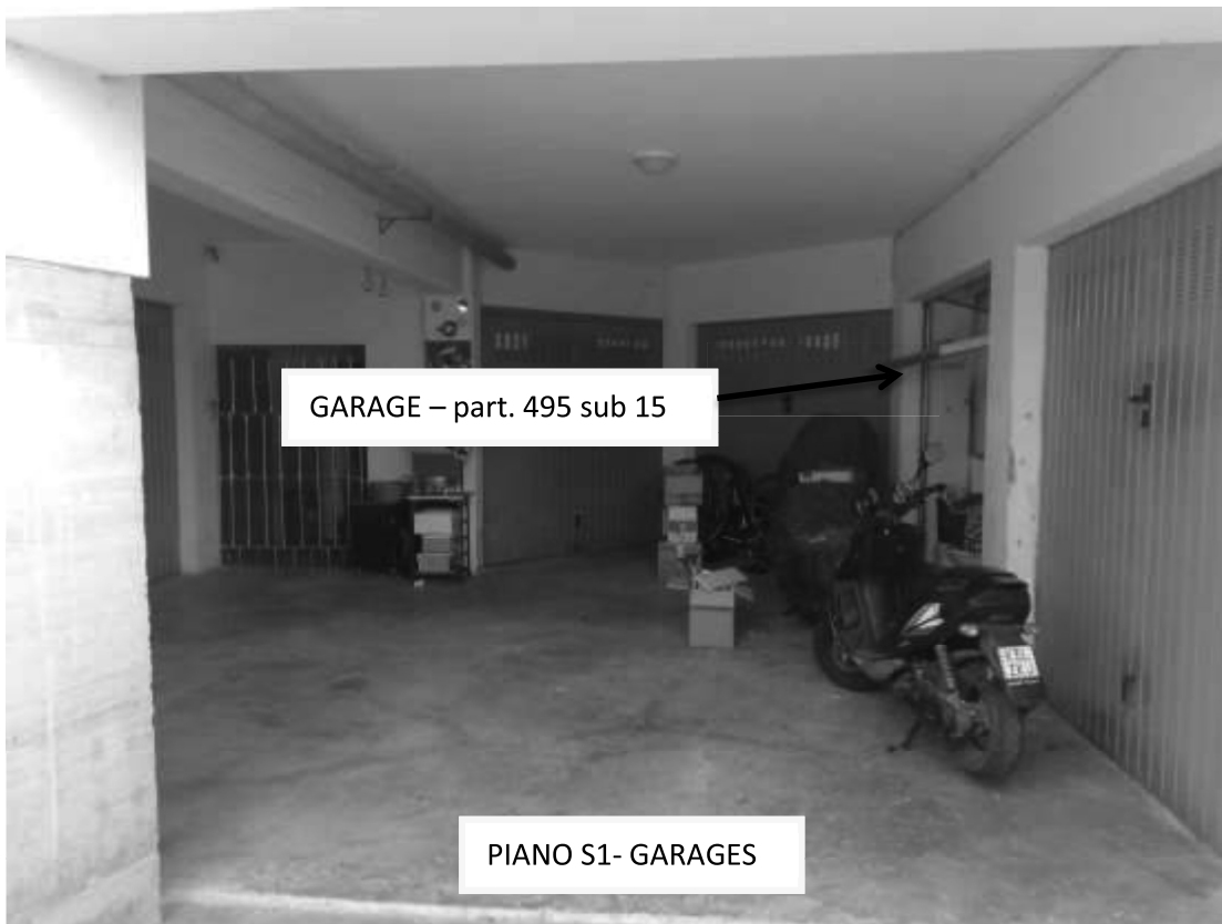
GARAGE – part. 495 sub 15