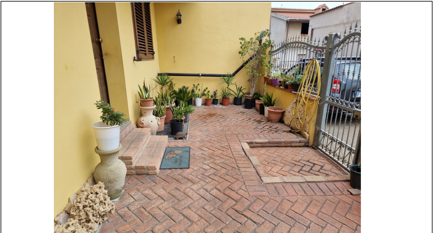
Foto 11 : Vista area parcheggio adiacente locale commerciale lato Via Olbia Capoterra (10/11/23)