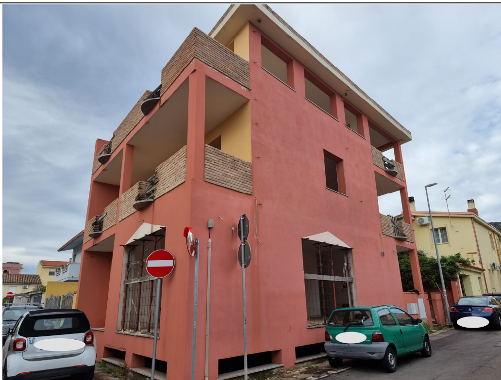
Foto 3 : Vista prospetto locale commerciale Via Gorizia, 1 Capoterra (10/11/23)