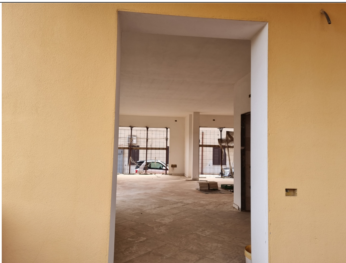
Foto 4 : Vista ingresso posteriore locale commerciale lato cortile Via Gorizia,1 Capoterra (10/11/23)