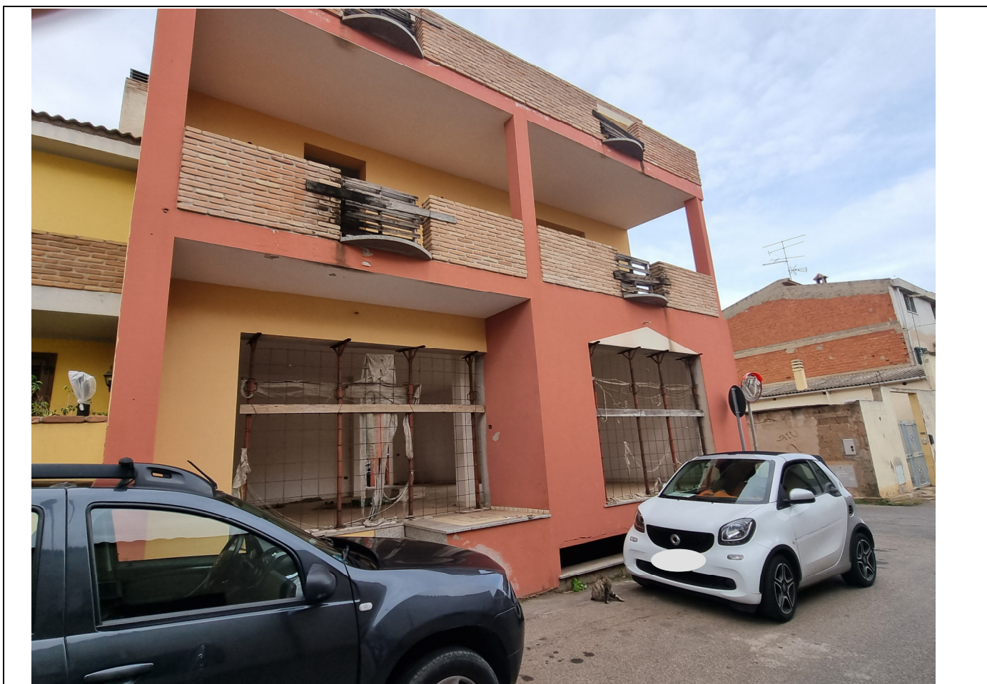
Foto 1 : Vista prospetto locale commerciale Via Olbia, 6 - Capoterra (10/11/23)