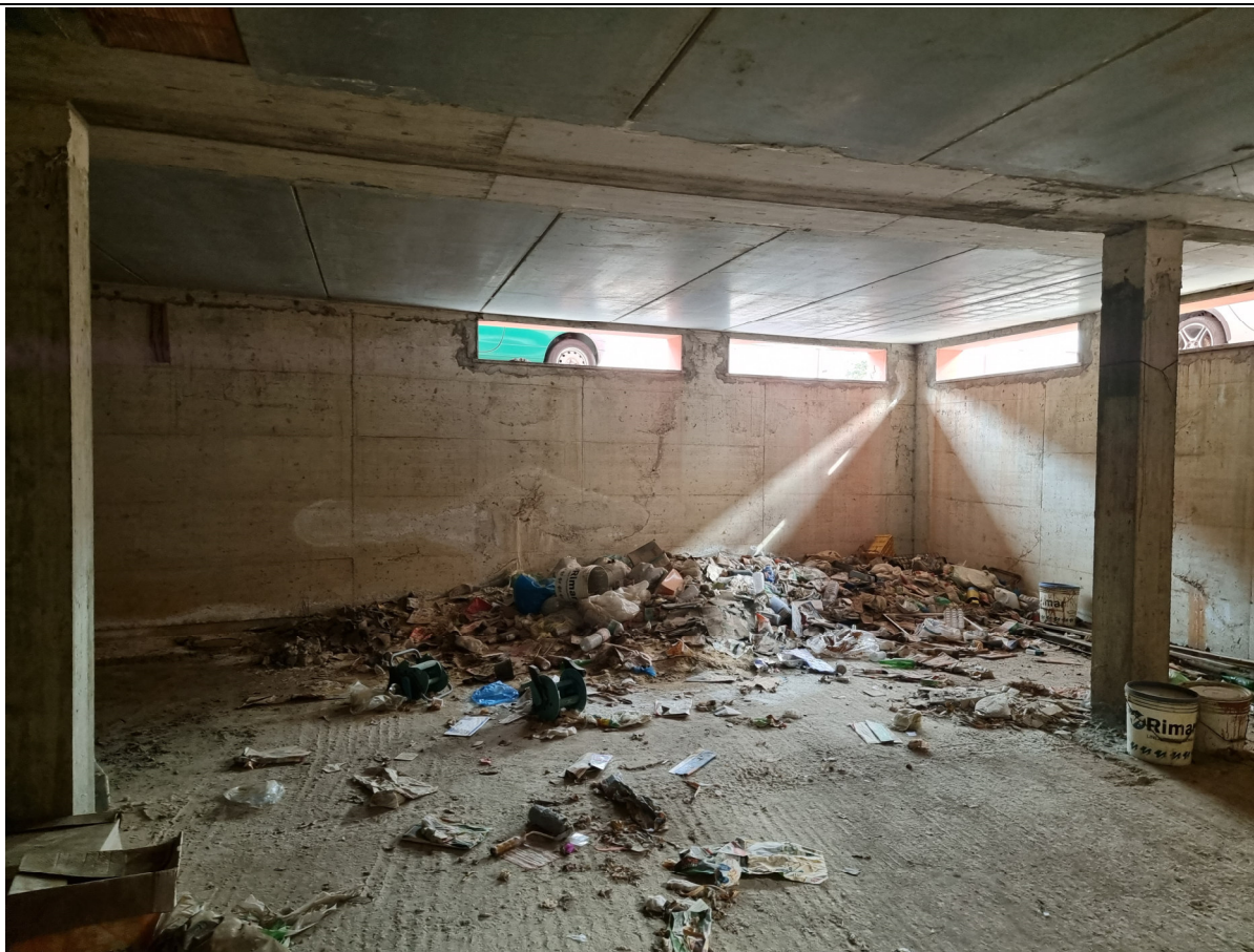
Foto 09 : Vista cantina locale commerciale lato Via Olbia Capoterra (10/11/23)