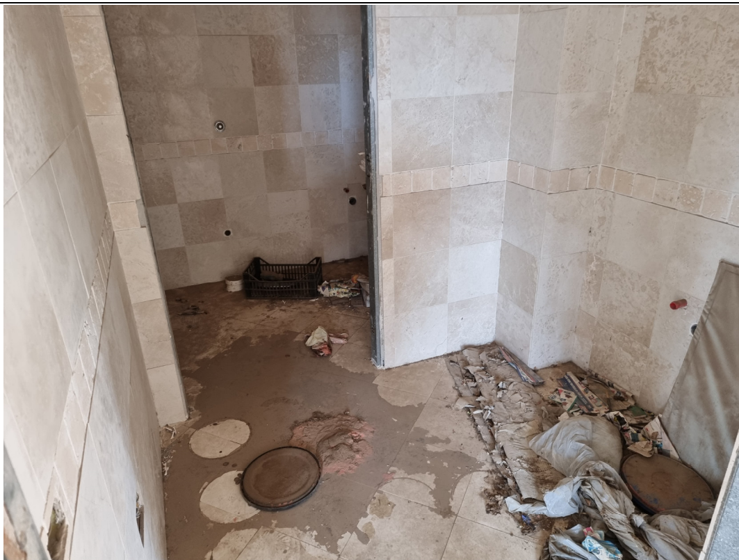
Foto 8 : Vista WC locale commerciale lato Via Gorizia Capoterra (10/11/23)