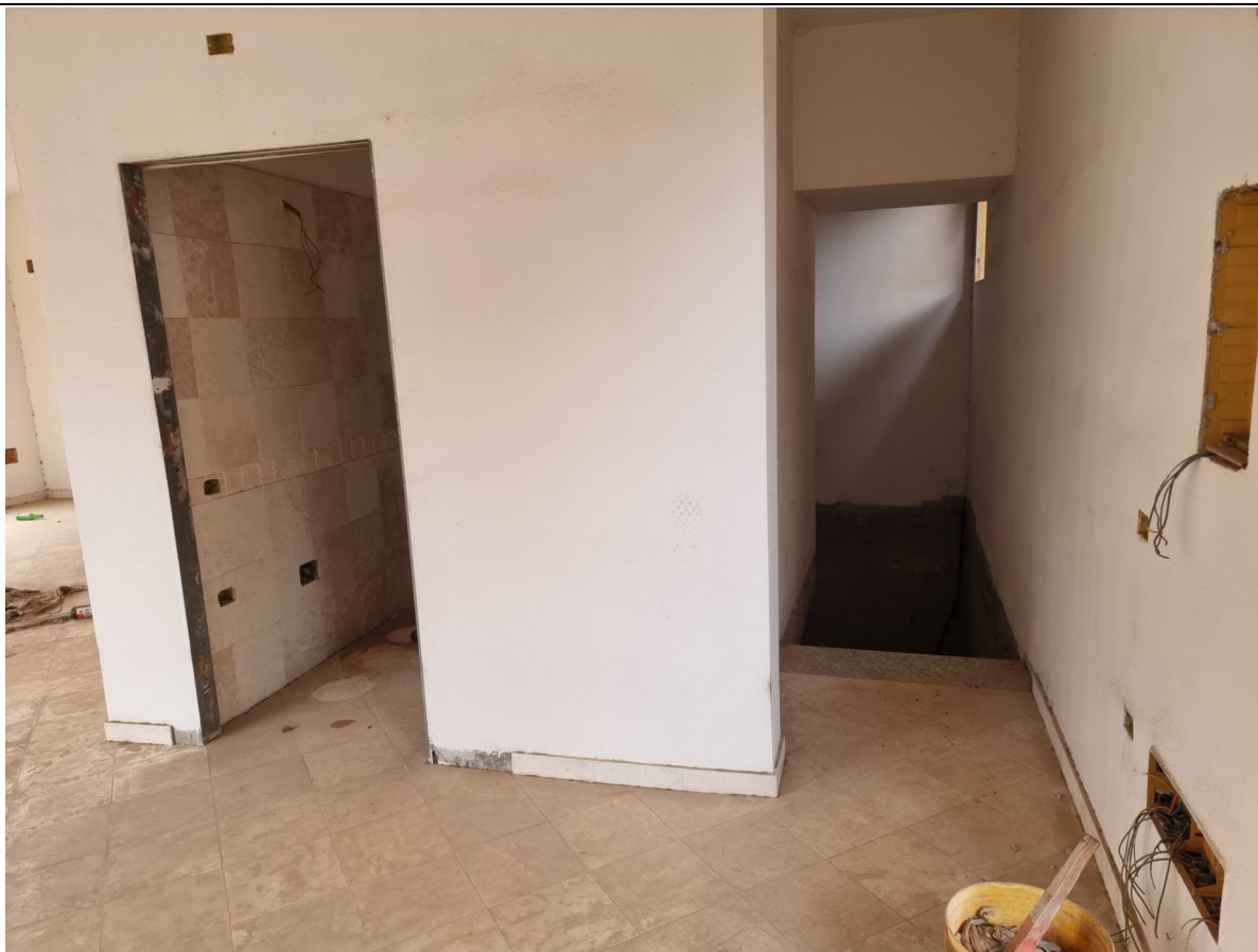
Foto 7 : Vista ingresso wc e scala cantina locale commerciale lato Via Olbia Capoterra (10/11/23)