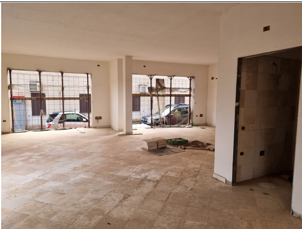
Foto 5 : Vista interno locale commerciale lato Via Olbia Capoterra (10/11/23)