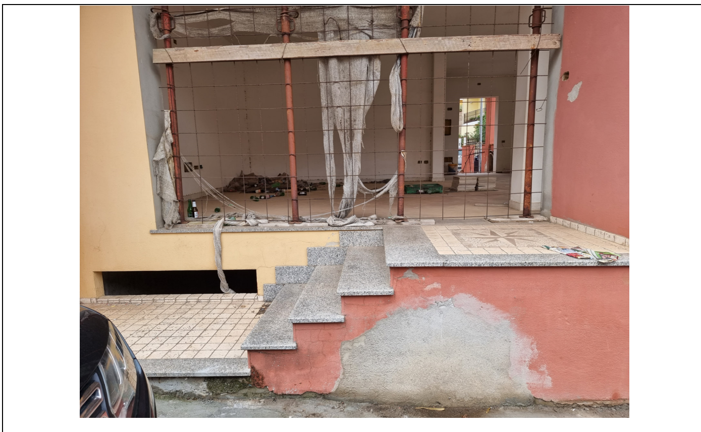
Foto 2 : Vista ingresso locale commerciale Via Olbia,6 Capoterra (10/11/23)