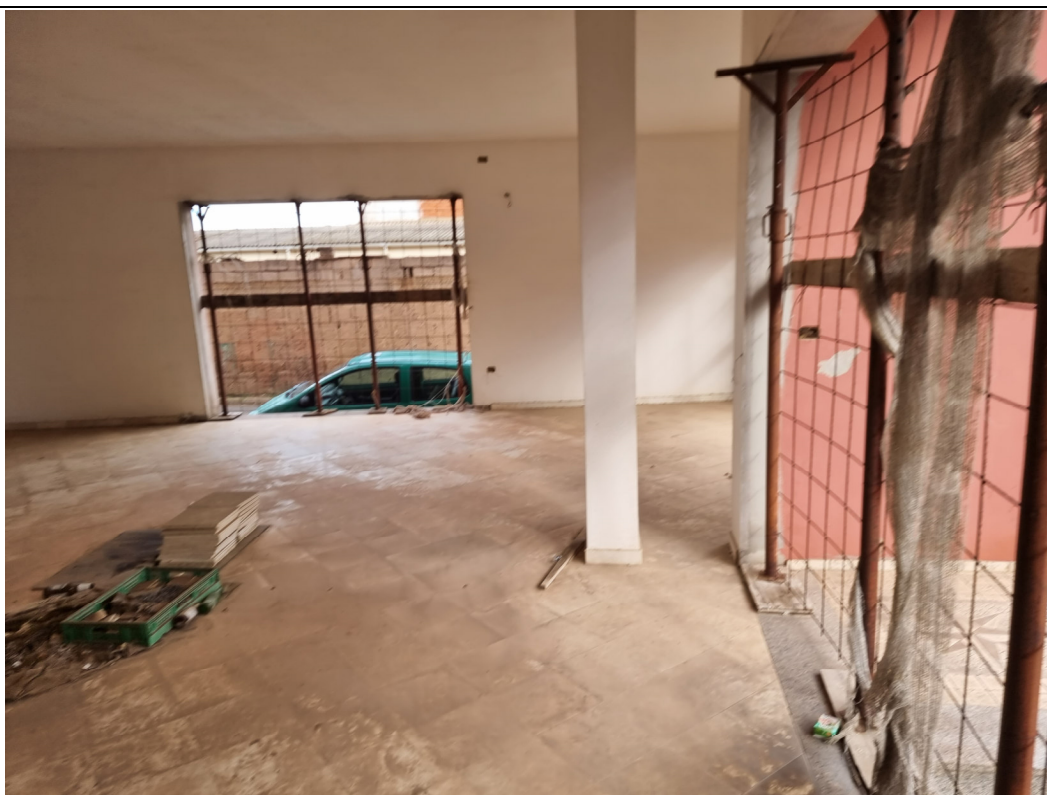
Foto 6 : Vista interno locale commerciale lato Via Gorizia Capoterra (10/11/23)