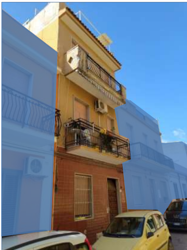
Fot. 11: prospetto su Via Sempione, vista da nord-est