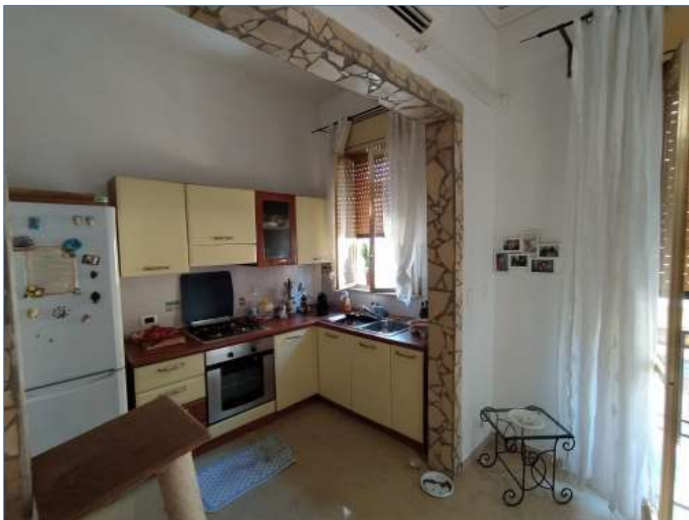
Fot. 4: piano primo, zona cottura