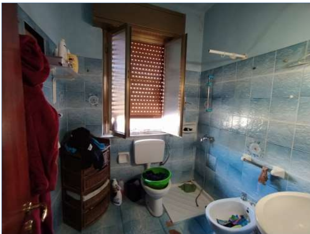
Fot. 7: piano secondo, bagno