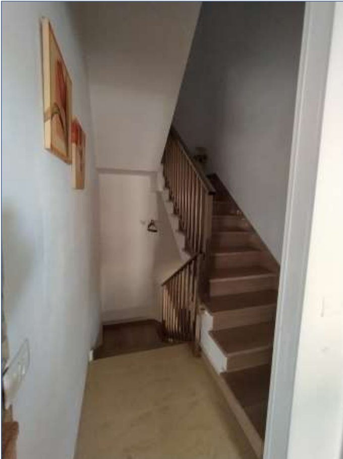
Fot. 5: rampa scale piano primo-piano secondo