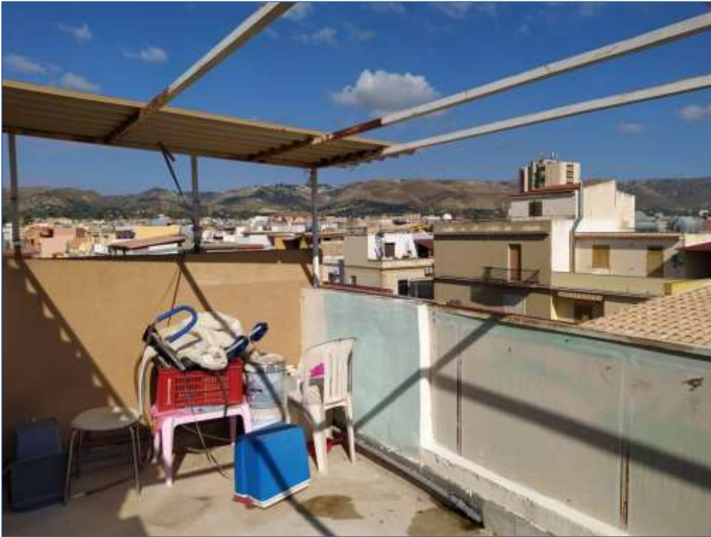
Fot. 9: piano terzo, terrazza esterna