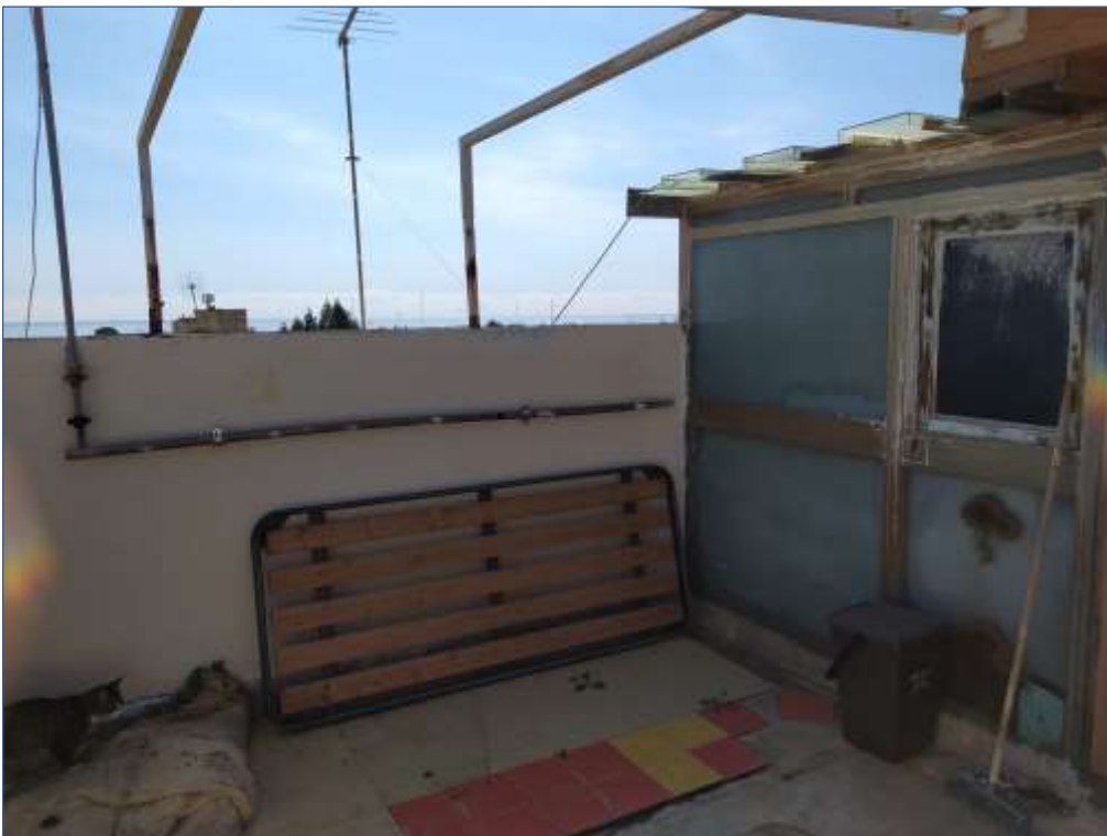
Fot. 10: piano terzo, terrazza esterna