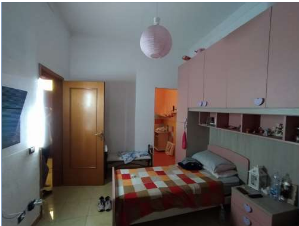
Fot. 1: piano terra, camera da letto singola