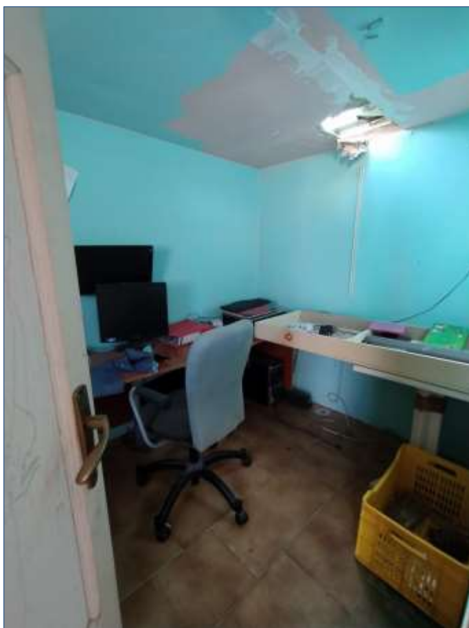
Fot. 8: piano terzo, vano ripostiglio