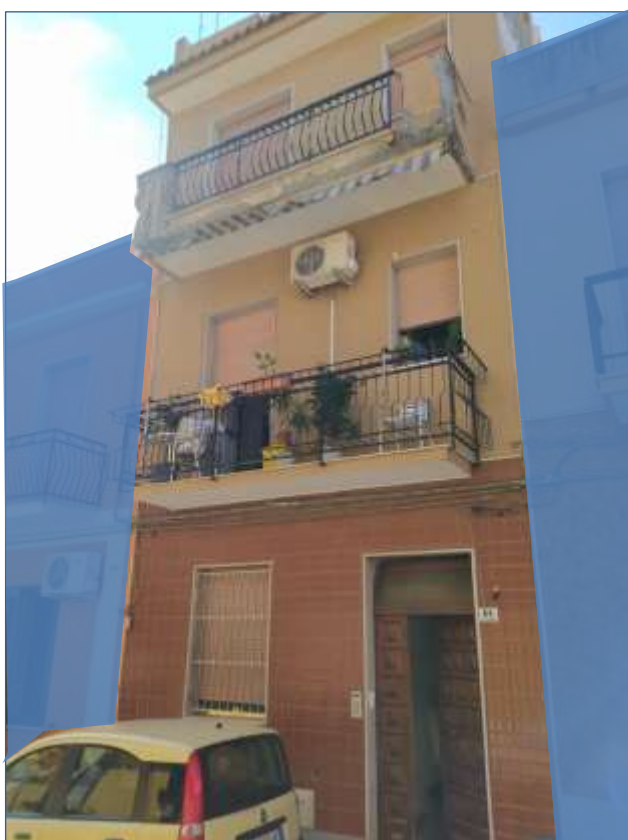
Fot. 12: prospetto su Via Sempione, vista da nord-ovest