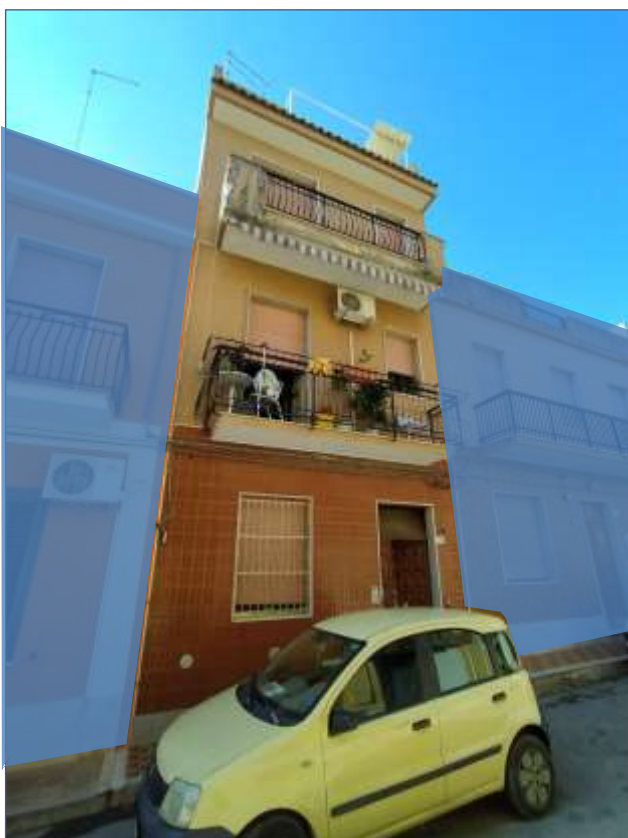
Fot. 14: prospetto su Via Sempione, vista frontale