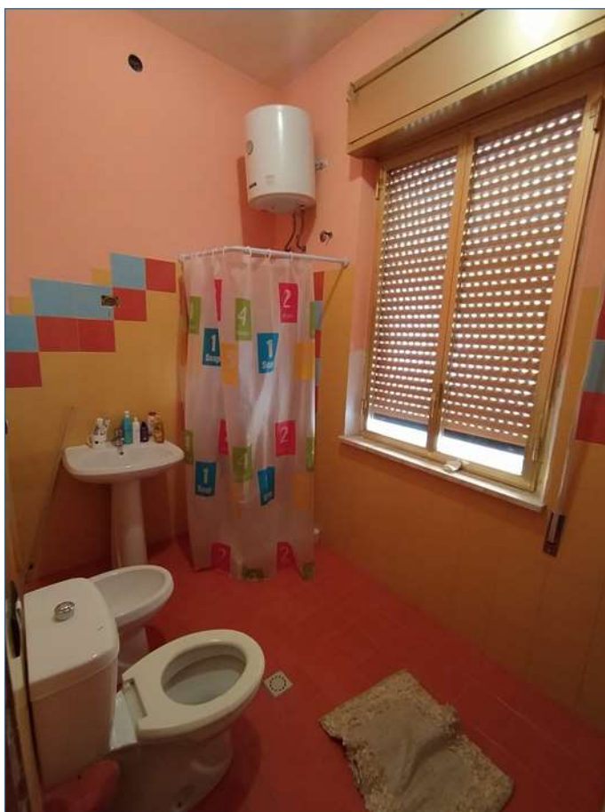
Fot. 2: piano terra, bagno