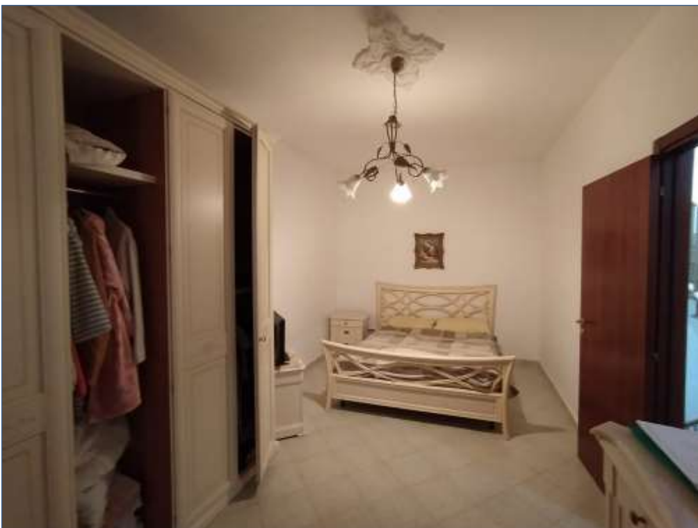
Fot. 6: piano secondo, camera matrimoniale