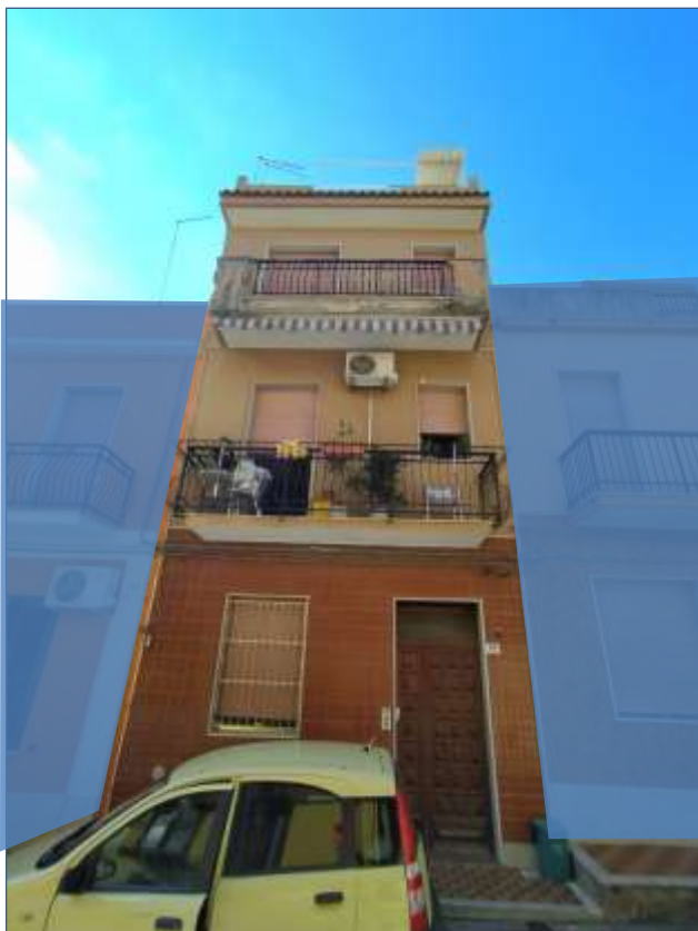
Fot. 13: prospetto su Via Sempione, vista frontale