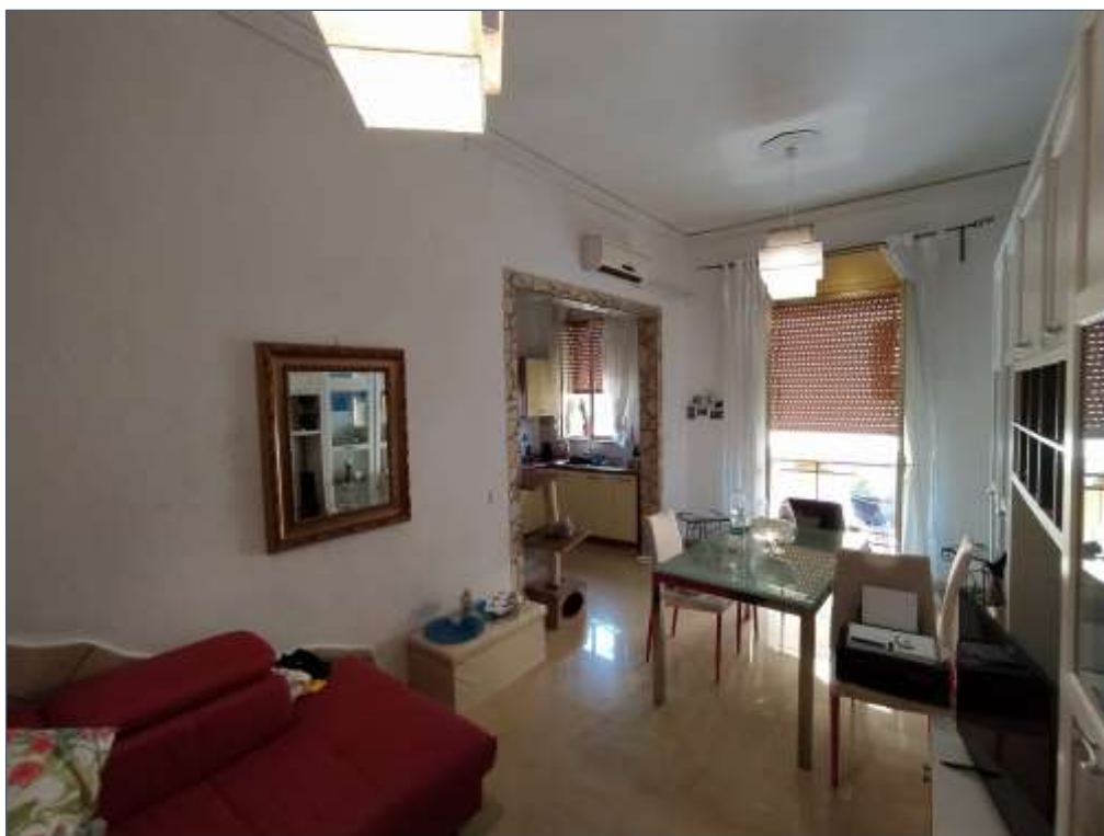
Fot. 3: piano primo, sala da pranzo